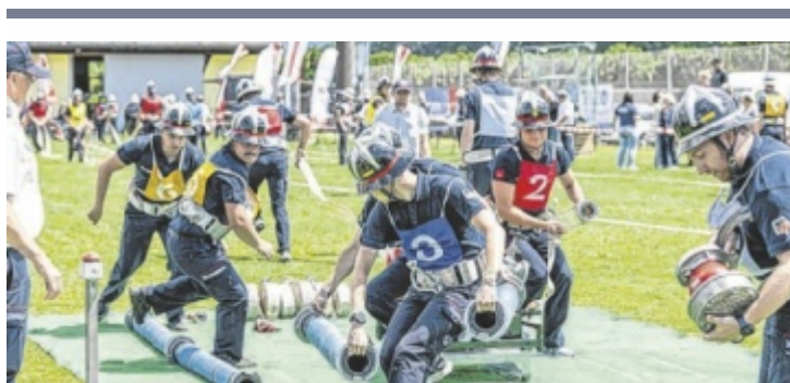
Abschnitts-Feuerwehrleistungsbewerb in Goldwörth

BEZIRK. Vor 100 Lebensmittelgeschäften in Linz-Land, Vöcklabruck, Rohrbach, Freistadt, Kirchdorf, Perg, Schärding und Urfahr-Umgebung baten freiwillige Rotkreuz-Mitarbeitende die Kundschaft, beim Einkauf ein Produkt mehr in den Wagen zu legen und dieses für die Rotkreuz-Märkte zu spenden. 26 Tonnen Lebensmittel und Produkte des alltäglichen Lebens kamen dabei zusammen.