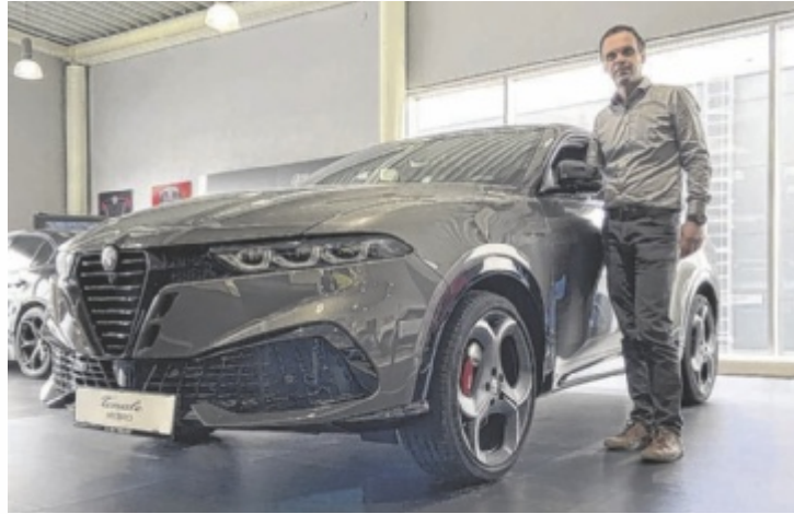
Am besten einfach probefahren und sich selbst überzeugen!

Rund dreieinhalb Jahre nach seiner Premiere schlägt der Alfa Romeo Tonale ein neues Kapitel in seiner Historie auf. Neben optischen und technologischen Neuerungen umfasst das Angebot jetzt zusätzliche Karosseriefarben und erweiterte Ausstattungsinhalte. Das Ergebnis ist ein Fahrzeug, das die typische DNA von Alfa Romeo – Balance, Präzision und italienisches Design – in zeit-