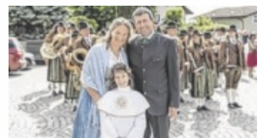
Marianne aus Braunau sicherte sich mit ihrem Foto den Sieg.

OÖ. Tips, die Brauerei Raschhofer und die Trachten Wichtlstube haben wieder das beliebteste Trachtenfoto gesucht – und gefunden. Beim diesjährigen Trachtenfoto-Voting konnten Teilnehmer ihre schönsten Bilder einreichen und sich den Stimmen der Leser stellen.