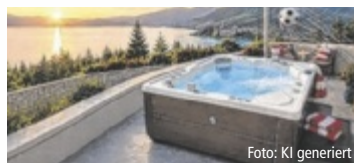
Bestpreis. Mehr Tore. Mehr Rabatt.

ÖÖ. Mit der HotSpring WM-Torwette wird jedes Tor der österreichischen Nationalmannschaft zum Vorteil beim Whirlpool-Kauf. Während der Fußball-WM erhalten Kunden den Best-Preis 2026. Je öfter der Ball im Netz zappelt, desto niedriger der Preis.