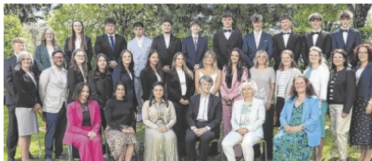
Die Schüler der Klasse 8 B samt Lehrkräften.