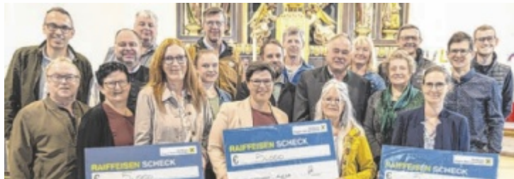
Theatergruppe Vorderweissenbach bei der Übergabe der großzügigen Spende.

VORDERWEISSENBACH. Unter dem Motto „Kleine Instrumente – große Klänge“ gestalteten die Kinder der Volks- und Mittelschule sowie der Kindergärten Regenbogen und Harmonie gemeinsam mit zahlreichen Gästen einen Dankgottesdienst in der Pfarrkirche Vorderweissenbach. Im Mittelpunkt standen Gemeinschaft, Zusammenhalt und persönliche Stärken. Leitgedanken wie „Füreinander da sein“ und „Musik verbindet“ prägten die Feier. Besondere Akzente setz-