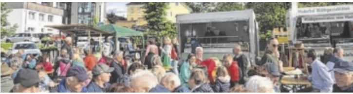
Man trifft sich wieder beim Niederwaldkirchner Genussmarkt.