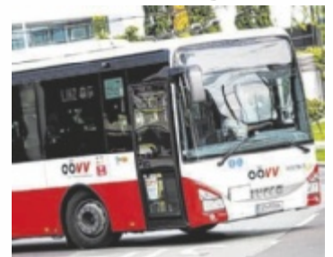
Mit Schulbeginn gibt es Verbesserungen im Busangebot.

Bessere Anbindungen gibt es auch an das Agrarbildungszentrum Waizenkirchen: Auf der Linie 204 wird für die Internatsanreise an Montagen ein zusätzlicher Kurs ab Gerling um 07:35 Uhr über