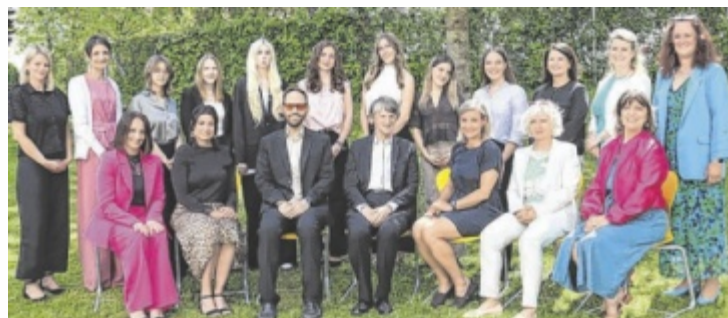
Die Schülerinnen der Klasse 8 C samt Lehrpersonal.