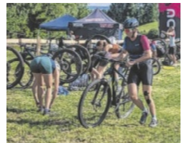
Drei Kilometer in die Pedale treten.

meinsam einen Hindernisparcours bewältigen. Dabei stehen Zusammenarbeit und gegenseitige Unterstützung im Mittelpunkt. Der Reinerlös kommt der Sportunion Bad Leonfelden zugute. Weitere Informationen sowie Anmeldung bei clemens.enzenhofer@gmx.at ; beziehungsweise telefonisch unter 0664 3941585 ■