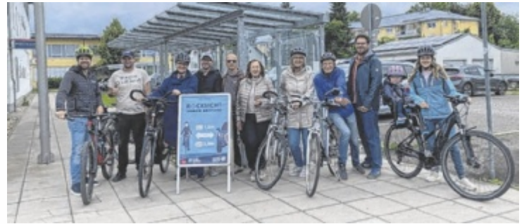
Die Abstandsmessung in Gallneukirchen zeigte, dass der gesetzlich vorgeschriebene Seitenabstand beim Überholen von Radfahrern nicht in allen Fällen eingehalten wurde. Das birgt ein enormes Sicherheitsrisiko.

Die Stadtgemeinde Gallneukirchen führte mit der Fahrradberatung Oberösterreich die Verkehrssicherheitsaktion „Rücksicht durch Abstand“ durch. Am 12. Juni wurden dabei im Ortsgebiet auf der Linzer Straße 72 Überholvorgänge von Kraftfahrzeugen (bei einer erlaubten Höchstgeschwindigkeit von 50 km/h) gegenüber Radfahrern gemessen. Während 47 Fahrzeuge den vorgeschriebenen Mindestabstand von 1,5 Metern einhielten, unterschritten 25 Fahrzeuge diesen Wert. Der geringste gemessene Abstand betrug 82 Zen-