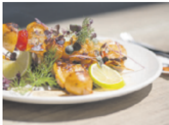
Frische Vielfalt mit saisonaler Mittags- und Speisekarte in der MLB.

Die Mühlviertler Landbäckerei (MLB) setzt in der Teigbude mit einer saisonal angepassten Mittags- und Speisekarte wieder frische Akzente im Gastronomieangebot.