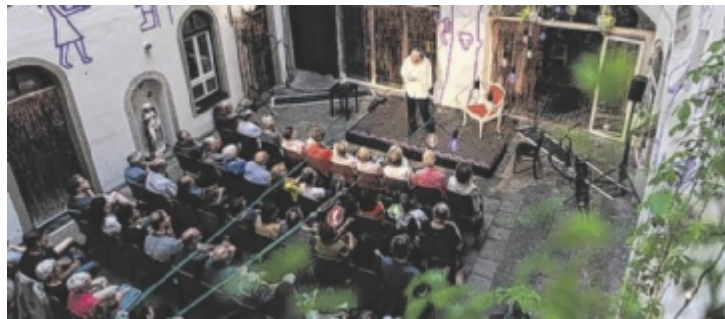
Festivalzentrum ist wieder das HP23 am Hauptplatz.

Weil an der Promenade weiter renoviert wird, weicht das Landestheater erneut in die Innenstadt aus. Das zweite Monolog-Festival konzentriert sich noch mehr rund um den Hauptplatz. „Damit man noch ein bisschen mehr dieses Festivalgefühl hat. Durch die verschiedenen Anfangszeiten kann man auch mehr zwischen den Programmen flanieren“, so Schauspielregisseur David Bösch. Das Festivalzentrum bleibt das HP23 am Hauptplatz. Neu ist etwa ein Songbattle um 19 Uhr beim Linz Logo, wo auch ein Infopoint eingerichtet wird, eventuell auch mit Abendkasse. Da die Besucherkapazität bei den Spielorten von 30 bis 80 Besuchern schwankt, gilt aber: Je eher man sich Karten besorgt, desto besser. „Wir haben nicht ganz so viele Besucherplätze wie bei der Fußball-WM, dafür