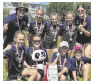
Große Freude beim jungen Team über Platz drei.

Nach einem souveränen Auftakt-sieg gegen die Heimmannschaft wartete bereits in der zweiten Begegnung der Dauerrivale aus Hirschbach, der sich später auch den Staatsmeistertitel sicherte. In einem intensiven Duell lag das Team zwischenzeitlich in Führung, musste sich jedoch knapp geschlagen geben. Am zweiten Wettkampftag sicherte sich die Mannschaft mit dem dritten Platz in der Vorrunde den Einzug ins Halbfinale. Dort erwies sich Ulrichsberg als zu abgeklärt und