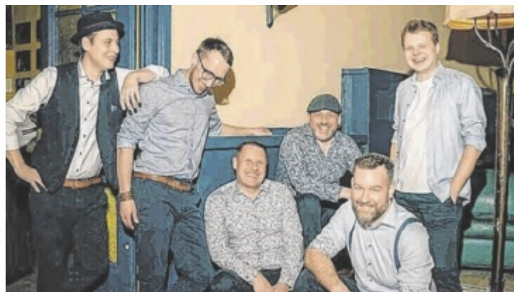
Die Band „Gschick“ spielt am 4. Juli unter freiem Himmel