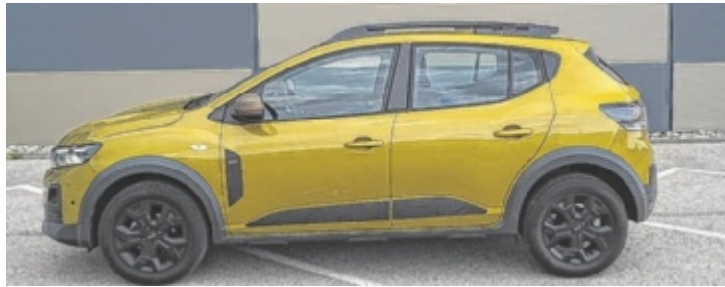
Der neue Dacia Sandero Stepway Extreme TCe 110

Ab-Preis 12.650 Euro. Dafür gibt es zwar eine spärlich ausgestattete Version mit 67 PS, doch am anderen Ende der Preisliste stehen 18.490 Euro für den 110 PS starken Sandero Stepway Extreme. Zum Test trat die beliebteste Sandero-Variante mit den Paketen „Technik“, „Winter“ und „Driving“ sowie der Lackierung in Amber Yellow an. Das ergibt einen Gesamtpreis von 20.717,20 Euro. Die Kombination aus Höherlegung, topografischer Bepflanzung und schwarzen 16-Zoll-Alufelgen verleiht dem Stepway einen eigenständigen und überraschend hochwertigen Auftritt.