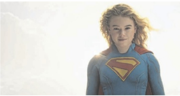
Milly Alcock schlüpft in die Rolle von Supergirl.