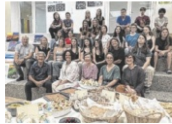
Bei der Präsentation in der Mittelschule Gallneukirchen.

GALLNEUKIRCHEN. Die Wahlpflichtfachklassen Kreativität und Slow Food der Mittelschule Gallneukirchen präsentierten bei der Ausstellung „Komm, guck und iss!“ Ergebnisse des Projekts „Mental Genial“. Die Initiative des Instituts Suchtprävention der pro mente Oberösterreich wird in Kooperation mit dem Land Oberösterreich umgesetzt und fördert die psychosoziale Gesundheit von Kindern und Jugendlichen. Zudem nehmen die Gallneukirchner Schü-