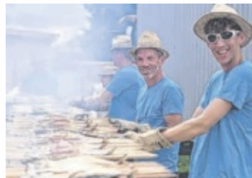
Das Rote Kreuz lädt zum Steckerlfischessen mit Dämmereschoppen.

ST. VEIT. Steckerlfischessen für den guten Zweck ist am 27. Juni wieder angesagt: Die Rotkreuz-Ortsstelle St. Veit lädt bereits zum 32. Mal zu diesem Event am Badeteich.