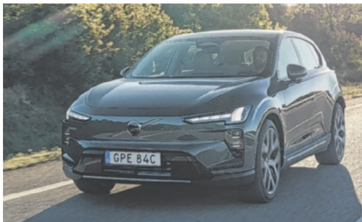
Mehr Reichweite, mehr Komfort: Der Volvo EX60

Der fünfsitzige SUV erreicht je nach Antriebsvariante eine Reichweite von bis zu 810 Kilometern und ist damit das bisher reichweitenstärkste Elektrofahrzeug von Volvo. Auch beim Laden setzt der EX60 neue Maßstäbe: An 400-kW-Schnellladestationen können innerhalb von zehn Minuten bis zu 340 Kilometer Reichweite nachgeladen werden. Damit soll der Umstieg auf Elektromobilität noch einfacher und alltagstauglicher werden.