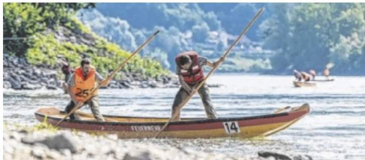
Der 64. Landes-Wasserwehrleistungsbewerb wurde an der Donau in Ottensheim ausgetragen.