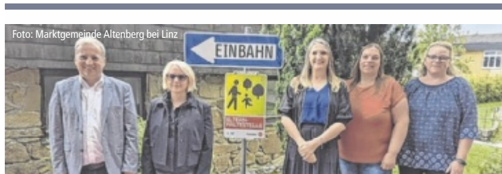
Ab Herbst sind in Altenberg zusätzliche Verkehrsmaßnahmen vorgesehen.