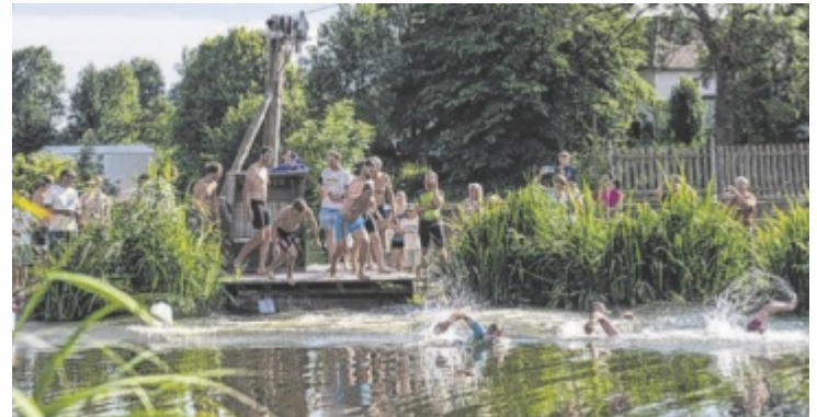
Schwimmen, Rad fahren und Laufen im Team.

Neu ist heuer ein Kinderbewerb, der um 15 Uhr startet. Auch hier zählt Teamgeist. Die Teams werden ausgelost und müssen ge-