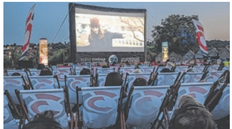
Das Silent Cinema macht am 6. Juli Station am Linzer Pfarrplatz.