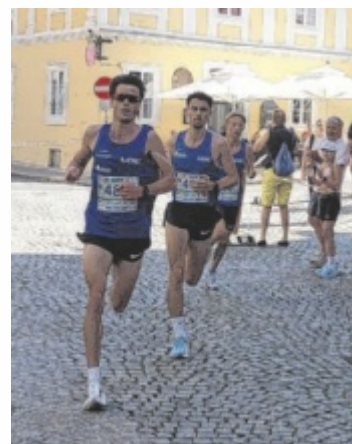
Stadtlauf am Sonntag