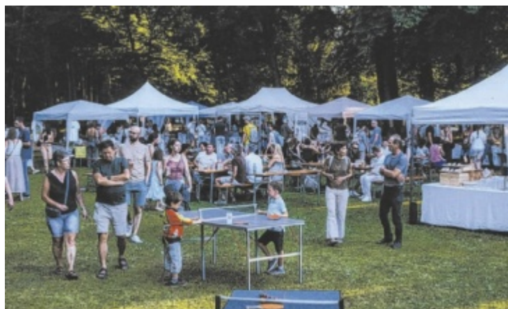
Kreativmarkt am Samstag ab 13 Uhr im Schlosspark