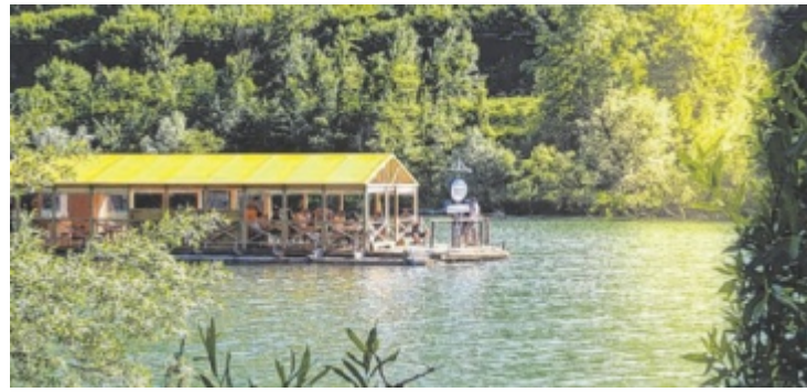
„Wein mal Eins“ am Floß der Floßmeisterei Dirninger im Ennstal