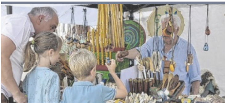
Sommermarkt Besonders die Aussteller im Freien litten beim Sommermarkt des Kunsthandwerkes in Sierning unter der großen Hitze. Am Vormittag war noch viel los und die Aussteller daher mit den Umsätzen zufrieden.