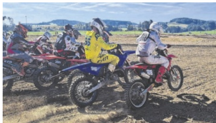
Motocross-Action wird an zwei Tagen in Behamberg geboten.