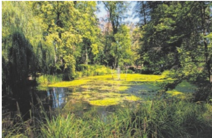
Der Schlosspark ist Steyrs grüne Lunge im Zentrum.

Das Ranking wird von der Gemeinde Lustenau in Vorarlberg angeführt, dort weist das Zentrum 55,3 Prozent Grünflächen auf. Dahinter folgen Bad Vöslau (Niederösterreich; 54,5 Prozent) und Ebreichsdorf (Niederösterreich; 54,4 Prozent). Steyr nimmt unter den 80 untersuchten Gemeinden mit 47,3 Prozent Grünflächen im Stadtzentrum den siebten Platz ein. Afselden (44,5 Prozent) kommt auf den 13. Platz, Traun (40,2 Prozent) auf den 20. Rang. Linz weist 33,4 Prozent Grünflächen auf, in Wels sind es