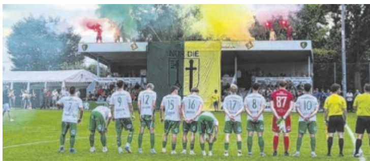
Der Fanklub aus Waldneukirchen sorgt mit seiner Choreografie beim Heimspiel für Gänsehaut bei den Spielern.

Die Union Waldneukirchen musste sich vor 350 Zuschauern zu Hause gegen BW Stadl-Paura mit einem 0:0 begnügen. Auswärts verlor man mit 2:5, damit steigt Waldneukirchen in die 2. Klasse ab. ■