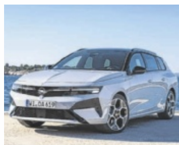
Opel Astra Sports Tourer Hybrid

Der Opel Astra bietet eine große Auswahl an Antrieben. Vom Elektroauto über Plug-in-Hybrid und Hybrid bis zum Diesel kann man das passende Modell für seine individuellen Bedürfnisse wählen.