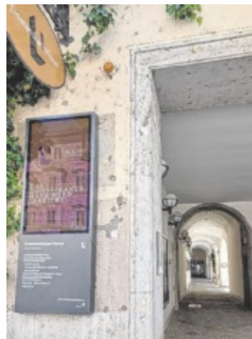
Dominikanerhaus schließt 2026.