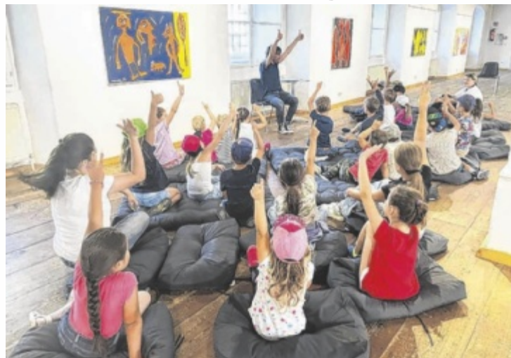
Das Format „Lesesinn“ findet im Schloss Lamberg statt.

Im Schloss Lamberg wird Lesen in neun kreativen Workshops mit allen Sinnen erlebbar gemacht – von Theater und Geschichten bis hin zu Kalligrafie und Sternenhimmel. Den Auftakt macht am Montag, 27. Juli, mit „Geheimnisvolles Chinesisch“ und „Schulalltag in China“ ein interkultureller Schwerpunkt in Kooperation mit dem Konfuzius Institut der Universität Wien: Kinder entdecken spielerisch chinesische Schriftzeichen, Kalligrafie, traditionelle Spiele und den All-