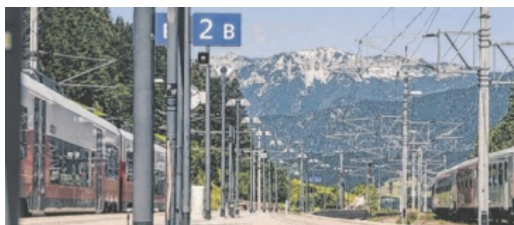
Der Bahnhof Spital bietet sich als Ausgangspunkt an.

Web: www.alpenverein.at/sektionspitalspialpyhrn