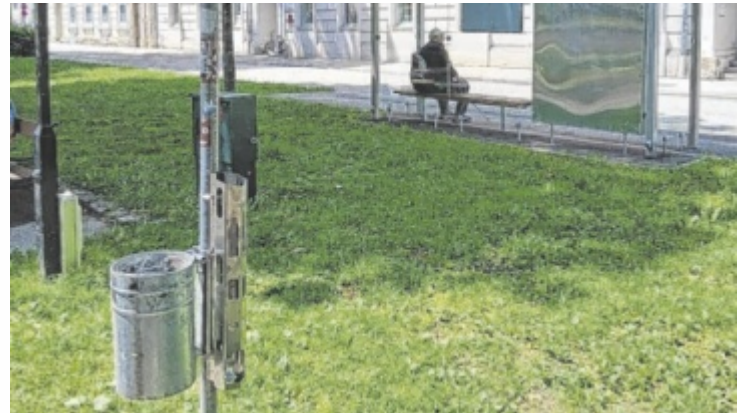
Die Module sind bei Mistkübeln – wie hier auf der Promenade – montiert und mit einer Flasche gekennzeichnet.

Menschen, die Pfandgebinde sammeln, müssen nicht mehr in Abfallbehältern suchen, sondern können sie direkt aus den vorgesehenen Halterungen mitnehmen. Das erspart das Wühlen im