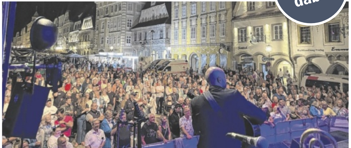
Das Stadtfest verwandelt die Steyrer Innenstadt in ein großes Festivalgelände.

Auf der Hauptbühne lässt „Help! A Beatles Tribute Band“ die größten Hits der Beatles wieder aufleben (20 Uhr). Von den frühen Klassikern bis zu den legendären Spätwerken spannt die Band einen Bogen durch das Schaffen der „Fab Four“. Im Anschluss bringen die Kubaner Ecos de Siboney, die Enkel des Buena Vista Social Club Musikers Compay Segundo, mit ihren latein-amerikanischen Rhythmen internationales Flair nach Steyr. Auch am Umkehrplatz am Ennskai gibt es wieder Livemusik.