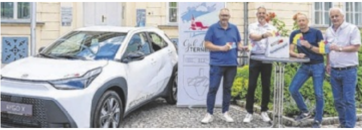
Der Hauptgewinn wurde von Toyota Reitner an das Marktfest-Team übergeben und wird bis zur großen Verlosung am Sonntag, 5. Juli, ausgestellt.