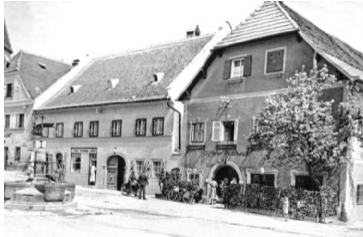
Gasthaus Zifferer wurde später zur Marktstub'n.

Ende Juni muss die Marktstub'n schließen, weil das Gebäude verkauft wurde und zugunsten von Wohnungen weichen soll. Seit mehr als 300 Jahren prägt das Haus (das sogenannte Zifferer Eck an der Kreuzung Kirchenplatz mit