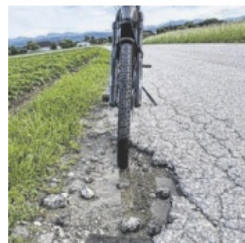
Gefährliches Schlagloch