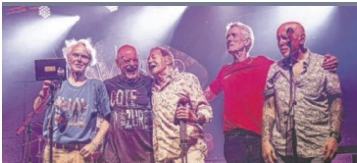
Austropop-Legende 1.400 Zuschauer lockte das Konzert von „Wir4 plus Eins“ rund um Wolfgang Ambros ins Vorwärts-Stadion. Der Steyrer Fußballverein will künftig regelmäßig als Konzertveranstalter tätig sein.