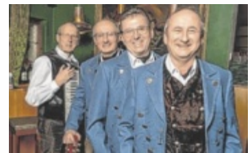
Die bekannten Krammerer Sänger gastieren am Stehrerhof.

NEUKIRCHEN/V. Das beliebte Gstanzlsinga und das Oldtimertreffen stehen am Stehrerhof auf dem Programm. Musikliebhaber und Freunde des schönen, alten Blechs kommen dabei am ersten Juliwochenende voll auf ihre Kosten.