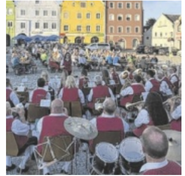
Die Platzkonzerte versprechen auch 2026 wieder unvergessliche Sommerabende.