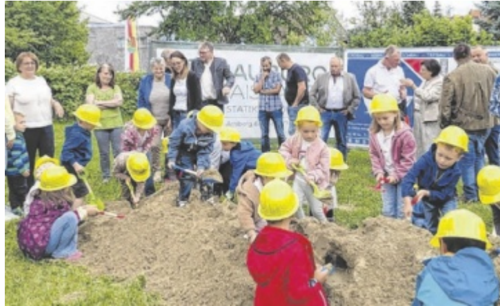
Spatenstich einmal anders: Die „Arbeit“ übernahmen mit Begeisterung die Kindergartenkinder aus Kirchheim.

Die neue Krabbelstube wird mit rund 1,1 Millionen Euro errichtet und stellt einen wichtigen Schritt zur Verbesserung der Kinderbetreuung in den drei Gemeinden dar. Durch die gemeindeübergreifende Zusammenarbeit können Synergien genutzt und ein bedarfsgerechtes Angebot für junge Familien geschaffen werden.