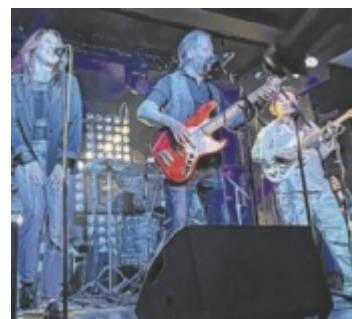
Die Badrock Blues band bei ihrem Konzert im KiK im März 2026.

durchgehend eine Kunsttombola statt. Dabei gibt es schöne Kunstpreise zu gewinnen, die Künstlerfreunde und Freundinnen der Galerie zur Verfügung gestellt haben.