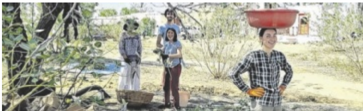
Ziel ist es, dass Frauen ihr Leben selbstbestimmt gestalten können.