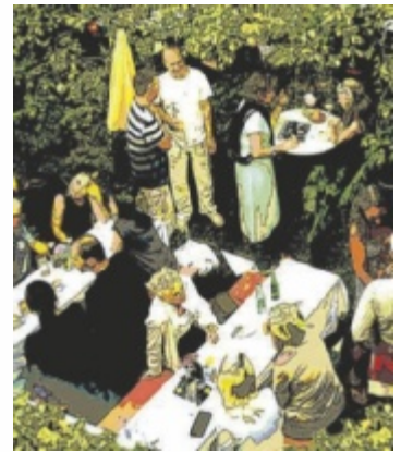
Das 20gerHaus feiert.

Beginn ist um 16 Uhr. Um 18 Uhr findet die offizielle Begrüßung und Eröffnung statt. Ab 19 Uhr wird die Badrock Blues Band ein Konzert geben. Die Kultband aus St. Martin liefert mit ihrem energiegeladenen Bluesrock den Soundtrack zum Jubiläum und wird die Bahnhofstraße in Konzertstimmung versetzen. Während des Festes findet