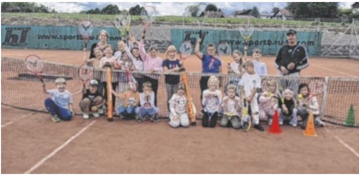
Die erste und zweite Klasse auf dem Tennisplatz