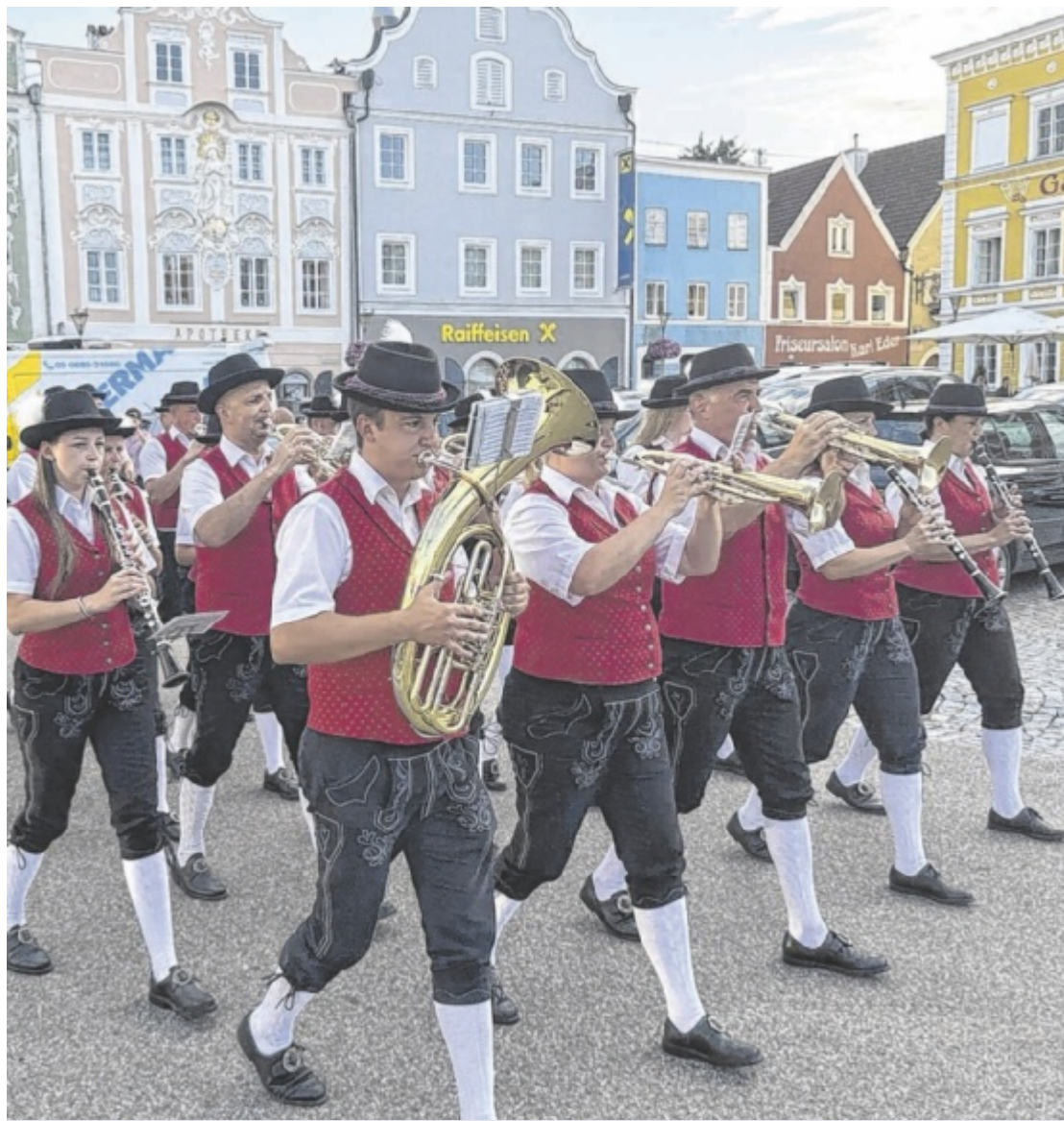
Obernberger Platzkonzerte Musikvereine aus dem Innviertel und Bayern spielen bei Schönwetter vom 10. Juli bis 28. August jeden Freitag ab 19 Uhr am Marktplatz auf. Der Eintritt ist frei.

Karriere als Immobilienmakler/in quer einsteigen und durchstarten REMAX innova Immobilien GmbH / remax-innova.at