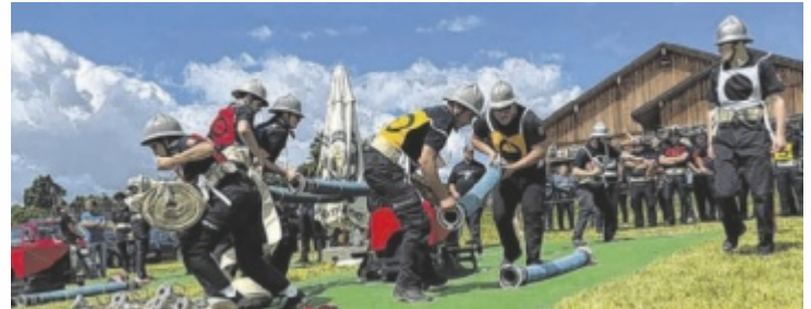
Bei den Bewerben bewiesen die Kameraden Teamgeist.

Den Auftakt bildete der Abschnitts-Feuerwehrleistungsbe- werb des Abschnittes Oberberg. Insgesamt stellten sich 85 Aktivgruppen und 127 Jugendgruppen den verschiedenen Herausforderungen und bewiesen dabei eindrucksvoll ihr Können, ihre Disziplin sowie ihren Teamgeist. Zahlreiche Zuschauer verfolgten die Bewerbe und sorgten für eine hervorragende Atmosphäre auf dem Festgelände. Im Anschluss an die Bewerbe und