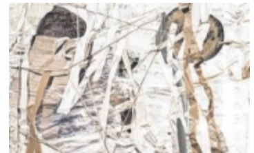
Hannes Rohringer: Present

Zentrum seiner Arbeiten und erforscht die Dualität des Objekts: Verbindung und Verletzung, Halt und Zerstörung. Ein alltäglicher Gegenstand wird zur kraftvollen Metapher. ■