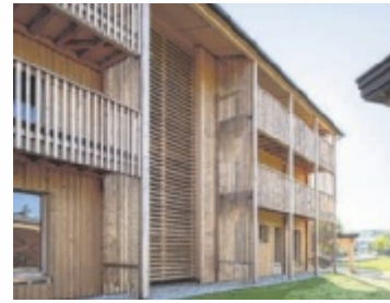
Holzbau ist die Zukunft!

ROSSBACH. Mehr als 200 Besucher folgten der Einladung zur „Langen Nacht des Holzbaus“ bei Holz Reisecker und sorgten für eine angenehme und lebendige Atmosphäre. Das große Interesse an den präsentierten Themen sowie die zahlreichen Gespräche und Begegnungen machten die Veranstaltung zu einem rundum gelungenen Abend.