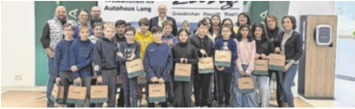
Die Schüler der Mittelschule 2 mit ihren Klassenpaten