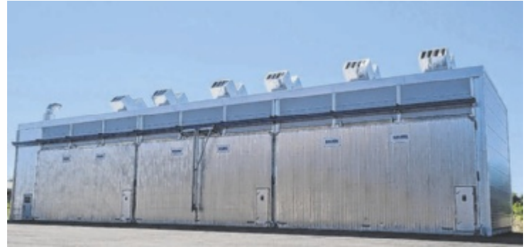
Energieeffiziente Trockenkammern des Typs 1306 PRO von Mühlböck

Das Auftragsvolumen liegt bei rund einer Million Euro. Dabei wurde die Infrastruktur auch bereits so ausgelegt, dass eine fünfte Anlage künftig problemlos ergänzt werden kann. Alpenglow Timber entwickelt derzeit in der Region Truckee am Lake Tahoe ein modernes und besonders nachhaltig ausgerichtetes Sägewerks- und Holzverarbeitungsprojekt. Das Unternehmen verarbeitet künftig vor allem Kiefern- und Tannenholz