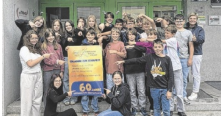
Die Schüler freuen sich auf das große Schulfest.

Vor 60 Jahren wurde eine Hauptschule in Eberschwang eingerichtet. Aus diesem Anlass lädt die Schule am Donnerstag, 2. Juli, um 16 Uhr, zu einem großen Schul- und Jubiläumsfest ein. Im Schuljahr 1965/66 begann die Geschichte der damaligen Hauptschule Eberschwang. Von einem modernen Schulbetrieb, wie man ihn heute kennt, war man damals allerdings noch weit entfernt. Ein eigenes Schulgebäude gab es noch nicht, die Klassen waren auf