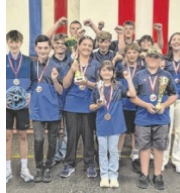
Die Jugendmannschaft freut sich über den Erfolg.

Die Bilanz der Landesmeisterschaften liest sich wie ein Märchen: Silber für die U14, Silber für die U19 und – als emotionaler Höhepunkt am letzten Wochenende – der Landesmeistertitel für die U16. Es war eine Saison der großen Emotionen und der fairen, spannenden Duelle. Die Belohnung