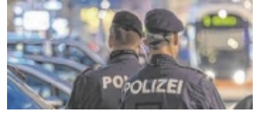
Nächtlicher Einsatz

LINZ. Ab 1. September 2026 passt die Polizei in Linz die Öffnungszeiten für den Parteienverkehr an. Dadurch sollen nachts zusätzliche Streifen unterwegs sein.