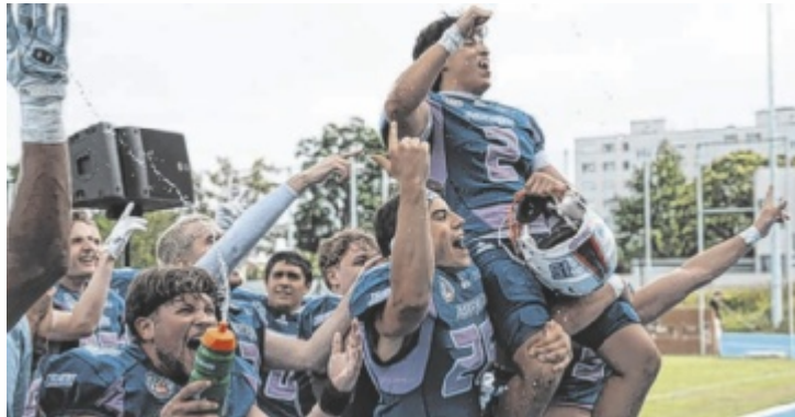
Die JKU Astros haben allen Grund zum Jubeln. Sie stehen im Finale.