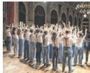
Jugendchöre aus ganz Österreich singen in Linz.

Das Publikum ist bei offenen Singen zum Zuhören eingeladen, am Martin-Luther-Platz und am Hauptplatz, am Dienstag und Mittwoch jeweils von 10 bis 12 Uhr so-