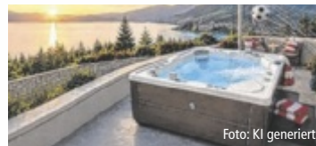
Bestpreis. Mehr Tore. Mehr Rabatt.

Im Aktionszeitraum von 11. Juni bis 19. Juli 2026 erhalten Kunden beim Kauf eines HotSpring Whirlpools 25 Prozent Rabatt – jedes Tor der Nationalmannschaft erhöht diesen Rabatt um weitere zwei Prozent. Da Österreich bei der WM bereits drei Tore erzielt hat (Stand: 17.6.), kommen aktuell sechs Prozent Zusatzrabatt auf den bereits reduzierten Aktionspreis dazu. Unter dem Motto „Mehr Tore. Mehr Rabatt. Mehr Wellness.“ verbindet HotSpring die Begeisterung der Fußball-WM mit Entspannung und Lebensqualität im eigenen Zuhause. „Mit unseren Produkten möchten wir