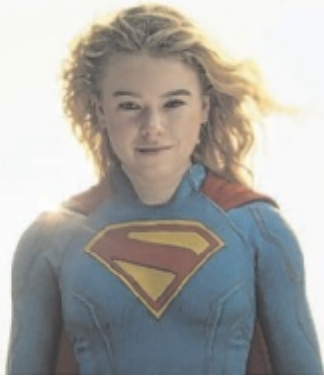
Milly Alcock schlüpft in die Rolle von Supergirl.