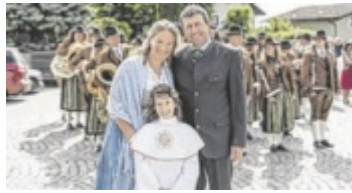
Marianne aus Braunau sicherte sich mit ihrem Foto den Sieg.

OÖ. Tips, die Brauerei Raschhofer und die Trachten Wichtlstube haben wieder das beliebteste Trachtenfoto gesucht – und gefunden. Beim diesjährigen Trachtenfoto-Voting konnten Teilnehmer ihre schönsten Bilder einreichen und sich den Stimmen der Leser stellen.