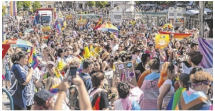
Rund 13.000 Menschen waren laut Hosi im Vorjahr Teil der Linzpride.

Die Linzpride steht erneut unter dem Motto „strong together, proud forever“, das sich auch immer mehr zum neuen Leitspruch für die Arbeit der HOSI Linz entwickelt. „Unsere Arbeit endet nicht mit dem Paradedag“, erläutert Vereinskocher Michael Müller: „Beratung, Bildungsarbeit, politische Interessenvertretung und Communityarbeit brauchen denselben Kern. Zusammenhalt nach innen. Selbstbewusstsein nach außen. ‚Strong together, proud forever‘ beschreibt genau diesen Anspruch.“