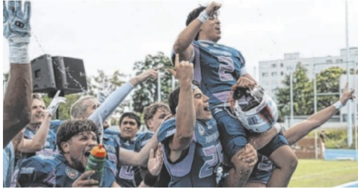
Die JKU Astros haben allen Grund zum Jubeln. Sie stehen im Finale.