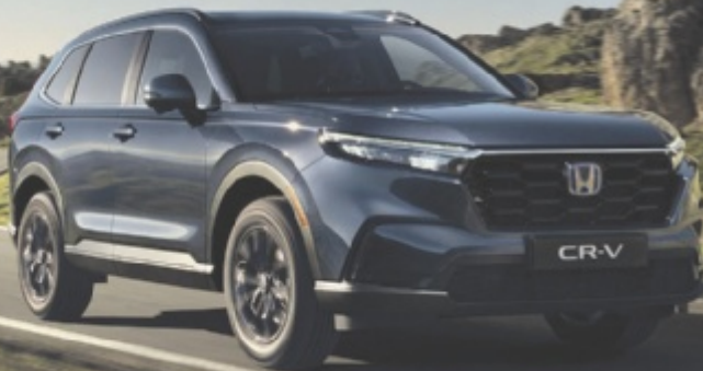
Honda CR-V 2.0 i-MMD Hybrid Advance