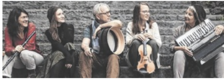
„Molly Malone“ kommen am 24. Juli vorbei.