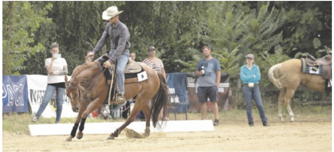
Rund neun Monate dauerten die Vorbereitungen für den Reining Day in Steyregg, der am 25. Juli stattfindet.

Wer Western-Feeling erleben und echte Cowboys und Cowgirls auf Westernpferden sehen will, ist beim Reitturnier Reining Day in Steyregg genau an der richtigen Stelle. Heuer wird dieser zum elften Mal vom Reitverein South Hill Ranch in Steyregg ausgetragen. Mastermind dahinter ist Trainer Reini Hochreiter. Der 44-Jährige aus Ried/Riedmark ist auf der Anlage seit mittlerweile 14 Jahren hauptberuflich Pferdetrainer, bildet Pferde aus, trainiert die Vierbeiner sowie deren Besitzer und reitet Jungtiere zu. Er selbst ist ein erfolgreicher Turnierstarter, war unter anderem Europameister sowie Staatsmeister und holte