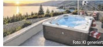
Bestpreis. Mehr Tore. Mehr Rabatt.

Im Aktionszeitraum von 11. Juni bis 19. Juli 2026 erhalten Kunden beim Kauf eines HotSpring Whirlpools 25 Prozent Rabatt – jedes Tor der Nationalmannschaft erhöht diesen Rabatt um weitere zwei Prozent. Da Österreich bei der WM bereits drei Tore erzielt hat (Stand: 17.6.), kommen aktuell sechs Prozent Zusatzrabatt auf den bereits reduzierten Aktionspreis dazu. Unter dem Motto „Mehr Tore. Mehr Rabatt. Mehr Wellness.“ verbindet HotSpring die Begeisterung der Fußball-WM mit Entspannung und Lebensqualität im eigenen Zuhause. „Mit unseren Produkten möchten wir