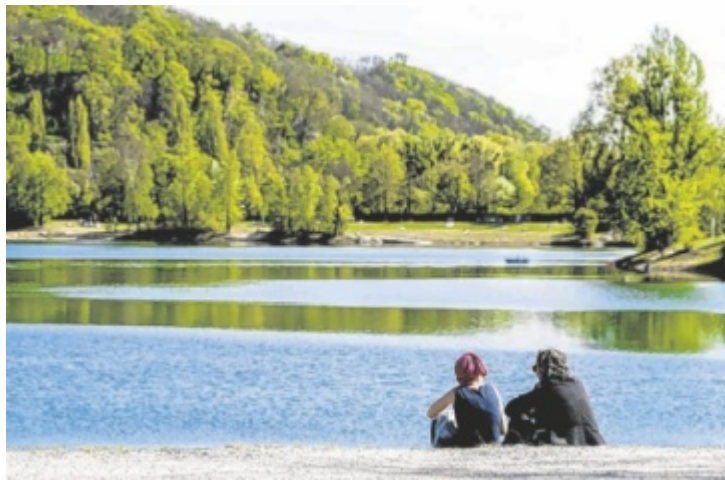
Der Pleschinger See in Steyregg ist derzeit Gesprächsthema.

Der betreffende Bericht der EEA beziehe sich zudem auf eine Prüfstation der AGES, die sich zu dieser Zeit noch in unmittelbarer Nähe einer Bootsanlegestelle befand, auf der sich immer wieder Wasservögel aufhalten. „Wo viele Wasservögel sind, kann sich das lokal auf die Wasserqualität auswirken“, schreibt die Linz AG, die in diesem Zusammenhang auf das Fütterungsverbot für Wasservögel verweist, da deren Ausscheidungen wesentlich die Wasserqualität