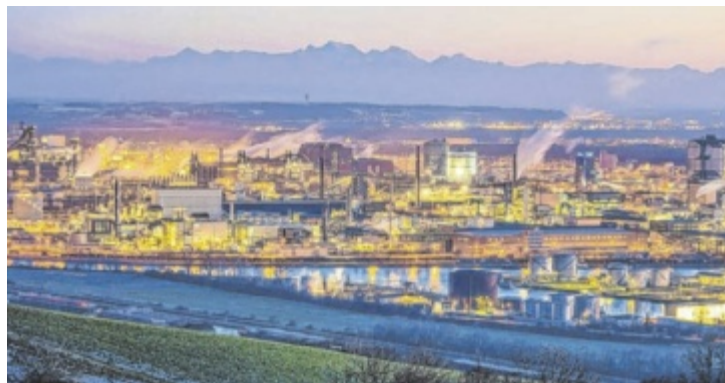
Linz soll Industriestandort bleiben.