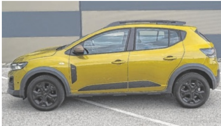
Der neue Dacia Sandero Stepway Extreme TCe 110

Dieses Modell hat sich auch zum Test eingefunden, angereichert um die Pakete „Technik“, „Winter“ und „Driving“ samt Amber-Yellow-Lackierung. Viel mehr Sandero geht dann nicht mehr, die 20.717,20 Euro für das Testmodell markieren den Zenit. Und ja, drei Pakete und die Metallic-Lackierung bringen Dacia zusammen weniger Gewinn als anderswo ein einziges Mini-Paketchen. Beim Sandero ist der Stepway die