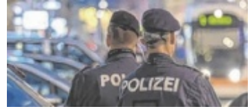
Nächtlicher Einsatz

LINZ. Ab 1. September 2026 passt die Polizei in Linz die Öffnungszeiten für den Parteienverkehr an. Dadurch sollen nachts zusätzliche Streifen unterwegs sein.