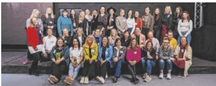
Das Event für selbstständige Frauen findet am 1. Juli statt.