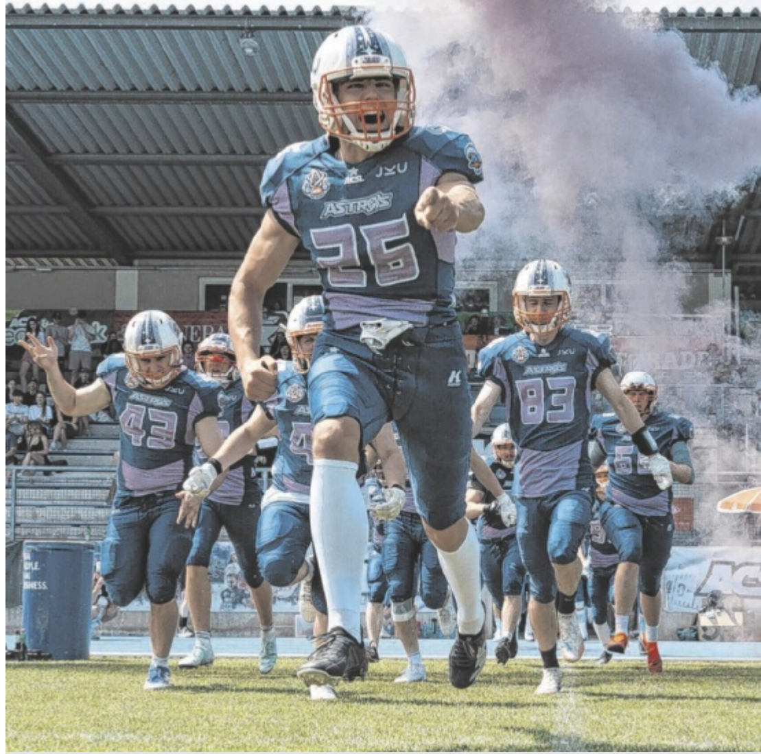
Football-Finale Die Footballmannschaft der JKU Linz schreibt Geschichte: Am kommenden Samstag, 27. Juni, stehen die JKU Astros im Super Bowl-Finale der österreichischen Universitäten in Wien.