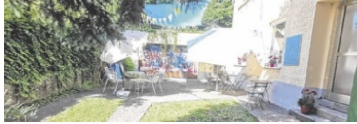
Das Simit Diyar cafe in der Hauptstraße bietet einen Gastgarten.

Ebenfalls geschlossen hat der afghanische Supermarkt mit angeschlossenen Restaurant. Angekündigt ist dort ein Umzug eine Hausnummer weiter, von Reindlstraße 1 zu Reindlstraße 3. Gegenüber hat sich vor kurzem ein Automatenshop eingemietet, ein Frequenzbringer ist auch das nicht. Frequenzbringer sind hingegen aktuell die Lokale mit Übertragungen der Fußball-WM.