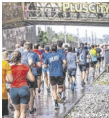
Der Lauf erfreut sich großer Beliebtheit.

Nachdem im vergangenen Jahr erstmals 800 Läufer beim 5,9-km-Lauf teilgenommen haben, wird heuer ein weiterer Teilnehmerrekord angestrebt. Gelaufen wird in 3er-Teams (Frauen, Männer, Mixed), wobei alle Teammitglieder die volle Distanz absolvieren und erst am Ende die drei Zeiten zu einer Gesamtzeit addiert werden. Der Startschuss erfolgt um 19.15 Uhr bei der Pluskaufstraße (Brücke). Das Ziel befindet sich am Palmenplatz in der PlusCity. Bereits bei der Startnummernabholung bekommen alle Starter ein prall gefülltes Goodie-Bag ausge-