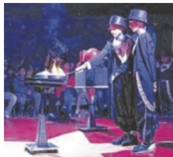
Showtime: Von Zauberei...

Unter Anleitung der Profis vom Projektzirkus Montana übten die jungen Artisten für insgesamt vier Vorstellungen vor Publikum. Jedes Kind erlebte dabei seinen ganz persönlichen Moment im Rampenlicht. Speziell angefertigte Kostüme sorgten für echtes Zirkusflair und ließen die Schüler zu kleinen Stars in der Manege werden. Ganz nebenbei wurden Selbstbewusstsein, Mut und das individuelle Talent gefördert. ■