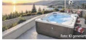
Bestpreis. Mehr Tore. Mehr Rabatt.

Im Aktionszeitraum von 11. Juni bis 19. Juli 2026 erhalten Kunden beim Kauf eines HotSpring Whirlpools 25 Prozent Rabatt – jedes Tor der Nationalmannschaft erhöht diesen Rabatt um weitere zwei Prozent. Da Österreich bei der WM bereits drei Tore erzielt hat (Stand: 17.6.), kommen aktuell sechs Prozent Zusatzrabatt auf den bereits reduzierten Aktionspreis dazu. Unter dem Motto „Mehr Tore. Mehr Rabatt. Mehr Wellness.“ verbindet HotSpring die Begeisterung der Fußball-WM mit Entspannung und Lebensqualität im eigenen Zuhause. „Mit unseren Produkten möchten wir