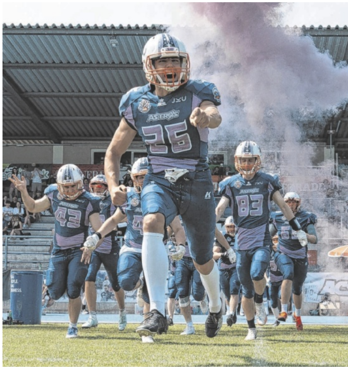
Football-Finale Die Footballmannschaft der JKU Linz schreibt Geschichte: Am kommenden Samstag, 27. Juni, stehen die JKU Astros im Super Bowl-Finale der österreichischen Universitäten in Wien.