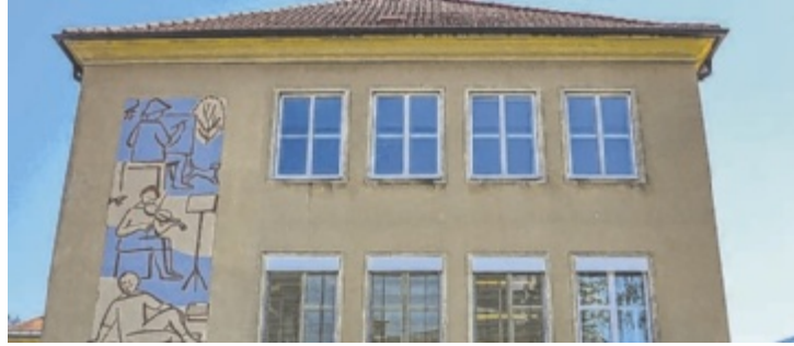
Die KMMS ist eine der ersten vier ausgezeichneten Schulen in OÖ

KIRCHDORF. Die Kreativ- und Musikmittelschule Kirchdorf zählt zu den ersten ausgezeichneten „Kinderrechte Schulen OÖ“. Mit einem kreativen Projekt rund um Stop-Motion-Videos setzte die Schule ein starkes Zeichen für ein respektvolles Miteinander und die aktive Beteiligung von Schülern.