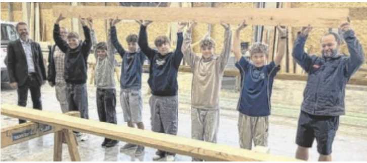
Die Pettenbacher Mittelschüler erhielten praktische Einblicke in die Arbeitswelt und lernten bei der Job Rallye verschiedene Berufe kennen.