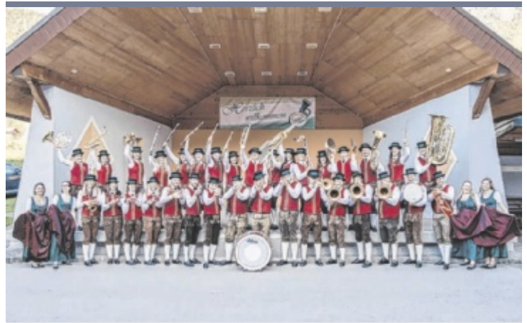
Dämmerstopp Der Musikverein Spital am Pyhrn lädt am Freitag, 3. Juli, ab 19 Uhr zum traditionellen Dämmerstopp beim Musikpavillon ein. Besucher dürfen sich auf einen stimmungsvollen Sommerabend mit Beiträgen des Musikvereins, der Jugendkapelle sowie der neuen „Minimusi“ freuen. Auch für das leibliche Wohl ist bestens gesorgt.