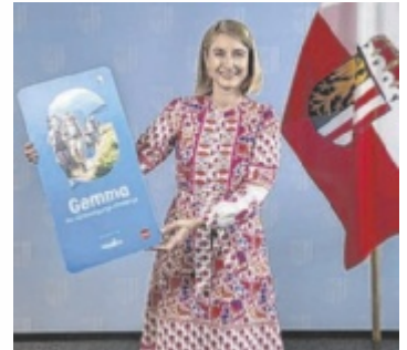
LH-Stv. Christine Haberlander

Bei den größeren Gemeinden mit mehr als 3.000 Einwohnern hat Micheldorf derzeit die Nase vorne. Mit 112.632 aktiven Minuten belegt die Marktgemeinde im oberösterreichischen Ranking Platz fünf. Besonders aktiv zeigt sich Micheldorf auch bei den Teilnehmern über 60 Jahren: In dieser Wertung wurden bereits 23.449 Bewegungsminuten gesammelt. Dabei zählt nicht die persönliche Höchstleistung, sondern die gemeinsame Aktivität