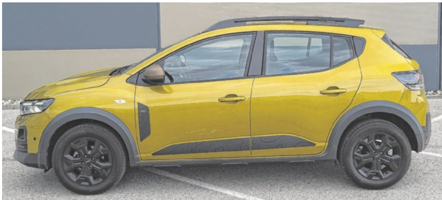
Der Dacia Sandero Stepway Extreme TCe 110 ist als Basismodell ab 15.490 Euro zu haben.