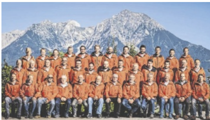
Die ehrenamtlichen Einsatzkräfte der Ortsstelle Windischgarsten

Riesenhuber: Da unser Equipment strenge Sicherheitsanforderungen erfüllen muss, ist es in der Anschaffung oft sehr teuer. Es handelt sich jedoch um Spezialmaterial, das nach einem Diebstahl wohl nur sehr schwer zu verkaufen sein wird. Obwohl die Bergretter ehrenamtlich arbeiten und somit die geleistete Zeit für Ausbildung und Einsätze nicht abgegolten wird, haben wir trotzdem einen relativ hohen Finanzierungsbedarf, um das Spezialmaterial anzuschaffen und um unsere Fahrzeuge und Einsatzmittel zu warten. Die ehrenamtliche Tätigkeit im Allgemeinen, und im Spezialfall natürlich auch in der Bergrettung, ist aus meiner Sicht absolut notwendig, um in Österreich in vielen Bereichen den Lebensstandard, wie wir ihn kennen, aufrechtzuerhalten. Wenn all die freiwillig geleisteten Stunden bezahlt werden müssten, dann wäre vieles nicht leistbar. Mein Appell an die Bevölkerung ist daher, nicht nur zu konsumieren, sondern auch darüber nachzudenken, wo man seinen Beitrag zu unserer Gesellschaft leisten kann. Gerade bei der ehrenamtlichen Tätigkeit erfährt man oft eine starke Gemeinschaft und eine Anerkennung der Bevölkerung. ■