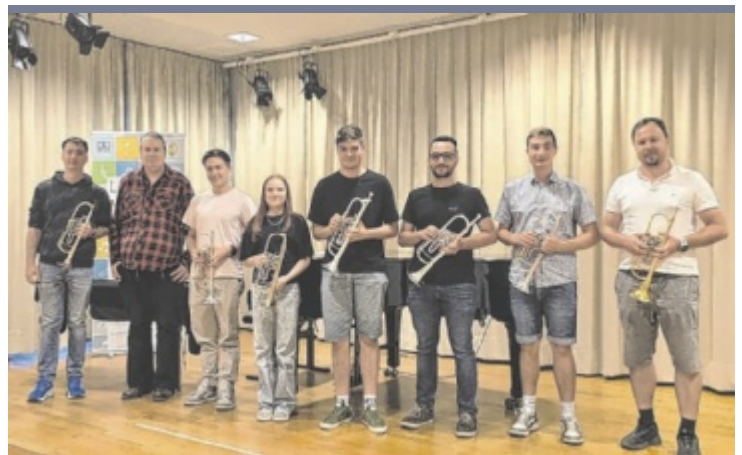
Trompetenkonzert An der Landesmusikschule Windischgarsten wurden gemeinsam mit Yamaha neu entwickelte Drehventiltrompeten getestet. Dabei gaben Fachleute Einblicke in die Entwicklung und den Bau von Blechblasinstrumenten. Interessierte und Schüler aus der Region konnten die Instrumente direkt ausprobieren und mit anderen Modellen vergleichen.