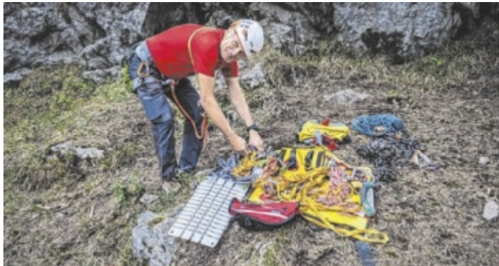
Ein Bergretter prüft das Rettungsmaterial – im Notfall zählt jede Minute.

Beim eigentlichen Einsatz ist die Vorbereitung sehr gering. Wir haben in unserer Zentrale immer einen fertig gepackten Anhänger, der am Bergrettungsbus angehängt wird und damit die Einsatzbereitschaft hergestellt wird. Das ist in etwa zwei Minuten erledigt. Sehr oft können wir schon 15 Minuten nach einer Alarmierung ausrücken. Hier ist die Anfahrtszeit der Bergretter