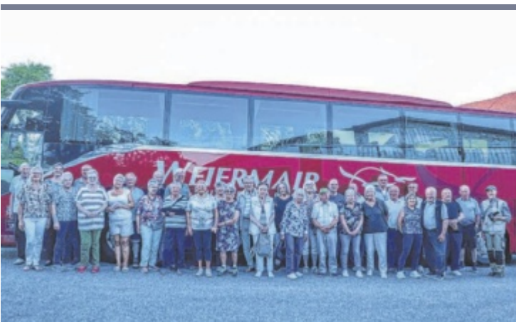
Ausflug Der Seniorenbund Kirchdorf/Krems war unterwegs in Landshut. Auf dem Programm standen die Burg Trausnitz, ein Spaziergang durch die Altstadt mit ihren schönen Bürgerhäusern und ein Besuch der Martinskirche mit dem höchsten Backsteinturm der Welt. Zum gemütlichen Abschluss kehrte die Gruppe bei der Mostschenke Möseneder in Geboltskirchen ein.