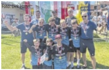
Die Faustballer jubeln über ihren Titel.