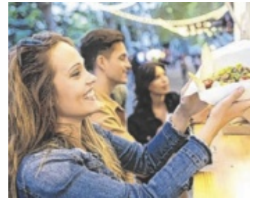
Von Stand zu Stand schlendern und genießen

Produktqualität wird großgeschrieben, wenn zum European Street Food Festival geladen wird. Die zahlreichen Köche machen mit ihren Food-Trucks am Samstag, 27. Juni, von 11 bis 22 Uhr und am Sonntag, 28. Juni, von 11 bis 20 Uhr am Marktplatz Kremsmünster Station. „Genuss aus aller Welt“ ist das Motto. Egal ob Mexikanisch oder Indisch, ob American Burger oder Schmankerl aus heimischen Küchen, ob Gekochtes oder Gegrilltes, Vegetarisch, Vegan oder Waffeln: all das wird angeboten. Zubereitet wird, wie bei Street Food üblich, direkt vor Ort frisch. Die Besucher schlen-