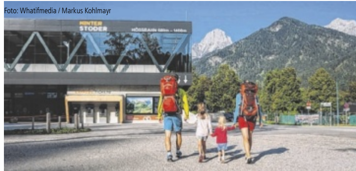
Wandern auf der Höss in Hinterstoder in der Urlaubsregion Pyhrn-Priel.

Zu den Programmhöhepunkten zählen das Almfest auf der Wurzeralm sowie Yoga-Angebote in alpiner Umgebung. Das Almfest findet am Samstag, 27. Juni, statt und umfasst musikalische Unterhaltung, regionale Verpflegung sowie Aktivitäten für Familien. Am Abend ist das traditionelle Bergleuchten geplant.