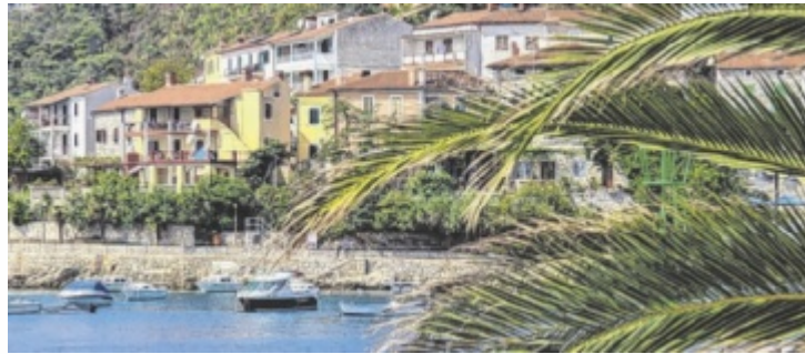
Rabac an der Ostküste Istriens: Ein malerisches Küstendorf, das mit mediterranem Charme und türkisfarbenem Wasser verzaubert.

An der malerischen Ostküste Istriens liegt die Perle Rabac. Einst ein kleines Fischerdorf, verzaubert der Ort heute mit mediterranem Charme, kristallklarem, türkisfarbenem Wasser und idyllischen Buchten. Eingebettet in üppige grüne Hügel, lädt Rabac im Juli dazu ein, die Seele baumeln zu lassen. Beim Schlendern an der lebhaften Strandpro-