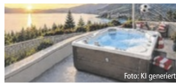
Bestpreis. Mehr Tore. Mehr Rabatt.

Im Aktionszeitraum von 11. Juni bis 19. Juli 2026 erhalten Kunden beim Kauf eines HotSpring Whirlpools 25 Prozent Rabatt – jedes Tor der Nationalmannschaft erhöht diesen Rabatt um weitere zwei Prozent. Da Österreich bei der WM bereits drei Tore erzielt hat (Stand: 17.6.), kommen aktuell sechs Prozent Zusatzrabatt auf den bereits reduzierten Aktionspreis dazu. Unter dem Motto „Mehr Tore. Mehr Rabatt. Mehr Wellness.“ verbindet HotSpring die Begeisterung der Fußball-WM mit Entspannung und Lebensqualität im eigenen Zuhause. „Mit unseren Produkten möchten wir