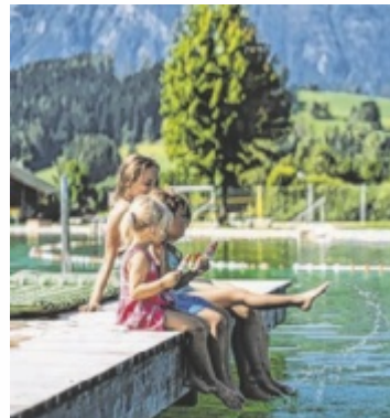
Am Badeseesee Edlbach im Windischgarstner Tal.

Ab 12 Uhr erwartet die Besucher in Edlbach ein abwechslungsreiches Freizeitprogramm. Im Mittelpunkt steht ein Beachvolleyballturnier, bei dem attraktive Preise vergeben werden. Darüber hinaus sind unter anderem eine Torschusswand, eine Limbostange sowie musikalische Unterhaltung geplant. Für die Besucher wird kostenlos Eis angeboten. Nach dem Termin in Edlbach macht die Tour in Maut-