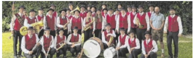
Der Musikverein Wesenufer lädt zum Jubiläumsfest ein.