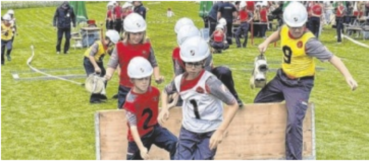
Beim Bewerb traten besonders viele Jugendgruppen an.