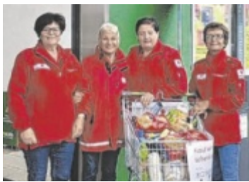
Sozialdienst-Mitarbeiterinnen waren im Einsatz.