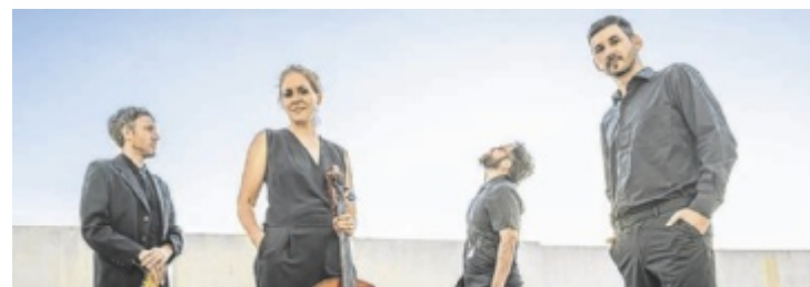
Das Ensemble Cuero bringt moderne Tangoklänge nach Schärdding.

Samstag, 4. Juli Schlosspark, Schärdding 20 Uhr / VVK: 18, AK: 20 Euro