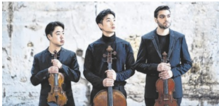
Das Arnold String Trio tritt am 3. Juli im Schloss Zell auf.

Donnerstag, 2. Juli Orangerie, Schärding 16.30 Uhr