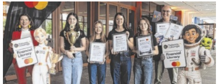
Schüler der 4M glänzten bei der „Mastercard Finanzchallenge“.

Initiiert hatten den Wettbewerb Mastercard und das DaVinciLab. Die besten Klassen wurden im