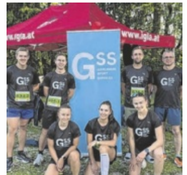
Das Team von Gierlinger Sport Service war erfolgreich.

ST. FLORIAN. Mit einer starken Teamleistung sicherten sich die Mitarbeiter des Unternehmens Gierlinger Sport Services aus St. Florian beim 12-Stunden-Lauf in Prambachkirchen den zweiten Platz in der Mixed-Wertung. Die Teilnehmer liefen dabei zugunsten der Oberösterreichischen Kinder-Krebs-Hilfe.