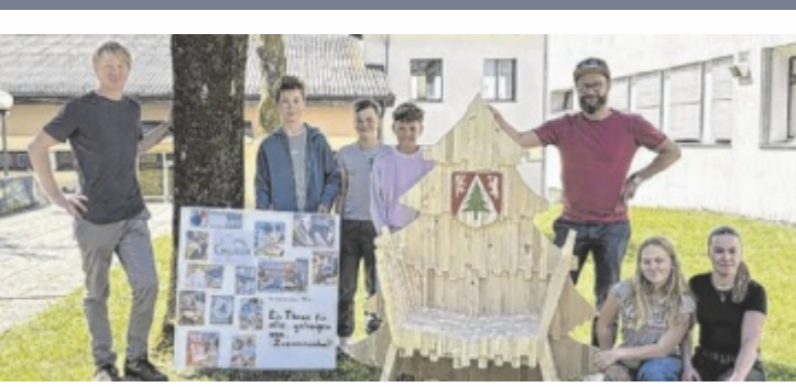
St. Marienkirchen hat dank der TNMS-Schüler einen eigenen Thron.