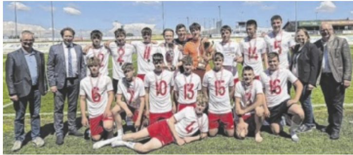
Die erfolgreiche Mannschaft der Fachschule

ST. FLORIAN. Die Fußballmannschaft der Landwirtschaftlichen Berufs- und Fachschule Otterbach ist derzeit auf Erfolgskurs: Neben der erfolgreichen Titelverteidigung beim Landessportfest sicherten sich die Schüler erstmals auch den Bundesmeistertitel der landwirtschaftlichen Fachschulen Österreichs.