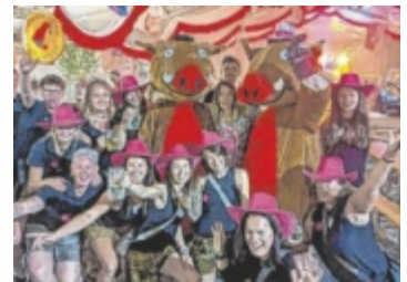
Maskottchen Eduard ist bei der Party mit dabei.

ST. AEGIDI. Das Wildsaufest in St. Aegidi zählt seit Jahren zu den größten Sommerveranstaltungen der Region. Am Wochenende von 24. bis 26. Juli wird im Gewerbegebiet Schauern zum 21. Mal gefeiert. Es werden Tausende Besucher erwartet.