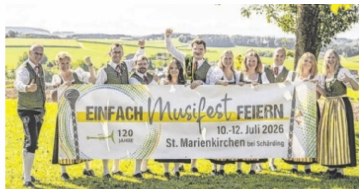
Der Musikverein St. Marienkirchen lädt zur Jubiläumsfeier.

Den Auftakt macht am Freitag, 10. Juli, der Bezirkswandertag des Seniorenverbandes. Nach der Eröffnung des Bezirksmusikfests um 19 Uhr sorgen bei der „Brass Night“