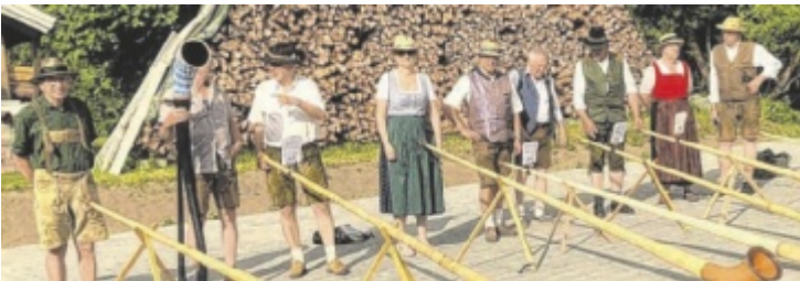
In Freinberg sind Ende Juni Alphornklänge zu hören.