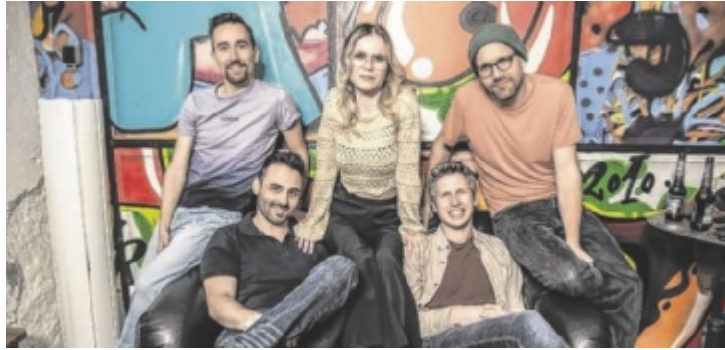
Queen's Garden übernimmt am 9. Juli die Opener-Rolle.

An drei Sommerabenden verwandeln sich besondere Orte in Perg in offene Bühnen für Musikbegeisterte. Jede Veranstaltung startet mit einer Opener-Band, die den Abend musikalisch eröffnet. Im Anschluss ist die Bühne frei für alle, die selbst musizieren möchten. Musiker jeden Alters und Levels sind eingeladen, zu spielen, Neues auszuprobieren und spontan miteinander Musik entstehen zu lassen.