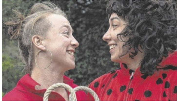
„3 Amigas Tuyas“ gastieren am Biohof Luftensteiner.