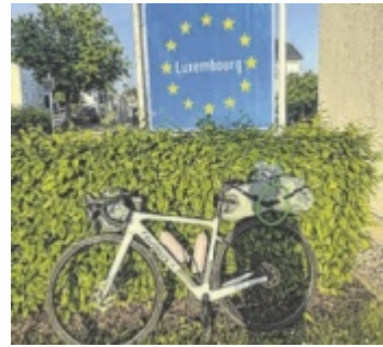
Die Tour führte auch durch Luxemburg.

Innerhalb von nur zehn Tagen führte die Reise von Irland über Großbritannien, Frankreich, Belgien, Luxemburg und Deutschland bis nach Oberösterreich. Im Mittelpunkt stand für sie jedoch nicht die sportliche Höchstleistung, sondern der gute Zweck. Mit ihrer Aktion unterstützte sie den Verein „Herz bewegt“, der lebensnotwendige Herzoperationen für Kinder in Entwick-