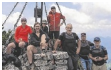
Die acht Gipfelstürmer der Naturfreunde Mauthausen.

führt wird? Diese Beispiele zeigen, wie wichtig das Zusammenkommen und miteinander reden ist“, sagt GVV-Bezirksvorsitzender Walter Hofstätter und freut sich auf das nächste Vernetzungstreffen. ■