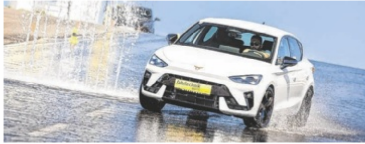
Ausweichen sollte man nur, wenn rechtzeitiges Anhalten unmöglich ist.