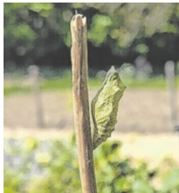
Von der Puppe...