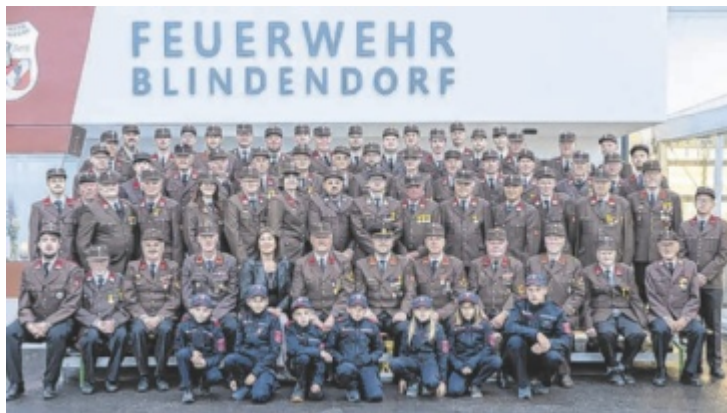
Die Kameraden der FF Blindendorf laden am 27. und 28. Juni zum großen Jubiläumsfest mit Abschnittsbewerb ein.

Die Veranstaltung findet in Blindendorf, direkt neben dem Leherbauer-Hof (Blindendorf 11), statt. Die Ursprünge der Feuerwehr reichen in die frühen 1920er-Jahre zurück. Damals erschütterten mehrere verheerende Brände die Ortschaft. Da umliegende Feuerwehren oft erst sehr verspätet eintreffen konnten, entschloss sich die Bevölkerung im Jahr 1926 zur Gründung eines eigenen Löschzuges. Ein Jahr-