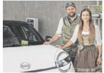
Trachtenpärchen-Wahl bei der Mühlviertler Wiesn

FREISTADT. Bei der Mühlviertler Wiesn wird erstmals das Mühlviertler Trachtenpärchen gewählt (14. August) und damit das offizielle Gesicht der Mühlviertler Messe für ein ganzes Jahr.