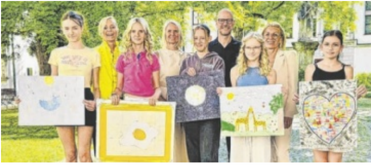
Die prämierten Teilnehmerinnen mit ihren Werken