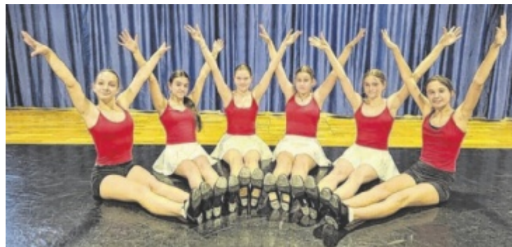
Tanzaufführungen am 19. und 20. Juni