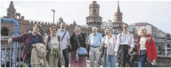
Für acht Teilnehmer ging es nach Berlin auf Bildungsreise.