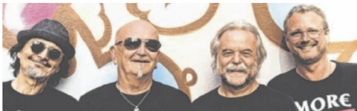
The Recyclers sorgen am 19. September für Stimmung.

mit Rock und Blues verbunden ist. Die Granden der legendären „Tornados“, „Rain & Tears“, „Gustl und seine Haberer“ und der „Showbrothers“ haben sich als „Recyclers“ wiedergefunden. „Wiederverwertet“ werden sie beim Konzert alles geben was sie draufhaben. Als Vorband tritt „Horch zua“ auf. VVK: www.gutau.ooesb.at ; AK: 20 Euro; Beginn: 19 Uhr, Einlass: 18.30 Uhr ■