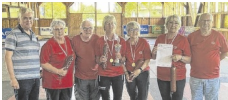
Die bestplatzierten Teams qualifizierten sich für die Landesmeisterschaft.