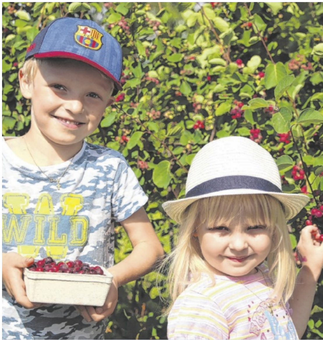
Machland-Exoten Früchte aus aller Welt – von der Feige bis zur Indianerbanane – kultiviert die Familie Hinterplattner auf ihrem Hof in Mauthausen. Der Nachwuchs hilft beim Pflücken und natürlich beim Naschen! Seite 2/