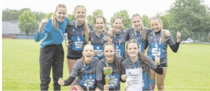
Die Landesmeisterinnen aus Bad Kreuzen.

Die Faustball-Landesmeisterschaft der Mädchen fand in Laakirchen statt. Insgesamt kämpften neun Teams um den Titel. Das Team der SMS Bad Kreuzen setzte sich aus vier Mädchen der 3A sowie vier Mädchen der 4A/B zusammen. Nach einem nervösen Auftaktspiel steigerten sich die Mädchen von Spiel zu Spiel. Mit großem Einsatz und tollen Leistungen kämpften sie sich bis ins Halbfinale vor. Das Spiel um den Finaleinzug gegen das BRG/BG Rohrbach war an