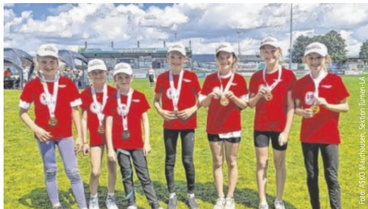
Riesensfreude über die Final-Qualifikation: „Die, die sich schlau bewegen“

Insgesamt 26 Mannschaften aus ganz Oberösterreich kämpften um die begehrten Startplätze für das Bundesfinale. Das Team des ASKÖ Mauthausen, das unter dem Namen „Die, die sich schlau bewegen“ antrat, überzeugte dabei mit großem Einsatz, hervorragender Teamarbeit und starken Nerven.