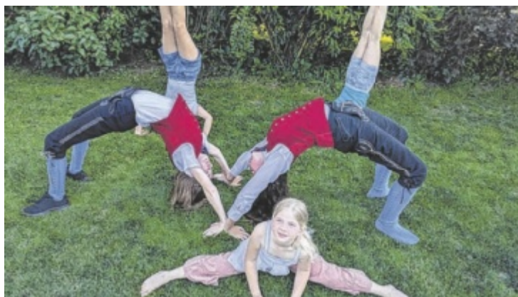
Ein Fest für Familien findet am 21. Juni in Mauthausen statt.

..... Die Veranstaltung beginnt um 9.30 Uhr auf dem Schulhof der Mittelschule mit einer feierlichen Feldmesse. Anschließend sorgen die Marktmusik Mauthausen, die Nachwuchsmusiker des Vereins sowie die Brass-Formation BöhmX mit einer Mischung aus modernen und traditionellen Klängen für beste Unterhaltung. Kulinarisch werden die Besucher mit Kistenbratl