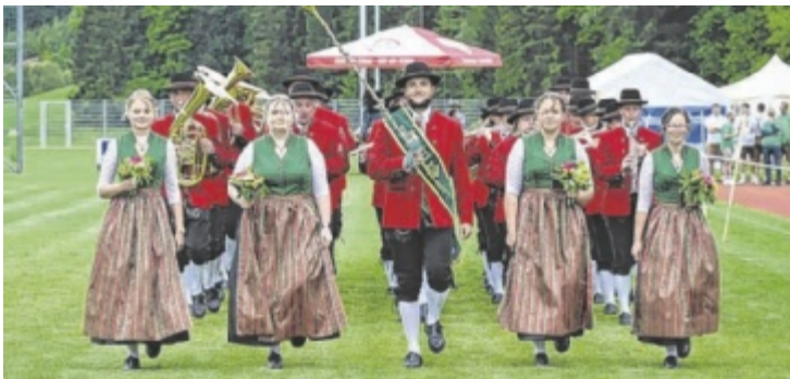
Gastgeber: die Musikkapelle Königswiesen