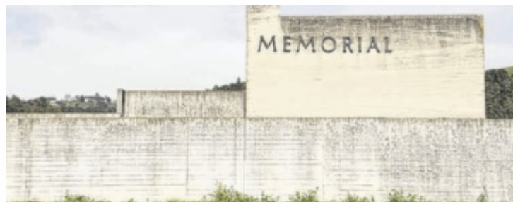
Erinnerungsort Gusen: Einblick in seine Geschichte

In diesem Rundgang wird der wechselhaften Geschichte des Erinnerungsortes Gusen von 1945 bis zur Gegenwart nachgegangen. Im Unterschied zum ehemaligen KZ Mauthausen, seit 1949 eine staatliche Gedenkstätte, ist die Erinnerung an das ehemalige KZ Gusen (dazu zählt auch die Errichtung des Memorials Gusen) bis Ende der 1990-er Jahre ausschließlich ausländischen wie inländischen privaten Initiativen zu verdanken. Während sich Mauthausen ab den 1970er Jahren zu einem zentra-