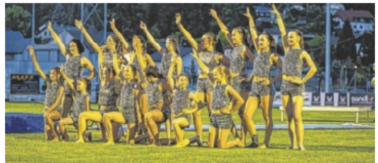
Sonnwendschauturnen am 26. Juni

fektion oder Modelqualitäten, sondern Persönlichkeit, Ausstrahlung, Sympathie und die Verbundenheit mit dem Mühlviertel. Auf das Trachtenpärchen warten hochwertige Preise regionaler Partner - unter anderem ein Elektroauto zur einjährigen Nutzung. Weitere Informationen folgen in Kürze. Homepage: messe-muehlviertel.at/mtp