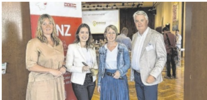
Netzwerktreffen für Unternehmer in Perg

Unternehmer aus ganz Oberösterreich nutzten die Veranstaltung, um in einer angenehmen Atmosphäre gezielt neue berufliche Verbindungen aufzubauen und konkrete Kooperationsmöglichkeiten zu erschließen. Die WKO Oberösterreich setzte dabei auf ein präzises „Speed-Dating für Unternehmen“. Die Gespräche wurden bereits im Vorfeld organisiert. Dadurch trafen die Teilnehmer direkt mit passenden Geschäftspartnern zusammen, mit denen sie fundiert über Partnerschaften und neue Geschäftsbeziehungen sprechen