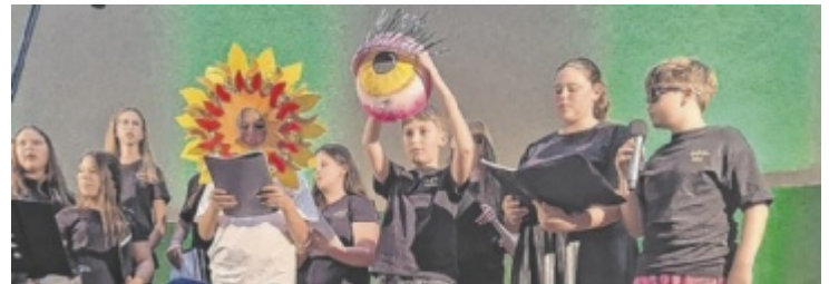
Gemeinsames Konzert von Schülern aus Perg und Bayern.