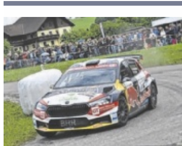
Raimund Baumschlager war mit seinem Skoda flott unterwegs.