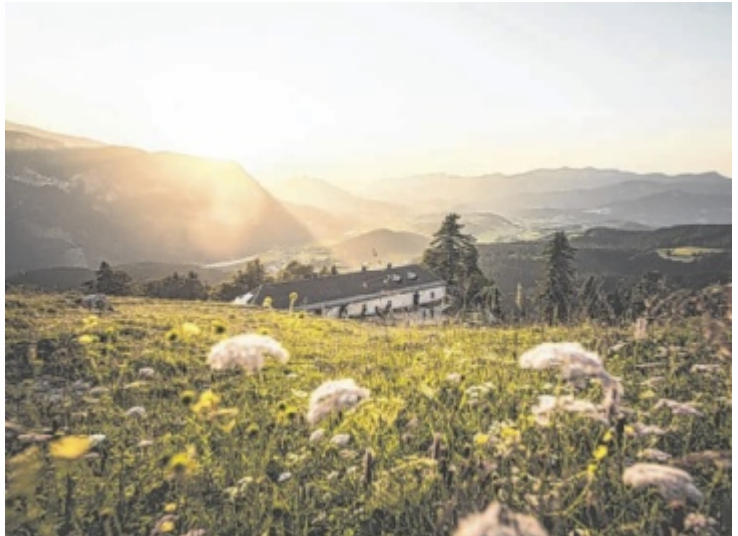
Die Hofalm liegt am Fuße des Großen Pyhrgas in den Ennstaler Alpen an der Grenze zwischen Oberösterreich und der Steiermark.

Hinter der Klimaschutzaktion stehen der Alpenverein Spital am Pyhrn und die Touristenklubs Windischgarsten und Linz. Kostenlose Hüttenübernachten, wenn man nachweislich mit Öffis anreist, gibt es zwischen 24. und 27. Juni, zwischen 15. und 18. Juli sowie zwischen 20. und 23. Juli. Jede der vier Höhlen stellt insgesamt drei Termine zur Verfügung, eine Reservierung muss im Vorfeld vorgenommen werden (siehe Infokasten). Die beteiligten Höhlen bieten eine gemütliche Atmosphäre sowie regionale Küche und sind ideale Ausgangspunkte für viele Wanderungen – von gemütlichen Almwegen bis zu alpinen Gipfeltouren. ■