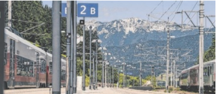
Der Bahnhof Spital bietet sich als Ausgangspunkt an.