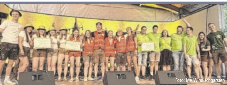
Gelungene Premiere Die erste „Gaschtner MusiGaudi“ im Rathaus Hof Windischgarsten war ein voller Erfolg. Für musikalische Vielfalt sorgten JuMuKap, die Bosruckmusi, Windischgarstner Böhmisches und VoigasBuam. Ein Highlight war der ausgetragene Gaschtner Blechathlon mit spannenden und unterhaltsamen Bewerben wie Luftballon-Staffellauf, Maßstemmen oder Musihut-Weitwurf.