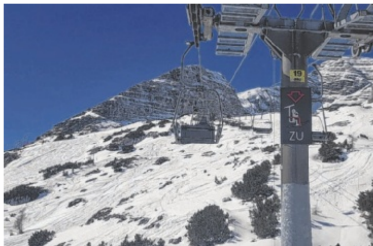
Der Frauenkar-Sessellift wird durch eine Zehner-Kabinenbahn ersetzt.

21,9 Millionen Euro sind für das große Seilbahn-Projekt veranschlagt, dazu wird die Beschneiungsanlage auf der Wurzeralm um 2,6 Millionen Euro erweitert. Ergibt Gesamtkosten von 24,5 Millionen Euro, ein Großteil davon wird mit Steuergeld finanziert. „Seitens des Landes Oberösterreich sollen dafür maximal 16,2 Millionen Euro an Förderungen bereitgestellt werden, um den Ganzjahresbetrieb im alpinen Erlebnisgebiet Wurzeralm wirtschaftlich und ökologisch nachhaltig abzusichern“, erklärt Landeshauptmann Thomas Stelzer (ÖVP).