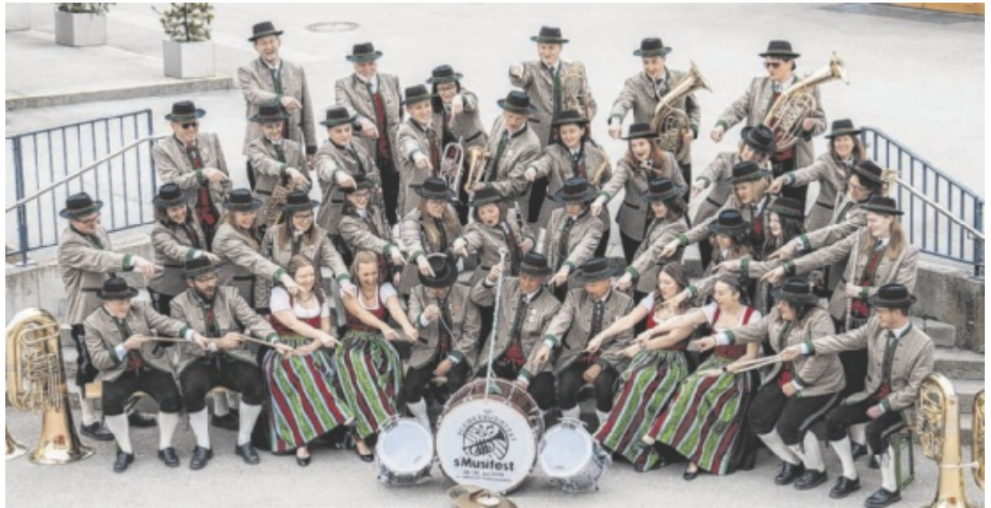
Der Musikverein Inzersdorf-Magdalenaberg posiert bestens gelaunt vor dem Start des Bezirksmusikfestes.

Am Samstag folgt am Vormittag der Landesseniorenwandertag, Teilnehmer aus ganz Oberösterreich erkunden die Landschaft. Danach klingt der Vormittag im Zelt aus. Ab 16 Uhr treten rund 20 Musikkapellen bei der Be-