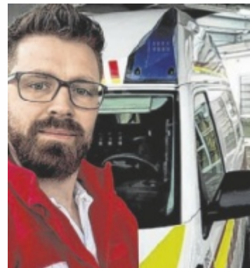
Andreas ist seit mehr als 20 Jahren für das Rote Kreuz im Einsatz.

Nach seinem Zivildienst blieb Andreas dem Roten Kreuz treu und übernahm im Laufe der Jahre zahlreiche Aufgaben. Neben seiner Tätigkeit im Rettungsdienst engagierte er sich als Jugendgruppenbetreuer und vermittelte Kindern und Jugendlichen Erste-Hilfe-Wissen sowie die Werte des Roten Kreuzes. Als Erste-Hilfe-Lehrbeauftragter setzte er sich zudem dafür ein, möglichst vielen Menschen die Angst vor dem Helfen zu nehmen und lebensrettende Maßnahmen praxisnah zu vermitteln. Prägend waren für ihn zahlrei-