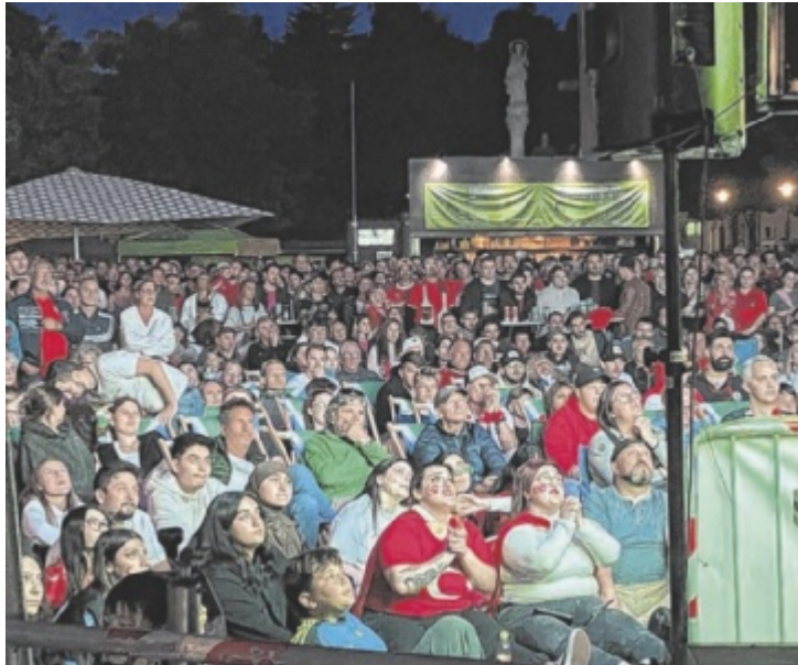
Bei der Euro 2024 waren die Public Viewings am Wieserfeldplatz (Foto) und am Stadtplatz in Steyr bestens besucht.

Österreichs erstes WM-Gruppenspiel gegen Jordanien wurde am Mittwochfrüh (17. Juni) um 6 Uhr angepfiffen, das letzte Gruppenspiel gegen Algerien findet am Sonntag, 28. Juni, um 4 Uhr unserer Zeit statt. Diese Anstoßzeiten sind der Hauptgrund, warum die Stadt Steyr heuer im Gegensatz zur Euro 2024 auf ein Public Viewing verzichtet. Dafür gibt es mehrere kleinere Veran-