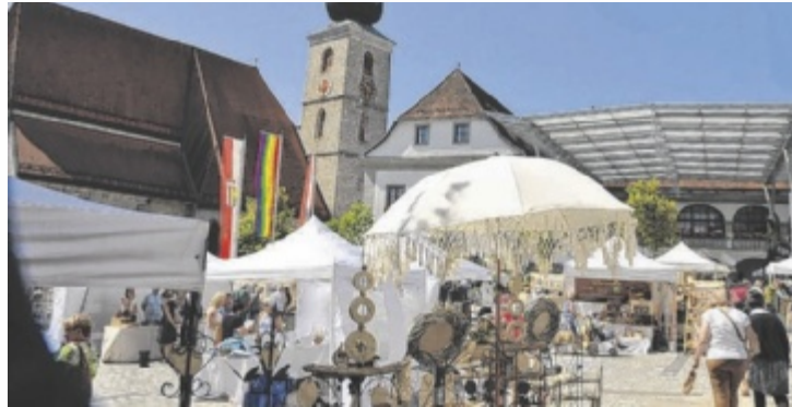
Flanieren am Sommermarkt des Kunsthandwerks in Sierning

Hier trifft das kunstsinnige Publikum auf Kunsthandwerker und Gestalter, die mit Ästhetik und innovativen Designs die Herzen höher schlagen lassen. Über Rundkurse können die Besucher in allen Arealen in ein Meer an visionären und bodenständigen mit den eigenen Händen erzeugten Produkten eintauchen. Vielfalt pur erleben beim Flanieren und Gustieren: Zu finden sind zahlreiche Holzprodukte, tolle Keramik, Mineralien, Schmuck in vielen Varianten, Goldschmiedekunst und vielfältiges Glasdesign. Auch Gefilztes, Gestricktes, Ge-