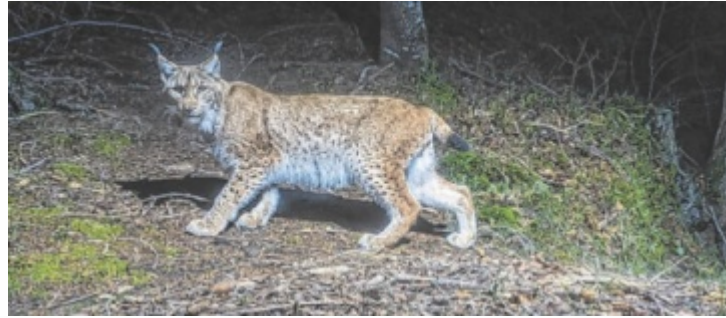
Der Luchs zählt zu den seltensten Säugetieren Österreichs.

Diese soll sich von den Karpaten bis zum Jura-Gebirge und den Westalpen erstrecken, einschließlich des deutschen Mittelgebirges und eines Teils des Dinarischen Gebirges. Der genetische Austausch zwischen den bislang isolierten Beständen ist eine zentrale Voraussetzung für das langfristige Überleben der Art. „Linking Lynx“ gilt dabei als gutes Beispiel für internationale Zusammenarbeit im Artenschutz: Mit dem Nationalpark