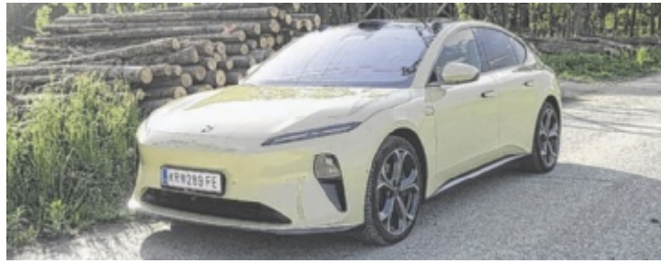
Der Nio ET5 Long Range ist als Basismodell ab 59.990 Euro zu haben.

Auch beim Platzangebot gibt es wenig Grund zur Klage. Selbst