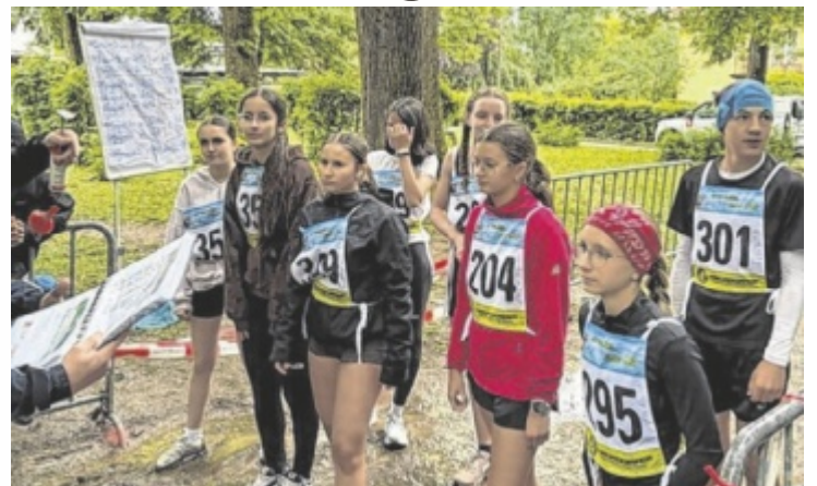
39. Bezirksparklauf in Kirchdorf

KIRCHDORF. Trotz kühler Temperaturen und Regen war der 39. Bezirksparklauf, veranstaltet von der Kreativ-Musikmittelschule Kirchdorf, ein voller Erfolg. Unter dem Motto Laufen für die mentale Gesundheit nahmen 17 Volks- und Mittelschulen wie auch Gymnasien aus dem Bezirk teil. Besonders erfreulich war die hohe Beteiligung, mehr als 340 Läufer erreichten das Ziel. Weitere Infos, Fotos und alle Ergebnisse findet man auf online auf www.ms-kirchdorf.at ■