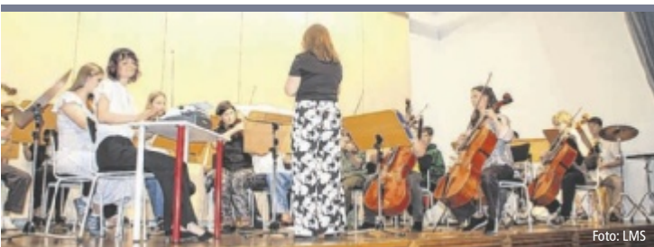
Beste Stimmung Das erste Streicher-Open-Air der Landesmusikschule Kirchdorf musste wegen Regens vom Stadtpark ins Schloss Neupernstein verlegt werden. Der Stimmung tat das keinen Abbruch. Junge Ensembles zeigten ihr Können. Für einen Höhepunkt sorgte das große Kammerorchester mit schwungvollen Stücken. Eindrucksvoll: Menschen von sechs bis 80 Jahren musizierten gemeinsam.