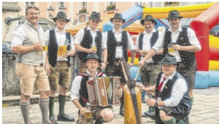
D'Garstnertaler halten die Tradition ums feierliche Maibaumumschneiden in Windischgarsten hoch.

Ein Frühschoppen mit der Trachtenkapelle Emmersdorf aus Niederösterreich beschließt das Festwochenende. ■