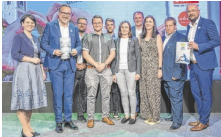
Die Gemeinde Engerwitzdorf durfte sich über den Spezial Award Futura für den bürgernahen Einsatz von KI freuen.

Im Bereich Bürgerservice erleichtert die Online-Terminbuchung „eTermin“ den Zugang zu Gemeindeleistungen. Termine können rund um die Uhr gebucht werden, Wartezeiten werden reduziert und Verwaltungsabläufe besser planbar. Ergänzt wird das