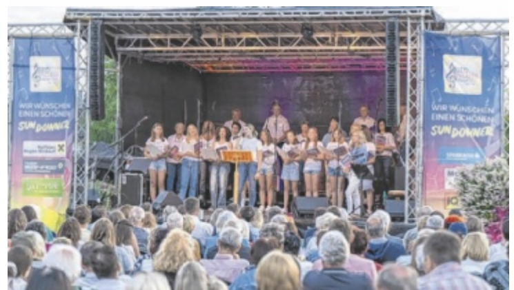
Singkreis Ried singt unter dem Titel „Wenn Musik das Leben feiert“.

den bis zu mitreißenden Liedern präsentiert der Chor in Begleitung von Klavier, Gitarre und Geige. Beginn ist um 20 Uhr auf dem Platz hinter dem Gemeindegarten. Karten: Chormitglieder, Tankstelle Klotz ■