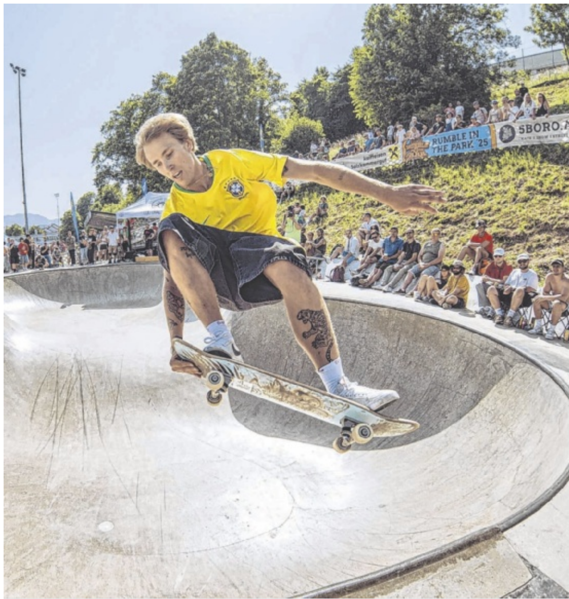
Skateboard-Action Am Samstag, 27. Juni, verwandelt sich der Skatepark Gmunden beim „18. DC Rumble in the Park powered by Raiffeisen Salzkammergut“ wieder in einen Hotspot der Skateboard-Szene. Seite 34