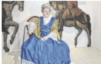
Mitglied des Musealvereins als Maria Theresia

Neu sind auch digitale Kurzvideos, in denen historische Persönlichkeiten wie Kaiser Maxi-