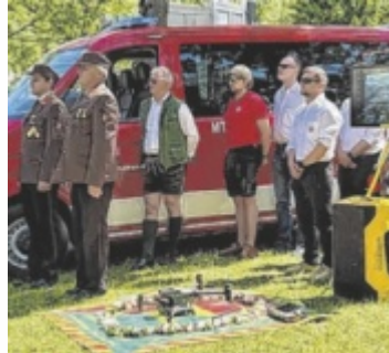
Fahrzeugsegnung und Segnung der neuen Drohne in Roith

Die gemeinsam von Feuerwehr und Bergrettung betriebene Drohne ist mit Wärmebildkamera, Zoomkamera, Scheinwerfer und Lautsprecher ausgestattet. Sie soll künftig insbesondere bei Personensuchen, Bränden und Einsätzen in unwegsamem Gelände Unterstützung leisten.