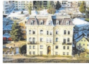
Drohnenaufnahme Villa an der Esplanade vom Jänner 2024

Bereits vor dem Brand war das Gebäude umfassend saniert worden. Nach einem Eigentümerwechsel im Jahr 2017 wurden