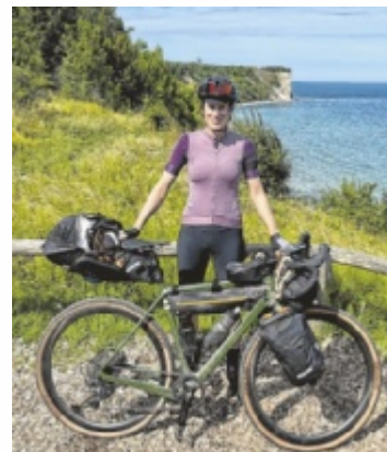
Kap Arkona auf Rügen.