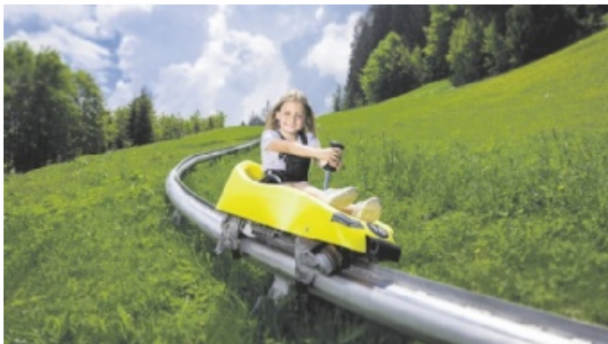
Sommerrodeln am Halleiner Dürrnberg

Sa, 11. Juli & 1. August ESPLANADE: Zeller Seefest.