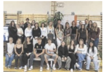
Redewettbewerb