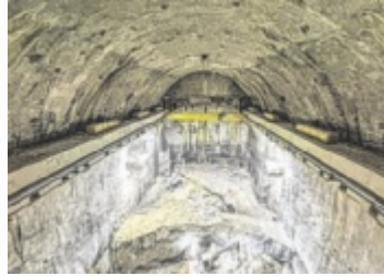
Kaverne ausgebrochen

EBENSEE. In Ebensee ist die unterirdische Kraftwerkskaverne, die so groß wie eine Kirche ist, fertig ausgebrochen. Auch am Oberwasserspeicher laufen die Arbeiten auf Hochtouren.