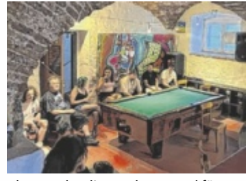
Ideen und Anliegen der Jugend für Bad Ischl.

BAD ISCHL. Bei der Veranstaltung „Erzähl’s uns bei einem Burger“ im YOUZ Bad Ischl nutzten zahlreiche Jugendliche die Gelegenheit, ihre Ideen und Wünsche für die Zukunft der Stadt einzubringen.