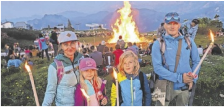
Das Sonnwendfeuer ist ein Erlebnis für die ganze Familie