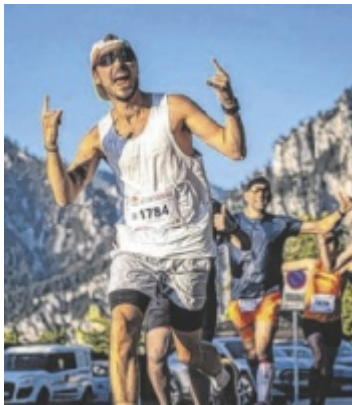
Halbmarathon Mehr als 4.500 Läufer haben sich für die Laufbewerbe am Traunsee angemeldet. Seite 31