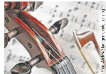
Konzertabend am 24. Juni in Lenzing

Den glanzvollen Auftakt des Abends macht Ludwig van Beethovens charmantes Rondino für Bläseroktett. Das meisterhafte Werk besticht durch seine melodische Eleganz, jugendliche Frische und das fein abgestimmte Zusammenspiel der Instrumente. Es zeigt bereits eindrucksvoll Beethovens besonderes Gespür für dichte Klangfarben im Bereich der klas-