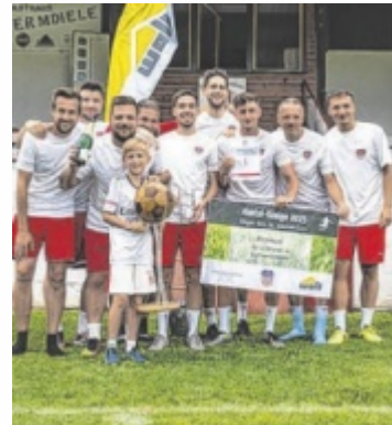
Die Gewinner des Almtalcup im letzten Jahr

Der Almtalcup findet am Samstag, 27. Juni, statt.