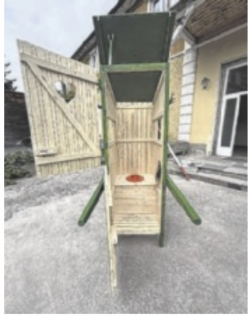
Der gefertigte Thron