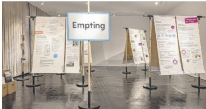
Die Wanderausstellung „Wie geht's, Alter?“ hält in Ebensee

Begleitend dazu werden mehrere Veranstaltungen angeboten, darunter Vorträge, Führungen, eine Exkursion sowie eine Schreibwerkstatt.