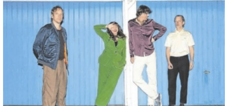
Die Sterne stehen am Freitag beim Jubiläumsfest auf der Bühne.

Ab 18 Uhr wird das Areal rund um das Kino Ebensee am Freitag, 19. Juni, Schauplatz einer gemütlichen Gartenparty und einer kurzen Ansprache. Den musikalischen Auftakt macht am Freitag die Musikerin Maiija. Im Anschluss stehen Die Sterne auf der Bühne.