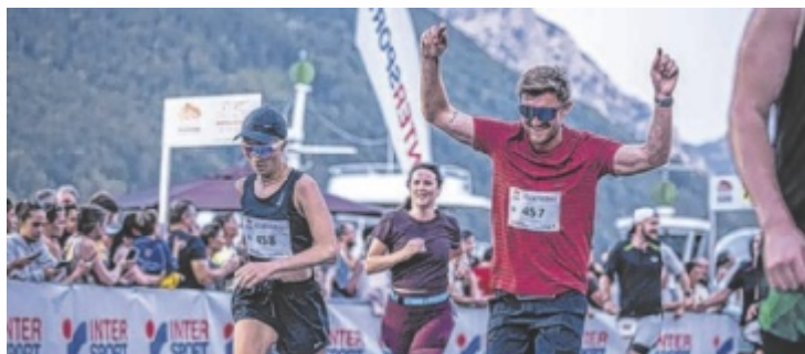
Traunsee Halbmarathon findet am Samstag, 20. Juni, statt.