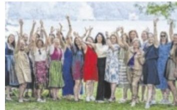
Soroptimist Club Attersee

Ein Vormittag voller Genuss, Musik und guter Taten erwartet Besucher am 21. Juni am Grafengut in Nußdorf. Der SI Club Attersee lädt von 10 bis 14.30 Uhr zu einem Benefiz-Jazzbrunch mit Live-Musik, regionalem Brunchbuffet und Seeblick ein. Für Unterhaltung sorgen außerdem Motorbootfahrten, eine Golf-Funchallenge, eine Tombola, eine Bildversteigerung und ein Kinderprogramm. Der gesamte Spendenerlös fließt in Projekte für Kinderschutz und Gewaltprävention für Frauen im Bezirk