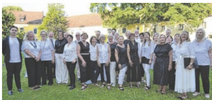
Stadtchor Attnang lädt zum sommerlichen Konzert

dern von Johannes Brahms und Klassikern der Comedian Harmonists. Bei Schönwetter wird der zweite Teil traditionell in den Schlosspark verlegt, wo Volkslieder für sommerliche Stimmung sorgen. Für das leibliche Wohl ist mit Schmankerln und Getränken gesorgt. Karten sind bei den Chormitgliedern, an der Abendkasse sowie unter 0650 630 3101 erhältlich. ■