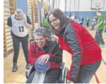
Vorbereitungen laufen

BAD ISCHL/WIEN. Von Donnerstag, 25. Juni, bis Dienstag, 30. Juni, finden in Wien die Special Olympics Sommerspiele statt. Mit dabei sind auch Sportler der Lebenshilfe-Werkstätte Bad Ischl.