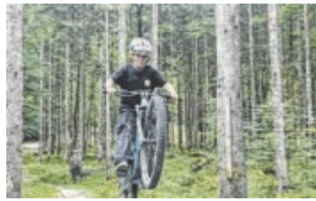
Mountainbiken 2 Bad Goisern

Ein besonderer Höhepunkt des Jubiläums war die Übergabe eines neuen Instruments durch Stadträtin Marija Gavric (SPÖ). Die Stadtgemeinde Bad Ischl unterstützt damit die engagierte Jugendarbeit der Musikkapelle. ■