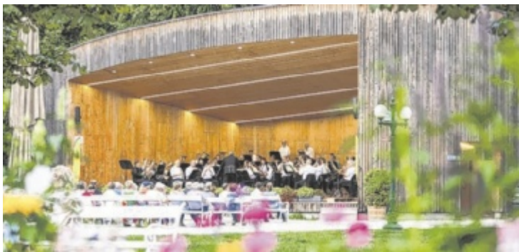
Salinenmusikkapelle lädt zu Konzerten im Musikpavillon.

Weitere Programmpunkte neben Eröffnung und Finissage: Mittwoch, 24. Juni: 9 bis 16 Uhr: Ausstellung geöffnet, Führungen können gebucht werden Freitag, 26. Juni: 12.30 bis 20.30 Uhr: Exkursion nach Kleinzell und St. Stefan-Afiesl zum Thema „Räume für Jung und Alt schaffen – Praxis & Finanzierungen“ (Anmeldung nötig) Montag, 29. Juni: 9.30 bis 17.30 Uhr: Ausstellung geöffnet, Führungen können gebucht werden 18 Uhr: Schreibwerkstatt „Bilder des Alterns“ (Anmeldung nötig) Dienstag, 30. Juni: 13 Uhr: Geführte Wanderung rund um den Offensee (Anmeldung nötig) 17.30 bis 18.30 Uhr: Führung durch die Ausstellung