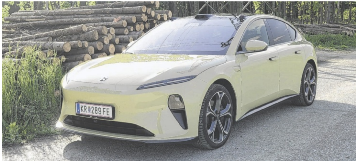
Der Nio ET5 Long Range ist als Basismodell ab 59.990 Euro zu haben.