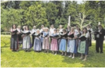
Singgemeinschaft Laakirchen