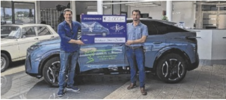
2.000 Euro für den Verein Rollende Engel