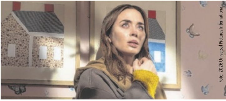
Emily Blunt wird mit einem mysteriösen Ereignis konfrontiert.