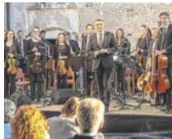
Konzert „Wasserspiele“ im Wasserschloss

Das „Sommernachtskonzert – Best of Musical, Film, Pop und Swing“, gespielt vom Symphonieorchester mit Schülern und Lehrern der Landesmusikschule