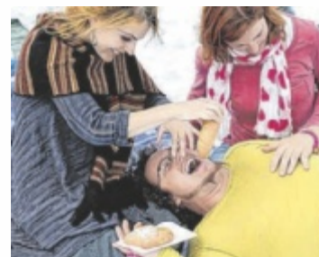
Köstliches Picknick - für einen guten Zweck

Im Mittelpunkt steht das große Familienpicknick: Für 69 Euro erhalten Gäste einen liebevoll gefüllten Picknickkorb für vier Personen mit regionalen Spezialitäten sowie den Eintritt ins Freibad. Ergänzt wird das Programm durch ein Charity-