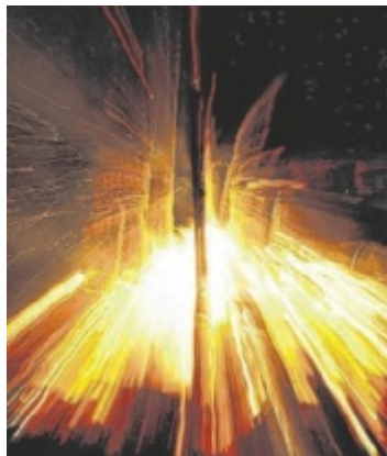
Die künstlerische Feuerinstallation „Brandmal“ ist geplant.

In der Pfarrkirche St. Stephan wartet von 15 bis 18 Uhr der Druckworkshop „Re-Printing History“ auf den Spuren der vergessenen Heldinnen des Bauernkrieges. Das Künstlerinnenkollektiv magggi macht die Ge-