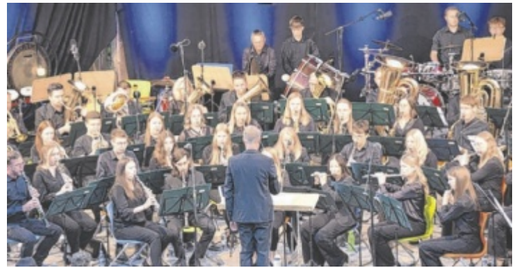
Open Air mit dem Musikverein St. Agatha