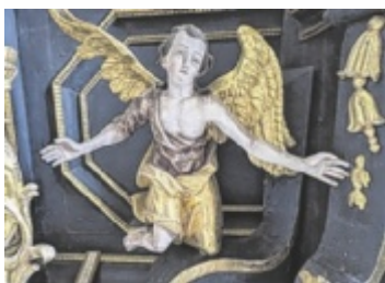
Engel in der Magdalenabergkirche in Bad Schallerbach

schoppen, bei dem „Die Echten“ für die passende musikalische Umrahmung sorgen. Ein besonderer Höhepunkt für alle Fans historischer Fahrzeuge ist das traditionelle Oldtimertreffen. Am Freitag und am Samstag ist der Eintritt bis 21.30 Uhr frei, danach kostet er acht Euro. Der Reinerlös dient der FF Oed in Bergen zur Anschaffung von Geräten und Betriebsausstattung. ■