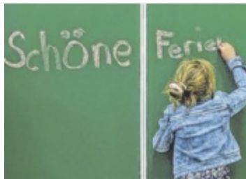
AK verspricht Ferienstpaß

Volksschulkinder erwartet eine Woche lang ein abwechslungsreiches und spannendes Programm voller Spiel, Spaß und Abenteuer. Für Eltern, die nach einer Lösung für die Kinderbetreuung in den langen Sommerferien suchen, ist dies die perfekte Gelegenheit: Jetzt schnell sein und noch einen Platz