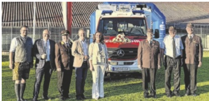
Ehrengäste mit dem neuen Kleinlöschfahrzeug

Mit Anschaffungskosten von rund 225.000 Euro stellt das neue Einsatzfahrzeug eine bedeutende Investition in die Sicherheit der Bevölkerung dar. Ermöglicht wurde die Anschaffung durch die Unterstützung des Landes Oberösterreich, des Landes-Feuerwehrkommandos, des Katastrophenfonds sowie der Marktgemeinde Haag. Das neue Kleinlöschfahrzeug mit Allradantrieb wird künftig bei Brandeinsätzen, technischen Hilfeleistungen und Katastropheneinsätzen wertvolle Dienste leisten. In