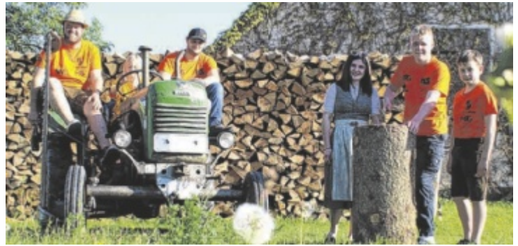
Die FF Oed in Bergen veranstaltet auch heuer das Fest „Oed on Fire“.

Am Festwochenende von Freitag, 12. bis Sonntag, 14. Juni, verwandelt sich das Festgelände in Würting 5, Hartkirchen drei Tage lang in den Nabel der Region. Das Festprogramm vereint Tradition, modernste Technik und ausgelassene Partystimmung: Den Auftakt bildet am Freitag, 12. Juni, ab 18.30 Uhr die feierliche Einweihung des neuen Tanklöschfahrzeugs TLF 2000. Nach dem Festakt übernimmt der Flachgau Express das Kommando auf der Bühne und wird im Festzelt für ordentlich Stimmung sorgen. Am Samstag, 13. Juni, ab 19 Uhr wird es sportlich