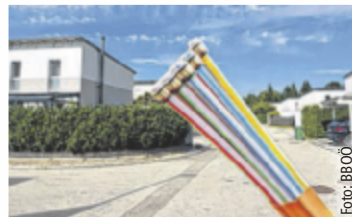
Glasfaser-Ausbau in Eferding/Grieskirchen

Bereits über 22.000 Haushalte haben die Möglichkeit, sich an das Netz der BBOÖ anzuschließen und von stabilen, hochleistungsfähigen Verbindungen zu profitieren. Für rund 1.000 weitere Haushalte sind entsprechende Anschlüsse derzeit in Planung oder bereits in Umsetzung. Aktuell wird in vielen Gemeinden das Glasfasernetz ausgebaut bzw. wird der Ausbau vorbereitet. In Alkoven, Grieskirchen, St. Georgen bei Grieskirchen und Taufkirchen wird die Infrastruktur für ultraschnelles Internet er-