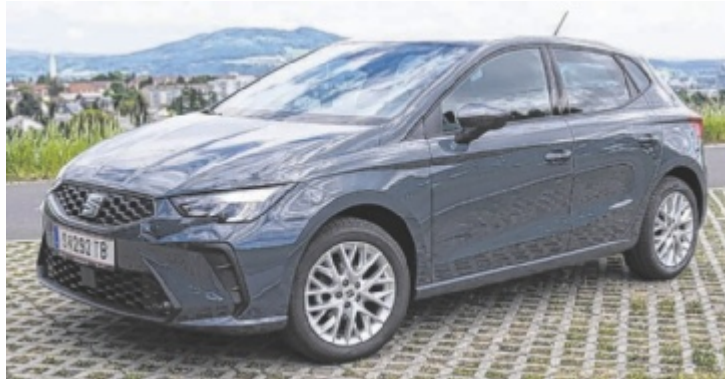
Der Seat Ibiza Style Edition 1.0 TSI

Seat Ibiza also. Fünfte Generation. Facelift. Den kleinen Spanier gibt es schon seit 1984, unter der Fuchtel von VW wurde aus ihm eine Kleinwagenikone, vergleichbar mit einem Corsa, Polo oder Clio. Der Jüngste ist der Spanier freilich nicht mehr, die fünfte Generation geht schon in ihr neuntes Jahr. Spricht für das zeitlose Design, das im Zuge des aktuellen Facelifts via neuem Kühlergrill und flacheren LED-Scheinwerfern nochmal etwas an Charakter dazu gewonnen hat. Neu sind auch diverse Farben und Felgen, der Innenraum wurde modernisiert, die digitalen Features erweitert. Ein