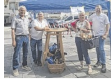
Aktion beim Bauernmarkt

EFERDING/GRIESKIRCHEN. Die zentrale Bedeutung der regionalen Milchwirtschaft für Versorgungssicherheit, Arbeitsplätze und die Kulturlandschaft betonten anlässlich des Weltmilchtages die Freien Bauern und die FPÖ der Bezirke Eferding und Grieskirchen.