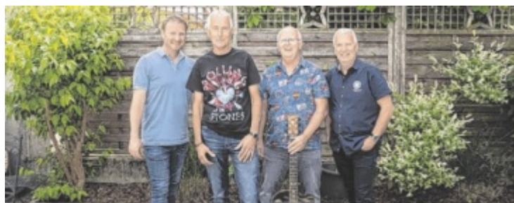
Die Guitar Brothers mit Neffen Roli

Ein Lesekabarett mit dem Titel „Ein Leben voller Lachen“ von Katharina Grabner-Hayden findet am Freitag, 12. Juni, um 19.30 Uhr im Pfarrhof Pollham im offenen Anbau statt. Musikalisch umrahmt wird es von Lukas Ferchhumer. Bei Schlechtwetter wird das Kabarett in der Kirche aufgeführt. Anmeldungen sind unter kfb-pollham@gmx.at erwünscht. Der Eintritt ist frei. Am Freitag, 3. Juli, findet von 9 bis 16 Uhr der alljährliche Flohmarkt vor der Bibliothek Grieskirchen statt.