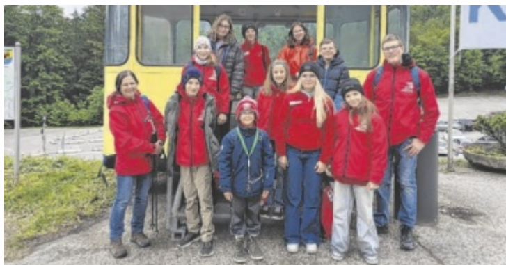
Bezirksjugendlager in Obertraun

Mit zwei Dienstfahrzeugen machten sich zehn Kinder und Jugendliche gemeinsam mit drei Betreuern und viel Abenteuerlust und guter Laune im Gepäck auf den Weg ins Salzkammergut. Dort erwartete die Gruppe ein buntes Programm voller Spiel, Kreativität und gemeinsamer Erlebnisse. Besonders die Ausflüge auf den Dachstein mit den beeindruckenden Eishöhlen sowie in die Salzwelten Altaussee sorgten für große Begeisterung.