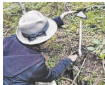
Ein Schopftintling

Freitag, 19. Juni Sporthalle MS/MMS, Andorf 19 Uhr / Freiwillige Spende