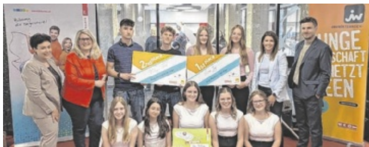
Die Teams „Pure Joy“ und „Vintage Town“ waren erfolgreich.

Sehr erfolgreich verlief der Wettbewerb in der Kategorie „Idea Challenge“: Das Team „Dyslexia“ setzte sich hier gegen die Konkurrenz durch und holte den ersten Platz nach Schärding. In der Kategorie „Real Market Challenge“ zeigte die HAK Schärding ihre Stärke gleich mit zwei Podestplätzen. Das Projekt „Pure Joy“ wurde zum Sieger gekürt,