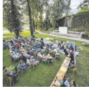
Kino unter freiem Himmel

Darin versucht Jan Josef Liefers als Heinz Hellmich bei einem politisch korrekten Dinner mit der Zeit zu gehen – Chaos ist vorprogrammiert. Am Mittwoch, 22. Juli, folgt die französische Tragikomödie „Die leisen und die großen Töne“. Veranstaltet wird das Sommerkino von der Stadtbibliothek Schärding sowie den Vereinen Fair leben & handeln, Vielfalter und kuli. Einlass ist jeweils ab 20 Uhr, der Film startet gegen 20.30 Uhr. Snacks und Getränke werden vom Verein Fair leben angeboten. Ei-