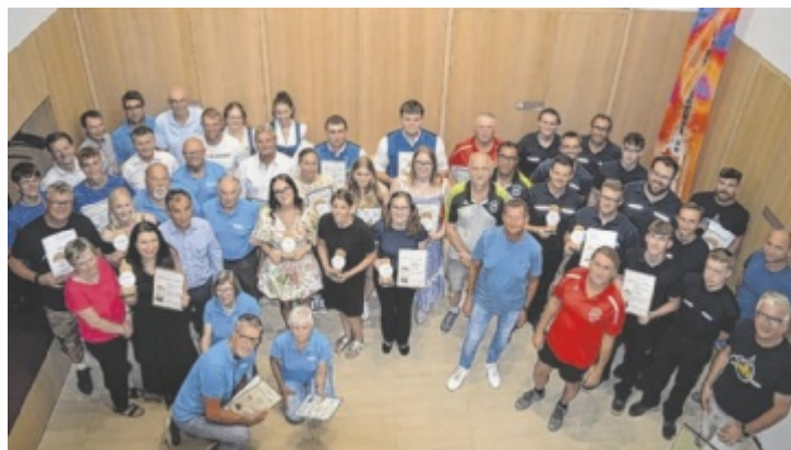
Die Preisträger des St. Marienkirchner Awards

Insgesamt wurden 21 Einzelpersonen sowie sechs Mannschaften aus verschiedensten Disziplinen