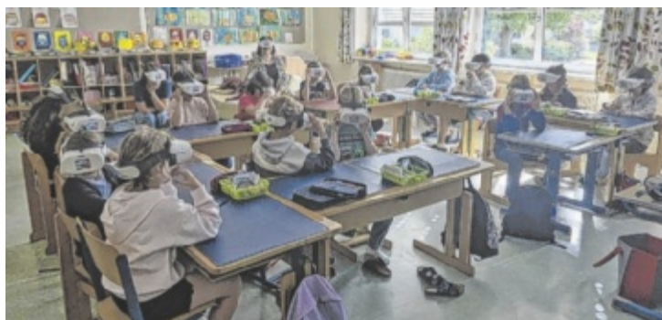
Der „Tauchgang“ vermittelte Botschaften zum Schutz des Wassers.

ten. Mithilfe von Virtual-Reality-Brillen verfolgten sie den Weg eines Baches bis hin zum Meer und erlebten dabei eindrucksvoll die Auswirkungen von Umweltverschmutzung auf Gewässer und ihre Bewohner. Die virtuelle Expedition führte durch klare Gewässer sowie durch verschmutzte Lebensräume, vorbei