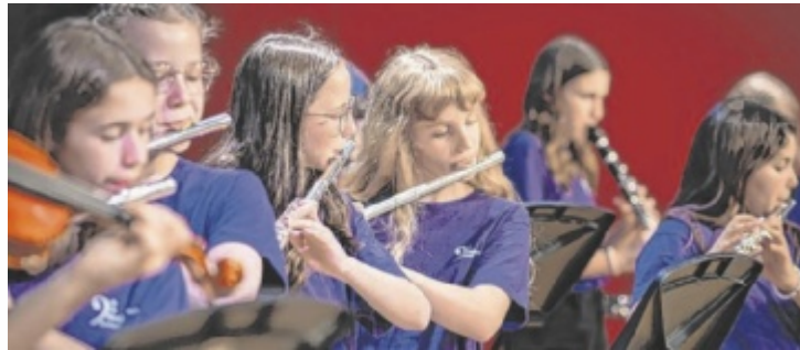
Das Bühnenprogramm steht unter dem Motto „Time Travel“.

Von Pop und Rock über Percussion und Tanz bis hin zur Volksmusik zeigen die jungen Talente, was sie in vier Jahren mit dem