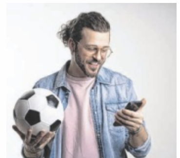
Ab sofort anmelden, Tipp abgeben und tolle Preise ergattern.

Beim kostenlosen WM-Tippspiel auf www.tips.at können Fußballfans ihre Prognosen zu den Spielen der Fußball-WM abgeben. Getippt werden kann jeweils bis 30 Minuten vor Anpfiff. Für einen exakt vorhergesagten Endstand gibt es vier Punkte, für den richtigen Spiel Ausgang – Sieg, Niederlage oder Unentschieden – zwei Punkte. Die Gesamtzahl der gesammelten Punkte entscheidet über die Platzierung in der Rangliste. Auf