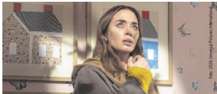
Emily Blunt wird mit einem mysteriösen Ereignis konfrontiert.

Ungünstig: Unkraut jäten; Wäsche waschen; Mineraldünger ausbringen; körperliche Anstrengungen