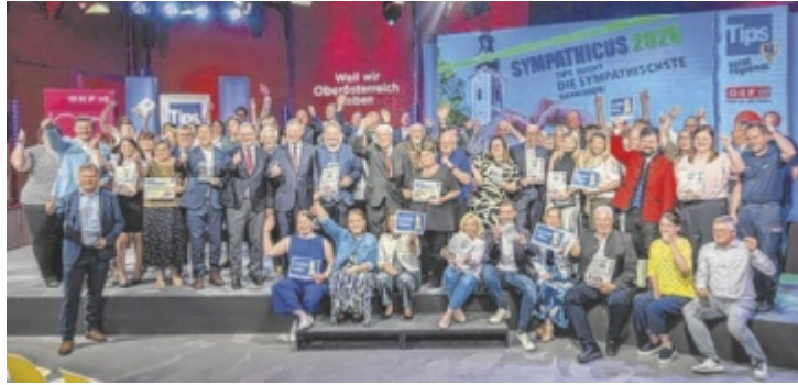
Das sind die diesjährigen Gewinner des Tips-Sympathicus 2026.

Mit 73 Gemeinden aus ganz Oberösterreich ging die 20. Auflage der beliebten Tips-Leseraktion „Sympathicus“, gemeinsam mit dem Land OÖ, Sparkasse OÖ, ORF OÖ, Brau Union und Spar über die Bühne. In der Kategorie bis 1.500 Einwohner setzte sich Polling im Innkreis gegen die Konkurrenz durch. Den Sieg unter den nächstgrößeren Gemeinden holte sich Niederwaldkirchen. Bei Gemeinden über 3.000 Einwohnern ging der erste Platz an die Bezirkshauptstadt