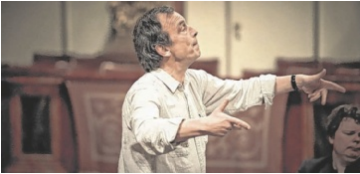
Lars Ulrik Mortensen ist mit Concerto Copenhagen in Brunnenthal zu Gast.