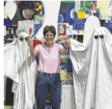
Auch zwei Schulgespenster kamen zur Jubiläumsfeier.

verschiedenen Quiz-, Sport- und Kreativaufgaben. Mit großem Einsatz meisterten die Schüler alle Herausforderungen und konnten schließlich den geheimnisvollen Brief vollständig entschlüsseln. Zum Abschluss versammel-