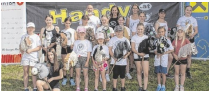
Die Teilnehmerinnen des Turniers in St. Florian