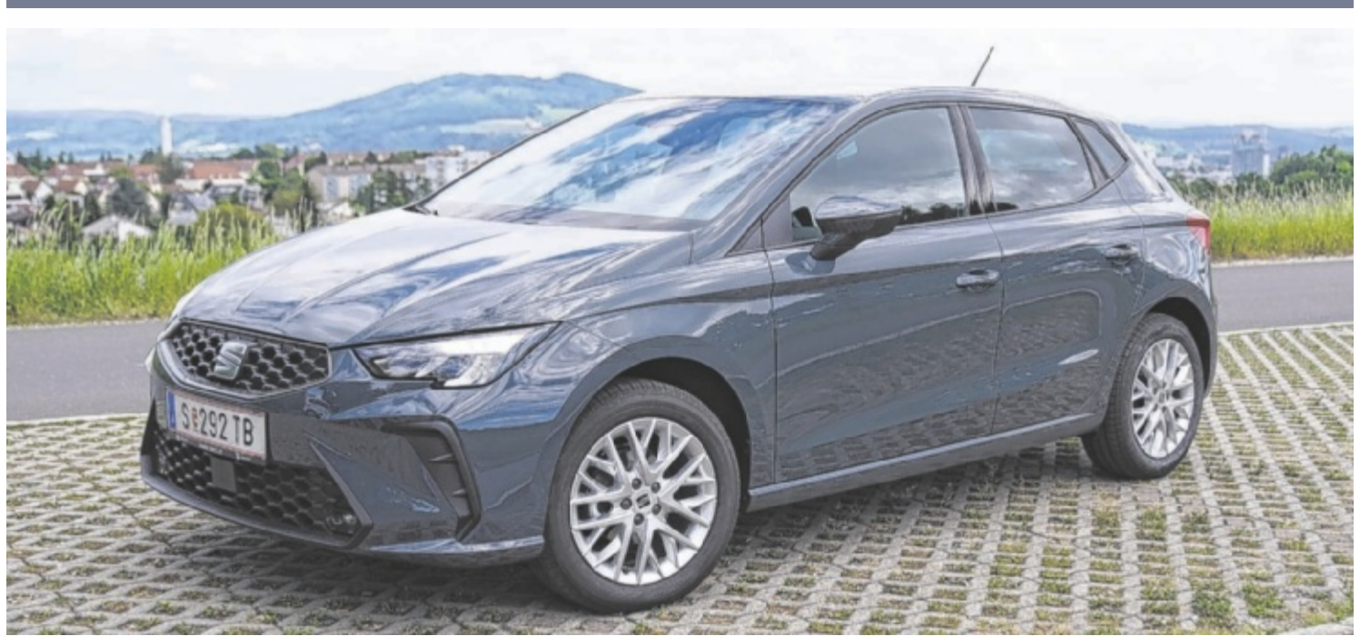
Der Seat Ibiza Style Edition 1.0 TSI ist als Basismodell ab 17.490 Euro zu haben.