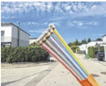
Der Glasfaserausbau im Bezirk Schärding schreitet voran.

ePaper, Gewinnspiele und vieles mehr auf www.tips.at