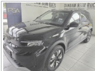
Opel Frontera GS 110 Aut. BJ: 01/2026, 1.600 km 2x Schwarz, Silber