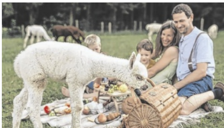
Auf der Plattform ist etwa der Stablhof.

INNVIERTEL. Mit dem neuen Projekt „Kulinarikreisen“ soll das Inn- und Hausruckviertel auf besondere Weise erlebbar werden. Die digitale Plattform bringt Besucher direkt zu regionalen Produzenten, landwirtschaftlichen Betrieben, Lebensmittelmanufakturen und Handwerksbetrieben – also dorthin, wo regionale Spezialitäten entstehen.