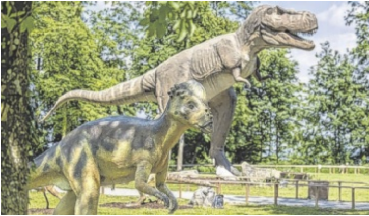
Auf die Besucher warten hautnahe Dino-Momente.