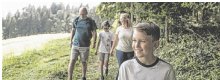
Vom Kobernaußerwald bis zum Europareservat bietet die Bewegungsarena Innviertel ein umfassendes Netz an Wanderwegen, Lauf- und Nordic-Walking-Strecken.

Die Bewegungs-Arena punktet auch mit Barrierefreiheit: Rund 300 Kilometer der Wege sind kinderwagentauglich, etwa 100 Kilometer sogar rollstuhlgerecht. Diese Informationen sind ebenfalls in der Karte vermerkt. Zudem laden 30 Relaxliegen aus regionaler Weißtanne an ausgewählten Plätzen zur Erholung ein.