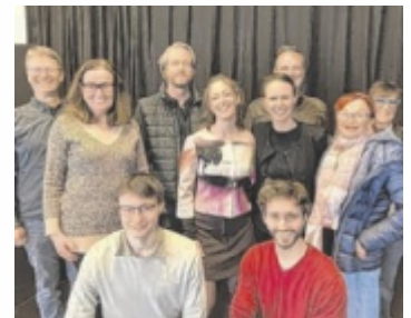
Das Bühnensembel

Die Pramtaler Sommeroperette will den Besuchern dieses Jahr einen Sommerabend voller Glanz, Musik und britischen Humor bieten. Das weltberühmte Musical „My Fair Lady“ wird dabei neu inszeniert und bietet so manche Überraschung. In dem Stück wird die Geschichte der Blumenverkäuferin Eliza Doolittle erzählt, die der exzentrische Professor Higgins zu einer feinen Dame machen möchte. „Tauchen Sie ein in die glanzvolle Welt des Londoner Gesell-