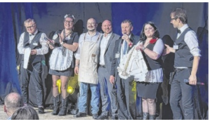
Das Menütheater umrahmte den Abend.