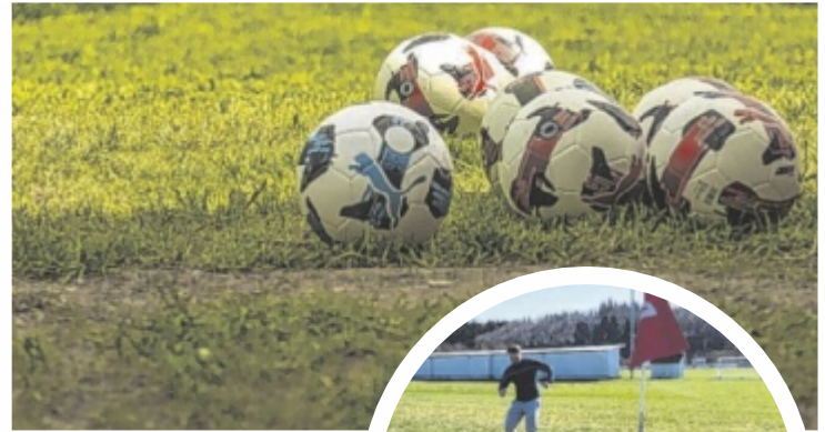
Bei Schönwetter also einfach in die Sportklamotten hüpfen und schon geht es zum Soccergolf nach Handenberg.

Die Soccergolfanlage ist bei Schönwetter von Dienstag bis Sonntag geöffnet – während der Sommerferien jeweils von 10 bis 20 Uhr. Weitere Infos unter: www.soccergolf-innviertel.at