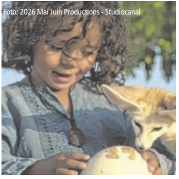
Hadara und der Wüstenfuchs