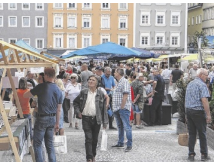
Der Genussmarkt ist ein Besuchermagnet.