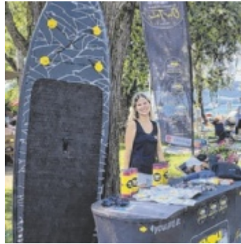
Teil der 4youCard-Sommertour ist ein Stand-up-Paddle-Set als Hauptgewinn

Mit im Gepäck sind jede Menge Action, spannende Mitmachangebote und ein attraktives Sommer-Gewinnspiel. An jedem Tour-Stopp haben Jugendliche die Chance auf tolle Preise – allen voran ein exklusives Stand-up-Paddle-Set im Wert von 800 Euro. Darüber hinaus warten viele weitere coole Gewinne auf die Teilnehmer. Die Tour macht unter anderem Station bei den beliebten Bubble Days im Linzer Hafen von 29. bis 30. Mai, beim Woodstock der Blasmusik in Ort im Innkreis am 5. Juli sowie beim Krone Fest in Linz von 21. bis 23. August. Damit ist die 4youCard bei einigen der größten Events des Sommers vertreten.