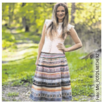
Leichtigkeit trifft Tradition

EDT. Die aktuellen Sommer-trends der Trachten Wichtlstube aus Edt bei Lambach verbinden traditionelle Schnitte mit modernen Stoffen und frischen Farben.