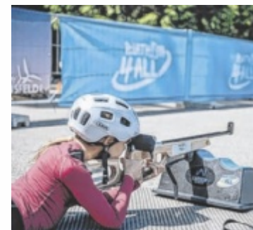
Laserschießen anlässlich des internationalen Biathlon-Tags

Dabei will der ASVÖ SC Höhnhart die aufstrebende Biathlon-Sparte präsentieren und dafür lässt man sich einiges einfallen. „Wir werden einen Lasergewehr-Stand aufbauen, bei dem sich jeder versuchen kann. Zudem gibt es Vorführungen der Langläufer des Oberösterreichischen Landesskiverbands und des Höhnharter Biathlon-Nachwuchses“, so Gerold Sattler, Obmann des SC Höhnhart.