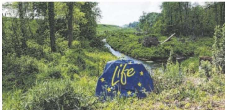
Die Fischwanderhilfe Eggfing-Obernberg ist Teil des EU-Life Projekts „Riverscape Lower Inn“.

Die von Gewässerökologen und Wasserbauern geplante Fisch-