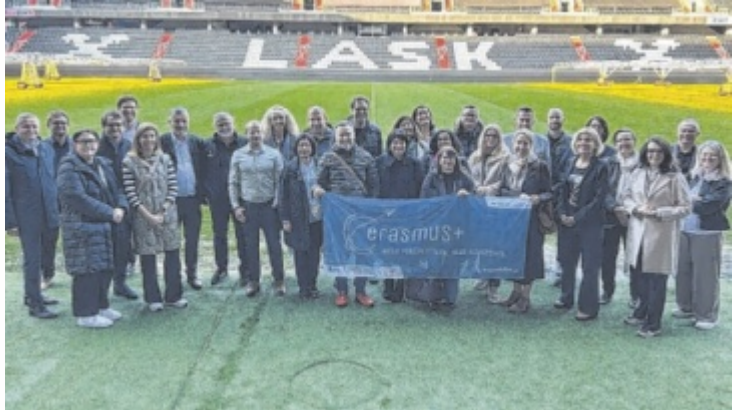
Die erfolgreiche Entwicklung der Initiative wurde in der Raiffeisen Arena Linz gemeinsam mit den Erasmus+ Verantwortlichen aller 22 Berufsschulen gewürdigt und gefeiert.

Die Teilnahme am Programm Erasmus+ Berufsbildung war für Lehrlinge und Lehrkräfte an Berufsschulen über längere Zeit hinweg nur eingeschränkt möglich. Für die duale Ausbildung brauchte es zunächst veränderte Rahmenbedingungen sowie eine gezielte Initiative, um neue Perspektiven zu eröffnen.