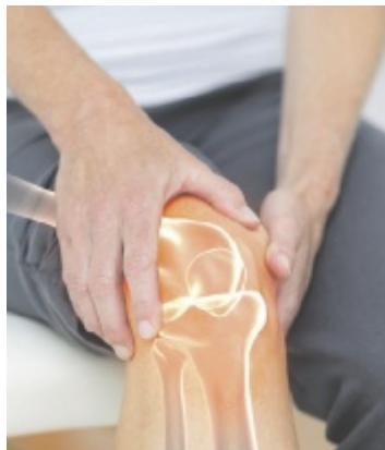
Knieschmerzen sind die häufigsten Gelenkschmerzen.

Doch was macht Rubaxx Plus so besonders? Die Arznei-