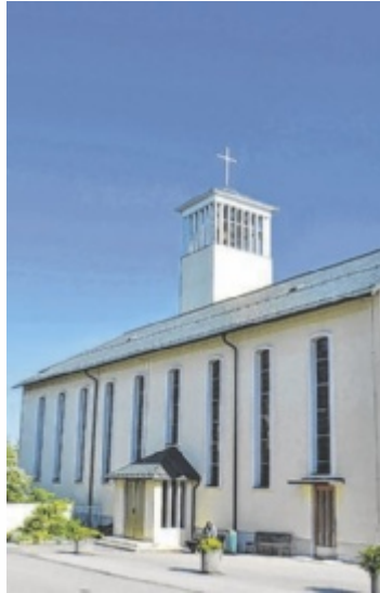
Die Renovierung der Riedbergkirche ist abgeschlossen.

Vor 70 Jahren entstand am Stadtrand von Ried ein neues Stadtviertel, der Riedberg. Der damalige Stadtpfarrer Dechant Kanonikus Franz Riepl hatte den Weitblick, für diesen neuen Stadtteil eine Kirche zu errichten. Die Planung und der Bau lagen in den Händen der Baufirma Fellner. Im September 1956 wurde die neue Kirche von Bischof Franz Zauner eingeweiht. In den nachfolgenden Jahren wurde die Kirche komplettiert, 1958 mit den Glocken und 1969 mit der Orgel. 1966 wurde der Riedberg dann auch eine selbstständige Pfarre. Diese wurde an-