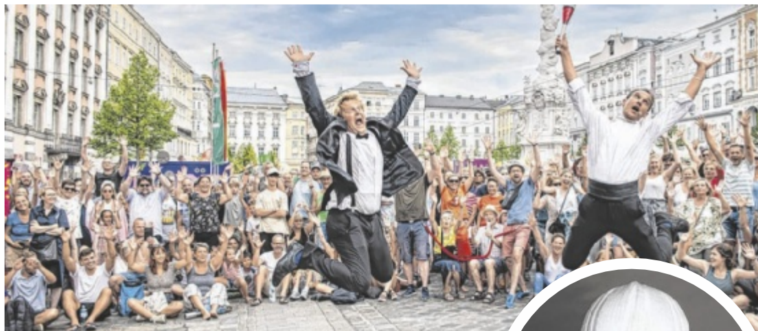
Das Pflasterspektakel macht Linz zur Bühne (oben). DJ Ötzi begeistert seine Fans am Domplatz.

Mehr Infos zu Ausflug und Urlaub in Oberösterreich gibt's auf www.ausflugstipps.at und www.oberoesterreich.at .