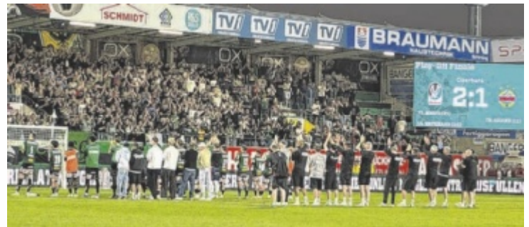
Die letzte Feier vor der Westtribüne

Als Aufsteiger wurde die SVR in der Abschlusstabelle Siebter und setzte sich in der unteren Playoff-Gruppe souverän durch. Dazu kamen die Bonus-Erfolge: Die SV Ried erreichte das Cup-