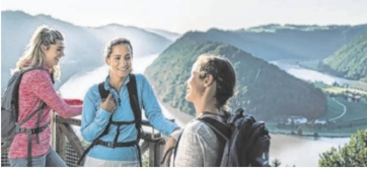
Purer Genuss in der Natur