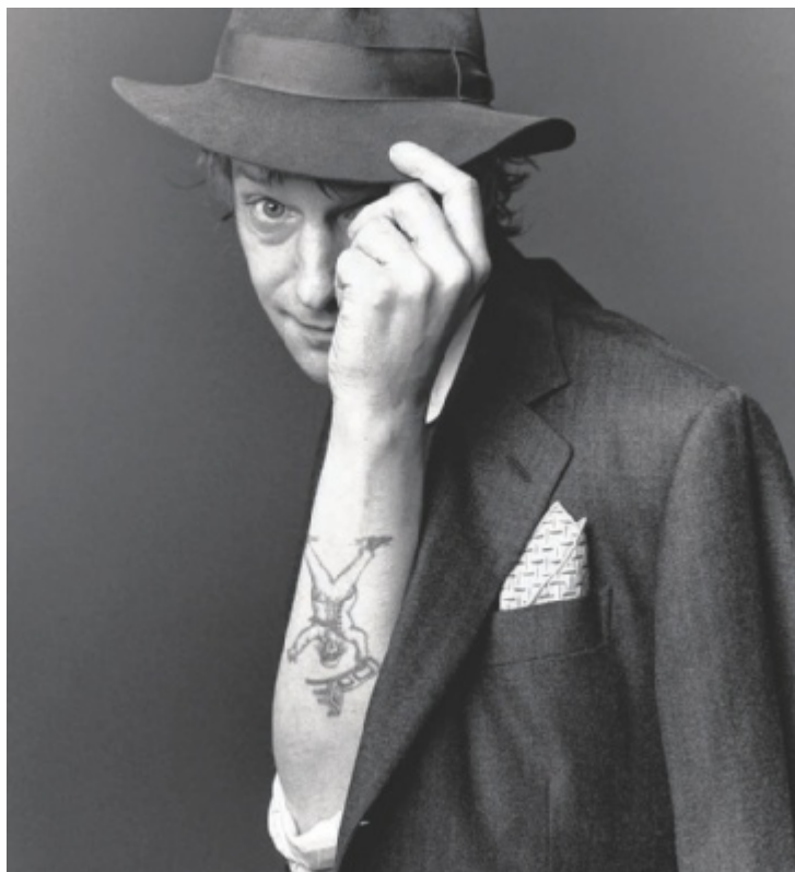
Voodoo Jürgens präsentiert sein neues Album „Gschnas“.