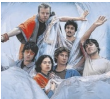
Buntspecht beenden das diesjährige Open Air.

Kulinarisch bleibt das Niveau gewohnt gut: Die Besucher werden dieses Mal von KuhB:K mit handgemachter Qualität aus regionalen Zutaten verköstigt – von Pulled Beef Burgern bis vegan.