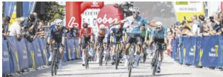
Zieleinfahrt in Ried 2025

Vom Donnerstag, 4., bis Sonntag, 7. Juni, werden rund 150 Radprofis aus über 20 Nationen in 25 Teams um den Sieg im Land ob der Enns fahren. Die Rundfahrt führt über 516,5 Kilometer und 7.112 Höhenmeter durch alle Landesteile. Die viertägige Rundfahrt ist neben der Tour of Austria die einzige Radrundfahrt in Österreich. Die „Innviertel-Etappe“ über 186,9 Kilometer und 2.070 Höhen-