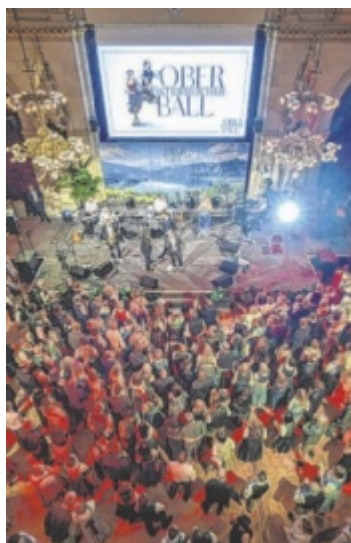
Oberösterreich Ball im Wiener Rathaus.

Der Oberösterreich Ball verspricht wieder eine Nacht voller Tanz, Musik und kulinarischer Genüsse im prunkvollen Ambiente. Mit dabei sind unter anderem die Poxrucker Sisters, zur Eröffnung wartet ein Falco-Tribute, das ptArt Orchester, die Polizeimusik OÖ, die MMK Haag am Hausruck, 2:tag:bart und viele, viele weitere Acts sorgen für Stimmung. Zum mittlerweile 122. Mal findet der Oberösterreich Ball in Wien statt. Neben kultureller Vielfalt werden regionale Spezialitäten in Wien präsentiert. Alle Infos und Karten: oberoesterreicherball.at ■