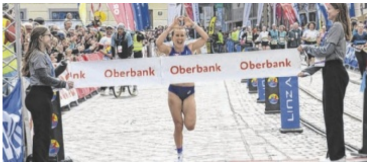
Euphorie an der Ziellinie beim Oberbank Linz Donau Marathon

Alle Etappen werden live auf ORF Sport+ und k19.at übertragen. ■