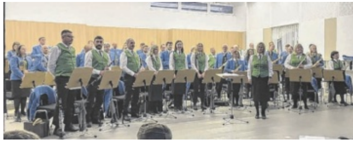
Der MV Hohenzell bei einem Konzert in seinem Musikheim

Ganz ohne Tanzschein, dafür mit viel Lebensfreude, stehen Tanzen, Gemeinschaft und Solidarität im Mittelpunkt. Für die passende Stimmung sorgt ein DJ mit Disco, Schlagern und modernen Beats. Der Reinerlös der Veranstaltung kommt Frauen zugute, die Unterstützung benötigen und schwierige Lebenssituationen bewältigen müssen. „Es geht darum, gemeinsam Spaß zu haben und gleichzeitig Herz zu zeigen“, betonen die Veranstalterinnen. ■