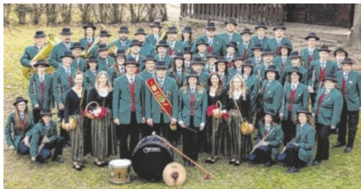
Der Musikverein Naarn lädt von Freitag, 5. Juni, bis Sonntag, 7. Juni, zum dreitägigen Zeltfest mit Bezirksmusikfest als Höhepunkt.

Bereits am Freitag startet das Festwochenende mit einem stimmungsvollen Auftaktabend im Festzelt. Ab 20 Uhr sorgt die Band Voixkrawäu für beste Unterhaltung und Partystimmung. Zusätzlich kosten bis 23 Uhr alle Getränke nur 3 Euro. Für größere Busgruppen werden vergünstigte Tickets angeboten.