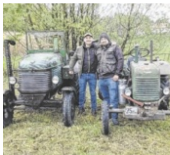
Von Motorrad bis Traktor