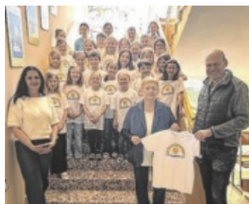
Frischer Look für den Schulchor.