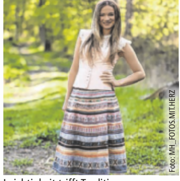
Leichtigkeit trifft Tradition

Im Mittelpunkt stehen Dirndl aus luftigen Materialien wie Baumwolle, Leinen und Viskose, die nicht nur angenehm zu tragen sind, sondern auch eine natürliche Eleganz ausstrahlen. Besonders gefragt sind handbedruckte Seidenschürzen, die jedem Dirndl eine individuelle Note verleihen. Zarte Pastelltöne dominieren die Farbpalette und verleihen den klassischen Silhouetten eine sommerliche Note. Feine Stickereien, verspielte Borten und liebevolle Details sorgen dabei für den unverwechselbaren Trachtencharakter. Auch bei den Schnitten zeigt sich die Tracht vielseitig. Dirndlblusen mit feinen Details oder zarten Puffärmeln sorgen für ein luftiges