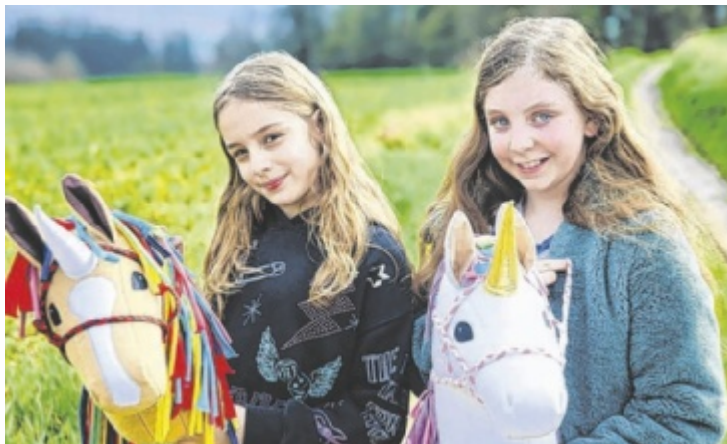
Die Stadt Perg lädt am Samstag, 13. Juni, zum Einhornfest.