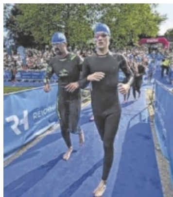
Keltenman Der Badeseer in Mitterkirchen wird am Samstag, 30. Mai, erneut zum Treffpunkt der Triathlon-Szene. Seite 32