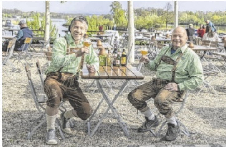
Die beiden Donauständler beim Genuss eines Miraculix

Kulinarisch setzt das donAu-Stand'l 2026 verstärkt auf regionale Spezialitäten, gemütliche Grillabende und moderne Genussküche. Besonders beliebt sind die wöchentlichen Kulinarik-Highlights: Beim Fischgrillen am Freitag kommen Steckerlfisch-Liebhaber voll auf ihre Kosten.