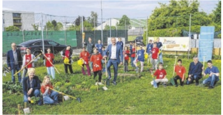
Mit erdverschmierten Händen, neugierigen Blicken und sichtbar viel Freude wird an der Volksschule Perg gegartelt.