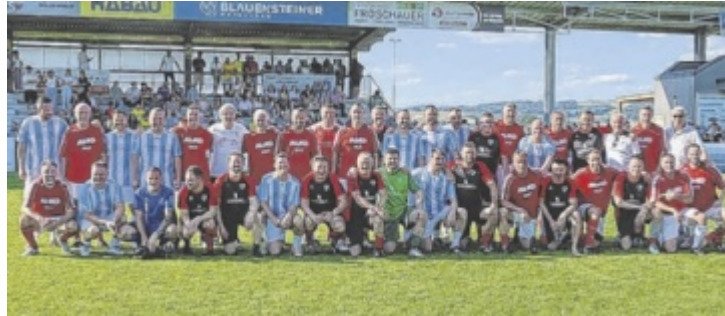
Das Team Copa Pele bezwang die Naarner Oldstars mit 2:1.

Gespielt wurde in drei Dritteln zu je 25 Minuten. Die ehemaligen Profis und Nationalspieler zeig-