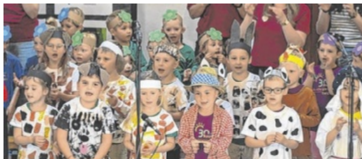
„Valerie und die Gute-Nacht-Schaukel“ begeisterte beim Festakt.