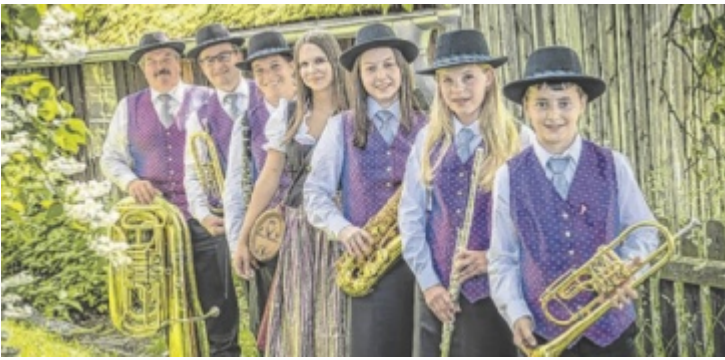
Musikalischer Fronleichnamsabend in Pabneukirchen.