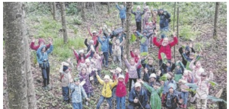
Die Volksschüler verbrachten einen Schultag im Wald.