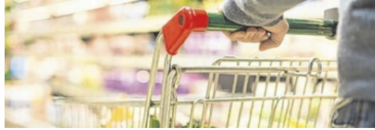
Chance für selbstständige Kaufleute in Schwertberg.

Mehrere namhafte Handelsketten, darunter Rewe, Spar und Norma, haben bereits Interesse am Unimarkt-Standort in Schwertberg bekundet, heißt es seitens der Gemeinde. Die zukünftigen Betreiber können frei wählen, mit welchem Konzernpartner die Zusammenarbeit erfolgen soll.