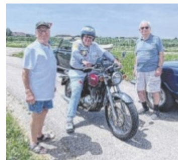
Oldtimer-Leidenschaft mal drei