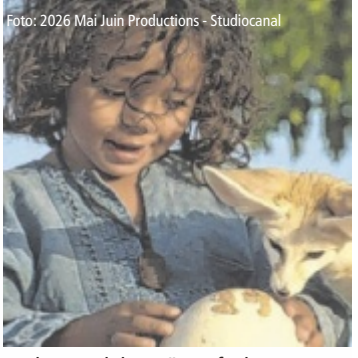
Hadara und der Wüstenfuchs