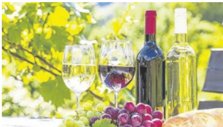
Die Pfarre lädt zum Wein- und Familienfest.

Winzer aus Oberösterreich, Niederösterreich, dem Burgenland und der Steiermark präsentieren ihre edlen Tropfen beim Weinfest in St. Georgen an der Gusen. Es kommen aber auch Nicht-Weintrinker auf ihre Kosten. Für Genussmomente sorgen zudem Schmankerl wie Speck-, Brat- und Schmalzbrot sowie Käse und