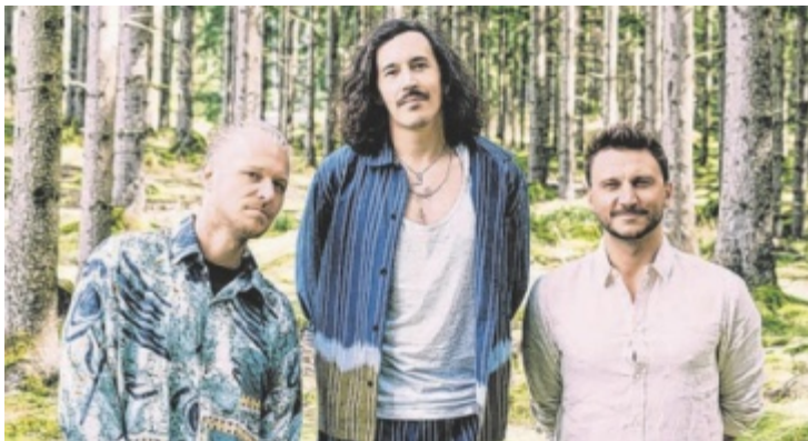
Headliner ist dieses Mal die Erfolgsband „folkshilfe“.