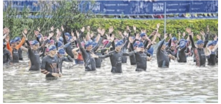
Sportliches Großereignis am Badensee Mitterkirchen.

Neben Einzelstärkern gehen auch Staffeln an den Start. Gewertet werden Männer-, Frauen- und Mixed-Staffeln.