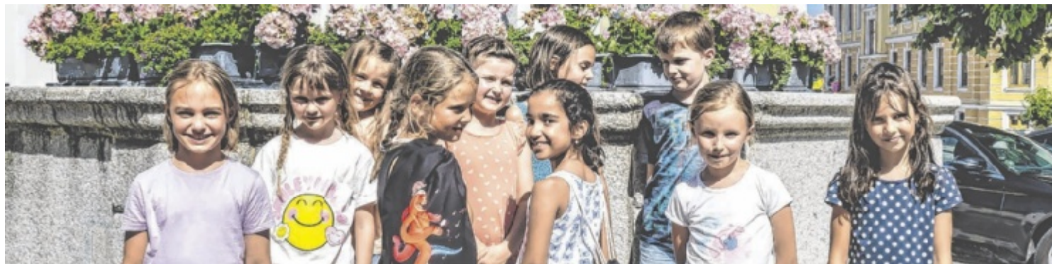
Als Belohnung für drei absolvierte Touren gibt es für fleißige Erkunder einen Bruckner-Detektiv-Sportbeutel