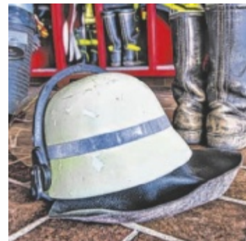
Vereine erleben

Ob Sport, Musik, Brauchtum oder Einsatzorganisationen – für jeden Geschmack ist etwas passendes dabei. Ziel der Veranstaltung ist es, Menschen aller Altersgruppen zusammenzubringen und das ehrenamtliche Engagement in der Gemeinde sichtbar zu machen. Der Eintritt zum