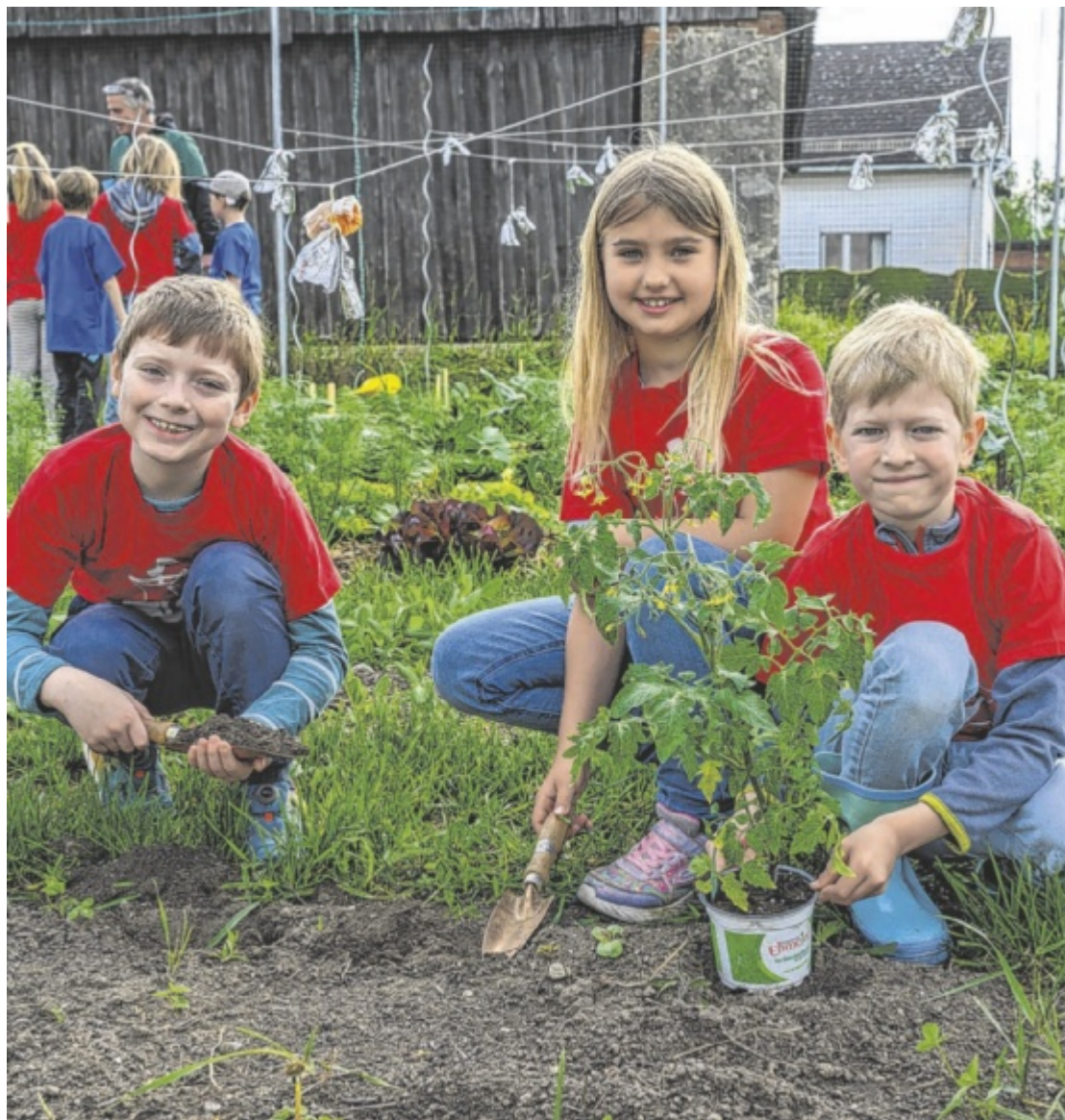
Junge Gärtner Die Kinder der Volksschule Perg erleben auf ihrem neuen Schulacker, wie aus Saatgut Lebensmittel entstehen. Spielerisch schärfen sie beim Garteln ihr Bewusstsein für Natur und Nachhaltigkeit. Seite 16