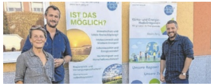
Der Umweltausschuss der Gemeinde Schwertberg lädt zum Vortrag.

Perg: Sozialberatungsstelle ☎ 0664 8234508