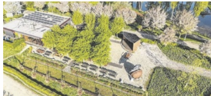
Das donAu-Stand'l in Au an der Donau mit Donaublick