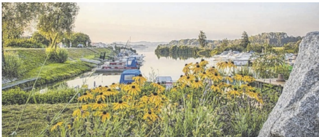
Der Hafen in Au an der Donau in Naarn beeindruckt mit seinem idyllischen Ambiente.