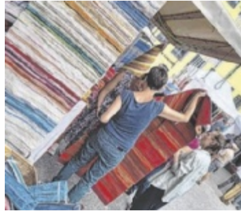
Bunt wird es wieder am Haslacher Webermarkt.

Ergänzend öffnet auch die Faserzone, eine Fachmesse für Garne, Materialien und Zubehör, ihre