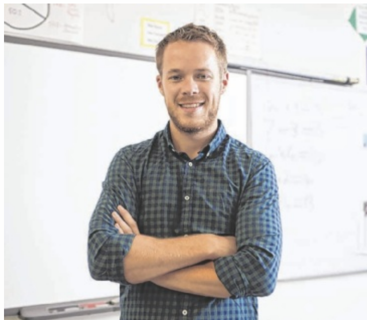
Bis 30. Juli anmelden!

Studierende, die bereits im Wintersemester 2025/26 oder früher mit dem Lehramtsstudium begonnen haben, können in das neue Curriculum wechseln. Durch eigens abgestimmte Äquivalenzregelungen und begleitende Beratung wurde dabei besonders darauf geachtet, einen möglichst nahtlosen und verlustfreien Umstieg in das verkürzte Studienmodell zu ermöglichen. Weitere Informationen zum Studium und Anmeldung (bis 30. Juli) online unter www.lehrerin-werden.at ■