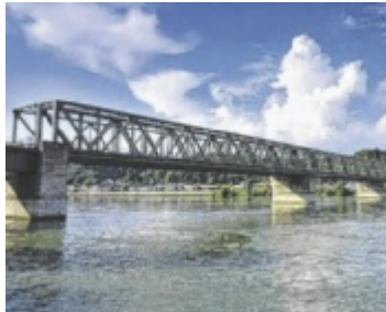
Donaubrücke Mauthausen

Ein besonderer Schwerpunkt liegt auf der Verbesserung des öffentlichen Verkehrs. Geplant ist eine Taktverdichtung im Schienenverkehr, insbesondere zu den Stoßzeiten. Konkret bedeutet dies einen Halbstundentakt auf der Donauuferbahn zwischen den Bahnhöfen St. Valen-