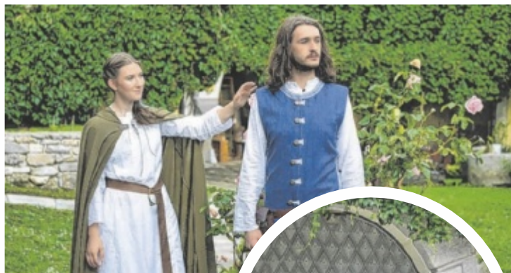
Die mittelalterliche Geschichte von Helmbrecht wird auf Schloss Sprinzenstein mit viel Musik zu neuem Leben erweckt.

Helmbrecht wird von 24. Juli bis 8. August auf Schloss Sprinzenstein, Gemeinde Sarleinsbach, aufgeführt. Tickets: www.helmbrecht.at