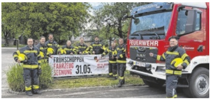
Die FF Aisting-Furth feiert ihr neues Tanklöschfahrzeug.

aufsteigender Mond Blütentag – Lichttag / Nahrungsqualität: Fett / Körperregionen: Venen, Unterschenkel Günstig: Kirschen u. Beeren ernten; Blumen aussäen; Unkraut jäten; Verblühtes entfernen; großer Hausputz; Fenster putzen; Reparaturen im Haushalt; Ordnung machen u. alte Dinge verstauen od. weggeben; lüften; Massagen; Kosmetik; Hühneraugen u. Warzen entfernen; Reise antreten – Ungünstig: Pflanzen gießen