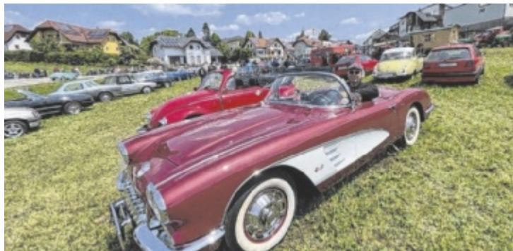
Naarn wird wieder zum Treffpunkt für Oldtimer-Liebhaber.

Oldtimer-Treffen Samstag, 13. Juni, ab 9 Uhr Wallfahrtskirche Maria Laab Laab 2, 4331 Naarn