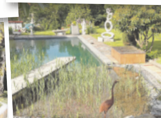
Anton aus Steyr

Mitmachen & abstimmen auf tips.at/garten