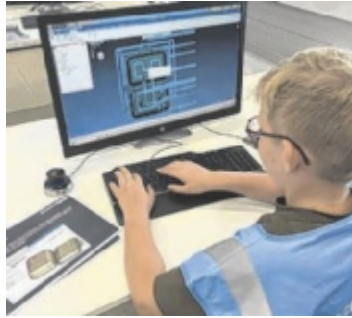
Einblicke in die Welt der 3D-Modellierung und Programmierung.

SCHLIERBACH. Die Talentewoche von 15. bis 17. Juli im Technologie- und Innovationszentrum Kirchdorf (TIZ) bietet Kindern die Möglichkeit, ihre Stärken zu entdecken und Einblicke in die Welt von Mathematik, Informatik, Naturwissenschaften und Technik zu gewinnen.