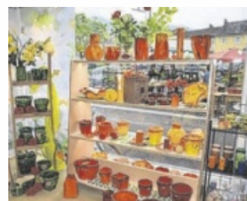
Heuer liegt der Schwerpunkt unter anderem auf Gartenkeramik.

Freitag, 12. Juni, 14 bis 18 Uhr Samstag, 13. Juni, 10 bis 17 Uhr Anton-Herzog-Straße 3 www.diakonie.schlossklaus.at