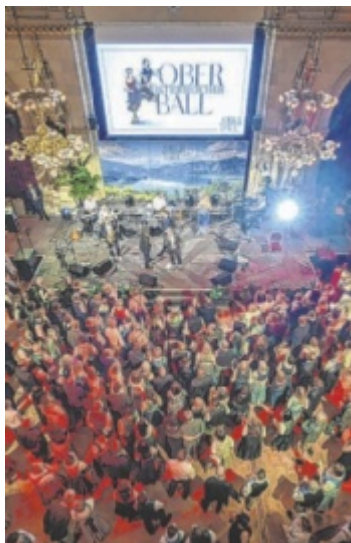
Oberösterreich Ball im Wiener Rathaus.

Der Oberösterreich Ball verspricht wieder eine Nacht voller Tanz, Musik und kulinarischer Genüsse im prunkvollen Ambiente. Mit dabei sind unter anderem die Poxrucker Sisters, zur Eröffnung wartet ein Falco-Tribute, das ptArt Orchester, die Polizeimusik OÖ, die MMK Haag am Hausruck, 2:tag:bart und viele, viele weitere Acts sorgen für Stimmung. Zum mittlerweile 122. Mal findet der Oberösterreich Ball in Wien statt. Neben kultureller Vielfalt werden regionale Spezialitäten in Wien präsentiert. Alle Infos und Karten: oberoesterreicherball.at ■