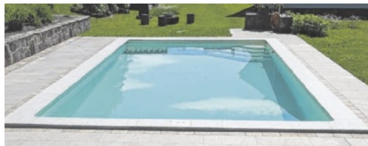
Pool vor der Sanierung (oben) und nach der Sanierung