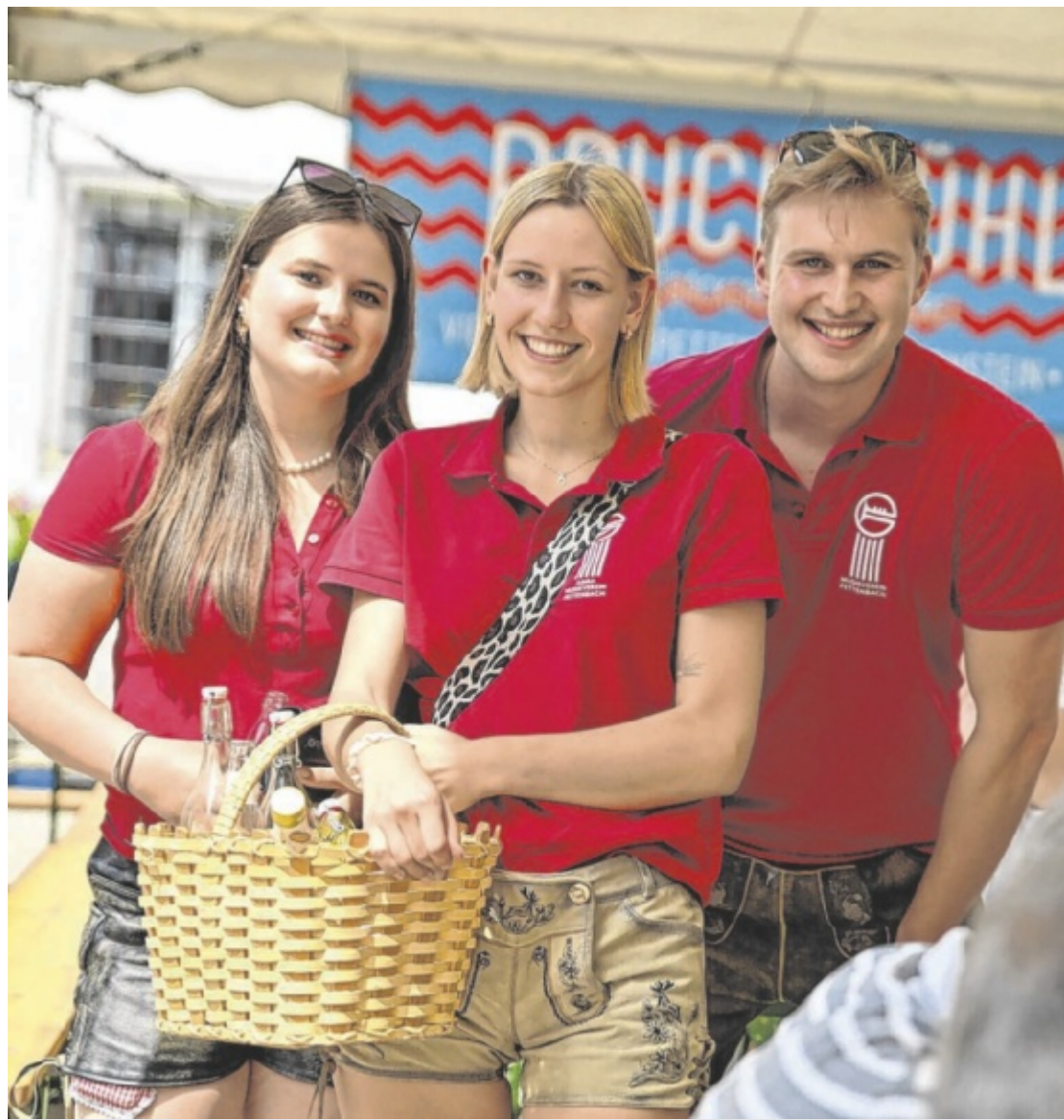
Sunnschoppen Der Musikverein Pettenbach lädt am 30. und 31. Mai zum Sunnschoppen in den Pfarrhof ein. Mit dabei sind das Jugendorchester „Freches Blech“ und der MV Weinzierl-Altpernstein. Eintritt frei. Seite 3