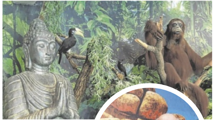
Eine chinesische Krokodilschwanzzechse, Ausstellungseinblicke und Wolfgang Artmann.