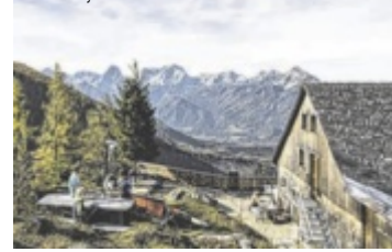
Zellerhütte in Vorderstoder