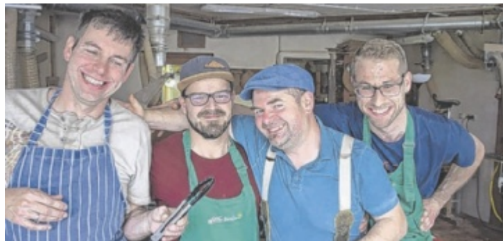
Sämtliche (Verkaufs-)Gegenstände am Kreativmarkt werden von Menschen mit Beeinträchtigungen handgefertigt.

KIRCHDORF. Die DIG-Tagesheimstätte Kirchdorf lädt am Freitag, 12. Juni, und Samstag, 13. Juni, zum Markt „Kreativ & g'schmackig“ in die Anton-Herzog-Straße 3 ein. Besucher erwartet eine vielfältige Auswahl an handgefertigten Produkten. Ein besonderer Schwerpunkt liegt heuer auf Gartenkeramik und Flechtarbeiten.