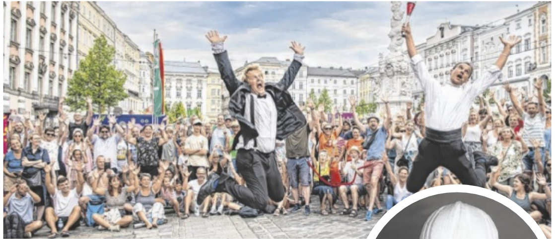
Das Pflasterspektakel macht Linz zur Bühne (oben). DJ Ötzi begeistert seine Fans am Domplatz.

Mehr Infos zu Ausflug und Urlaub in Oberösterreich gibt's auf www.ausflugstipps.at und www.oberoesterreich.at .