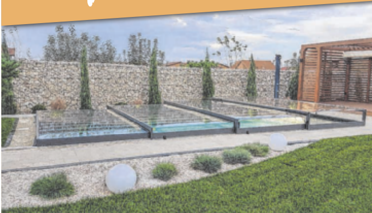
Überdachung Alukov Champion