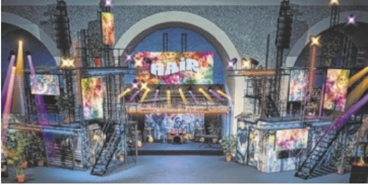
Mit dem Kultstück „Hair“ erobert das erste große Rockmusical der Theatergeschichte das 32. Musikfestival Steyr.