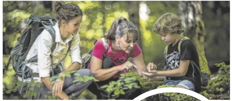
Rund 40 Ranger vermitteln im Nationalpark Kalkalpen wertvolles Wissen über die Natur.