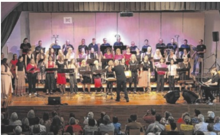
Der stimmenreiche Chor OSGS steht für musikalische Vielfalt.