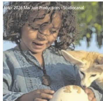
Hadara und der Wüstenfuchs