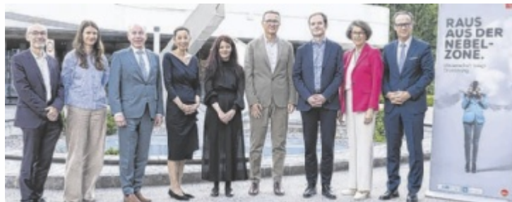
Referenten und Vertreter von Wirtschaft, Land OÖ und Greiner

Im Zentrum des Abends standen aktuelle Forschungsprojekte zur