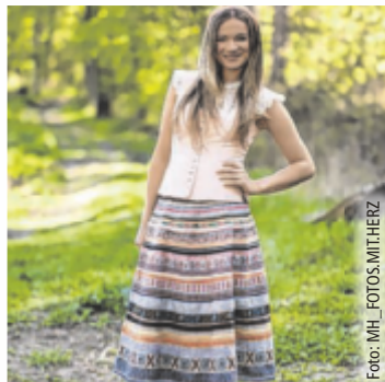
Leichtigkeit trifft Tradition

EDT. Die aktuellen Sommer-trends der Trachten Wichtlstube aus Edt bei Lambach verbinden traditionelle Schnitte mit modernen Stoffen und frischen Farben.