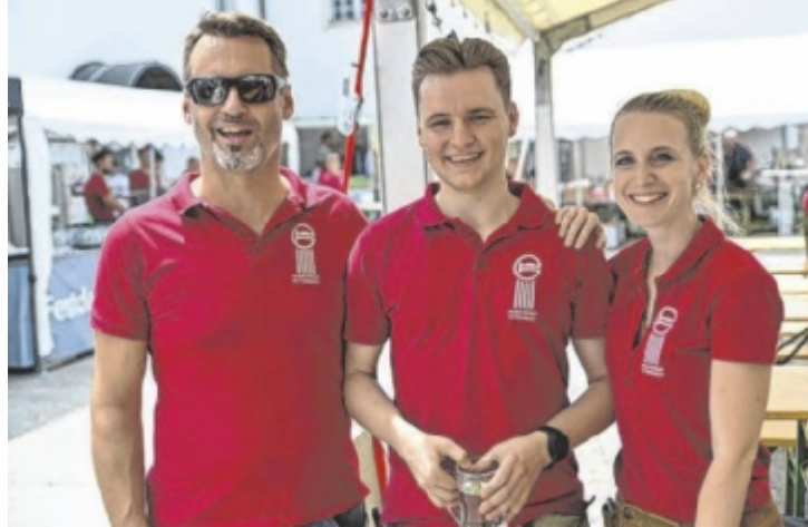
(Jung-)Musiker aus Pettenbach freuen sich auf zahlreiche Gäste.