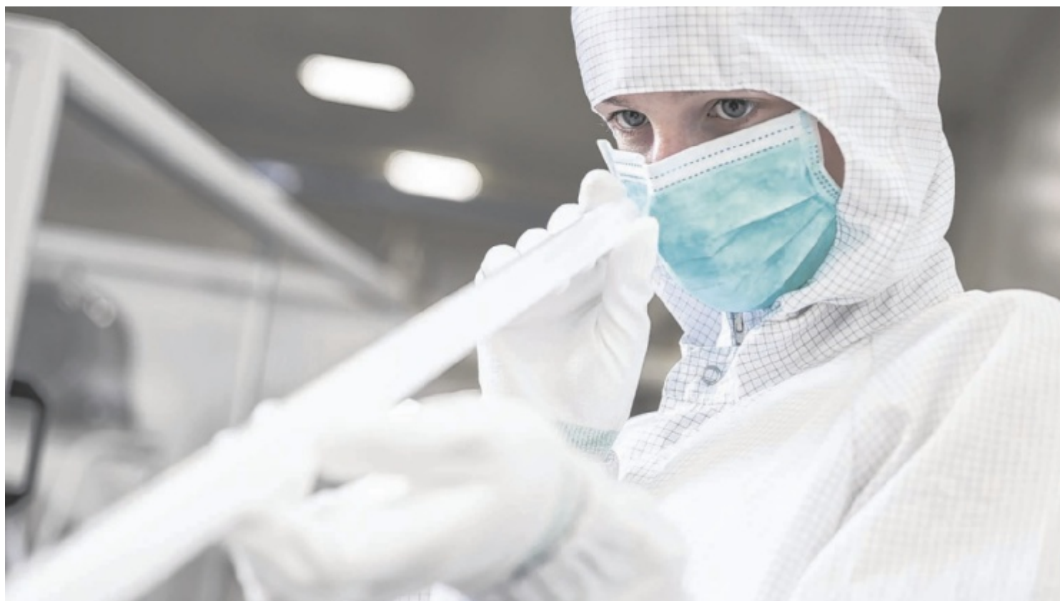
Bei AGRU sorgt präzise Kontrolle im Reinraum für höchste Produktqualität.