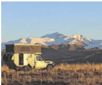
Die Familie war im Pick-Up mit selbstgebauter Wohnkabine unterwegs.