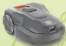
Foto hochladen & Husqvarna Mähroboter 308V sowie Gutscheine von der Gärtnerei Dopetsberger im Wert von € 1.500,- inkl. Gartencheck gewinnen!