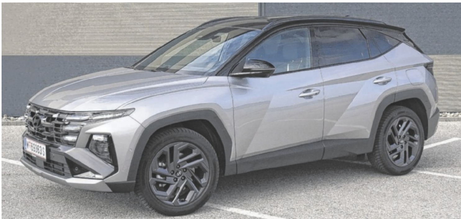
Der getestete Hyundai Tucson 20th Anniversary 1.6 T-GDI Hybrid 2WD ist ab 46.990 Euro zu haben.