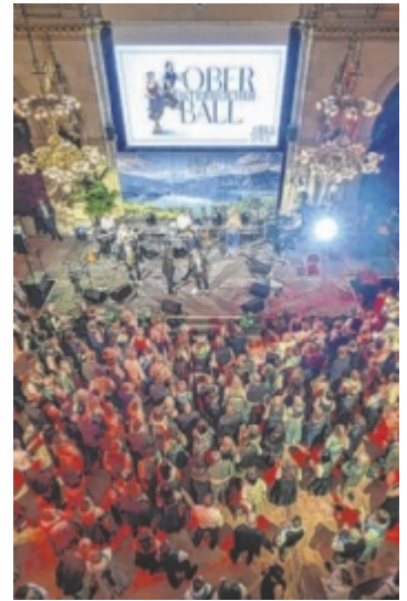
Oberösterreich Ball im Wiener Rathaus.

Der Oberösterreich Ball verspricht wieder eine Nacht voller Tanz, Musik und kulinarischer Genüsse im prunkvollen Ambiente. Mit dabei sind unter anderem die Poxrucker Sisters, zur Eröffnung wartet ein Falco-Tribute, das ptArt Orchester, die Polizeimusik OÖ, die MMK Haag am Hausruck, 2-tages:bart und viele, viele weitere Acts sorgen für Stimmung. Zum mittlerweile 122. Mal findet der Oberösterreich Ball in Wien statt. Neben kultureller Vielfalt werden regionale Spezialitäten in Wien präsentiert. Alle Infos und Karten: oberoesterreicherball.at ■