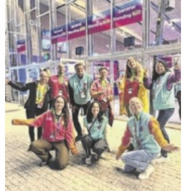
Trotz 10.000 Besuchern herrschte bei den Freiwilligen beste Stimmung.

beim ersten Briefing gesagt worden – ein Motto, das sich durch ihre gesamte Woche zog.