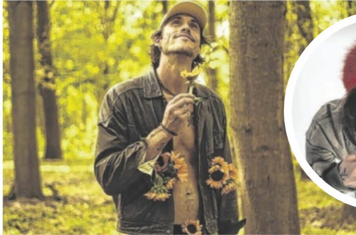
GReeN ist Headliner am Freitag.

KIRCHDORF/KREMS. Musikalisch setzt das ehrenamtlich organisierte Festival heuer auf ein starkes Headliner-Duo mit GReeN am Freitag und Bibiza am Samstag. Gleichzeitig liegt ein besonderer Schwerpunkt auf weiblichen Acts: Künstlerinnen wie Paula Carolina, Uche Yara, Nenda oder Magdalena Wawra stehen stellvertretend für ein vielfältiges Line-up. Ergänzt wird das Programm unter anderem durch Acts wie Die Sterne, Pöbel MC oder Adam Angst. Neben Live-Musik sorgen DJs, Food Trucks und ein abwechslungsreiches Rahmenprogramm für Festivalatmosphäre. Eine eigens errichtete Containerhalle bietet zudem Wetterschutz. Neu sind heuer reservierbare Stellplätze für Caravan-Gäste sowie ein „BringMichHeim“-Bus für