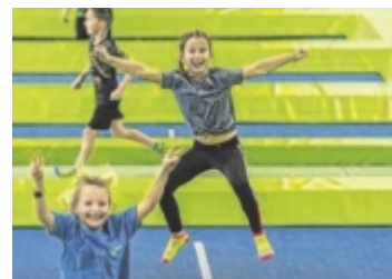
Spaß im JUMP DOME

Besonders beliebt sind auch die Geburtstagspartys im JUMP DOME. Passend zum fünfjährigen Jubiläum wird nun ein neues Premium-Geburtstagspaket vorgestellt, das zusätzliche Extras und noch mehr gemeinsames Erlebnis bieten soll. Neben Sprungzeit und reserviertem Geburtstagsstisch erwarten die Gäste unter anderem