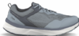
Veloce light blue | Joya