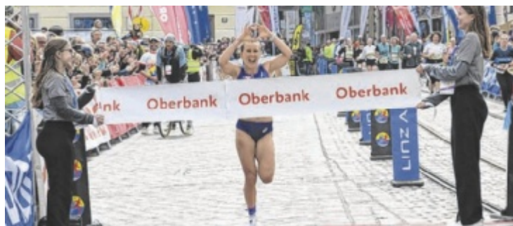
Euphorie an der Ziellinie beim Oberbank Linz Donau Marathon

ASTEN. Die 16. Int. Raiffeisen Oberösterreich Rundfahrt wird ein echtes Radsportspektakel. Vom 4. bis 7. Juni 2026 werden 150 Radprofis aus über 20 Nationen um den Sieg im Land ob der Enns fahren. Die 3. Etappe wird am 6. Juni von Asten nach Bad Schallerbach führen. Der Start erfolgt um 14 Uhr beim Paneum. Von der Wunderkammer des Brotes führt dieses Teilstück vom Stift St. Florian über Schlierbach zur Bergwertung Magdalenaberg. Danach geht es nach Lambach. Spektakulär wird dann das Finale der Etappe in der Eurothermen-Gemeinde Bad Schallerbach, wo nach der Bergwertung Am Hochfeld und einer weiteren Schleife in die Mosthauptstadt Oberösterreichs, St. Marienkirchen an der Polsenz, das Ziel erreicht wird. ■