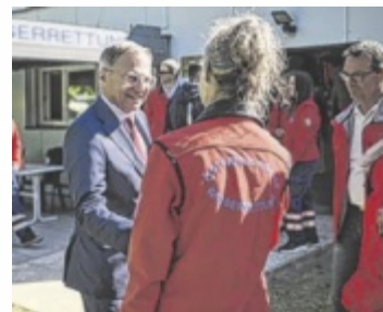
Gemeinsam mit Vertretern der OÖVP dankte LH Stelzer Wasserrettern und Feuerwehrtauchern für ihren Einsatz.

Stelzer betonte die Bedeutung des freiwilligen Engagements für das Bundesland. „Viele Menschen investieren unzählige Stunden ihrer Freizeit für andere – selbstverständlich, freiwillig und oft im Hintergrund“, sagte der Landeshauptmann. Gerade am Staatsfeiertag wolle man diese Leistung sichtbar machen und wertschätzen. Laut Land Oberösterreich engagieren sich rund 600.000 Menschen ehrenamtlich und leisten dabei insgesamt etwa 2,8 Millionen Arbeits-