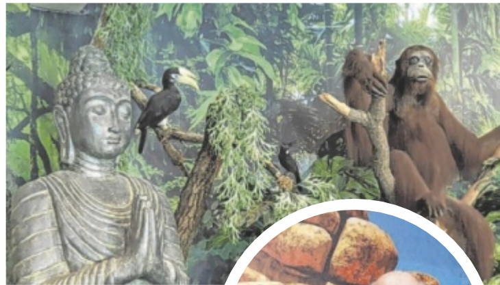
Eine chinesische Krokodilschwanzzechse, Ausstellungseinblicke und Wolfgang Artmann.