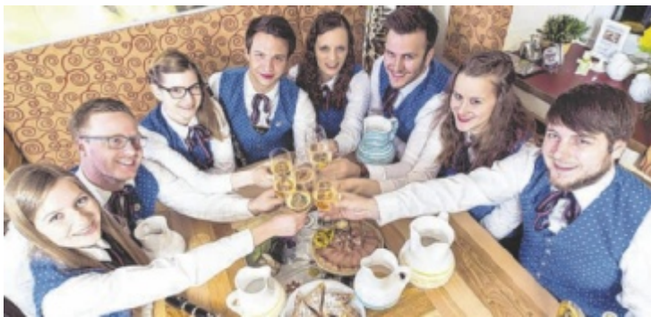
Die Trachtenkapelle Traun Siebenbürger lädt zum Mostfestl.