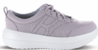
Bauma pink | kybun