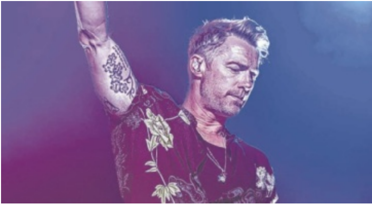
Ronan Keating kommt zu den Haibacher Sommer Open Airs.