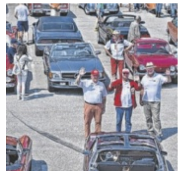
Der Vereinsvorstand inmitten der edlen Karossen.

Ein Höhepunkt ist um 13 Uhr die Rallye „Rund um Leonding“, an der etwa 50 Oldtimer teilnehmen sollen. Zudem steht heuer ein Rückblick auf die österreichischen Fahrzeugkonstrukteure Hans und Erich Ledwinka im Mittelpunkt. Fahrzeuge der beiden Autopioniere werden vor Ort präsentiert. Auch Clubfahrzeuge können im Skaterpark besichtigt werden. Neben den historischen Autos erwartet die Besucher ein Rahmenprogramm mit Musik, Kaffee