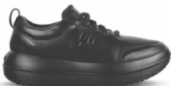
Bauma CL black | kybun