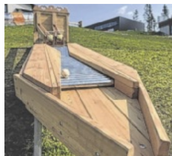
Kugelbahn in Hinterstoder

Für unvergessliche Momente sorgt außerdem das beliebte Bergglühen in Hinterstoder – stimmungsvolle Sonnenaufgangsfahrten inklusive Bergyoga am Schafkogelsee sowie anschließendem Frühstücksbuffet beim Höss Salettl und der Löger Hütt'n. Auch das Bergyoga in Hinterstoder