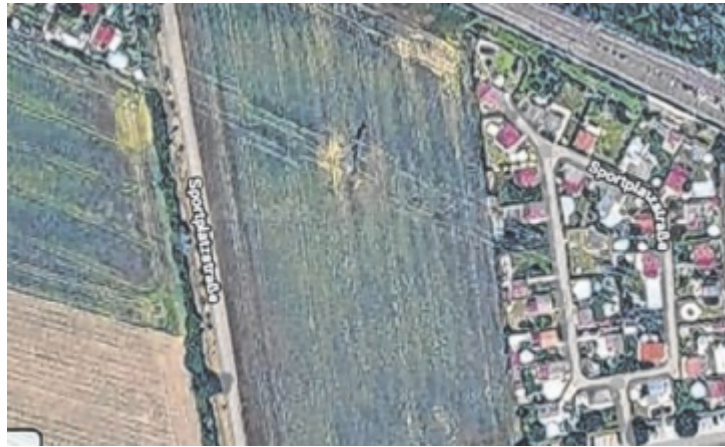
Geplante Kleingartenanlage in Asten: Auf diesem Gelände an der Sportplatzstraße sollen insgesamt 45 Parzellen entstehen.

Geplant sind Grundstücke zwischen 270 und 442 Quadratmetern sowie 72 Parkplätze. Die Aufschließung übernimmt der Landesverband. Vorgesehen sind asphaltierte Wege und Parkflächen sowie Strom-, Wasser- und Kanalschlüsse bis zu den jeweiligen Parzellengrenzen. Auch die Einzäunung der gesamten Anlage mit Schiebetoren ist geplant. Der Baubeginn soll im Juni erfolgen, die Fertigstellung der Arbeiten ist für September 2026 vorgesehen. Grundlage für die Nutzung bildet