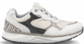
Tina III white-gold | Joya