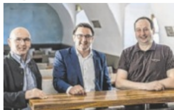
Die Zukunft der Gastronomie im Schloss Traun wurde fixiert.

Für Bürgermeister Koll ist die Entscheidung auch ein Signal: „Unser Weg mit Robert war klar und transparent“, sagt er. „Mit der nun erfolgten Vertragsfixierung setzen wir konsequent um, was wir gemeinsam beschlossen haben. Das ist eine echte Trauner Lösung.“ Mit Mader übernehme nicht nur ein erfahrener Gastronom,