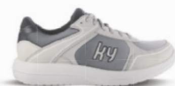
Maggingen light grey | kybun