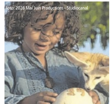
Hadara und der Wüstenfuchs