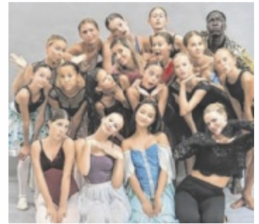
Die OÖ Tanzakademie reist durch die Musikgeschichte.

Bereits ab 10 Uhr laden Kreativstationen im Großen Foyer des