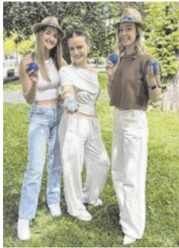
Spiel, Spaß und Sommerstimmung in Linz mit Under the bridge.

Im Mittelpunkt steht die „Gurkerl-Olympiade“ presented by efko: Besucher können ihr Geschick bei Spielen wie Cornhole, Gaberln, Wasserpong, Boccia und Mini-Tischtennis unter Beweis stellen. Unter allen Teilnehmern wird ein Stand-up-Paddle von efko verlost, zusätzlich warten attraktive Preise wie Gutscheine der Fussl Modestraße im Wert von bis zu 300 Euro. Die ersten 100 Gäste erhalten Goodies. Für Stimmung sorgt unter anderem das DJ-Kollektiv inner circle und die besondere Atmosphäre direkt am Wasser. ■