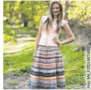
Leichtigkeit trifft Tradition

Im Mittelpunkt stehen Dirndln aus luftigen Materialien wie Baumwolle, Leinen und Viskose, die nicht nur angenehm zu tragen sind, sondern auch eine natürliche Eleganz ausstrahlen. Besonders gefragt sind handbedruckte Seidenschürzen, die jedem Dirndl eine individuelle Note verleihen. Zarte Pastelltöne dominieren die Farbpalette und verleihen den klassischen Silhouetten eine sommerliche Note. Feine Stickereien, verspielte Borten und liebevolle Details sorgen dabei für den unverwechselbaren Trachtencharakter. Auch bei den Schnitten zeigt sich die Tracht vielseitig. Dirndlblusen mit feinen Details oder zarten Puffärmeln sorgen für ein luftiges