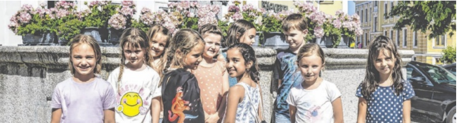
Als Belohnung für drei absolvierte Touren gibt es für fleißige Erkunder einen Bruckner-Detektiv-Sportbeutel