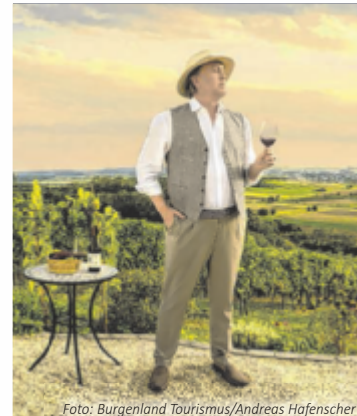
Burgenland Markenbotschafter und Genießer: Nicholas Ofczarek

Ein besonderes Highlight setzt dabei der Herbst: Von 1. bis 11. Oktober laden die Naturerlebnistage dazu ein, das Burgenland noch intensiver und vor allem authentisch zu entdecken. Anzeige