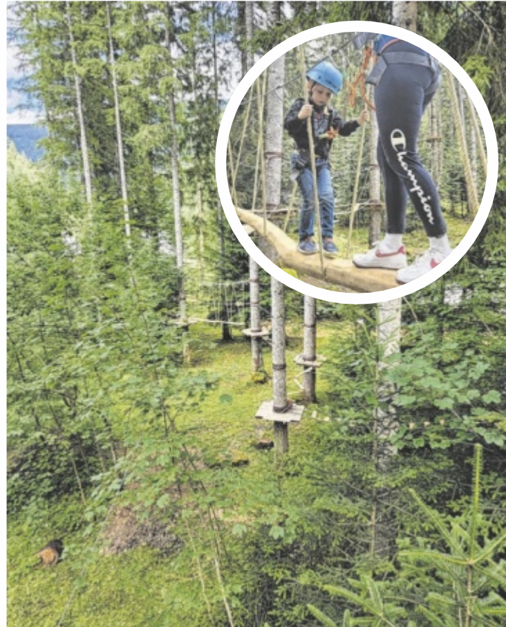
Kletter-Erlebnis im Gosauer Wald

Auf Wunsch können erfahrene Trainer gebucht werden, die Gruppen begleiten und mit Tipps für ein noch intensiveres Erlebnis sorgen. Der Walderlebnispark ist je nach Witterung in den Monaten April bis Oktober geöffnet. www.wep-gosau.at