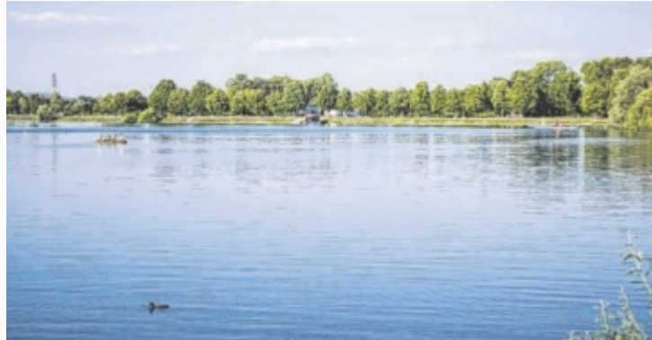
Das Entenfütterungsverbot ist ein wichtiger Faktor zur Eindämmung von Zerkarien am Oedtersee, die zu juckendem Hautausschlag führen.