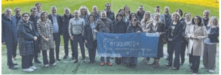
Die erfolgreiche Entwicklung der Initiative wurde in der Raiffeisen Arena Linz gemeinsam mit den Erasmus+ Verantwortlichen aller 22 Berufsschulen gewürdigt und gefeiert.

Die Teilnahme am Programm Erasmus+ Berufsbildung war für Lehrlinge und Lehrkräfte an Berufsschulen über längere Zeit hinweg nur eingeschränkt möglich. Für die duale Ausbildung brauchte es zunächst veränderte Rahmenbedingungen sowie eine gezielte Initiative, um neue Perspektiven zu eröffnen.