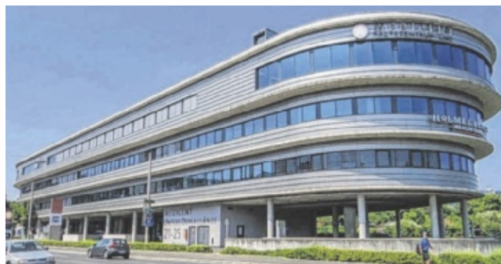
WKZ-WundKompetenzZentrum®-Linz im MEDICENT in Linz

Im MEDICENT Linz erwartet Patienten ein spezialisiertes Wundbehandlungszentrum mit über 26 Jahren praktischer Erfahrung mit individueller Analyse zu Beginn jeder Therapie. Ein interdisziplinäres Team aus erfahrenen Wundspezialisten und ZWM-zertifizierten Wundmana-