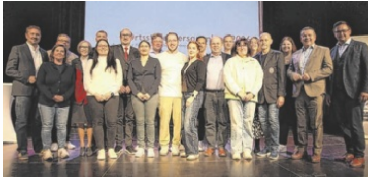
Der neu gewählte Ortsstellenausschuss.