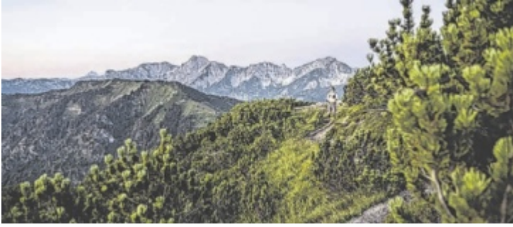
Rund 40 Ranger vermitteln im Nationalpark Kalkalpen wertvolles Wissen über die Natur.