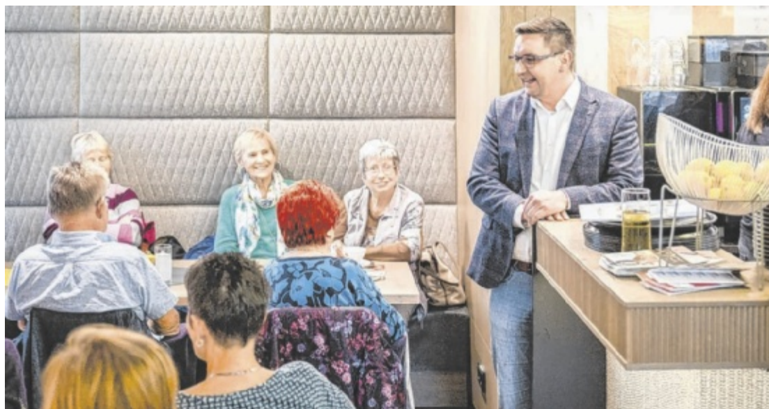
Bürgermeister Karl-Heinz Koll hat immer ein offenes Ohr für die Anliegen der Trauner.

Koll: Man kann nur dann gute Politik machen, wenn man weiß, was die Menschen tatsächlich bewegt. Sprechstunden, Stammtische oder Stadtgespräche geben ganz direkte Einblicke in Wünsche, Sorgen und Anliegen der Leute. Dieser persönliche Austausch ist durch nichts zu ersetzen. Viele wichtige Ideen entstehen genau aus solchen Begegnungen. Deshalb ist es mir wichtig, den direkten Kontakt weiterhin aktiv zu pflegen. ■ Anzeige