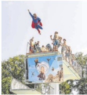
Der Battle of Tower ist nichts für schwache Nerven.

Ganztags am Programm stehen: Water-Action, Eisbaden, Hafenrundfahrten, Hubschrauber-