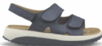
Panama blue | Joya