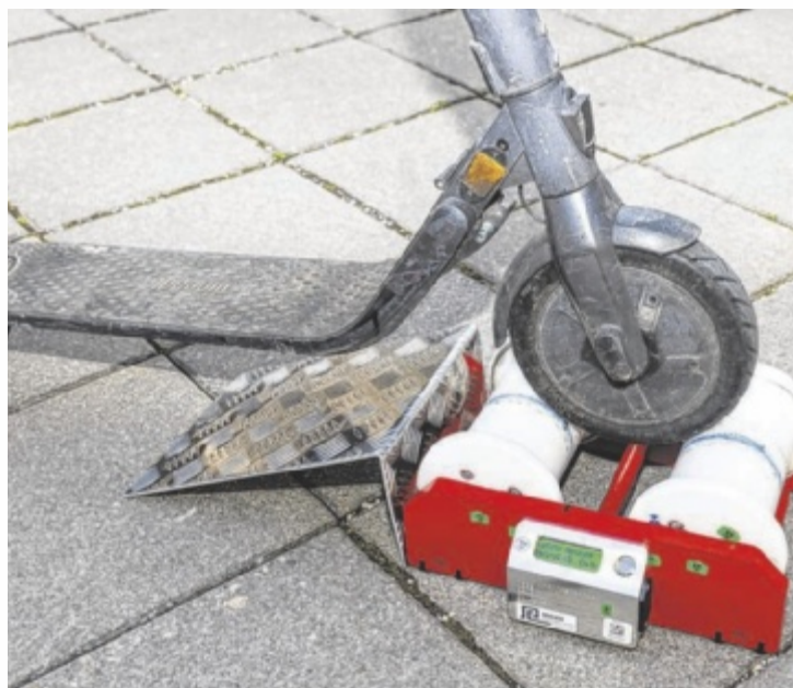
Mit dem neuen Rollenprüfstand werden die Kontrollen für E-Scooter-Fahrer in Traun verschärft.

Besonders sensibel ist die Situation in Naherholungsgebieten wie rund um das Schloss Traun. Dort hinterlassen E-Scooter-Fahrer durch Bremsmanöver und riskante Fahrten im Kies immer wieder tiefe Löcher im Boden. Diese stellen für Fußgänger, insbesondere für ältere Menschen, eine erhebliche Stolper- und Verletzungsgefahr dar“, erläutert Trauns Bürgermeister Karl-Heinz Koll.