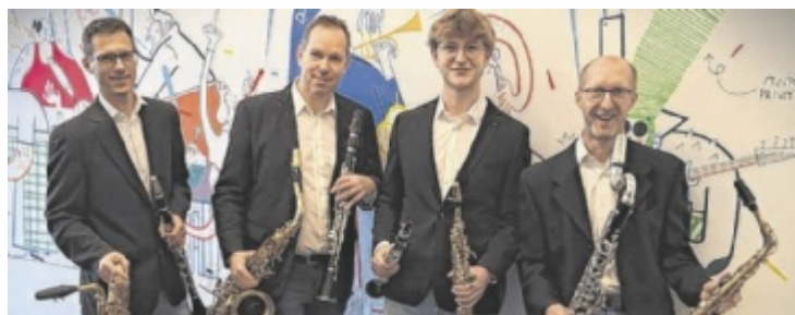
Für die musikalische Gestaltung sorgen „four shades of reed“.