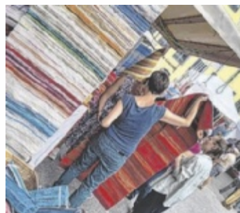
Bunt wird es wieder am Haslacher Webermarkt.

Ergänzend öffnet auch die Faserzone, eine Fachmesse für Garne, Materialien und Zubehör, ihre