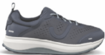
Miami blue | Joya