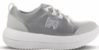
Pura silver | kybun