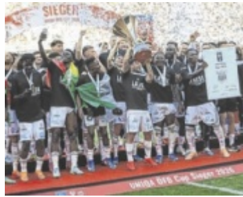
Unterstützt von 15.000 mitgereisten Fans holte der LASK den Titel.

KLAGENFURT/LINZ. Historischer Erfolg: Erstmals seit dem Double-Gewinn 1965 krönte sich der LASK wieder zum österreichischen Cupsieger. Nach einer packenden Partie bezwangen die Schwarz-Weißen im Finale in Klagenfurt den SCR Altach 4:2 nach Verlängerung.