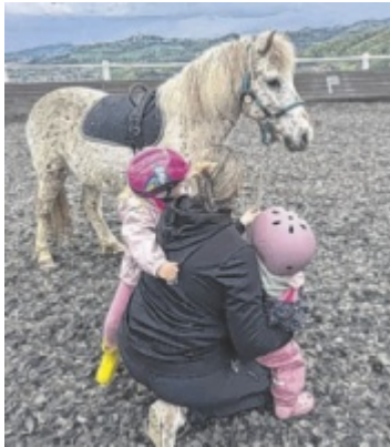
Hippotherapie Am Melfergergut in Linz wird ab Mai Hippotherapie für Kinder und Jugendliche angeboten. Seite 5