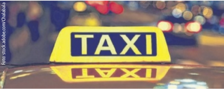
Das JugendTaxi sorgt für einen sicheren Heimweg in den Nachtstunden.