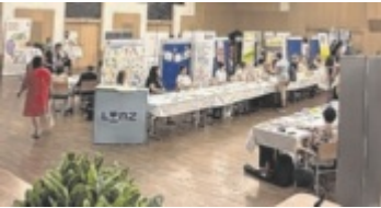
Rund 30 Infostände zeigen Angebote und Möglichkeiten auf.