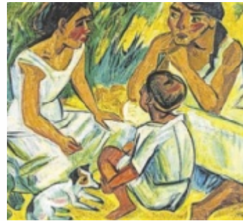
Max Pechsteins „Die Unterhaltung“

LINZ. Die Retrospektive „Abenteurer Expressionismus“ im Lentos widmet sich mit Max Pechstein einem Hauptvertreter der klassischen Moderne. Neben Schlüsselwerken aus verschiedenen Schaffensphasen steht besonders seine Beziehung zu seinem Förderer, dem Kunsthändler Wolfgang Gurlitt, im Fokus, der auch den Grundstein der Vorgängerinstitution des Lentos legte.