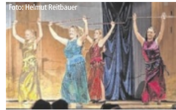
Die Gruppe zeigt ihre neue Show.

Musiktheater. Gute Laune ist garantiert! Infos und Karten: landestheater-linz.at, Tel. 0732 76 11-400. Bei Tips gibt's 3 x 2 Freikarten für das Konzert zu gewinnen. ■