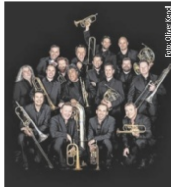
Das Ensemble Pro Brass.

Lächeln ist die kürzeste Verbindung zwischen Menschen – und genau das stellt Pro Brass in seinem Programm „Smile“ musikalisch unter Beweis. Seit der Gründung in den frühen 1980er-Jahren steht Pro Brass für Innovation, Vielseitigkeit und Unverwechselbarkeit. Mit Mut zur musikalischen Freiheit und Kreativität überschreiten die Musiker immer wieder Genregrenzen und definieren den Begriff „Brass Ensemble“ neu. Einzigartige Kompositionen, Arrangements und einem Mix aus Klassik, Jazz und Pop warten im