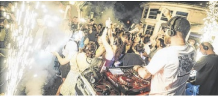
Kopfhörer auf, Musik an und gemeinsam abtanzen