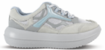
Uster cyan | kybun