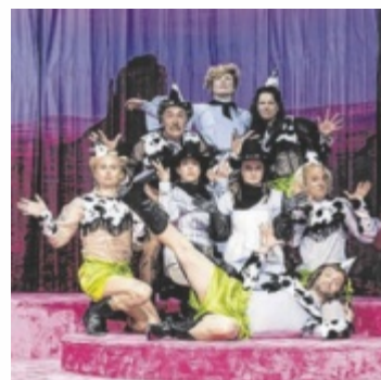
„Der Menschenfeind“ feiert am 9. Mai in Linz Premiere.

LINZ. Molières Lustspiel „Der Menschenfeind“ feiert am Samstag, 9. Mai, 19.30 Uhr, in den Kammerspielen Premiere.