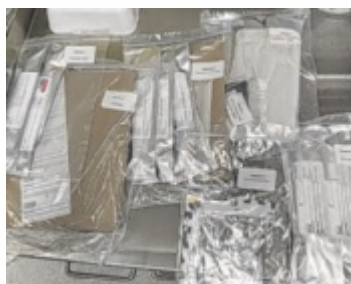
In den Untersuchungsboxen finden sich Schritt-für-Schritt-Anleitungen.

Um eine Betreuung rund um die Uhr zu gewährleisten, stehen außerhalb der Öffnungszeiten der Gewaltambulanz zwei spezielle Untersuchungsboxen für sexuelle Gewalt und Trauma zur Verfügung. Diese enthalten Schritt-für-Schritt-Anleitungen zur Beweissicherung – etwa ein Mundhöhlenabstrich oder Spurensicherung am Körper – und können so auch