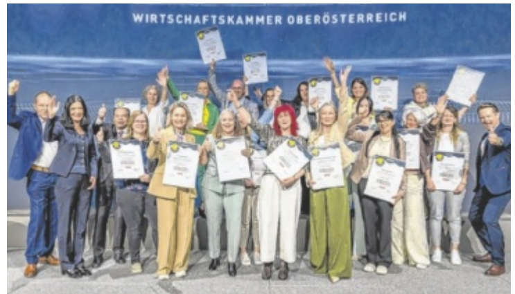
Die glücklichen zertifizierten Direktberaterinnen

für die steigende Relevanz und Dynamik dieses Wirtschaftszweigs. Ein besonders emotionales Moment war die Ehrung von 18 zertifizierten Direktberaterinnen. Hier wurde nicht nur Leistung ausgezeichnet – sondern Konsequenz, Durchhaltevermögen und der Wille, sich weiterzuentwickeln. ■ Anzeige