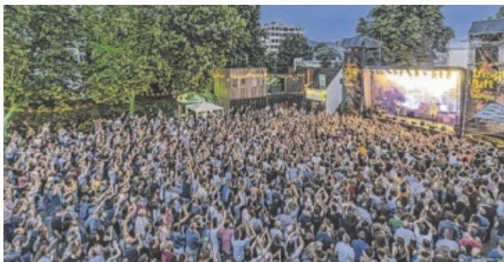
Die Bühne der FrischLuft-Reihe wird größer, breiter, tiefer. Das besondere Feeling, hautnah am Bühnengeschehen zu sein, soll bleiben.

Mehr zu allen Veranstaltungen und Karten: posthof.at