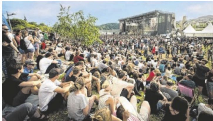
Der Ahoi! Pop Sommer meldet sich zurück im Donaupark.