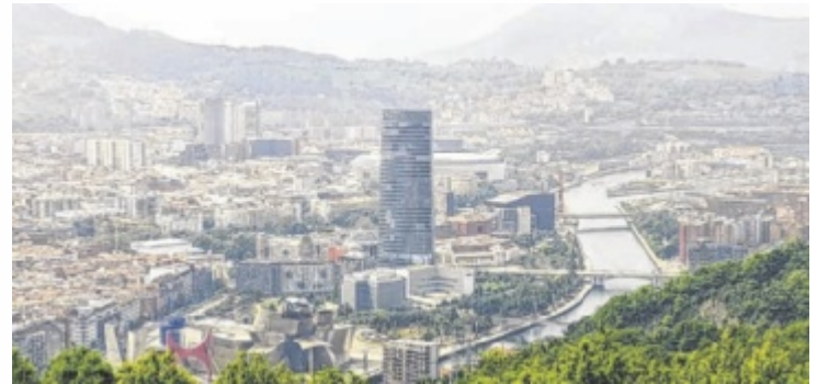
Blick auf die Industrie- und Hafenstadt Bilbao im Baskenland