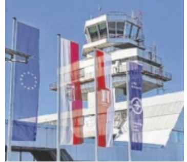
Die internationale Flughafen-Anbindung wurde verbessert.

Damit wird mit einer Flugnummer geflogen. Für die Passagiere bedeutet die Neuerung die Möglichkeit von Durchgangstarifen samt Bordkarten bis zum Endziel. Auch wird das Gepäck bei der Aufgabe in Linz bis zur Zieldestination durchgecheckt. Zudem hat man nun eine Anschlussgarantie: Sollte sich ein Flug verspäten, kümmert sich die Airline um eine Umbuchung. Linz ist damit wieder an das weltweite Streckennetz der Luft-