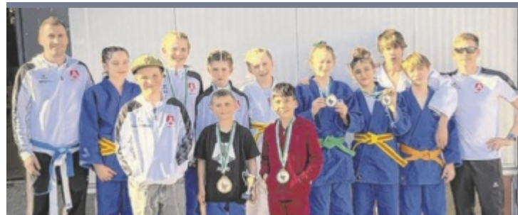
Erfolg für Nachwuchs-Judokas Der Nachwuchs des Askö Judo Linz zeigte beim Austrian Cup, einem der bedeutendsten Nachwuchsturniere Europas, in Zeltweg auf. Mit zwei Gold-, drei Silber- und fünf Bronzemedailles platzierte sich das Team in der Gesamtwertung auf Platz sechs von 102 Vereinen.