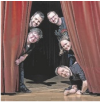
Die Gaudiatoren