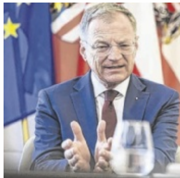
LH Thomas Stelzer (ÖVP)

LINZ/OÖ. Der Florianitag am vergangenen Montag lenkte den Blick auf den Landespatron und die Bedeutung von Schutz, Verantwortung und Solidarität. Landeshauptmann Thomas Stelzer (ÖVP) betont die Bedeutung eines breiten Sicherheits- und Sozialsystems sowie das Zusammenspiel von Staat und Ehrenamt in Oberösterreich.