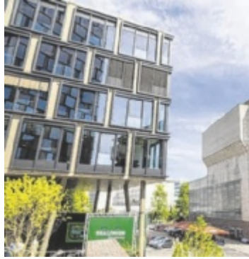
Der neue Bürokomplex am Areal der Tabakfabrik.

Die neue Zentrale in der Landeshauptstadt sei auch ein Be-