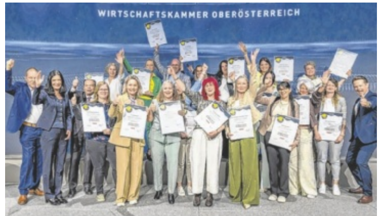
Die glücklichen zertifizierten Direktberaterinnen

für die steigende Relevanz und Dynamik dieses Wirtschaftszweigs. Ein besonders emotionales Moment war die Ehrung von 18 zertifizierten Direktberaterinnen. Hier wurde nicht nur Leistung ausgezeichnet – sondern Konsequenz, Durchhaltevermögen und der Wille, sich weiterzuentwickeln. ■ Anzeige