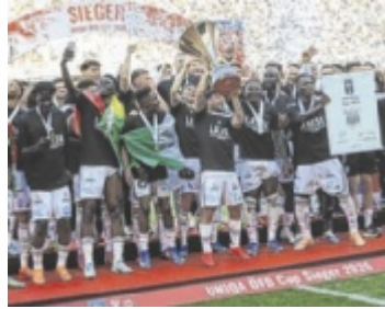
Unterstützt von 15.000 mitgereisten Fans holte der LASK den Titel.

KLAGENFURT/LINZ. Historischer Erfolg: Erstmals seit dem Double-Gewinn 1965 krönte sich der LASK wieder zum österreichischen Cupsieger. Nach einer packenden Partie bezwangen die Schwarz-Weißen im Finale in Klagenfurt den SCR Altach 4:2 nach Verlängerung.