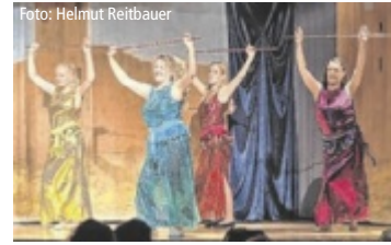
Die Gruppe zeigt ihre neue Show.

Musiktheater. Gute Laune ist garantiert! Infos und Karten: landestheater-linz.at, Tel. 0732 76 11-400. Bei Tips gibt's 3 x 2 Freikarten für das Konzert zu gewinnen. ■