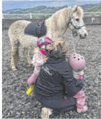
Die Ponys und Pferde am Melferergut sind den Umgang mit Kindern gewöhnt.