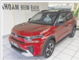
Citroen C3 Aircross MAX Hybrid EZ: 09/2025, 2.000 km 5x Weiß, Rot, Schwarz & Grau