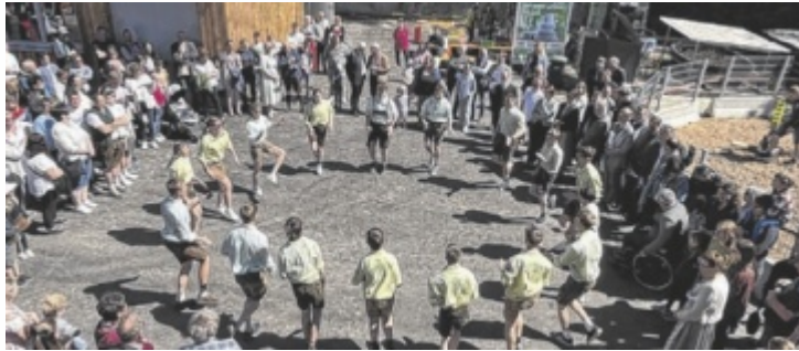
Die neue Maschinenhalle wurde mit einem Fest eröffnet.

Künftig soll die neue Einstellhalle mit Nebenräumen bessere Bedingungen für Unterricht und Praxis bieten. Sie entstand auf einer Fläche von etwa 465 Quadratmetern. Neben dem Schutz von Maschinen steht vor allem der Nutzen für die Ausbildung im Vordergrund. „Heimat braucht Ursprung – und der entsteht dort, wo Landwirtschaft gelernt und gelebt wird“, sagt Agrar-Landesrätin Michaela