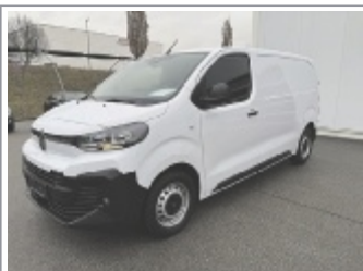
Citroen Jumpy BHDi 120 M BJ: 01/2026, 1.500 km Weiß