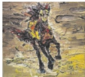
Das Werk „Ein rotes Pferd 10“