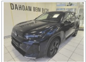
Citroen C5 Aircross Max Hybrid 145 DCG6 BJ: 10/2025, 1.500 km 4x Weiß, Schwarz & Grau