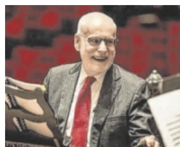
Dirigent Ton Koopman