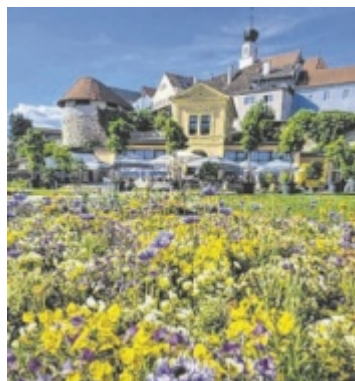
In Schärding können blühende Schätze entdeckt werden.

Am Muttertag selbst veranstaltet der Alpenverein Altheim eine Bergtour zum Zwiesel in den Chiemgauer Alpen. ■