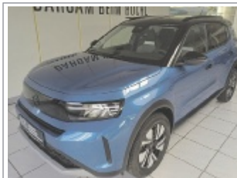
Opel Frontera GS 110 Aut. BJ: 01/2026, 1.600 km 2x Schwarz, Silber