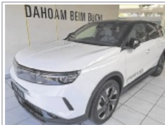
Opel Grandland GS Hybrid EZ: 07/2025, 9.000 km 2x Schwarz & Grau