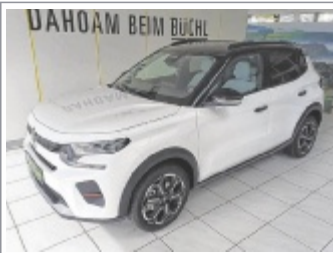
Citroen C3 MAX Turbo EZ: 02-12/2025, 2.000 km 10x Blau, Weiß, Rot, Schwarz & Grau