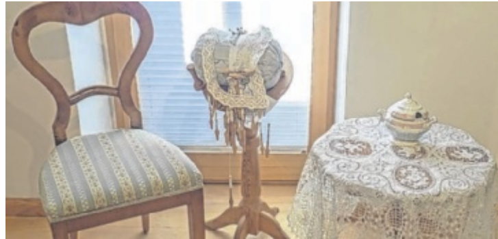
Gezeigt werden unter anderem Klöppelarbeiten.

Gezeigt wird eine breite Palette traditioneller und kunstvoller Handarbeiten: von Brügger Spitzen und irischer Häkelei über Klöppelarbeiten, Kreuzstich-Stickereien und ABC-Mustertücher bis hin zu gestrickten Perlbeuteln und alten Spanschachteln. Auch Gewebes und Gemaltes aus Sie-