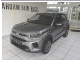
Citroen eC3 YOU 44kWh EZ: 12/2025, 1.700 km Grau