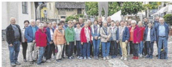
Der Seniorenbund Diersbach ist das ganze Jahr über sehr aktiv.

Aktuell zählt der Verein 128 Mitglieder. Im Mittelpunkt stehen Bewegung, Begegnung und gemeinsames Erleben – ganz im Sinne der Leitsätze „Gemeinsam bewegen. Gesünder leben“ und „Alt werden ist nichts für Feig-