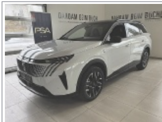
Peugeot 5008 GT Hybrid 145 BJ: 07/2025, 4.800 km 4x Weiß, Blau & Grau