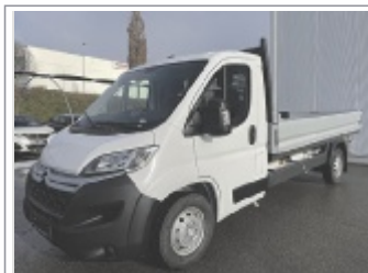
Citroen Jumper PT 35+ L3 Blue HDi 140 S&S EZ: 12/2024, 600 km Weiß, 48 Monate Garantie