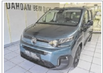
Citroen Berlingo Plus M BHDi 100 BJ: 02/2026, 300 km 4x Blau, Silber