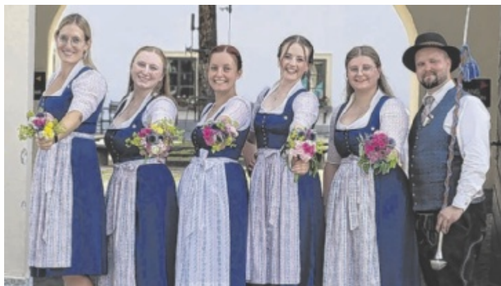
Der Musikverein Brunnenthal zeigt am Muttertag seine Tracht.

Eine Muttertagsmatinee wird ab 11 Uhr im Kubinsaal Schärding veranstaltet. Die Basil-Coleman-Kammersolisten präsentieren Darbietungen, die vom Barock bis zum Pop reichen. „Es geht also quer durch die Highlights der Mu-