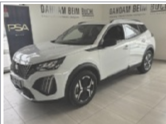
Peugeot 2008 Allure 100 Turbo od. 110 DCG 6 EZ: 2/2026, 1.800 km 5x Weiß, Schwarz, Grau & Blau