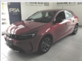
Opel Corsa Edition BJ: 04/2025, 150 km 4x Rot, Weiß