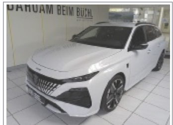
Peugeot 308 SW GT Hybrid 145 DCG 6 BJ: 1/2026, 1.700 km 5x Grau, Weiß & Schwarz