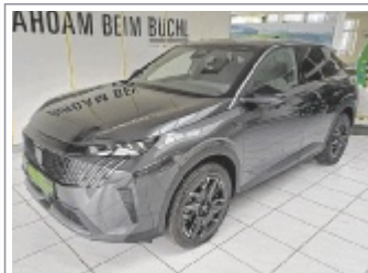
Peugeot 3008 GT Hybrid 145 EZ: 06-12/2025, 4.300 km 7x Weiß, Blau, Schwarz & Grau