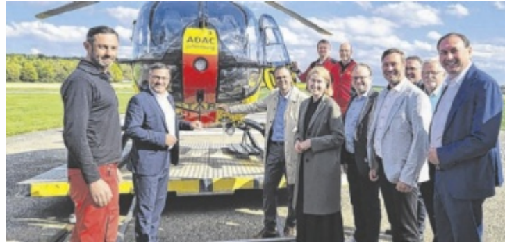
Politische Vertreter aus Oberösterreich und Bayern trafen sich in Suben, um über die Notfallversorgung in der Region zu sprechen.

Einigkeit herrschte darüber, dass der Hubschrauber längst eine unverzichtbare Säule der medizinischen Versorgung darstellt. „Man ist froh, wenn man ihn nicht sieht, dennoch vermittelt er ein hohes Maß an Sicherheit“, sagte der bayerische Landtagsabgeordnete