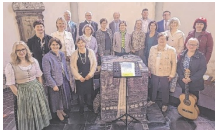
Beim Kirchenchor Wernstein spielt die Gemeinschaft eine große Rolle.

Dabei steht nicht nur die musikalische Qualität, sondern auch die Freude am Singen im Fokus. Bei Hochfesten wie Weihnachten und Ostern werden sowohl lateinische Messen als auch moderne Chorkliteratur in deutscher