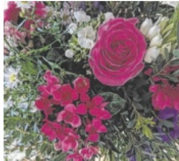
Blumen passen immer

Gerade zum Muttertag – aber nicht nur da – sollte man bewusst auf qualitativ hochwertige und saisonale Blumen achten. Im Gegensatz zu Supermärkten, die ihre Ware oft aus großen Produktionsanlagen aus dem Ausland beziehen, setzen regionale Gärtnereien auf nachhaltige Produktion und kurze Wege. Die Floristen vor Ort binden individuelle Sträuße und berücksichtigen die Wünsche der Kunden. Die richtige Pflanzenwahl gilt gerade um diese Jahreszeit auch bei Blumen für Garten, Balkon, Terrasse oder Innenbereich. Die