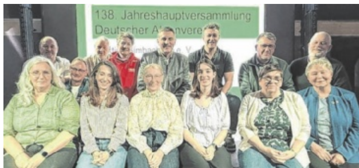
Die Vorstandschaft des Simbacher Alpenvereins