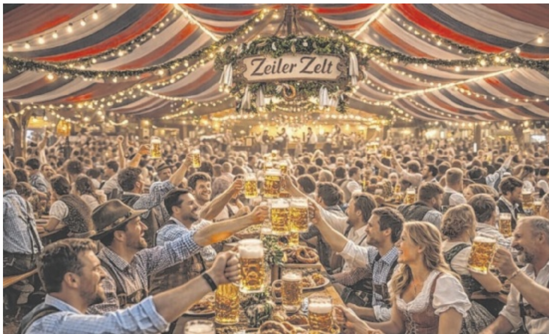
Das neue Zeiler-Festzelt ist freitragend und verspricht eine perfekte Akustik

Im Außenbereich gibt es keine Veränderung. Der Biergarten und Eingangsbereich bleiben auch in diesem Jahr gleich. Und natürlich darf man sich wieder auf das süffige Festbier des Hofbräu-