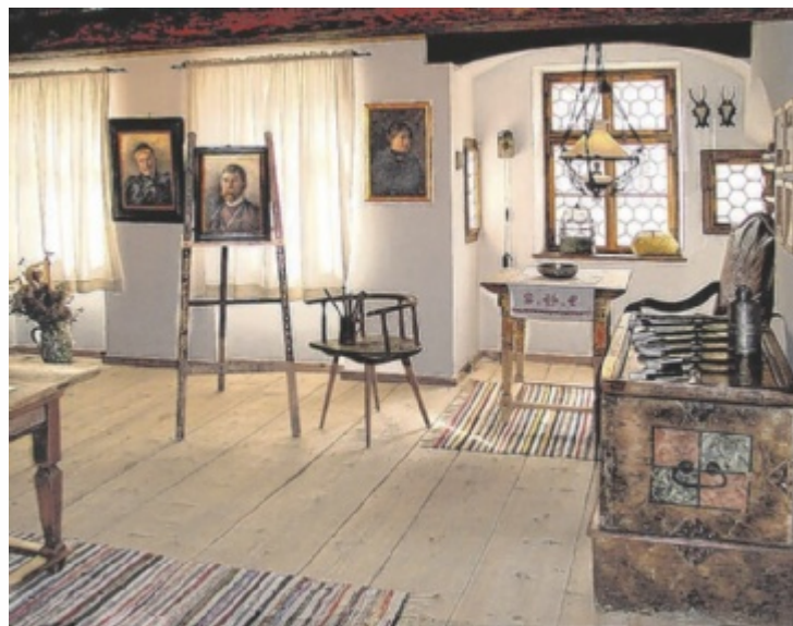
Einblicke in das dörfliche Leben der Donauschwaben bietet diese Gedenkstube.

Das Leben der Donauschwaben war geprägt von harter Arbeit, Gemeinschaftssinn und tief ver-