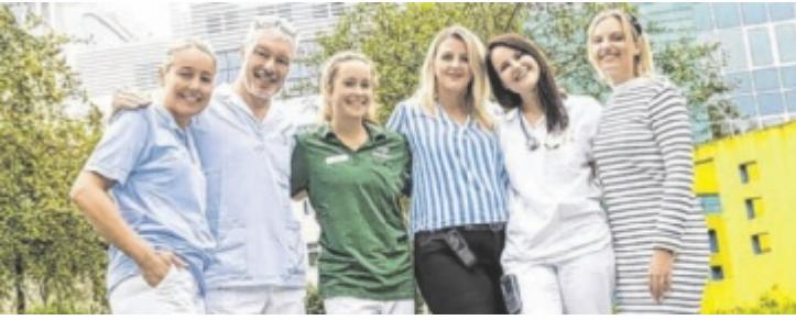
Das St. Josef zählt zu den beliebtesten Arbeitgebern des Jahres.