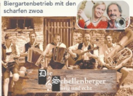
Die Schellenberger artig und echt

ab 9 Uhr: Weißwurst Fröhschoppen & Biergartenbetrieb mit den scharfen zwoa