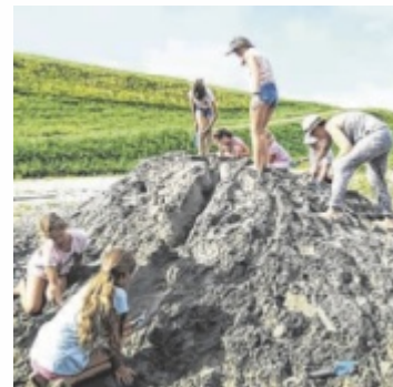
Gemeinsame Auszeit

Darüber hinaus warten weitere Highlights: Beim Flusserlebnis lernen Kinder spielerisch den Inn kennen, während die „Grenzgänger“-Exkursionen das beeindruckende Naturschauspiel des Auwaldes als „europäischen Dschungel“ erlebbar machen. Wer sich für Kräuter interessiert, kann diese bei einer Führung mit einer zertifizierten Kräuterpäd-