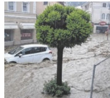
1. Juni 2016 in Simbach