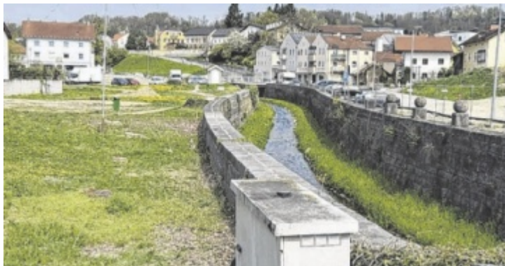
Rund zwei Jahre Bauzeit sind für die „grüne Mitte“ vorgesehen

Im Anschluss geht es weiter mit dem Setzen der Bohrpfähle. Los geht es auf Höhe von Cafe Leni, entlang der ehemaligen Metzge-