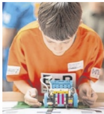
Schüler bauten Roboter.

Unter dem diesjährigen Motto „Chatbot – Programmierte Antworten zur Lösung von Anfragen“ entwickelten die Schüler kreative Lösungen und optimierten ihre Roboter laufend im Wettbewerb. Der Wettbewerb ist Teil der internationalen World Robot Olympiad und wird vom