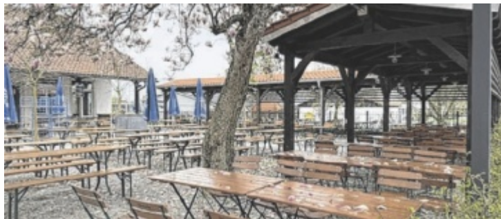
Im großzügigen Biergarten mit neuer Überdachung lässt sich gut feiern

Bei der Pflingstgaudi darf neben dem süffigen Bier und Brotzeit natürlich auch die passende Musik nicht fehlen. Im Bierhaus setzt man aber lieber auf begleitende Töne, bei denen auch eine Unterhaltung in normaler Lautstärke