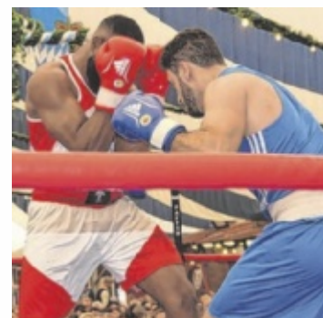
Pflingstsonntag wird geboxt

Der Boxkampf startet um 10 Uhr. Der BC Simbach hat sich außer dem sportlichen Erfolg auch vorgenommen die Zuschauermarkt zu knacken. Im letzten Jahr waren es 1.170 Zuschauer, dieses Jahr will man die 1.200er Marke knacken. Moderiert wird der Boxkampf fachkundig von Ringsprecher Detlef Amthor. ■