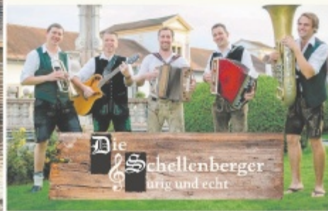
Die Schellenberger artig und echt