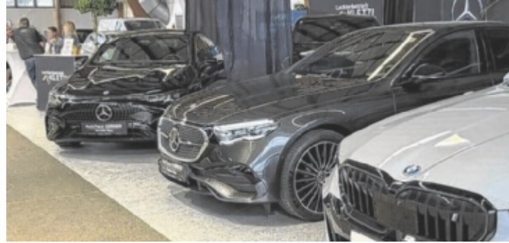
Der Braunauer Autosalon wird dieses Jahr um 500 Quadratmeter größer.

Der Autosalon wächst um 500 Quadratmeter und ist bereits ausgebucht. Neben etablierten Marken werden auch neue Anbieter präsentiert, darunter erstmals die Marke BYD. Für besonderes Interesse sorgt zudem die Premiere des Bundesheeres: Das Panzerregimentbataillon 13 aus Ried