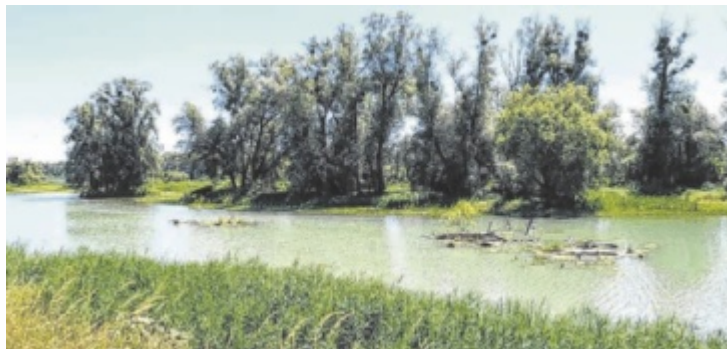
Ausflugstipp im Mai: eine Exkursion zur Aufhausener Lacke

Den Auftakt macht Anfang Mai eine Auen- und Vogelwanderung, bei der Besucher die erwachende Natur erkunden und mit etwas Glück seltene Vogelarten beobachten können. Auch die beliebten Auwaldwanderungen stehen wieder am Programm