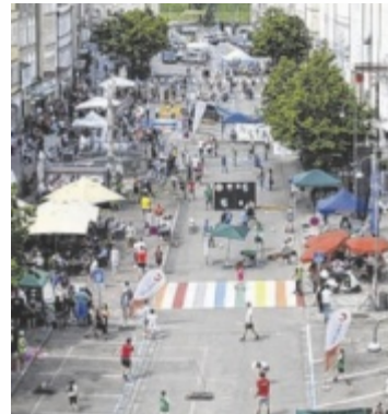
Hier kann man verschiedene Sportarten kennenlernen.

BRAUNAU. Der Braunauer Stadtplatz verwandelt sich beim „Tag des Sports“ am 31. Mai von 14 bis 18 Uhr wieder zu einem großen Sportplatz. Vereine aus Braunau und Simbach präsentieren ihr vielfältiges Angebot und laden Besucher ein, verschiedene Sportarten kostenlos kennenlernen und auszuprobieren.