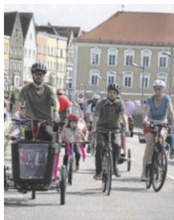
Gemeinsam radeln für mehr Rücksicht im Straßenverkehr für Radler

Bundesweit setzt sich das Bündnis für mehr Fahrradsicherheit im Straßenverkehr ein, vor allem für Kinder. In Simbach und Braunau organisieren UNS-FW sowie in Braunau das Team Braunau mobil den Umzug. Am Sonntag, 3. Mai, sind die Familien mit ihren Kindern zur Radl-Demo eingeladen. Treffpunkt ist um 14.30 Uhr am Aenus. Die Strecke führt, begleitet von der Polizei, über die Innstraße, Bahnhofstraße und Maximilianstraße zum Rathaus. Dort erwartet die Teilnehmer ein familienfreundliches Programm mit Hüpfburg und alkoholfreien Getränken. Als Highlight werden sechs Kinokarten verlost.