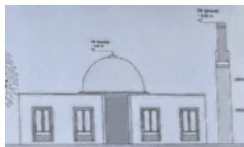
Vorentwurf der Moschee

SIMBACH. Groß war das Besucherinteresse bei der Bauausschusssitzung, denn auf der Tagesordnung stand der Antrag zum Bau einer Moschee.