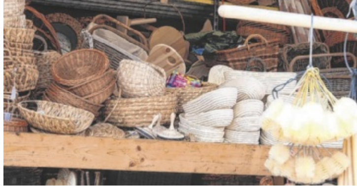
Korbwaren gehören zum klassischen Sortiment des Warenmarktes

Knapp 100 Stände füllen den Markt, der sich vom Bahnhof bis zum Festgelände erstreckt. Auch in Zeiten von Amazon und Supermärkten hat der traditionelle Warenmarkt nach wie vor seine Daseinsberechtigung, denn wo sonst wird einem demonstriert wie man Fenster richtig putzt, das Auto wächst, Ungeziefer effektiv abhält oder Zwiebeln und Karotten fein raspelt? Ein bunter Mix aus Kurzwaren, Spielzeug, Kleidung, Keramik, Mineralien, Tracht und Taschen wechselt sich ab mit Gewürzen, Rosswürsten, Obst, Gemüse und internationalen Spezialitäten. Da freut sich nicht nur Oma und opa auf den Markt, sondern auch