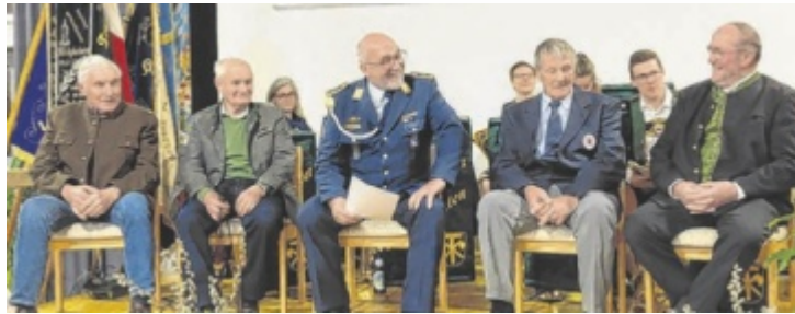
Eine lustige Talkrunde erinnerte an die Gemeindegemeinschaften Zusammenlegung

In ihrer Festrede blickte Moser ausführlich auf die Entstehung der Großgemeinde zurück. Im Zuge der Gebietsreform der 1970er Jahre kam es zu intensi-