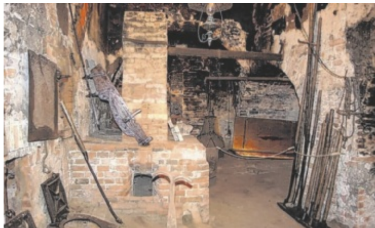
Diese originelle Rauchküche zeigt, wie früher gekocht wurde.