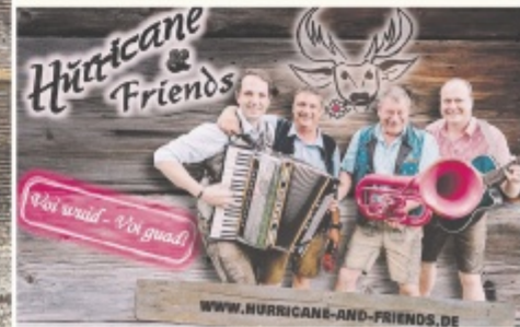
Hurricane & Friends Wir sind - Voi gaud!