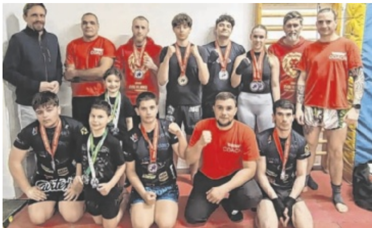
Stolze Medaillengewinner der Fightcrew