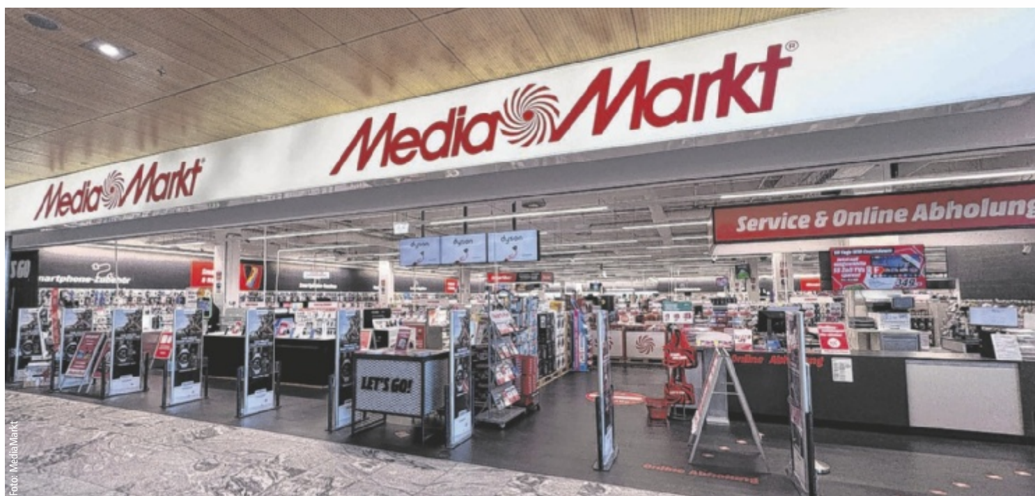
Bei Media Markt Wels im Max Center erwarten Kunden erstklassige Kaffeemaschinen, moderne Smartphones und persönliche Beratung für ein rundum stressfreies Einkaufserlebnis.