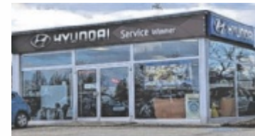
Autohaus Wimmer in Günskirchen

Bei Autohaus Wimmer steht der Mensch im Mittelpunkt. Die persönliche Betreuung, schnelle Lösungen und transparente Preise