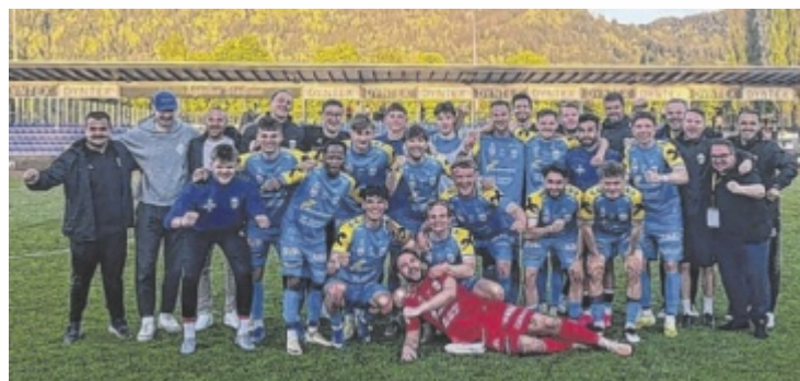
Das Team jubelt über den Klassenerhalt.