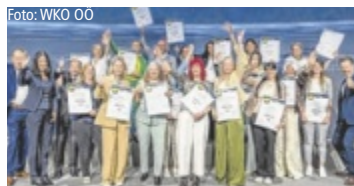
Die ausgezeichneten Direktberater des Masterclass-Vorgängerlehrgangs

OÖ. Mit der neuen Direktvertrieb Masterclass praxisnahes Know-how für den Start sammeln.