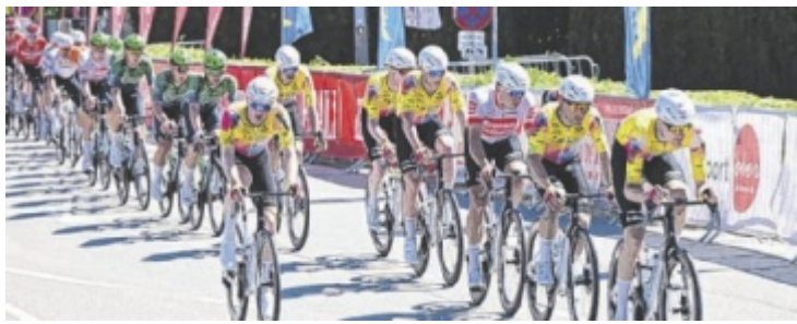
Zieldurchfahrt beim Eliterennen

den Sieg. Viele Zuschauer kamen, um die Fights zu sehen. Dass verschiedene Kampfsportarten parallel stattfanden, macht die Staatsmeisterschaft zu einer wichtigen Plattform für den gesamten Sport. Informationen zu Trainingszeiten gibt es unter www.fightcrew.at ■