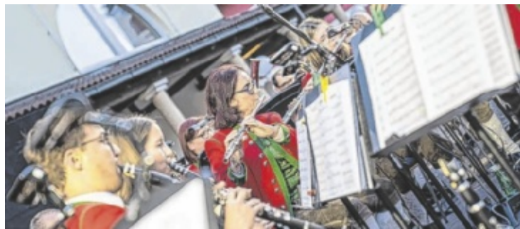
iMitreißenden Swing-Sound unter freiem Himmel genießen.