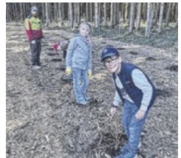
Stolz setzten die Kinder „ihre“ Bäume, die sie sicher wieder besuchen kommen.

Verhalten von Menschen, Tiere und Pflanzen im Wald und der Forstbetrieb Trummer erklärte, worauf man beim Pflanzen junger Bäume besonders achten muss und informierte über die verschiedenen Sorten in einem Mischwald. Das Projekt zeigte gut, wie wichtig es ist, schon früh ein Bewusstsein für Nachhaltigkeit und den verantwortungsvollen Umgang mit der Umwelt zu entwickeln. ■