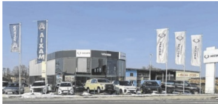
Autohaus Wimmer bietet Service und Reparatur für alle Marken.

Egal ob kleiner Service, größere Reparaturen oder komplexe Diagnosen: Das Team von Autohaus Wimmer bietet professionellen Werkstattservice für Fahrzeuge aller Marken. Mit geschultem Fachpersonal und modernsten Prüfgeräten ist das Auto hier in den besten Händen. Als Vertragspartner von KGM (ehemals SsangYong), AIXAM, dem führenden Herstel-