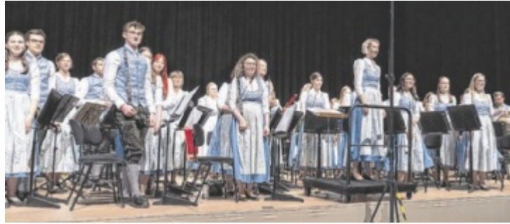
Stark wie nie: Die Trachtenkapelle Thalheim freute sich über 92,83 Punkte in der Wertungsstufe C.

Jeweils drei Stücke wurden von den Orchestern vorgetragen. Der Schwierigkeitsgrad der Stücke stieg mit der Leistungsstufe, die die Musikkapellen selbst wählten (von B bis E). Mit der höchsten Punktezahl wurde die Darbietung der Trachtenmusikkapelle Bad Wimsbach-Neydharting bewertet. 97,33 Punkte