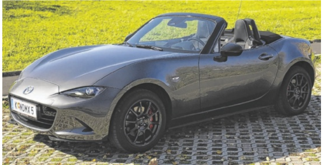
Der Mazda MX-5 ST 1.5L Skyactiv 6MT Homura ist ab 41.580 Euro zu haben.

„Homura“ steht für Top-Ausstattung. Es treffen Recaro Sportsitze in Leder-Alcantara Kombination, Brembo Bremsanlage und rote Bremssättel auf adaptive Matrix-LED Scheinwerfer, BOSE Soundsystem und Sitzheizung. Auch hat der Mazda alle gängigen und gesetzlich notwendigen Assistenzsysteme an Bord. Die Antwort auf die Sinnfrage nach Spurhalte- und