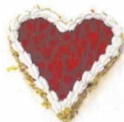
Erdbeerherz von Stöbich

WELS. Unter dem Motto „Von Herzen Danke sagen“ widmen sich die Konditoren der Bäckerei Stöbich jedes Jahr mit besonderer Liebe dem Muttertag.