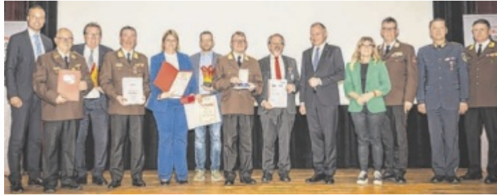
Zahlreiche Ehrungen wurden Kameraden und Partner vergeben.

Nur rund zehn Prozent dieser gewaltigen Stundenleistung fallen auf die 1.975 Einsätze des Jahres 2025 (617 Brand- und 1.358 technische Einsätze). Der weitaus größere Anteil fließt in Ausbildung (81.482 Stunden), Jugendarbeit (53.897), Bewerbe und Leistungsprüfungen (47.545) sowie Administration,