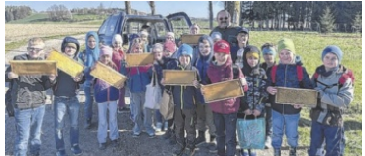
Der Imker erklärte den Volksschulkindern die Bedeutung der Bienen.

Gemeinsam mit Familie Knogler-Holzinger und der „Waldbildung Projekt GmbH“ durften die 1d, 2b, 2c, 2d, 4a und 4d bei der Aufforstung eines Waldstücks mithelfen. Mit großer Begeisterung pflanzten die Schüler ihre eigenen Bäume und leisteten damit einen wertvollen Beitrag für Umwelt und Klima. Daneben gab es noch Stationen, die den Tag besonders lehrreich machten: Ein Imker erklärte die Bedeutung der Bienen für das Ökosystem. Ein Jäger gab Einblicke in den Lebensraum Wald und seine Tiere. Eine Waldpädagogin übermittelte spielerisch das korrekte