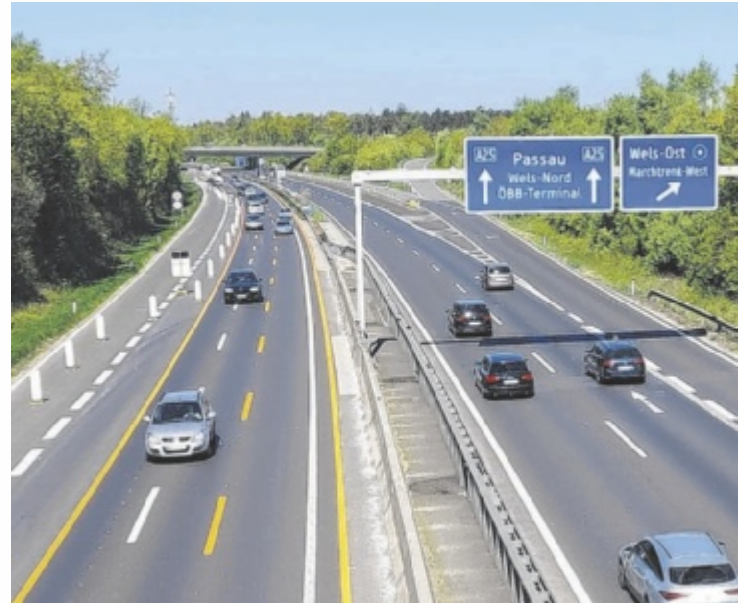
Blick auf den Autobahnanschluss Marchtrenk: Auf der Richtungsfahrbahn Knoten Haid sind die orangenen Markierungen schon aufgetragen.

Danach folgt die Richtungsfahrbahn Knoten Wels. Die endgültige Verkehrsfreigabe ist mit Ende August 2027 terminisiert. Zwei Fahrspuren bleiben immer