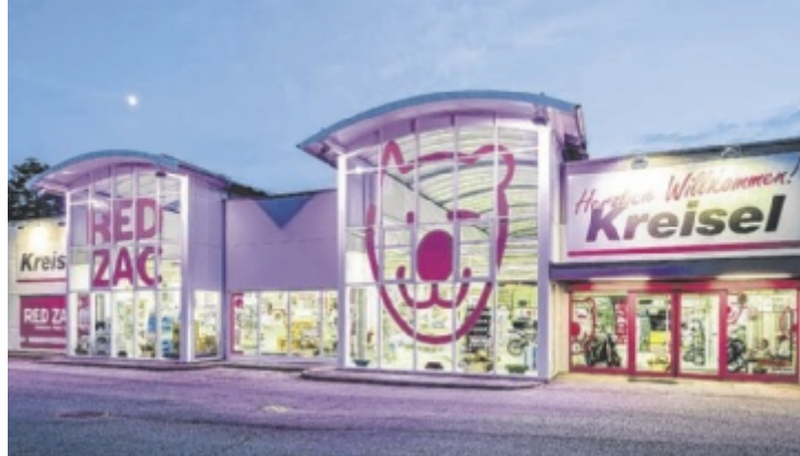
Red Zac Kreisel lädt zu den Robotertagen am 8. und 9. Mai nach Freistadt.

Mammotion hat sich mittlerweile als die meistverkaufte Marke für kabellose Mähroboter weltweit etabliert und setzt mit dem neuen Modell LUBA 3 technologische Maßstäbe. Das Herzstück der neuen Serie ist die innovative Tri-Fusion-Navigationstechnologie, die Satellitensignale (RTK), LiDAR-Lasersensoren und Vision-Technologie (Kamera) kombiniert. Dadurch orientieren sich die Geräte selbst unter Bäumen