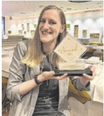
Voller Einsatz für besondere Tage: DasSee Event Exclusive in Feldkirchen an der Donau

FELDKIRCHEN. Großer Erfolg für DasSee Event Exclusive: Die renommierte Eventlocation in Feldkirchen an der Donau wurde für den WOW Award 2025 mit dem ersten Platz in der Kategorie „Location“ ausgezeichnet und zählt damit offiziell zu den besten Hochzeitslocations des Landes.