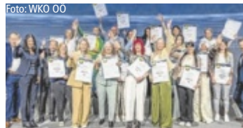
Die ausgezeichneten Direktberater des Masterclass-Vorgängerlehrgangs

Seit mehr als zehn Jahren bündeln das Gremium Direktvertrieb der WKO Oberösterreich und das WIFI OÖ ihr Know-how, um eine praxisnahe Ausbildung anzubieten, die im Geschäftsalltag wirklich weiterhilft. Die neue Direktvertrieb Masterclass umfasst vier kompakte Module – von Branchen- und Kaufverhaltensverständnis über fundierte rechtliche Grundlagen bis hin zu professioneller Kommunikation und einem selbstbewussten Auftritt. „Ob du gerade in die Selbstständigkeit startest oder dein Business weiterentwickeln willst – hier bekommst du praxisnahes Wissen und hilfreiche Orientie-