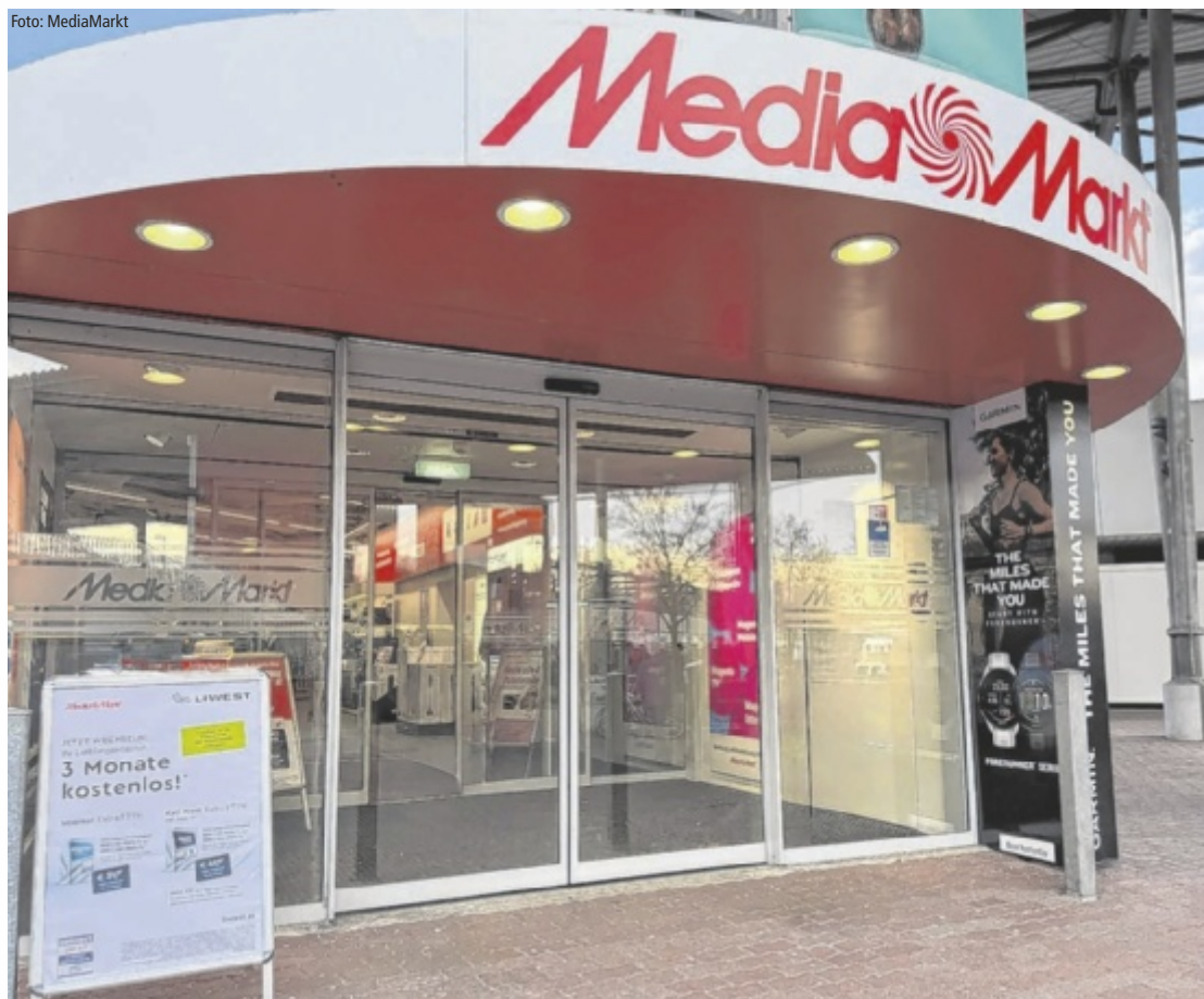
Wer zum Muttertag auf bleibende Begeisterung setzen möchte, findet bei MediaMarkt Linz Industriezeile passende Angebote.

Technik kann entlasten – und damit Zeit schenken. Innovative Lösungen von Dyson bieten leistungsstarke Luftreiniger für ein angenehmes Raumklima, intelligente Saugroboter für mehr Freizeit sowie durchdachte Haartrockner für schonendes, professionelles Styling zu Hause. Kaffeevollautomaten von JURA sorgen jeden Morgen für Barista-Qualität in der eigenen Küche. Kreative Back- und Kochideen gelingen mühelos mit Küchenmaschinen von Kenwood. Mit Fotodruckern von Canon entstehen hochwertige, brillante Ausdrucke in beeindruckender Qualität – schnell erstellt und gemacht, um ein Leben lang zu halten. Ob Familienmomente, Urlaubsbilder oder besondere Augenblicke: So werden digitale Fotos zu bleibenden Erinnerungen.