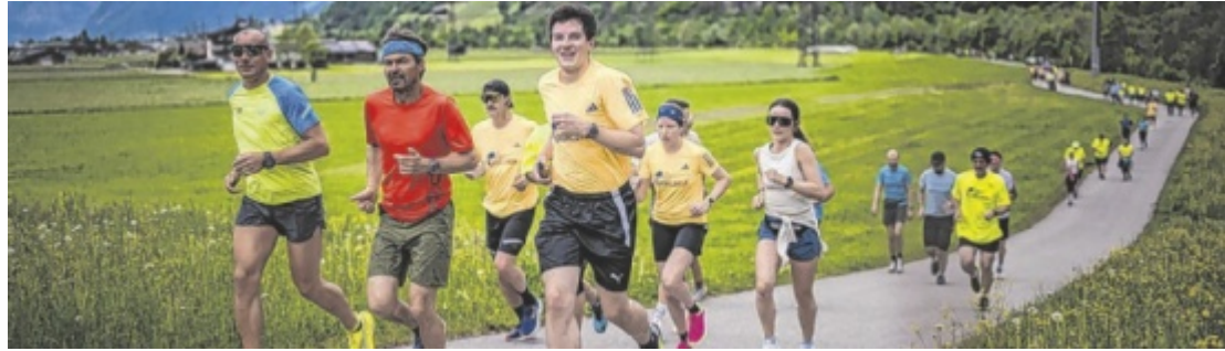
Lauf für die Forschung mit Starts auch im Bezirk Urfahr-Umgebung.

BEZIRK. Beim Wings for Life World Run am Sonntag, 10. Mai, gehen auch in Urfahr-Umgebung viele Teilnehmer an den Start. Der Lauf verbindet Bewegung mit einem klaren Ziel, nämlich die Forschung und Mitmenschen zu unterstützen. Denn alle Startgelder und Spenden fließen in die Rückenmarksforschung und helfen, eine Heilung für Querschnittslähmung zu finden.