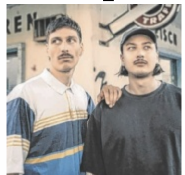
Mit dabei sind „Ende“.