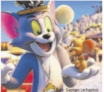
Tom und Jerry sind zurück!

In ihrem neuesten Abenteuer beweisen Tom und Jerry, dass sie auch nach Jahrzehnten nichts von ihrem Charme verloren haben – auch wenn sie diesen diesmal weit abseits ihres gewohnten Wohnzimmers versprühen.