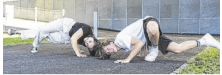
Mit Mai startet ein kostenloses Bewegungsangebot für Jugendliche.

Ein Hip-Hop- und Commercial-Tanzkurs startet am Mittwoch, 6. Mai, um 16.30 Uhr in der Keplerhalle am JKU Gelände. Trainer der SU Synergy Dance Linz lehren verschiedene Grooves, Tanztech-