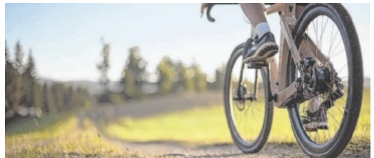
Viele Events rund ums Bike gibt's von 4. bis 7. Juni.

Ein besonderer Höhepunkt im Veranstaltungsreigen quer durch das Mühlviertel wird am Samstag, 6. Juni, in Aigen-Schlägl stattfinden. Das weltgrößte Fahrradklingel-Orchester soll um 13 Uhr am Stiftsgelände des Stiftes Schlägl erklingen. Vereine, Grup-