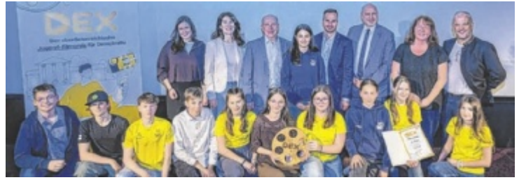
Strahlende Gesichter bei der Mittelschule Ottensheim.