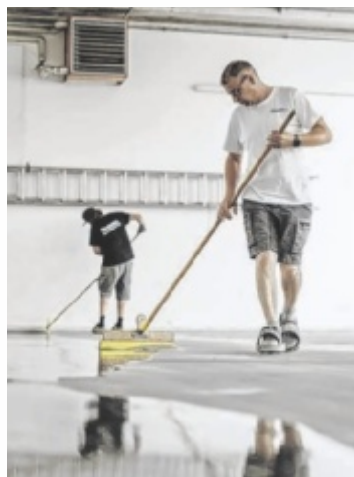
Garagenbeschichtungen schützen, sind pflegeleicht und langlebig.

Mit einem erfahrenen Team werden Projekte im privaten und gewerblichen Bereich umgesetzt – zuverlässig, langlebig und optisch ansprechend. Floorex bietet Beschichtungen aller Art – von Kellerräumen bis hin zu großflächigen Tiefgaragen und Industriehallen. Zusätzlich umfasst das Leistungsspektrum Balkonbeschichtungen, Betonsanierungen sowie Estrich- und Dämmarbeiten. Aktuell liegt ein besonderer Fokus auf dem Sanierungsbereich. Oft realisiert Floorex dabei Komplettlösungen, etwa bei der Garagensanierung: Vom Entfernen und Entsorgen des bestehenden kaputten Oberbelags, Flämmen, den Einbau eines neuen