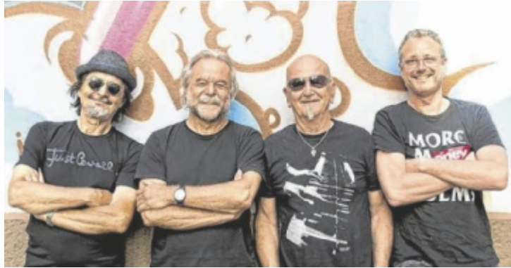
Am 12. Mai bringen The Recyclers den Sound der 1960er- bis 1980er-Jahre auf die Bühne des Café & Bistro Kowalski in Gallneukirchen.