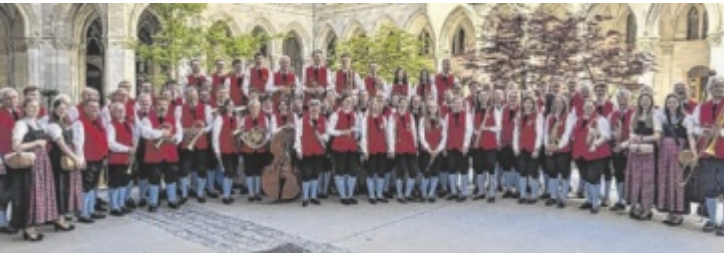
Blasmusik in Wien: Podestplatz für Kapelle aus Bad Leonfelden

„Prager Gassen“ und der Marsch „Sympatria“. Die Jury bewertete die Darbietungen. Am Ende erreichte die Kapelle aus Urfahr-Umgebung den dritten Platz und erhielt eine Querflöte als Preis. Die Bad Leonfeldner Musikkapelle hat, als würdiger Vertreter Oberösterreichs im nationalen Blasmusikbereich, in der Bundeshauptstadt wieder einmal ihr Können unter Beweis gestellt. ■