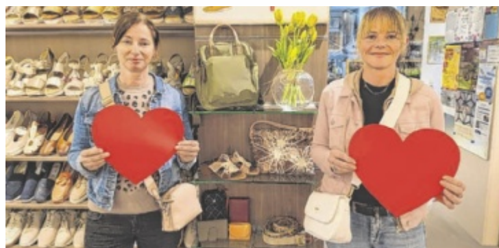
Schuhe, Taschen und vieles mehr: Geschenkideen zum Muttertag

cessoires wie Gürtel und Geldbörsen in vielen Trendfarben. Wer die Wahl lieber der Mama überlässt, greift zu den beliebten Gutscheinen oder Gutscheinnunzen. Das Team berät gerne persönlich und hält in der Woche vor Muttertag eine kleine süße Überraschung für alle Mütter bereit. Infos auf www.neundlinger.at oder Social Media, schuhe@neundlinger.at , Tel. 07217 6014 ■ Anzeig