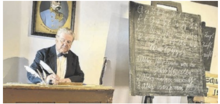
Einblick in den historischen Schulalltag: Im OÖ. Schulmuseum Bad Leonfelden wird eine Schulstunde aus vergangenen Zeiten lebendig.

Das OÖ. Schulmuseum zählt zu den ältesten erhaltenen ehemaligen Schulgebäuden des Landes