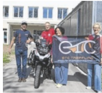
Motorradtreffen am 1. Mai für den guten Zweck in Gallneukirchen.

Neben dem gemeinsamen Start in die Saison steht auch der gute Zweck im Mittelpunkt. Alle dabei erzielten Spenden kommen bedürftigen Menschen zugute. Zuletzt spendeten die beiden Motorradclubs ETC-Treffling