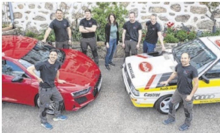
Das Team von Auto Prammer in Neumarkt im Mühlkreis

Der Betrieb, spezialisiert auf Fahrzeuge der Marken VW, Audi und Škoda, erweitert damit sein Leistungsangebot und bietet Kunden noch präzisere und effizientere Lackierarbeiten. Ein besonderes Augenmerk wurde bei der neuen Lackierbox auf die Energieversorgung gelegt: Beheizt wird diese mittels einer umweltfreundlichen Hackschnitzelheizung – das Holz dafür stammt aus dem eigenen Wald. Ergänzend kommt eine Stromheizung zum Einsatz, wenn ausreichend Energie aus der betriebseigenen