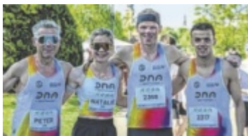
Team der SU Bad Leonfelden