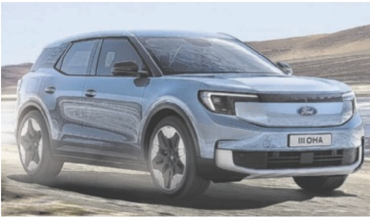
Der neue Ford Explorer Electric Standard Range hat eine Reichweite von bis zu 378 Kilometer.