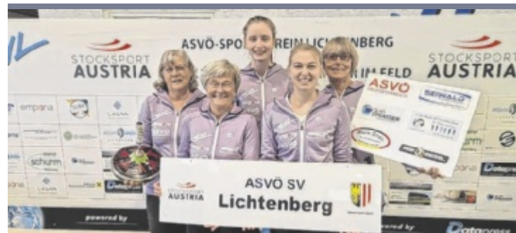
Traumdebüt Aufsteiger ASVÖ SV Lichtenberg fegte in der Stocksport Staatsliga der Damen den ESV Lustenau mit 8:2 vom Asphalt. Dank einer extrem niedrigen Fehlerquote ließen die Mühlviertlerinnen den Gästen keine Chance.

Kleinzell wird am Pfingstwochenende wieder zum Treffpunkt für Mountainbiker aus ganz Österreich und darüber hinaus. Bereits zum 24. Mal findet der „Raiffeisen Granitmarathon“ heuer am 23. und 24. Mai statt und blickt damit auf ein Vierteljahrhundert voller sportlicher Highlights zurück. Die beeindruckende Landschaft und die anspruchsvollen Strecken machen das Rennen nicht nur für die