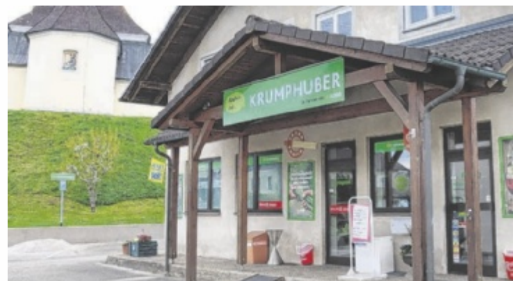
Das Kaufhaus liegt unterhalb der Pfarrkirche in der Kremsmünsterer Straße 8. Weil die Betreiberin in Pension geht, wird am 27. Juni geschlossen.