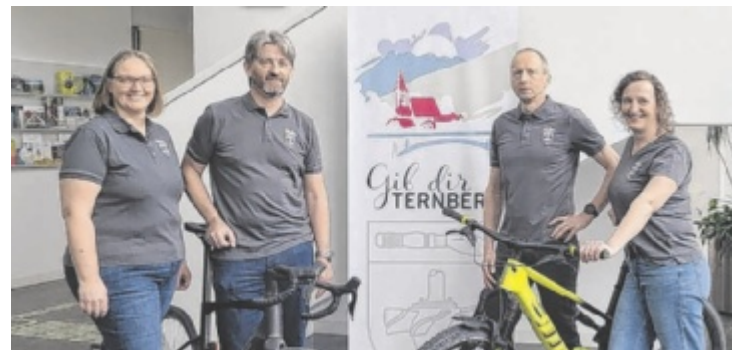
Durch das Dienstradleasing können Mitarbeiter der Gemeinde Ternberg bei der Anschaffung eines Rades steuerlich profitieren.