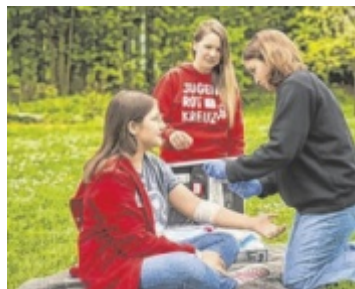
Ausbildung junger Menschen in Erster Hilfe.

20.–22. Juli, VS Großraming 5–14 Jahre, Anmeldung ab 11. Mai, 18 Uhr; Teilnahme: 25 Euro Infos: www.kinderuni-ooe.at