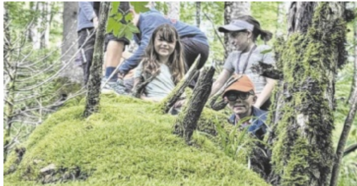
Kinder erkunden bei den Science Holidays Steyr den Nationalpark.

Die insgesamt fünf Tage dauernden Science Holidays Steyr von Montag, 20. Juli, bis Freitag, 24. Juli, führen acht- bis zwölfjährige Teilnehmer in die einzigartige Wildnis des Nationalpark Kalkalpen. Treffpunkt ist bei der Fachhochschule in Steyr. Die Gruppe verbringt mit erfahrenen Rangern drei aufschlussreiche Tage im Wald und erforscht Tiere, ihre Spuren, Pflanzen und Bäche. Die KinderUni Ennstal findet von Montag, 20. Juli, bis Mittwoch, 22. Juli in der Volksschule Großraming statt und lädt Kinder von fünf bis 14 Jahren dazu ein zu experimentieren, zu bauen und zu ge-