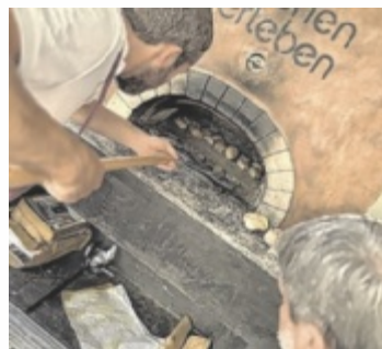
Vor Ort wird gebacken.