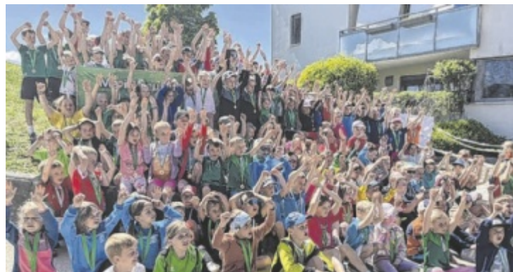
Der Wickie-Kinderlauf-Cup startet in Maria Neustift. Weitere Stationen sind Weyer, Großraming und Gaflenz.