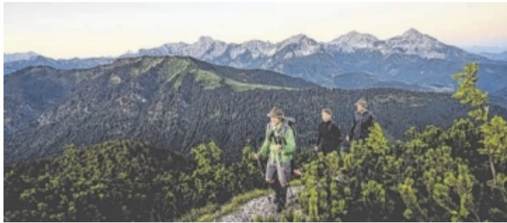
Anfang Mai startet die Besuchersaison im Nationalpark Kalkalpen.

Das Interesse an geführten Programmen ist weiterhin hoch. 2025 nahmen 10.700 Personen an Ranger-Touren, Mehrtagesangeboten und Fachveranstaltungen teil. Laut Nationalpark-Direktor Josef Forstinger wächst in einer zunehmend schnelllebigen Zeit das Bedürfnis nach unmittelbaren Naturerfahrungen. Der Nationalpark sei dafür ein geeigneter Raum. Das diesjährige Sommerprogramm umfasst sowohl familienfreundliche Angebote als auch intensive Naturerlebnisse. Neu sind unter anderem Führungen zur Vogelstimmenbestimmung, kombinierte Rad- und Wandertouren sowie Veranstaltungen zur