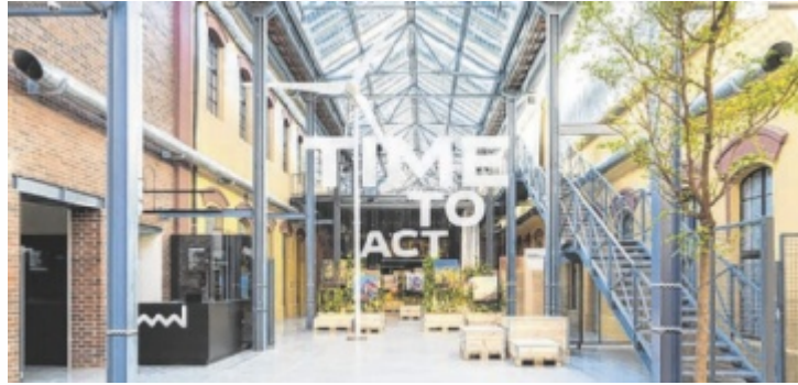
Im Rahmen des Steyrer Klimafestes kann im Museum Arbeitswelt am 9. Mai die Ausstellung „Energiewende“ kostenfrei besucht werden.

In Steyr bietet das Museum Arbeitswelt im Rahmen des Klimafestes am Samstag, 9. Mai, freien Eintritt in seine Ausstellung „Energiewende“. Im Stadtmuseum steht am Mittwoch, 6.