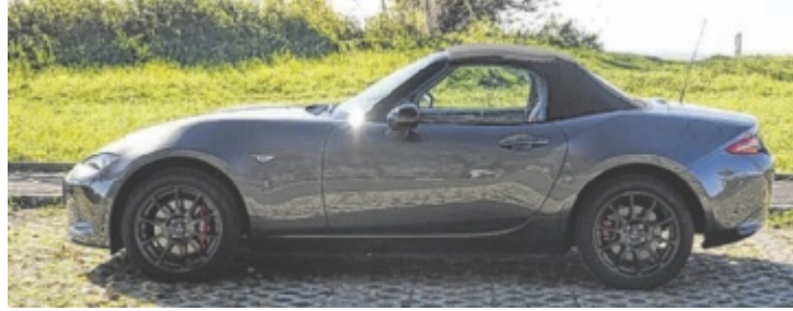
Der neue Mazda MX-5 ST 1.5L Skyactiv 6MT Homura

Getan hat sich natürlich trotzdem einiges: Mittlerweile gibt es neben einem Soft-Top auch eine Hard-Top-Variante. Dafür fiel der für einige Jahre erhältliche 184 PS starke 2.0 Liter Benziner zuletzt den neuen CO 2 -Grenzwerten zum Opfer. Die Testfahrer von Fahrfreude.cc feiern das G132 Soft-Top-