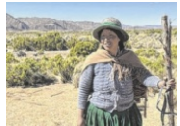
Aktivistinnen berichtet in Steyr über das Leben im Altiplano.

Fans zusammen. Der Fokus liegt auf echtem Feuer mit Holz und Holzkohle. Firmen zeigen den Bau von Schamotte- und Lehmöfen live vor Ort. Besucher sehen Aufbau, Befuerung und Backergebnis, regionale Betriebe präsentieren zudem Tischherde sowie Kamin- und Kachelöfen und mehr.