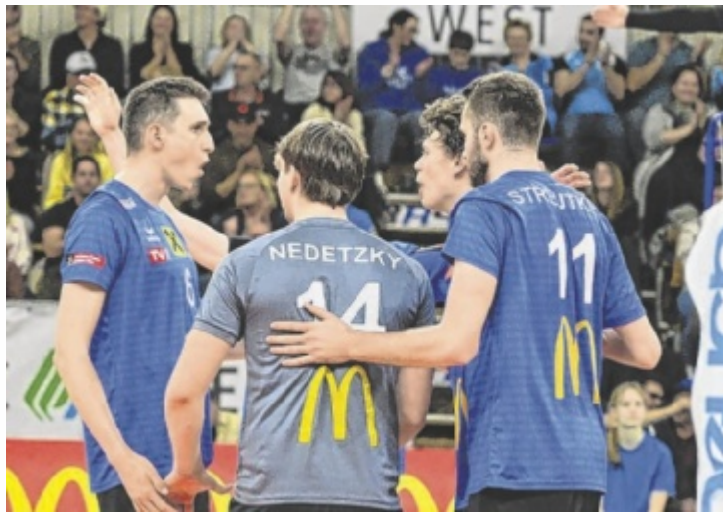
Der Finaleinzug ist der größte Erfolg des UVC McDonald's Ried.

Sollte der UVC Ried dieses Match in Hartberg gewinnen, ist die Entscheidung vertagt. Dann findet zumindest noch ein Spiel am Freitag, 1. Mai, um 20.20 Uhr