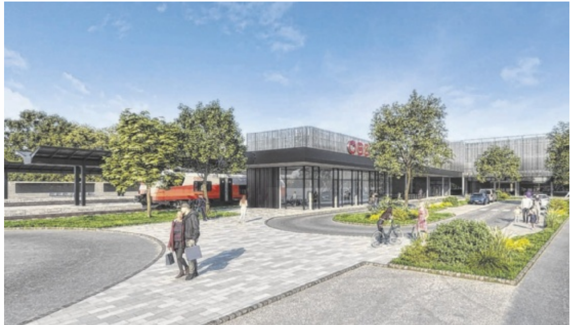
Visualisierung des neuen Bahnhofs in Ried

Damit setzen die ÖBB einen weiteren Schritt für den zukunftsorientierten Streckenausbau in Oberösterreich. Die Bundesbahnen investieren 87,3 Millionen Euro in die Elektrifizierung der Innkreisbahn. „Mit der Elektrifizierung der Innkreisbahn setzen wir einen wichtigen Impuls für die Weiterentwicklung des regionalen Zugverkehrs in Oberösterreich. Gerade in