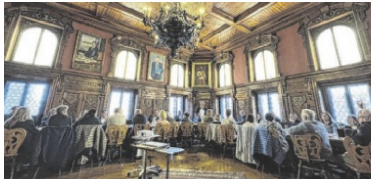
Der Gemeinderat beschloss Investitionen in Millionenhöhe.