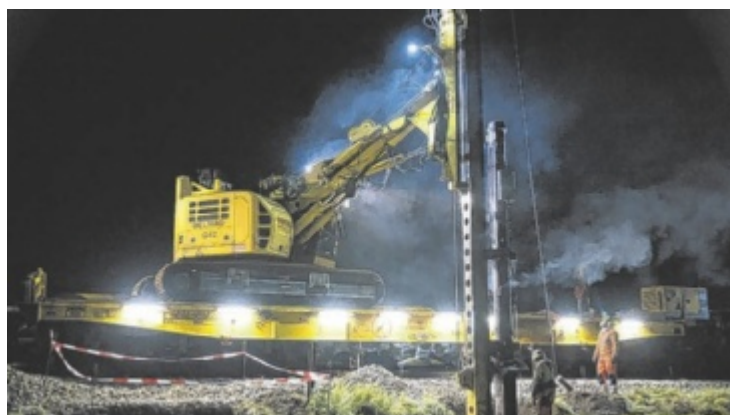
Der Großteil der Arbeiten für die Elektrifizierung findet nachts statt.

Während der Bauzeit müssen sich Fahrgäste allerdings auf Einschränkungen einstellen. Zwar soll der Betrieb großteils aufrechterhalten bleiben, dennoch sind temporäre Streckensperren, Schienenersatzverkehr und längere Fahrzeiten in einzelnen Bauphasen unvermeidbar. ■