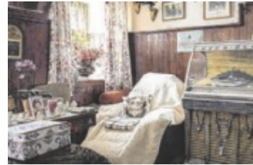
Das Bild zeigt einen Blick ins Gasthaus Koller in Mehrnbach – zu sehen in der aktuellen Ausstellung.

„Jo Hawedere! Wirtshaus trifft Museum“ lautet das Motto am 8. Mai im Museum Innviertler Volkskundehaus. Im Zuge der Ausstellung „Im Wirtshaus bin i wia z'Haus“ wird von 14 bis 21 Uhr alles geboten, was so ein Wirtshaus ausmacht. Vom Pop-Up-Gastgarten mit Schmankerln vom KUHB:K über zünftige Live-Musik und einer Kegelbahn bis zu launigen Führungen durch die Wirtshausausstellung.