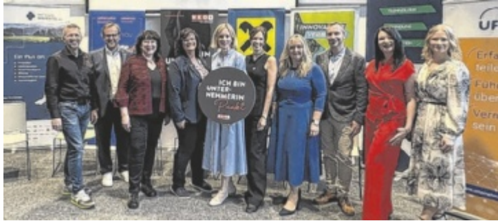
Experten aus Wirtschaft, Bildung und Netzwerk diskutierten über die Chancen von InnRaum 3 .

RIED/SCHÄRDING/PASSAU. Frau in der Wirtschaft Ried und Schärдинг sowie die UnternehmerFrauen im Handwerk Passau luden zur Veranstaltung „KI trifft InnRaum 3 – Innovation über Grenzen hinweg“ ins Raiffeisen Techno-Z Schärдинг ein.