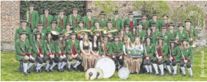
Die Ortsmusik St. Marienkirchen/H. spielt ihr Wunschkonzert am 2. Mai.