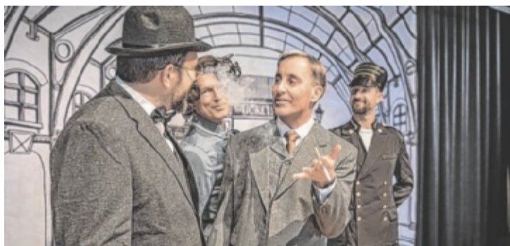
Die Proben für die Premiere laufen auf Hochtouren.

Die Geschichte ist schnell erzählt – und steckt doch voller Überraschungen: Der luxuriöse Orientexpress ist unterwegs durch Europa, als in einer verschneiten Nacht ein Mord geschieht. Die Weiterfahrt ist unmöglich, der Täter muss sich noch an Bord befinden. Jeder Fahrgast scheint etwas zu verbergen, jeder könnte ein Motiv