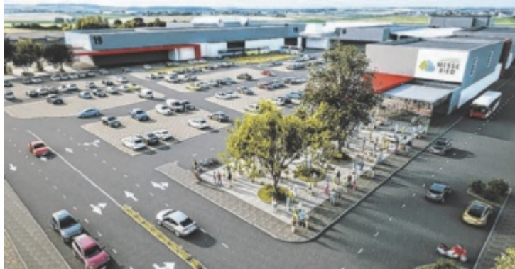
Visualisierung des modernisierten Messezentrums Ried

Der Eingangsbereich rund um Halle 12 ist baulich und funktional veraltet. Mit Blick auf das