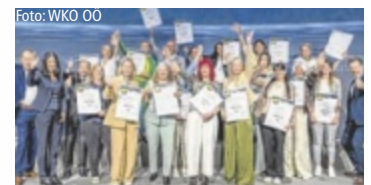
Die ausgezeichneten Direktberater des Masterclass-Vorgängerlehrgangs

Seit mehr als zehn Jahren bündeln das Gremium Direktvertrieb der WKO Oberösterreich und das WIFI OÖ ihr Know-how, um eine praxisnahe Ausbildung anzubieten, die im Geschäftsalltag wirklich weiterhilft. Die neue Direktvertrieb Masterclass umfasst vier kompakte Module – von Branchen- und Kaufverhaltensverständnis über fundierte rechtliche Grundlagen bis hin zu professioneller Kommunikation und einem selbstbewussten Auftritt. „Ob du gerade in die Selbstständigkeit startest oder dein Business weiterentwickeln willst – hier bekommst du praxisnahes Wissen und hilfreiche Orientie-