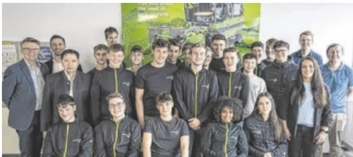
Die Sponsorentafel im Hintergrund schmückt künftig die Rückwand des Klassenzimmers.