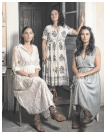
„Sistas“ stellen im KiK ihr Album „Forward to the Roots“ vor.