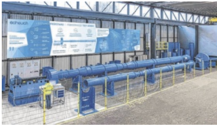
Das neue Prüfstandzentrum in Auroldmünster ist eine von vielen Investitionen in die Entwicklung und Fertigung.

Mit neuen Prüfständen kann das Unternehmen Ventilatoren und weitere Bauteile künftig noch genauer testen. Insgesamt sind bis 2030 Investitionen von rund acht Millionen Euro in den Standort geplant. In Auroldmünster wurde ein neues Prüfstandzentrum aufgebaut, in dem Ventilatoren unter realitätsnahen Bedingungen getestet werden. Leistung, Energieverbrauch und Geräuschverhalten können dabei exakt gemessen werden. Die gewonnenen Daten helfen dabei, Produkte gezielt zu optimieren.