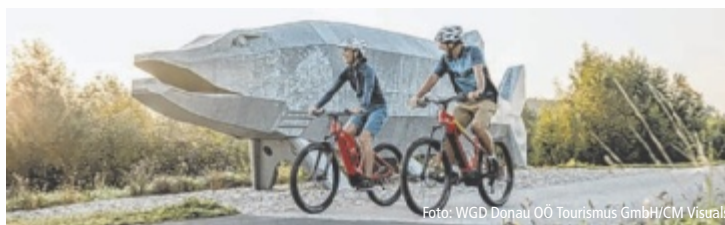
Beim „Genussradeln“ lässt sich die Region besonders gut erkunden.

In Mitterkirchen ist der Startpunkt für die „Alpenblickrunde“. Durch die Machlandebene fährt man bis Auhof und von da über Pergkirchen zu einem