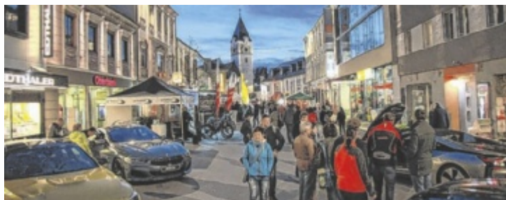
Persönliche Kontakte sollen bei der Einkaufsnacht im Fokus stehen.

Die Fachgeschäfte öffnen an diesem Tag unter dem Motto „Freizeit, Mode und Motoren“ ihre Türen. Das soll dazu anregen, die Zeit zu nutzen und durch die Innenstadt zu bummeln. Der öffentliche Raum in der Herrenstraße und am Hauptplatz wird an diesem langen Einkaufstag zur Ausstellungsfläche: Regionale Autohäuser und Fahrradspezialisten präsentieren, wie dynamisch sich der Fahrzeugsektor