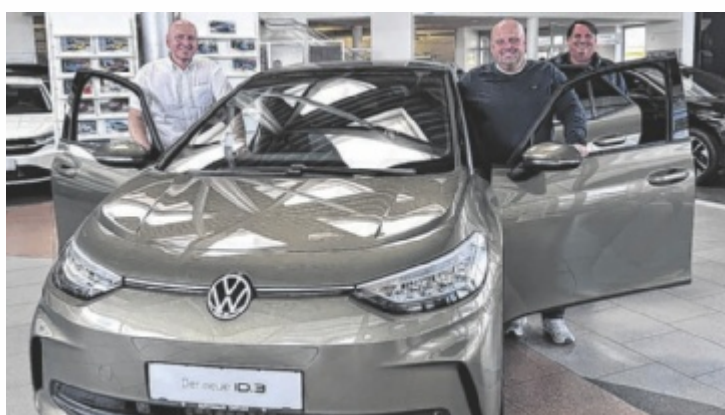
Große Fahrzeugausstellung am 8. Mai in Stadtzentrum von Perg

Um Platz für die rund 50 Fahrzeuge der Autohändler sowie von Fahrrädern, Motorrädern und Oldtimern zu schaffen, wird ab 13 Uhr die Herrenstraße zwischen Stadthaus und Hauptplatz für den Durchzugsverkehr gesperrt. Gesperrt werden auch der Hauptplatz Süd und Ost. Von der Bahnhofstraße kann der Verkehr in einer Einbahn über der Hauptplatz West abfließen; lokale Umleitungen werden eingerichtet. Die Bus-Haltestelle Herrenstraße wird ab 13 Uhr nicht mehr bedient. Neben neun Autohäusern aus dem Bezirk Perg nutzt auch Sport Mayr