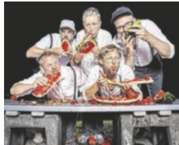
5/8erl in Ehr'n sind am 15. Mai live in Klam zu erleben.