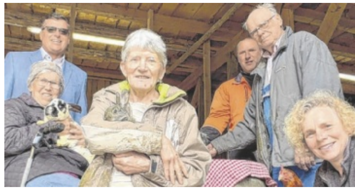
Ein Begegnungszentrum für Senioren entsteht.