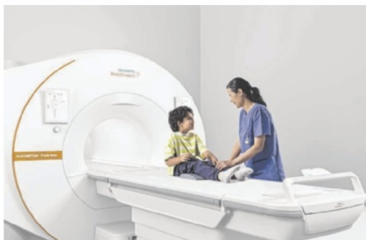
Ressourcenschonende MRT-Technologie mit KI-Unterstützung in Perg

Mit der Investition in ein modernes Magnetresonanztomographie (MRT)-System sowie ein zusätzliches CT (Computertomographie) wird das bisherige MR Zentrum Perg zu einem umfassenden Zentrum für bildgebende Diagnostik ausgebaut. Patienten sollen dadurch künftig wohnortnah von einem erweiterten radiologischen Angebot profitieren. Im Zentrum des neuen Angebots steht ein besonders modernes MRT-System,