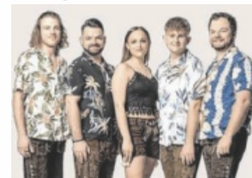
Die „Heckenklescher“ sorgen für Partystimmung.

Los geht es am Freitag ab 19 Uhr (Einlass 18.30 Uhr). „D'Aushüfn“ werden für ein stimmungsvolles Warm-up sorgen, bevor die „PartyHirschen“ dem Publikum in der Beach-Party-Arena so richtig einheizen. Weiter geht es am Samstag, ab 20 Uhr (Einlass 19.30 Uhr), mit einer Eventnacht mit den Heckenkleschern. Am Sonntag, 3. Mai, findet in Windhaag bei Perg am Vormittag um 9.30 Uhr zuerst das Maibaumsetzen der ÖVP statt. Anschließend lädt die Bürgerkorpskapelle Windhaag zum Beach-Party-Frühschoppen ein. Das Jugendorchester P&P