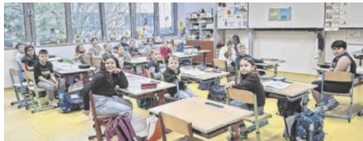
Große Freude über die neuen Räumlichkeiten der Volksschule Perg.

Der bestehende Schulbau wurde aufgestockt und um acht neue Klassenräume mit Bewegungsraum und Sanitärräumen erweitert. Weiters wurden die Räumlichkeiten der Nachmittagsbegleitung umgebaut und erneuert, das betraf auch teilweise die bestehenden Klassenräume. Ein neuer hofseitiger Zugang mit einem integrierten Garderobentrakt sorgt für eine zeitgemäße und funktionale Erschließung des Gebäudes. Die Planung wurde von der Firma Oppenbauer übernommen, während die Baumeister- und Zimmererarbeiten von