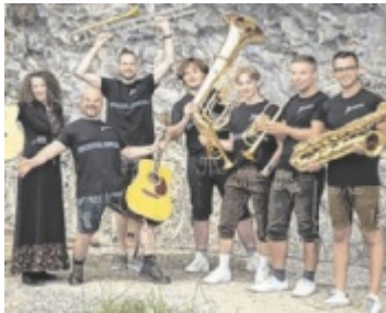
„Bluatschink spielt Blasschink“ am 14. Mai im Meierhof