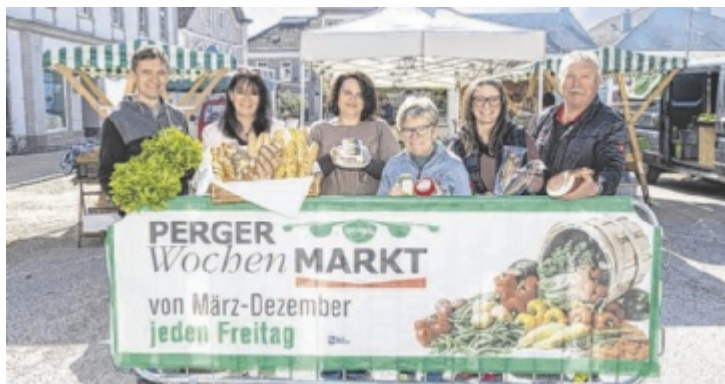
Der Perger Wochenmarkt lockt mit regionalen Köstlichkeiten.

Die Nähe macht den Unterschied: Man trifft sich beim Wochenmarkt in Perg, tauscht Rezepte aus und nimmt ein Stück echte Heimat mit nach Hause. Die Marktbesucher schätzen am Perger Wochenmarkt die Lebensmittel, zu deren Geschichte sie mit den Anbietern persönlich