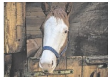
Premiere in Steyregg