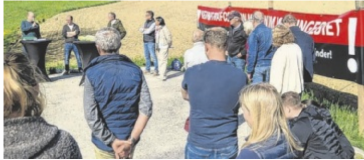
Gegenwind für Trafo im Wohngebiet an der Spitzfeldstraße in Grein

GREIN. Im Wohngebiet an der Spitzfeldstraße in Grein ist die Errichtung eines Transformators geplant. Gegen dieses Vorhaben regt sich Widerstand seitens der Anrainer. Daher lud die Gemeinde vergangenen Donnerstag zu einer Zusammenkunft, um Bedenken und Einwände gemeinsam zu besprechen.