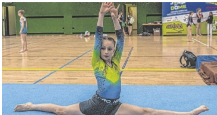
Die Turn10-Landesmeisterschaft begeisterte das Publikum.