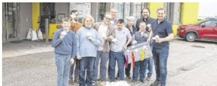
Die Lebenshilfe Werkstätte Perg kümmert sich um den Maibaum.