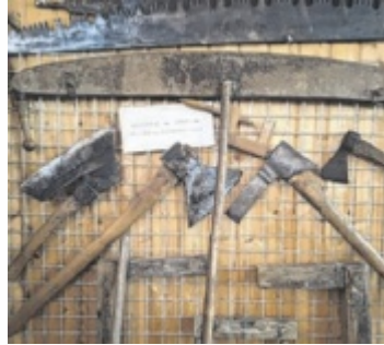
Einblicke ins Handwerk.

Den Anfang macht am Sonntag, 3. Mai, Hubert Derntl – er gibt einen umfassenden Einblick in die Holzbearbeitung. Dabei entstehen Hackenstiele, Sensen werden gedengelt und aus Nüssen werden kleine Schätze gefertigt. Für das leibliche Wohl ist bestens gesorgt. ■