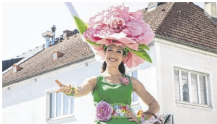
Die Stadtgemeinde Perg lädt wieder zum Einhornfest.

sorgen zahlreiche Mitmachstationen für jede Menge Abwechslung und laden dazu ein, selbst aktiv zu werden. Unter anderem gibt es Bastelstationen, Kinderschminken, Tattoo-Sprühen sowie sportliche Herausforderungen. Auch die Polizei gibt einen Einblick in ihren Alltag – um ein paar Highlights zu verraten. ■