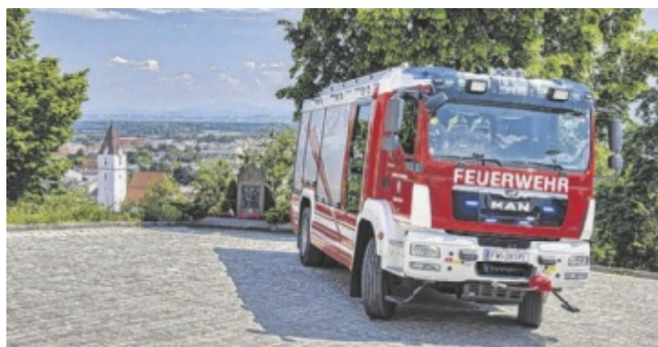
Die Freiwillige Feuerwehr der Stadt Perg lädt in ihr Einsatzzentrum.

stück der Freiwilligen Feuerwehr der Stadt Perg fertiggestellt. Beim Tag der offenen Tür gibt es die Möglichkeit, bei einer Hausführung die neuen Räumlichkeiten zu besichtigen. Zudem wird eine Fahrzeugausstellung geboten. Für das leibliche Wohl der Besucher und überdachte Sitzmöglichkeiten wird gesorgt. ■