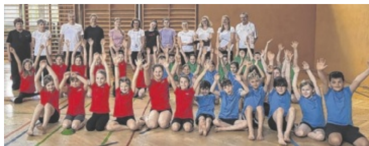
31 Kinder meisterten „Beweg dich schlau“-Qualifier-Event in Mauthausen.

gen Fähigkeiten stärken. In Mauthausen traten 31 Kinder der dritten und vierten Klassen der Volksschule, aufgeteilt in fünf Teams, in abwechslungsreichen Bewerbungen gegeneinander an. Am Ende holte sich das Team „Die, die sich schlau bewegen“ den Tages-sieg. Mit ihrer Leistung qualifizierten sich die jungen Sportler für das Landesfinale am 13. Juni in Bad Wimsbach. Dort kämpfen sie um einen begehrten Startplatz beim Bundesfinale. ■