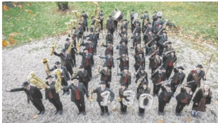
Der Musikverein Pergkirchen feiert sein 130-jähriges Bestehen.