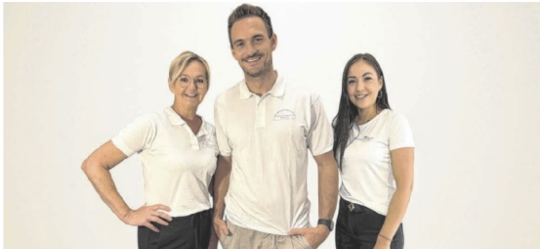
Das Team in Perg begleitet Kunden mit modernen Anwendungen auf dem Weg zu ihren Zielen.

„Abnehmen im Liegen“ bietet eine innovative Möglichkeit, gezielt Körpermitte zu reduzieren – ganz ohne schweißtreibendes Training. Die spezielle Ultraschalltechnologie öffnet Fettzellen, aktiviert den Stoffwechsel bis zu 24 Stunden und