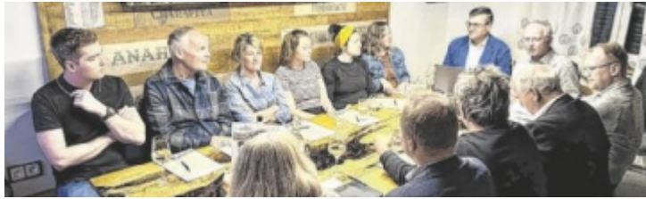
Neue Ideen für die Leader-Region wurden gesammelt.

KATSDORF. In inspirierender Atmosphäre fand in der Chili-Manufaktur „Mühlviertler Feuerzeug“ in Katsdorf die Sitzung des Leader-Projektauswahlgremiums statt. Zahlreiche Projekte wurden dabei präsentiert.