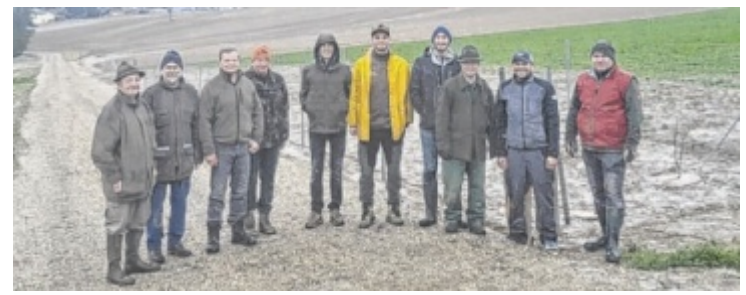
In Lanzenberg in Perg wurden rund 300 Bäume und Sträucher gepflanzt.