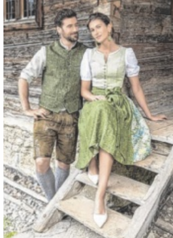
Trachtenmode SCHMID lädt zur Trachten-Outlet-Woche von 2. bis 9. Mai nach Unterweißenbach.

An diesen Tagen erwartet Besucher ein besonderes Einkaufserlebnis auf rund 1.000 m 2 Verkaufsfläche. Geboten wird eine Vielfalt aus über 70 Marken und Labels im Trachtenbereich. Ein Highlight ist die Aktion „Ihr persönliches Lieblingsteil“ mit minus 25 Prozent auf ein Lieblingsteil. Diese Aktion gilt auch auf neue Kollektion. Weitere Rabatte beziehen sich auf gekennzeichnete Outlet-Ware, Einzelstücke und Kollektionsabverkäufe. Ab einem Ein-