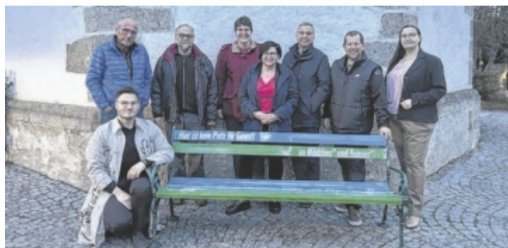
Gemeinsam mit der Pfarre sowie allen Fraktionen des Gemeinderates wurden in Arbing die 19. und 20. StoP-Parkbänke im Bezirk Perg errichtet.

Bewusstsein in der Bevölkerung zu schärfen und Betroffene zu ermutigen, Hilfe in Anspruch zu nehmen. „Unser gemeinsames Ziel ist eine Gemeinde, in der Respekt, Gleichberechtigung und gegenseitige Wertschätzung gelebt werden“, so das gemeinsame Statement aller Fraktionen und der Pfarre, die bei der Parkbankaktion involviert waren. ■