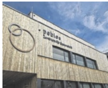
Pebios Gesundheitszentrum