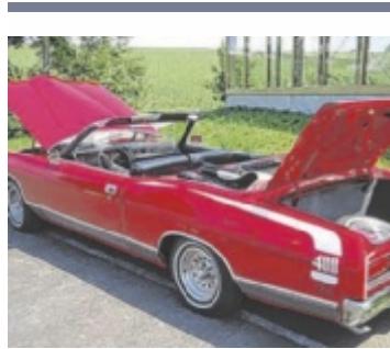
Oldtimertreffen in Pregarten am 7.