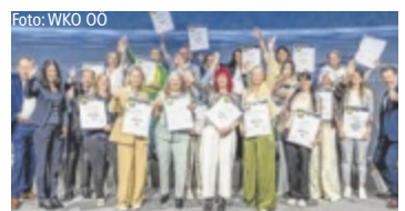
Die ausgezeichneten Direktberater des Masterclass-Vorgängerlehrgangs

Seit mehr als zehn Jahren bündeln das Gremium Direktvertrieb der WKO Oberösterreich und das WIFI OÖ ihr Know-how, um eine praxisnahe Ausbildung anzubieten, die im Geschäftsalltag wirklich weiterhilft. Die neue Direktvertrieb Masterclass umfasst vier kompakte Module – von Branchen- und Kaufverhaltensverständnis über fundierte rechtliche Grundlagen bis hin zu professioneller Kommunikation und einem selbstbewussten Auftritt. „Ob du gerade in die Selbstständigkeit startest oder dein Business weiterentwickeln willst – hier bekommst du praxisnahes Wissen und hilfreiche Orientie-