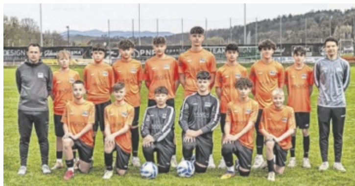
Schon bald wird auf internationalem Rasen gespielt.