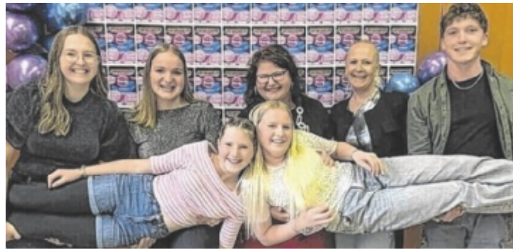
Das Organisationsteam freut sich über viele junge Partygäste.

Ried: Psychologische Beratung für Mädchen und Frauen ☎ 0680 4447647