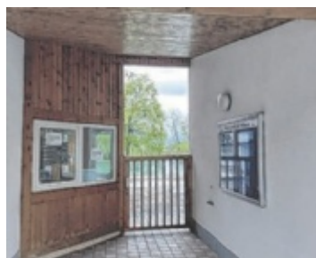
Eingang zum Freibad