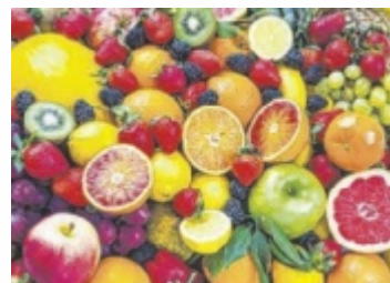
Auch Obst gab es im Dorfladen zu kaufen (Symbolbild)

STEYRLING. Der Dorfladen im Klausner Ortsteil Steyrling schließt vorerst seine Türen. Der Verein „wir für uns“, der den Laden gemeinsam mit Nah und Frisch betrieb, lud zu einem Abschiedsfest vor Ort ein – ein bewusst positiver Rahmen für einen Neuanfang, der bereits in Planung ist.