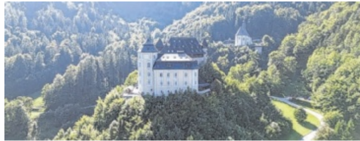
Das Schloss Klaus lädt am Muttertag 2026 zu Rundgängen, Besichtigungen und Vorträgen im sonst nicht öffentlich zugänglichen Schloss ein.

Im Mittelpunkt stehen geführte Rundgänge durch die alten Gemäuer, die über den gesamten Nachmittag hinweg angeboten werden. Ergänzend dazu gibt es im Burgsaal zwei Programm-