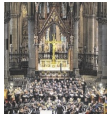
Im Mariendom in Linz

Das Benefizkonzert zugunsten von „Pro Mariendom“ bringt eines der bekanntesten Chorwerke des 20. Jahrhunderts in einer groß besetzten Fassung zur Aufführung. Neben dem Collegium Vocale Linz musizieren Kinder- und Jugendchor, Solisten, zwei Klaviere sowie ein großes Schlagwerkensemble unter der musikalischen Leitung von Josef Habringer. Die Komposition basiert auf mittelalterlichen Texten und verbindet kraftvolle Chorszenen mit lyrischen und dramati-