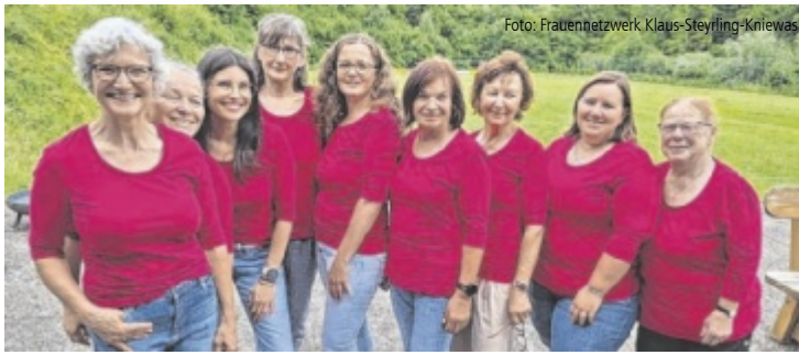
Das Frauennetzwerk organisiert gesellige Events das ganze Jahr über.