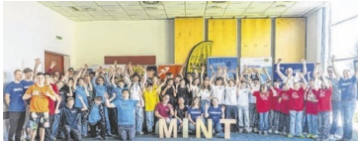
Das Lego-League-Finale im TIZ Kirchdorf war ein voller Erfolg.

23 Teams aus neun Schulen der Sekundarstufe I mit rund 80 Schülerinnen und Schülern nahmen am Wettbewerb der World Robot Olympiad (WRO) teil. Seit Jänner arbeiteten sie am internationalen Thema „Robots Meet Culture!“ und entwickelten so-