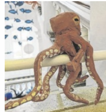
Meerestiere im Schulgebäude

jekts gegeben. Für Verpflegung ist gesorgt, der Reinerlös der Veranstaltung geht an die Organisation MareMundi. Diese setzt sich mit Bildungs- und Forschungsprojekten für den Schutz der Meere sowie für ein besseres Verständnis mariner Lebensräume ein. ■