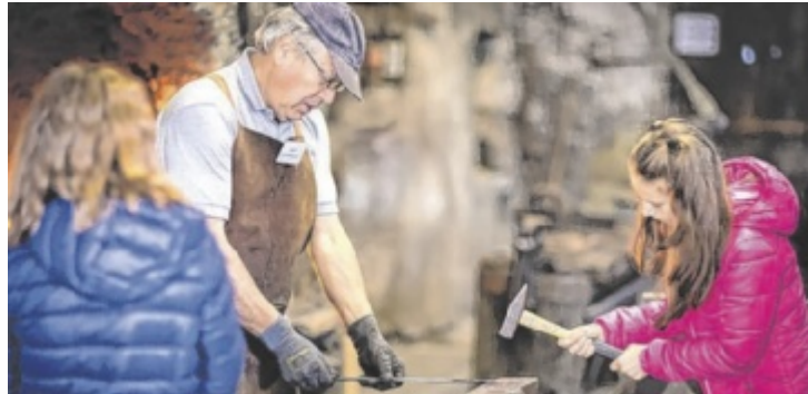
Ein Besuch in der Huf- und Hackenschmiede Lindermayr am 6. Mai gibt Einblicke in einen vergangenen Handwerkszweig.

73 Häuser in Oberösterreich öffnen heuer in der Museumswoche ihre Türen für freie oder vergünstigte Angebote. Im Bezirk Kirchdorf erleben die Besucher Ausstellungen, Mitmachange-