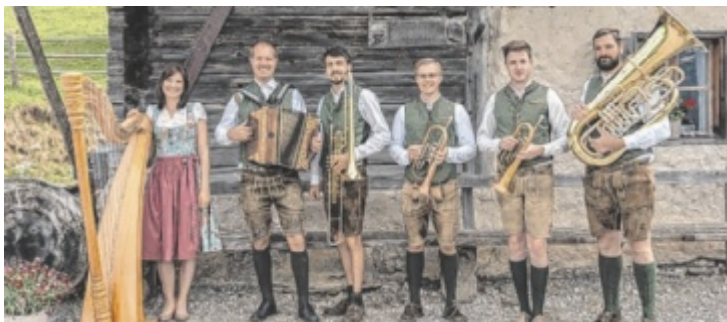
Die Band Kremstalblech: eine von fünf Gruppen, die bei „Musi & Gsang im Fruajahr“ in der Landwirtschaftsschule auftreten werden.