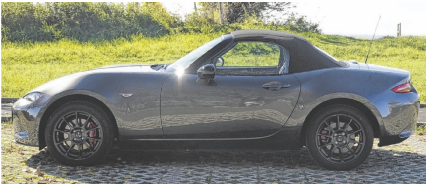
Der Mazda MX-5 ST 1.5L Skyactiv 6MT Homura ist ab 41.580 Euro zu haben.