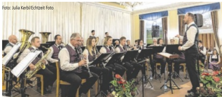
Im Gasthaus Schinagl spielte der Musikverein Steyrling sein Herbstkonzert.