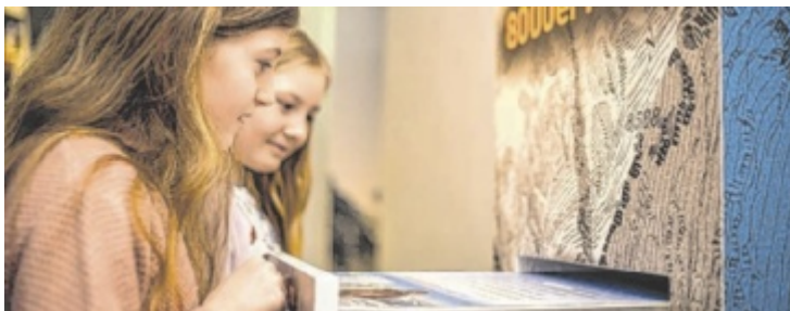
Das Kaltenbrunner-Museum ist auch für Kinder ein Erlebnis.

bote und Einblicke in frühere Lebenswelten. In Molln eröffnet das Wilderer Museum am Samstag, 2. Mai, um 14 Uhr die Schau „Bewegte Bilder im Wandel, Filmen einst und jetzt“. Der Filmclub hat an der Gestaltung mitgewirkt.