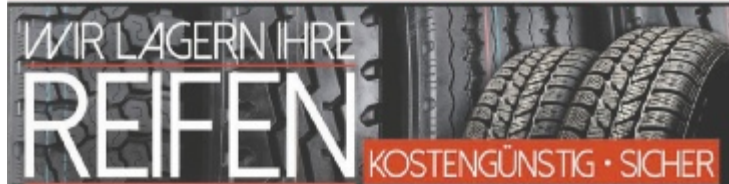
REIFEN &amp; FELGEN