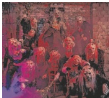
Die Klausner Wasser-teufeln