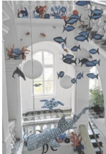
Korallenriff im Stiegenhaus des Gymnasiums

Am Projekt, das heuer auch für den Feronia Nachhaltigkeitspreis nominiert wurde, sind mehrere Klas-