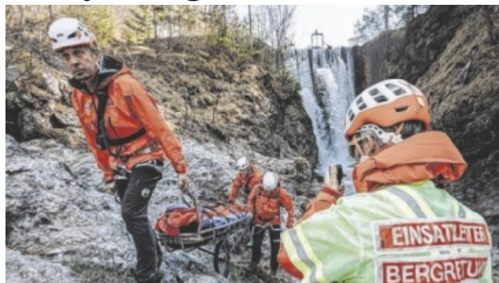
Die Bergretter aus Steyrling sind im Ernstfall zur Stelle.

Finanziert wird die Bergrettung großteils durch Spenden. Notwendige Ausrüstung wie Seile, Sicherungsmaterial, persönliche Ein-