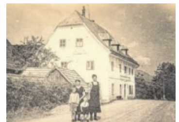
Alles begann 1906 mit dem „Gasthof zur schönen Aussicht“

Ihre Vision formuliert die Familie so: „Eines der Top 3 Nationalpark Resorts in Mitteleuropa zu werden, die nationale und internationale Gäste mit natürlichem Luxus – nachhaltig, klimaneutral und authentisch begrüßt.“ ■