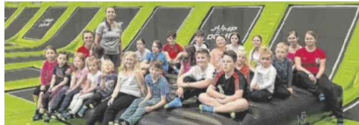
Bisheriges Highlight 2026: Ein Ausflug in den Jumpdome.

Spiele gegen freiwillige Spenden angeboten – der Nachhaltigkeitsgedanke steht im Vordergrund. Zusätzlich gibt es Angebote wie Kinderfasching, Tanz-, Bastel-, und Malkurse. In einer Gruppenstunde beteiligten sich die Kinder an der Aktion „HUI statt PFUT“ und setzen ein Zeichen für Umweltbewusstsein. Neue Mitglieder sind jederzeit willkommen. Infos: www.kinderfreunde.at ■