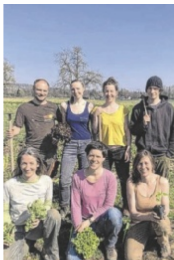
Das Team von Krünzeug präsentiert seine Jungpflanzen.

Besucher wählen vor Ort aus einem großen Sortiment an Jungpflanzen aus eigener Anzucht. Krünzeug baut in Inzersdorf Biogemüse an und versorgt die Region ganzjährig mit frischer Ware. Es gibt etwa Tomaten in verschiedenen Farben, Paprika, Chili, Zucchini, Salat, Snackgurken und Kürbisse. Das Team setzt auf samenfeste Sorten und gewinnt Saatgut selbst (keine Hybridpflanzen). Die Gärtnerei ist Mitglied bei Bio-Austria und ÖBV Via Campesina. Das Gemüse ist am Frische-