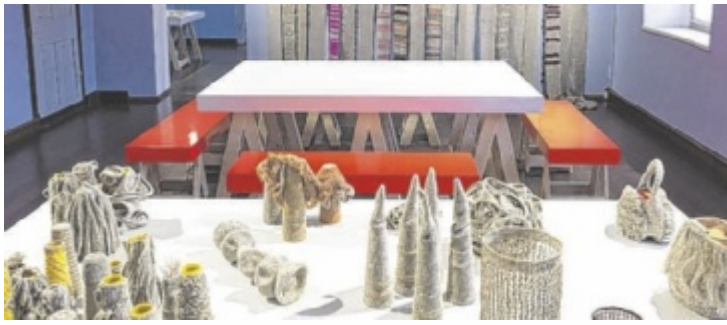
Eine Ausstellung richtet den Fokus auf „Do it yourself“.