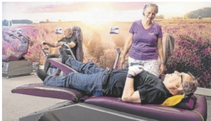
Ganzheitlich fit mit Feelgood: Modernes Training für mehr Gesundheit und Wohlbefinden

Im Zentrum steht ein praxisbewährter und systematisch aufgebauter Trainingsansatz, der individuell auf die Bedürfnisse der Menschen abgestimmt wird. Durch den Einsatz moderner Technologien und klar strukturierter Abläufe entstehen messbare Fortschritte – effizient, sicher und unabhängig vom Fitnesslevel.