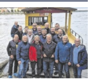
Saisonstart 2026