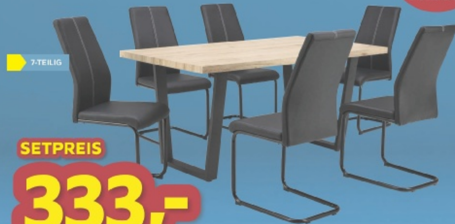
TISCHGRUPPE , 7-teilig 333,- bestehend aus ESSTISCH , Platte Artisan Eiche Dekor, Gestell Metall Schwarz pulverbeschichtet matt, BxHxT: ca. 160x75x90 cm 159,- SCHWINGSTUHL , Lederlook Schwarz, Gestell Metall Schwarz, BxHxT: ca. 44x96x57 cm 29,- (112340005/05.07580198/01)

GÜLTIG NUR IN ST. FLORIAN BIS 02.05.2026