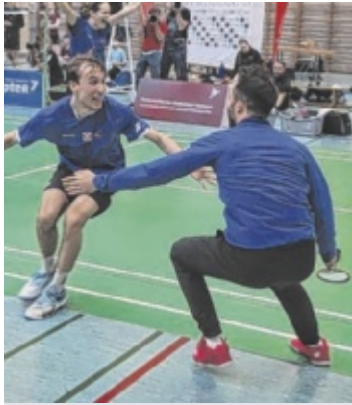
Meister Die ASKÖ Traun sicherte sich gegen Wolfurt den 16. Meistertitel des Vereins in der Badminton Bundesliga. Seite 23 / Foto: ASKÖ Traun