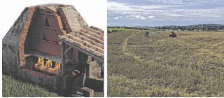
Links die Rekonstruktion eines römischen Brennofens, rechts das Untersuchungsgebiet bei Enns.

Seit 2015 untersucht ein interdisziplinäres Team den rund zehn Kilometer langen Abschnitt zwischen Enns und St. Pantaleon-Erla. Dabei wurden bereits zahlreiche militärische und zivile Strukturen sichtbar – vom Legionslager über kleinere Lager bis hin zu Wachtürmen. Nun bringt eine neue Messkampagne zusätzliche Erkenntnisse. Im Fokus stand ein Areal nordöstlich des Legionslagers, wo sich bereits die größte bekannte Kalkbrennofenanlage des Römischen Reiches mit zwölf Öfen befindet. Neue Messungen mittels Bodenradar und Geomagnetik zeigten weitere Gebäude, die mit dieser Anlage in Verbindung stehen. Hier produzierten Soldaten der legio II Italica, aber auch Sklaven, Kalk in großem Stil. Den entscheidenden Hinweis lieferten jedoch zwei große Ofenanlagen: Mit Aus-