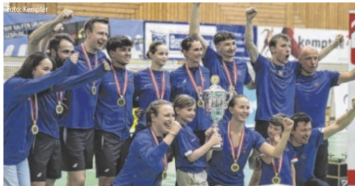
ASKÖ Traun feiert den Gewinn der österreichischen Badminton-Meisterschaft.