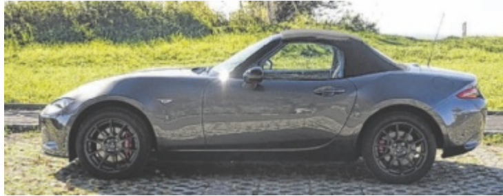
Der neue Mazda MX-5 ST 1.5L Skyactiv 6MT Homura

Was soll man noch über den Mazda MX-5 erzählen, was man nicht eh schon weiß? 1989 wurde der Mazda in Chicago erstmals vorgestellt und in den 36 Jahren haben sich weder Konzept noch Layout großartig geändert. Alleine das ist schon Garant für maximalen Wiedererkennungswert. Getan hat sich natürlich trotzdem einiges: Mittlerweile gibt es neben einem Soft-Top auch eine Hard-Top-Variante. Dafür fiel der für einige Jahre erhältliche 184 PS starke 2.0 Liter Benziner zuletzt den neuen CO2-Grenzwerten zum Opfer. Die Testfahrer von Fahrfreude.cc feiern das G132 Soft-Top-