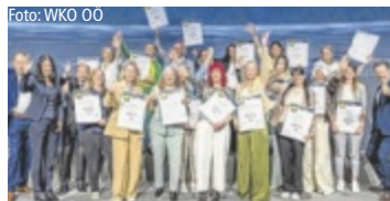
Die ausgezeichneten Direktberater des Masterclass-Vorgängerlehrgangs

Seit mehr als zehn Jahren bündeln das Gremium Direktvertrieb der WKO Oberösterreich und das WIFI OÖ ihr Know-how, um eine praxisnahe Ausbildung anzubieten, die im Geschäftsalltag wirklich weiterhilft. Die neue Direktvertrieb Masterclass umfasst vier kompakte Module – von Branchen- und Kaufverhaltensverständnis über fundierte rechtliche Grundlagen bis hin zu professioneller Kommunikation und einem selbstbewussten Auftritt. „Ob du gerade in die Selbstständigkeit startest oder dein Business weiterentwickeln willst – hier bekommst du praxisnahes Wissen und hilfreiche Orientie-