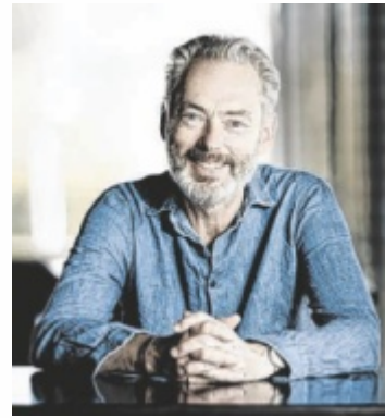
Tenor Mark Padmore

LINZ. Nicht als Sänger, sondern als Geschichtenerzähler versteht sich der britische Tenor Mark Padmore. Am Klavier begleitet von Julius Drake, präsentiert er bei seinem Liederabend am Dienstag, 5. Mai, 19.30 Uhr, im Brucknerhaus Linz ein intimes Programm.