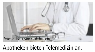
Apotheken bieten Telemedizin an.

OÖ. In Oberösterreich startet ein Pilotprojekt zur Telemedizin in Apotheken. In teilnehmenden Betrieben können Patienten kostenlos ein vertrauliches Online-Gespräch mit einer Ärztin oder einem Arzt führen – direkt vor Ort in einem separaten Beratungsraum.