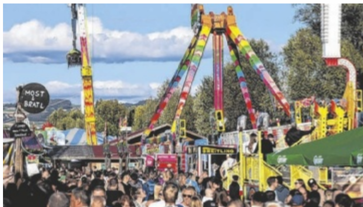
Der Urfahrner Frühjahrsmarkt findet erstmals elf Tage lang statt.