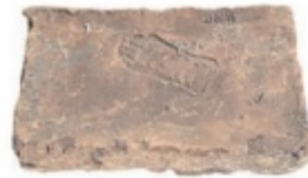
Römischer Ziegel mit Stempel der legio II Italica in Form eines Fußes.

tiert. Für Landeshauptmann Thomas Stelzer ist der Fund ein „wissenschaftlicher Meilenstein“, der das historische Potenzial Oberösterreichs unterstreiche und zugleich die Bedeutung des Donaulimes als UNESCO-Welterbestärke. Die neuen Erkenntnisse sind nicht nur für die Forschung wichtig. Sie helfen auch, das Areal besser zu schützen – und zeigen, dass die Region noch längst nicht vollständig erforscht ist. ■