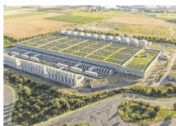
Das Google-Datencenter soll 2027 fertiggestellt sein.