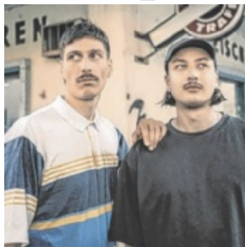
Mit dabei sind „Ende“.

EUphoria! Seit mehr als einem Jahrzehnt wird der jährliche Europe Day im Brüsseler Ancienne Belgique als musikalische Feier Europas begangen. Als Teil des Projekts Liveurope setzt der Posthof diese Initiative 2026 erstmals fort – für mehr Sichtbarkeit neuer musikalischer Stimmen in Europa. Vier Bands sorgen am Samstag, 9. Mai im Posthof für einen vielfältigen und verbindenden Abend. Auf der Bühne sind „Ende“ aus Wien und Linz mit ihrer Klangwelt aus Post-Punk, Neue Neue Deutsche Welle bis Pop, „Boebeck“ aus Ungarn rund um Frontfrau Boe, „Pony