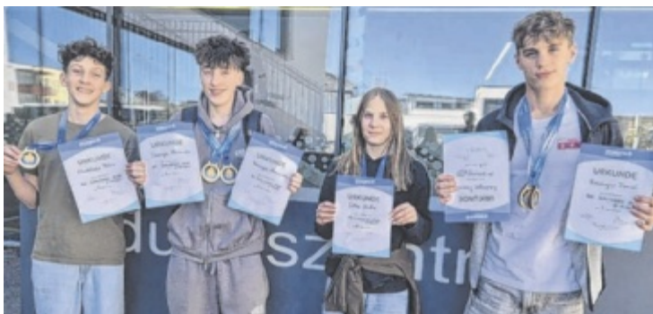
Schüler der Mittelschule Pregarten