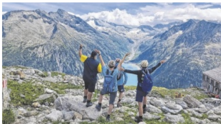
Erholung in den Bergen beim Garberwirt im Zillertal in Tirol