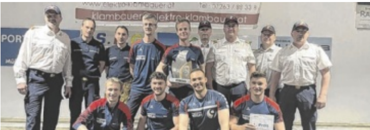
Das Siegerteam: Die FF Mötlas