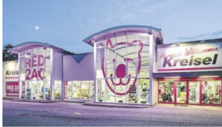
Red Zac Kreisel lädt zu den Robotertagen am 8. und 9. Mai nach Freistadt.

Mammotion hat sich mittlerweile als die meistverkaufte Marke für kabellose Mähroboter weltweit etabliert und setzt mit dem neuen Modell LUBA 3 technologische Maßstäbe. Das Herzstück der neuen Serie ist die innovative Tri-Fusion-Navigationstechnologie, die Satellitensignale (RTK), LiDAR-Lasersensoren und Vision-Technologie (Kamera) kombiniert. Dadurch orientieren sich die Geräte selbst unter Bäumen