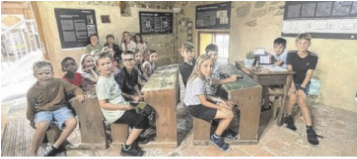
Kinder zu Besuch in der Alten Schule in Windhaag