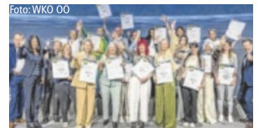
Die ausgezeichneten Direktberater des Masterclass-Vorgängerlehrgangs

Seit mehr als zehn Jahren bündeln das Gremium Direktvertrieb der WKO Oberösterreich und das WIFI OÖ ihr Know-how, um eine praxisnahe Ausbildung anzubieten, die im Geschäftsalltag wirklich weiterhilft. Die neue Direktvertrieb Masterclass umfasst vier kompakte Module – von Branchen- und Kaufverhaltensverständnis über fundierte rechtliche Grundlagen bis hin zu professioneller Kommunikation und einem selbstbewussten Auftritt. „Ob du gerade in die Selbstständigkeit startest oder dein Business weiterentwickeln willst – hier bekommst du praxisnahes Wissen und hilfreiche Orientie-