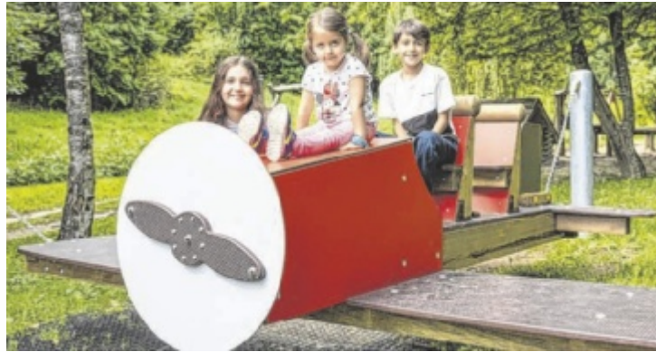
Schautafeln, interaktive Stationen, Naturspielplätze und Balanciermöglichkeiten sind am Vogelkundeweg in Gutau zu entdecken.

Familien, Schulklassen und Naturinteressierte finden hier eine gelungene Kombination aus Bewegung, Lernen und Naturerlebnis. Der Vogelkundeweg startet beim Schauraum gegenüber dem Färbemuseum im Ortszentrum. Der Rundweg ist etwa zwei Kilometer lang und leicht begehbar. Mit einer Gehzeit von rund ein bis zwei Stunden eignet sich ideal für einen entspannten Spaziergang. Besonders hervorzuheben ist, dass der Weg kinder-