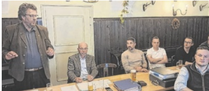
Vollversammlung des Fischereireviers Freistadt in Kefermarkt.

Bei der Vollversammlung des Fischereireviers Freistadt begrüßte Obmann Wilhelm Leitner zahlreiche Ehrengäste sowie Betriebsleiter und Pächter der mehr als 270 Gewässer im Bezirk. Im Rückblick wurde auf ein aktives Jahr verwiesen, unter anderem mit einem erfolgreichen Messeauftritt. Landesfischereimeister Gerhard Sandmayr berichtete von rund 38.000 Fischern in Oberösterreich und sicherte weitere Unterstützung bei Besatz-