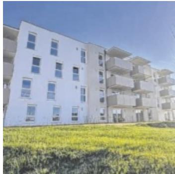
Die neue Wohnanlage

Auch die Infrastruktur der Anlage überzeugt: Neben einer Tiefgarage mit ausreichend Stellplätzen stehen Kellerabteile, Fahrrad- sowie Technikräume zur Verfügung. Großzügig gestaltete Freiflächen sowie Spielplätze für unterschiedliche Altersgruppen fördern eine lebendige Nachbarschaft und bieten Raum für Begegnung und Bewegung. Die Wohnanlage liegt gegenüber dem Agrarbildungszentrum in ruhiger Lage und profitiert gleichzeitig von der Attraktivität des Standorts. Hagenberg hat sich mit der Fachhochschule Oberösterreich zu einem bedeutenden Technologie- und Bildungsstandort entwickelt und wird nicht ohne Grund als „Silicon Valley“ Österreichs bezeichnet. Zahlreiche Unternehmen haben sich hier angesiedelt, wodurch der Ort auch