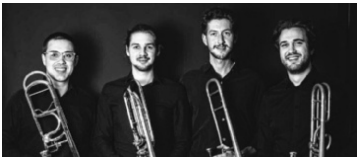
Vier junge Posaunisten konzertieren quer durch die Jahrhunderte.

ben findet und verbindet die Schwere ihres Schicksals mit Wärme, Mut und unerwarteten Momenten der Leichtigkeit. Unter dem Titel „Naseweisheiten – Was ich als Clown über das Leben lernte“ erzählt Pachl-Eberhart in ihrem Vortrag, wie sie die Perspektive des Clowns durch schwere persönliche Krisen getragen hat. Details: www.mitsinn.org , auf www.tips.at gibt es Vortragskarten zu gewinnen. ■