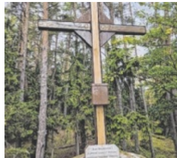
Gipfelkreuz Himmelsstiege

Um 10 Uhr wird vom Marktplatz in Neumarkt Richtung Baumgarten und Lamm marschiert, die Himmelsstiege samt Gipfelkreuz und Labstelle erklimmen und dann über Steigersdorf zurückgewandert. Bei Regen wird die Wanderung verschoben. N7 ist die Bezeichnung des Rundwanderweges, den Karl Ortner mit Unterstützung der Gemeinde beschildert hat. Für die 15,7 Kilometer mit 607 Höhenmetern sind etwa fünf Stunden einzuplanen. „Neumarkt