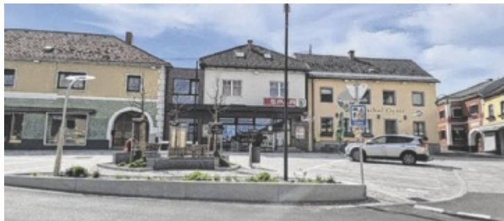
Der Marktplatz Gutau wurde neu gestaltet.

Unter dem Titel „Unser Marktplatz – unser Fest“ steht dabei nicht nur die Fertigstellung eines Bauprojekts im Mittelpunkt, sondern vor allem das Ergebnis eines intensiven, gemeinschaftlichen Prozesses. Der Festtag beginnt um 9 Uhr mit der Segnung des neuen Friedensplatzes bei der Kirche. Um 9.30 Uhr folgt ein Gottesdienst am Marktplatz. Der offizielle Festakt startet um 10.30 Uhr. Nach dem traditionellen Frühschoppen geht das Programm in einen musikalischen Nachmittag über – ganz im Zeichen von „Gutau für Gutau“