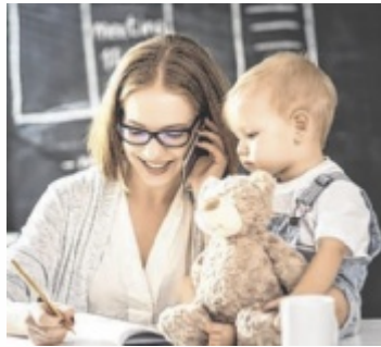
Wie wirkt sich die Arbeit von Müttern auf das Einkommen ihrer Kinder aus?

Unter dem Titel „Mütter und der Gender-Pay-Gap ihrer Kinder“ lädt das Freie Radio Freistadt mit den Partnerorganisationen Frau-stadt Freistadt und Commit zu einer offenen Diskussionsrunde in Café-Atmosphäre. Beginn: 16 Uhr. Im Zentrum steht der Gender-Pay-Gap, also die geschlechtsspezifische Lohnlücke zwischen Frauen und Männern. Diese beschreibt den Unterschied im durchschnittlichen Einkommen und ist nach wie vor ein bedeutendes gesellschaftliches Thema. René Böheim, Universitätsassistent in Linz, hat er-