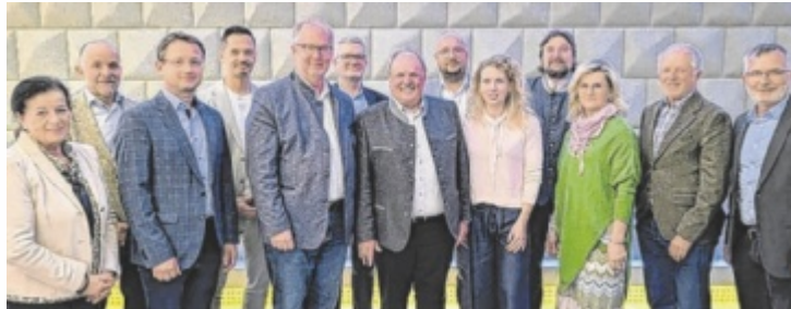
Das Vorstandsteam der Messe Mühlviertel