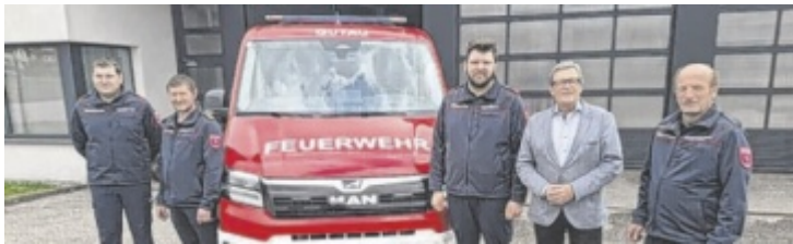
Empfang des neuen Kommando-Fahrzeuges.

ken“), gefährdete Arten und Naturschutz. Die Informationen werden nicht nur über klassische Schautafeln vermittelt, sondern auch über interaktive Elemente. So können Besucher beispielsweise Vogelstimmen auf Knopfdruck anhören oder Präparate in ausgehöhlten Baumstämmen betrachten. Hörstationen mit Vogelgesängen, Sichtrohre zur Naturbeobachtung, ein großer Hörtrichter, der Waldgeräusche einfängt, ein begehrter Nistkasten und ein riesiges Vogelnest, Naturspielplätze und Balanciermöglichkeiten sorgen für spielerisches Lernen und Spaß. Zusätzlich sorgt ein Vogelquiz entlang des Weges für Unterhaltung und vertieft das Gelernte. ■