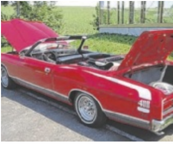
Oldtimertreffen in Pregarten am 7.