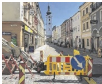
Nach dem Fernwärme-Ausbau wird die Oberfläche wiederhergestellt.

FREISTADT. Nach dem Ausbau des Fernwärmenetzes in der Innenstadt werden nun die betroffenen Flächen endgültig instand gesetzt.