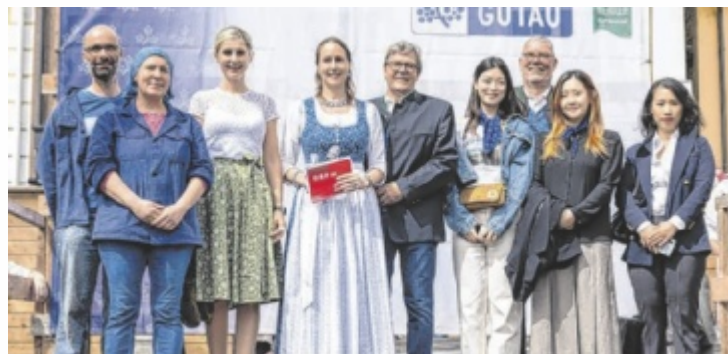
Der Färbermarkt in Gutau hat sich zu einem internationalen Treffpunkt für Handwerks-Liebhaber entwickelt.

Die Kunsthandwerker aus mehreren europäischen Ländern präsentieren am Marktplatz und in den umliegenden Straßen ihre hochwertigen, oft handgefertigten Produkte. Besonders eindrucksvoll ist das Schaufärben in der Zeugfärberei: Alle 30 Minuten kann man live miterleben, wie sich Stoffe beim Indigofärben von Weiß über Grün in das charakteristische Blau verwandeln – ein echtes „Blaues Wunder“. Auch das Färbermuseum öffnet seine Türen und bietet Führungen, die spannende Einblicke in die Geschichte und Technik des Blaudrucks geben.