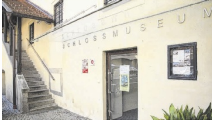
Mühlviertler Schlossmuseum Freistadt

Bei der Aktionswoche „Treffpunkt Museum“ öffnen 73 Häuser mit rund 200 Programmpunkten in Oberösterreich ihre Türen – vielfach bei freiem oder ermäßigtem Eintritt. Mit einem Tag der offenen Tür lädt das Mühlviertler Schlossmuseum in Freistadt am 2. Mai, von 14 bis 17 Uhr, zur Besichtigung der Sonderausstellung „Der heiße Sommer 1938. Der Hintermann und sein Spionagenetzwerk“ ein. Ein besonderes Erlebnis ist eine Besteigung des Turms mit neun Stockwerken. Führungen im Färbermarkt in Gutau bieten am