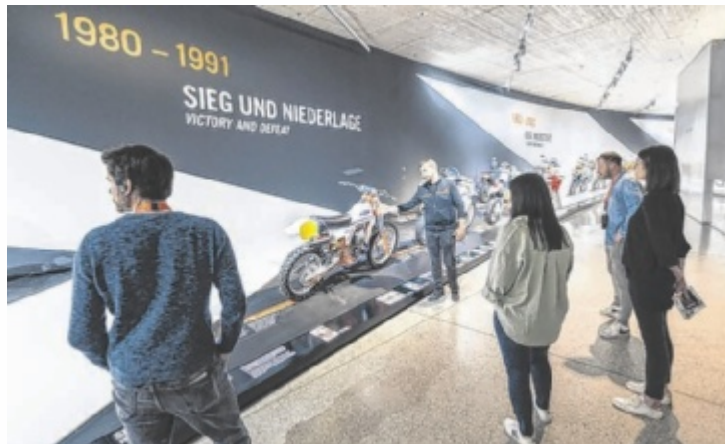
Die KTM bietet Einblicke in Produktion und Ausstellungen an.

Bereits am Samstag, 2. Mai, startet das Heimathaus Braunau in die neue Saison. Ab Saisonauftakt werden bis Ende September auch wieder regelmäßige Führungen, jeweils von Dienstag bis Samstag um 13.30 Uhr (ausgenommen Feiertage), angeboten. Damit bietet sich für interessierte Besucher die optimale Gelegen-