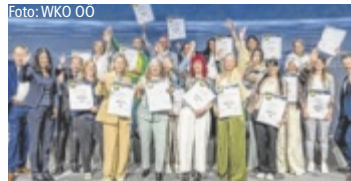
Die ausgezeichneten Direktberater des Masterclass-Vorgängerlehrgangs