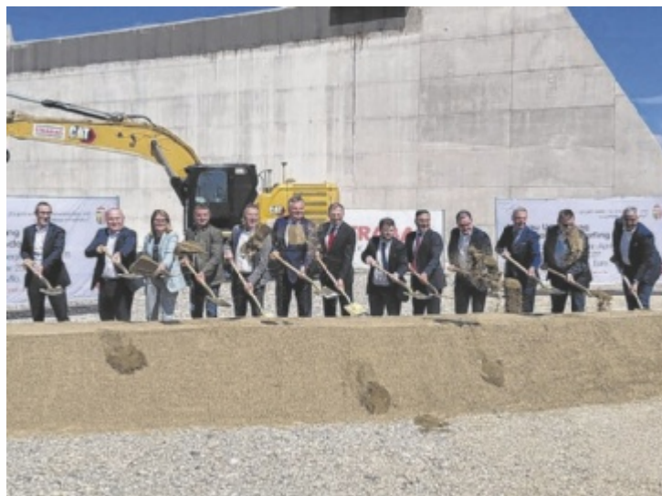
Der Spatenstich bildet den Startschuss für die Umsetzung des zweiten und dritten Bauabschnitts der Umfahrung Mattighofen-Munderfing.

Der Spatenstich für die Umfahrung Mattighofen-Munderfing sei ein Meilenstein, betont Landeshauptmann Thomas Stelzer, insbesondere weil das Projekt „keine kurze Vorgeschichte“ habe. Bereits im Jahr 1988 wurde eine erste Studie für eine Entlastungsstraße erstellt, 2009 folgte der Beschluss der Trassenverordnung und die Einreichunterlagen für die Bauabschnitte zwei und drei wurden 2015 beziehungsweise 2017 zur Genehmigung vorgelegt. Es folgten zahlreiche rechtliche Verfahren in den folgenden Jahren, insbesondere die Frage einer möglichen Umweltverträglichkeits-