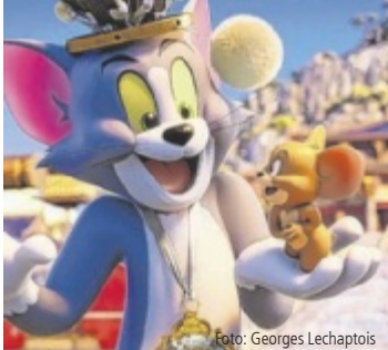
Tom und Jerry sind zurück!

In ihrem neuesten Abenteuer beweisen Tom und Jerry, dass sie auch nach Jahrzehnten nichts von ihrem Charme verloren haben – auch wenn sie diesen diesmal weit abseits ihres gewohnten Wohnzimmers versprühen.