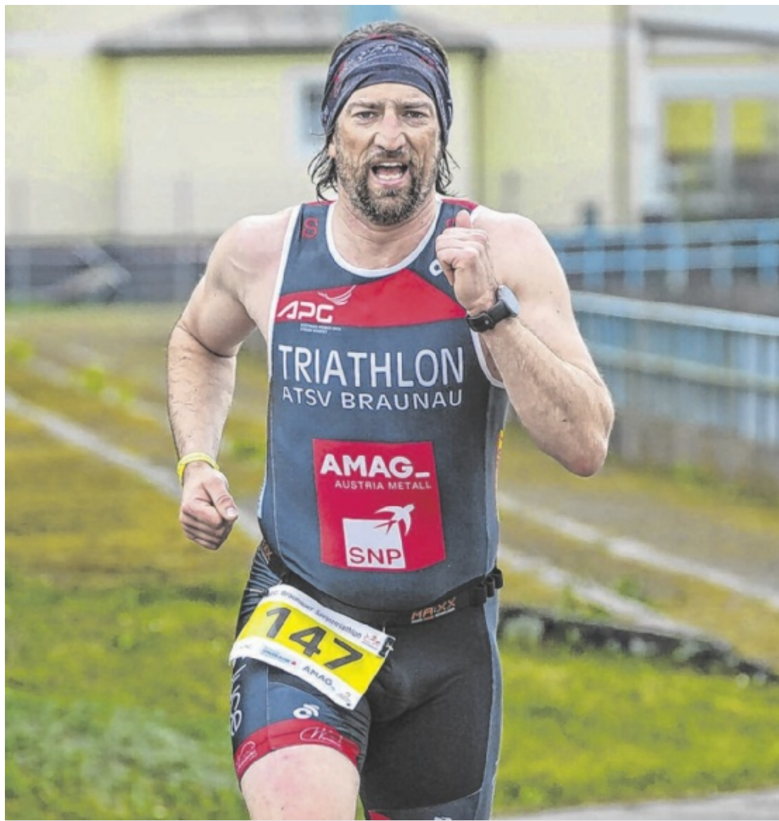
Sprinttriathlon Schwimmen, Radfahren, Laufen: Die 31. Ausgabe des Braunauer Sprinttriathlons läutet am 3. Mai die neue Wettkampfsaison ein und bringt wieder zahlreiche Athleten sowie Zuschauer in die Stadt. Seite 25

REMAX Innova Immobilien GmbH / remax-innova.at