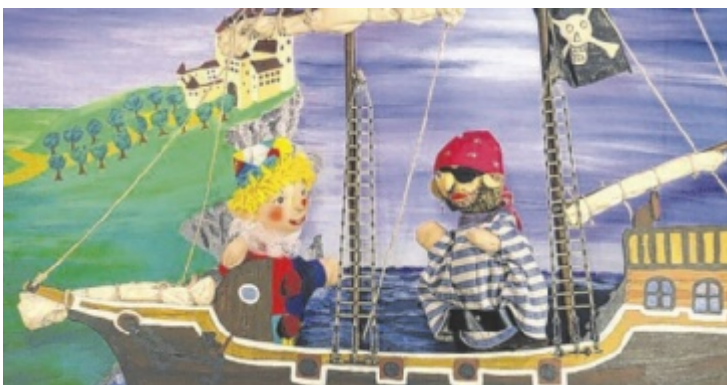
Kasperl begibt sich auf ein Abenteuer an Board.