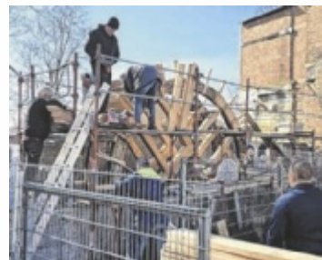
Viele fleißige Hände brachten das Mühlrad wieder zum Laufen.

ALTHEIM. Es klappert wieder: Der Motor-Veteranen-Club Altheim hat das Mühlrad bei der Gatterbauermühle wieder zum Laufen gebracht. Gefei-ert wird dies mit einem Mühlradfest am Samstag, 2. Mai.