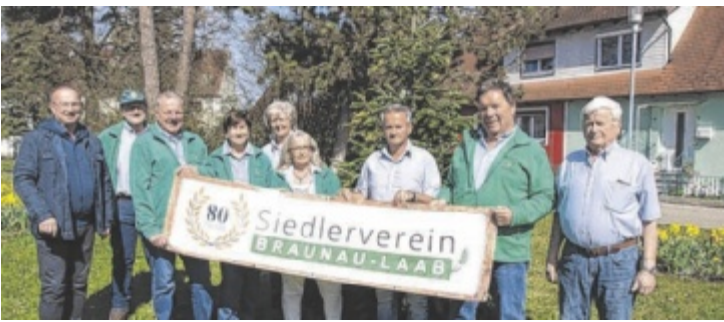
Der Siedlerverein Braunau-Laab spendete der Stadt einen Nordmann-Tanne, die künftig als festlicher Weihnachtsbaum dienen soll.