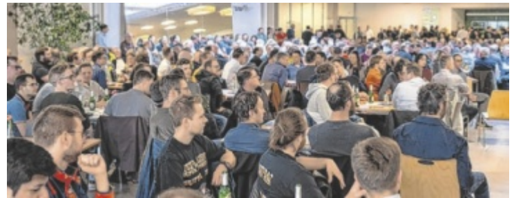
Über 500 Absolventen folgten der Einladung zum Wiedersehen.

dersehen. Für musikalische Stimmung sorgte die HTL Bigband Revival, während Einblicke in die aktuelle Entwicklung der Schule sowie Führungen durch neue Labore und Werkstätten großes Interesse weckten. Beim anschließenden Buffet stand vor allem eines im Mittelpunkt: der Austausch von Erinnerungen und das Wiederaufleben alter Freundschaften. ■