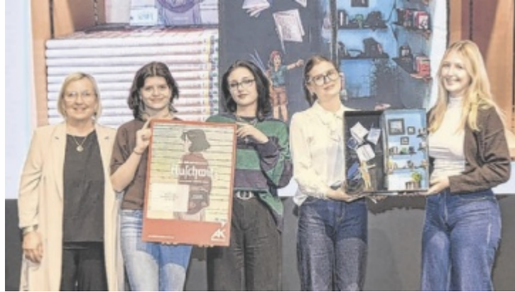
Die Schülerinnen präsentierten ihr Werk in Linz.

Ausgangspunkt war das Werk „Die Bibliothekarin von Auschwitz“, das die Geschichte von Dita Kraus erzählt, die im Lager heimlich Bücher verwaltete und damit Hoffnung schenkte. Inspiriert davon entwickelten die Jugendlichen ein eindrucksvolles Kunstprojekt: In einer gestalte-