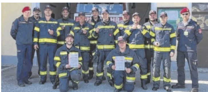
Die Kameraden, die die Abzeichen erfolgreich ablegen konnten

gespielten Ablauf zu bewältigen waren. Neben Schnelligkeit spielten vor allem Genauigkeit und perfektes Zusammenspiel eine zentrale Rolle. Eine Gruppe absolvierte die Leistungsprüfung in der Stufe Silber, auch die zweite Gruppe, die in der Stufe Gold antrat, überzeugte mit einem starken Auftritt. ■