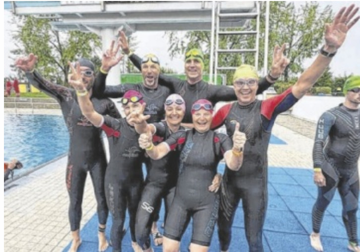
Sowohl Hobbysportler als auch Profis messen sich alljährlich beim Braunauer Sprinttriathlon.

Am Sonntag, 3. Mai, wird Braunau erneut zum Treffpunkt der heimischen Ausdauerszene. Früh am Morgen versammeln sich die Teilnehmer im Freibad Braunau, wo mit dem Schwimmen die erste Disziplin beginnt. Danach geht es direkt auf die Radstrecke, bevor beim abschließenden Lauf – inklusive zweier Steigungen – noch einmal volle Konzentration und Ausdauer gefragt sind. Der Bewerb verlangt nicht nur kör-