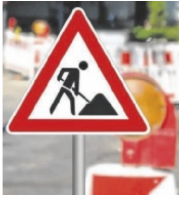
Symbolfoto Foto: studio v-zwoelf/stock.adobe.com

BRAUNAU. Mit der Sanierung der L502 Simbacher Straße setzt das Land Oberösterreich einen wichtigen Schritt zur Verbesserung der Verkehrssicherheit im Stadtgebiet von Braunau. Wie Infrastruktur-Landesrat Günther Steinkellner (FPÖ) informiert, wird die Straße auf einer Länge von rund 500 Metern umfassend erneuert.