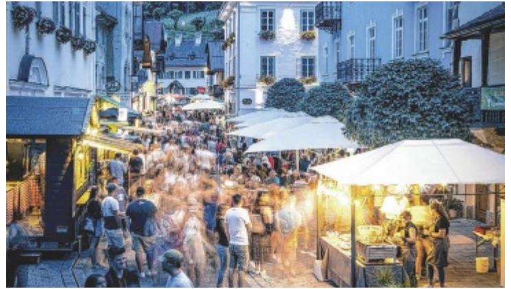
Stimmung, Musik und Genuss im Herzen von St. Wolfgang