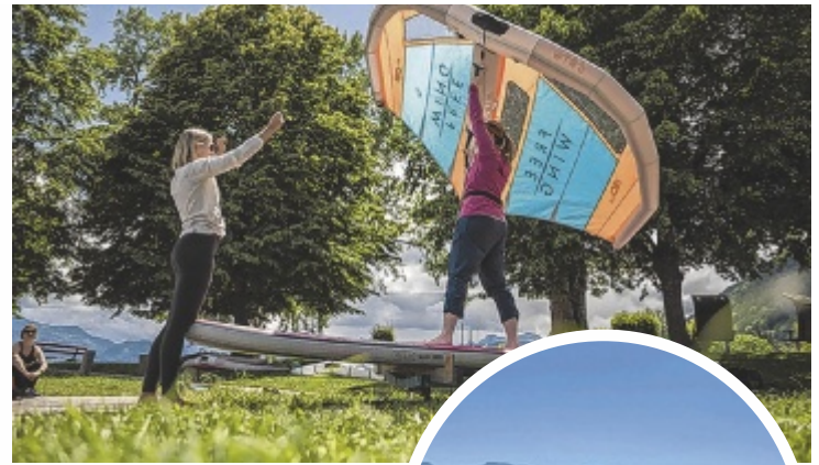
Wassersport bringt Action und Beach-Vibes nach Ebensee.

Der reguläre Betrieb der LAKEBASE startet im Mai 2026, Kurse und Camps sind bereits online buchbar. Weitere Informationen gibt's unter www.lakebase.at