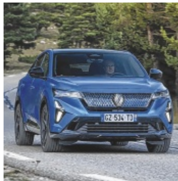
Der neue Renault Rafale E-Tech Plug-in-Hybrid 4x4

Die Reichweite beträgt bis zu 1.000 Kilometer nach WLTP mit Verbrauchswerten von 0,6 l/100 km und 6,2 l/100 km bei entladener Batterie. Im elektrischen Betrieb sind bis zu 105 Kilometer möglich. Alternativ fährt das Modell auch als Vollhybrid und kann an Steckdose oder Ladestation geladen werden. Die Ausstattung Atelier Alpine bringt 21-Zoll Räder, Gipfel-Blau Matt, adaptive Fahrwerksregelung, Kameranavigation, Allradantrieb und Allradlenkung für mehr Dynamik und Komfort. Damit vereint der Rafale Leistung, Effizienz, Agilität und hohen Fahrkomfort und ist im normalen Alltag und im Gelände einsetzbar.