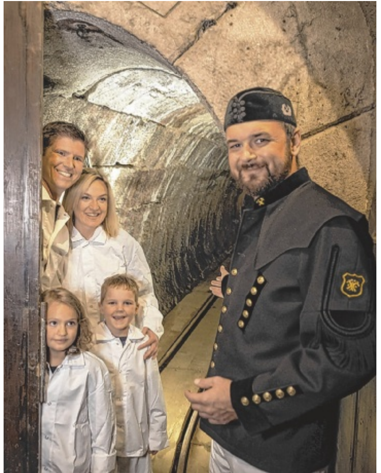
Die Salzwelten Altaussee erwarten Besucher.

folgt stressfrei und ermöglicht bereits unterwegs eindrucksvolle Ausblicke auf die alpine Natur. Im größten aktiven Salzbergwerk Österreichs erwartet Besucher eine abwechslungsreiche Mischung aus Geschichte und Abenteuer. Dazu zählen die geheimnisvolle Barbarakapelle, ein unterirdischer Salzsee sowie zwei lange Bergmannsrutschen. Ein besonderer Teil der Führung widmet sich zudem der spektakulären Rettung wertvoller Kunstgüter, die einst im Bergwerk versteckt wurden. Die gesamte Dauer beträgt rund dreieinhalb Stunden, inklusive Transfer und Führung.