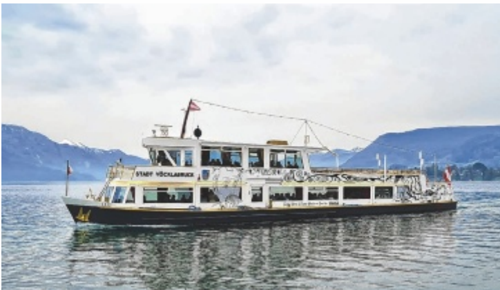
Mit dem Künstler-Schiff über den Attersee schippern.

Infos und Buchung online unter www.atterseeschifffahrt.at .