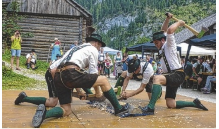
Die D'Dachstoana bei einem Holzhacker-Auftritt