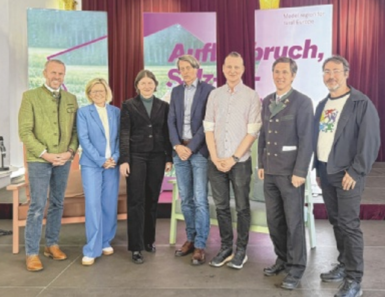
Präsentation von „Aufbruch Salzkammergut“ in Bad Ischl