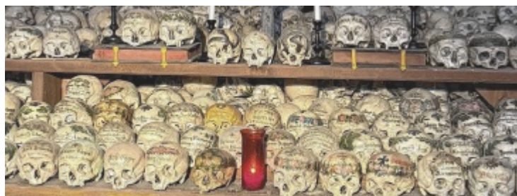
Das Beinhaus von Hallstatt ist einzigartig auf der Welt.

entnommen und die Schädel gereinigt, gebleicht und verziert – oft mit Blumen als Zeichen der Liebe. Diese Tradition begann im Jahr 1720. Der letzte Schädel kam 1995 hinzu. Heute ist diese Bestattungsform selten, auch wegen zunehmender Feuerbestattungen, die deutlich mehr Platz auf Friedhöfen schaffen.