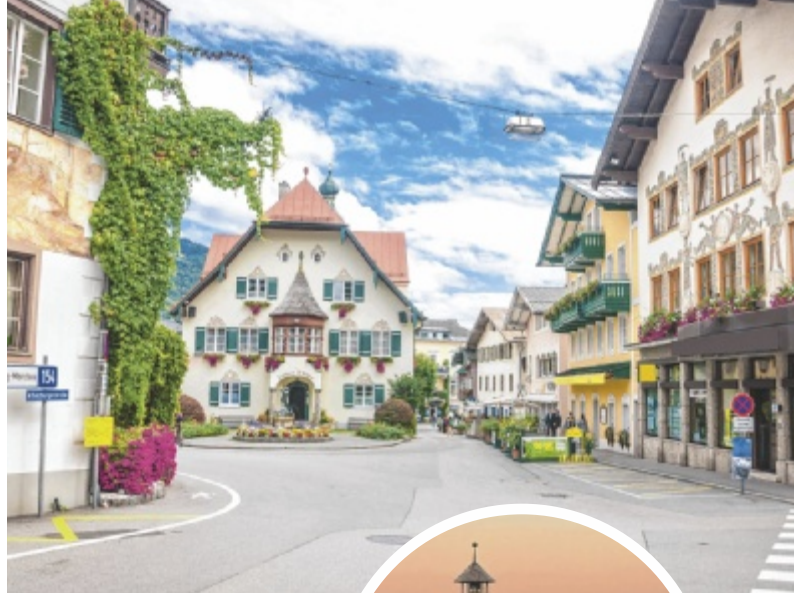
Neues Trapp-Museum eröffnet mitten in der Filmkulisse am Zwölferhorn.