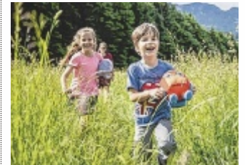
Wanderchallenge für Kinder

SALZKAMMERGUT. Mit der JOLLY Kinder-Wanderchallenge wird das Salzkammergut zum Abenteuerspielplatz: Gemeinsam mit Dachstein und Salzstein entdecken junge Wanderer fünf abwechslungsreiche Touren mit Natur, Ausblicken und spannenden Geschichten. Ob am Berg oder am See – jede Route bringt neue Erlebnisse. Wer alle fünf Wanderungen schafft, wird im Tourismusbüro mit Urkunde, JOLLY-Stiften und einem Kuscheltier belohnt. Mehr unter dachstein.salzkammergut.at