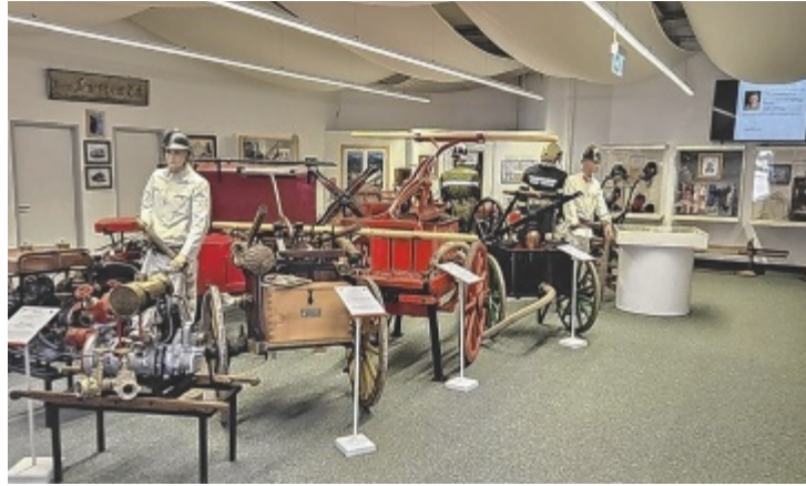
Feuerwehr-Geschichte hautnah erleben bis Oktober

BAD ISCHL. Mit dem Start in die neue Saison öffnet auch das Feuerwehrmuseum Bad Ischl wieder regelmäßig seine Türen geöffnet. Untergebracht im ehemaligen Autohaus Weinzierl in der Kaiser-Franz-Josef-Straße wird hier die bewegte Geschichte des Ischler Feuerwehrwesens lebendig präsentiert. Besucher haben jeweils freitags und samstags von 10 bis 17 Uhr die Möglichkeit, in die Welt der Feuerwehr einzutauchen.