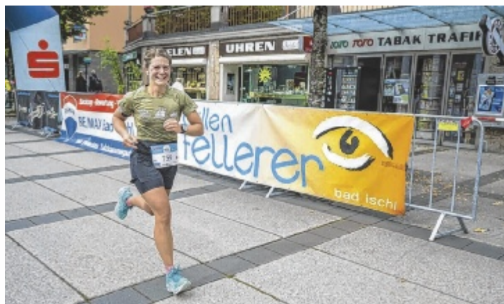
Bad Ischl läuft wieder. Auch das Laufkaiserpaar wird gekürt.

BAD ISCHL. In der Kaiserstadt Bad Ischl stehen auch 2026 wieder drei große Laufveranstaltungen im Rahmen der Serie #badischllaueft auf dem Programm. Den Auftakt bildet der Katrin Berglauf am Sonntag, 14. Juni. Dieser führt über 4,4 Kilometer und 943 Höhenmeter von der Talstation auf die Katrin. Neben dem Hauptlauf wird auch eine Staffel mit elf Läufern ausgetragen, bei der jeder Teilnehmer einen Streckenabschnitt übernimmt. Der Lauf zählt zu den anspruchsvollsten Bergläufen der Region. Das zweite Rennen ist der Bad Ischler Voigas17 am Samstag, 1. August. Die Trailveranstaltung führt über Forststraßen, Wanderwege und Bergpfade rund um Perneck. Neben der Strecke über 17 Kilometer wird auch eine kürzere Strecke über rund 5,6 Kilometer angebo-