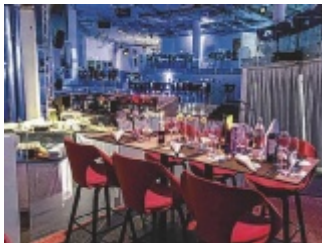
Eventresort scalaria lädt zu Dinner und Konzert.