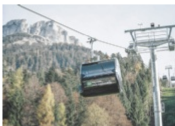
Mit der Panoramabahn auf 1.600 Meter Seehöhe

SALZKAMMERGUT. Die Panoramabahn auf den Loser mit 76 barrierefreien 10er-Kabinen bietet ganzjährig bequemen Zugang zur Bergwelt – ideal für Skifahrer, Wanderer, Rodler und Paragleiter. Auch Kinderwagen, Hunde und Bikes sind willkommen. Öffi-Anbindung und Top-Aussicht inklusive. Infos unter www.loser.at