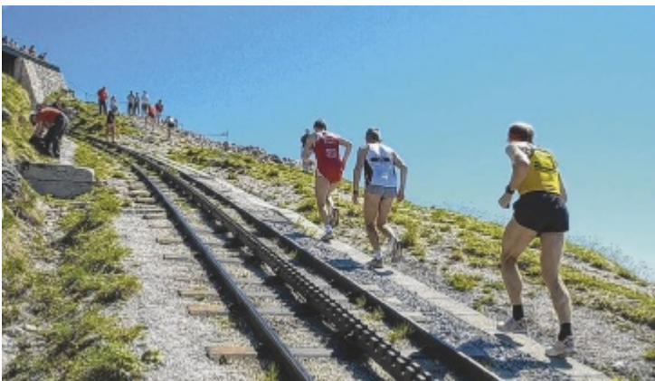
Am 9. Mai findet der 26. Schafberglauf am Wolfgangsee statt.