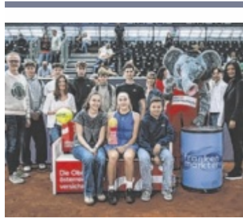
Tennis-Nachwuchs vom UTC Bach beim Finalspiel.