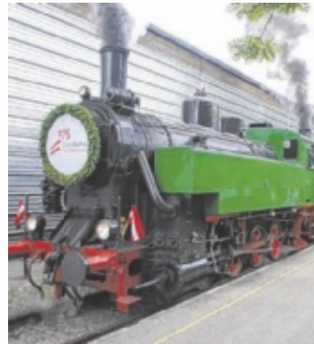
Lokpark Ampflwang

Der Lokpark Ampflwang – OÖ Eisenbahn- und Bergbaumuseum lädt am Freitag, 1. Mai, von 10 bis 16.30 Uhr zur Saisonöffnung. Auch die Museumsbahn Ampflwang–Timelkam ist in Betrieb. Am Freitag, 8. Mai, findet im Würfelspielhaus „Mensch.Macht.Leben“ um 17 Uhr der Workshop „Meine, deine, unsere Geschichte?“ statt. Das Evangelische Museum Oberösterreich bietet zwei Kinder-Bibel-Labore: am Mittwoch, 6. Mai, von 10 bis 12 Uhr für Vorschulkinder sowie am Samstag, 9. Mai, von 15 bis 17 Uhr für zehnbis 14-Jährige. Am Sonntag, 3. Mai, lädt der Heimatverein At-