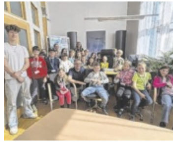
Besuch der Gemeinde

Um die Inhalte anschaulich zu vermitteln, setzt die Marktgemeinde Seewalchen seit 2023 auf ein mehrstufiges Programm.