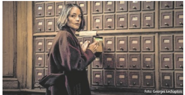
Jodie Foster spielt eine Therapeutin, deren Patientin ums Leben kommt.