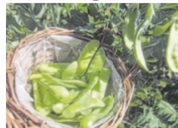
Düngen mit Hülsenfrüchten

ST. GEORGEN. Der Siedlerverein Attergau lädt zu einem Vortrag zum Thema „Düngen mit Hülsenfrüchten“ ein. Erbsen, Bohnen und Linsen können mithilfe von Knöllchenbakterien an ihren Wurzeln Stickstoff aus der Luft binden und so als natürlicher Dünger dienen. Bei richtiger Fruchtfolge profitieren auch andere Gemüsesorten davon. So benötigen etwa Kraut, Zucchini, Gurken, Paprika und Tomaten keinen zusätzlichen Dünger mehr. Wie Leguminosen optimal eingesetzt wer-