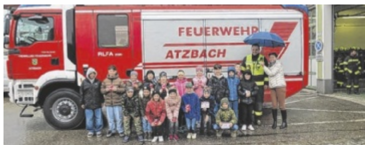
Die Kinder erhielten spannende Einblicke in den Feuerwehralltag.

vierte Klasse das Feuerwehrhaus, erhielt Einblicke in den Feuerwehralltag und bekam den Brandschutzausweis „Gemeinsam-Sicher-Feuerwehr“ überreicht. Auch im Kindergarten stand die Vermittlung von Wissen im Mittelpunkt. Die Kinder konnten Ausrüstung kennenlernen und teilweise anprobieren. Zudem wurde eine Evakuierung des verrauchten Gebäudes durchgeführt sowie die Rettung einer vermissten Person unter Atemschutz geübt. ■