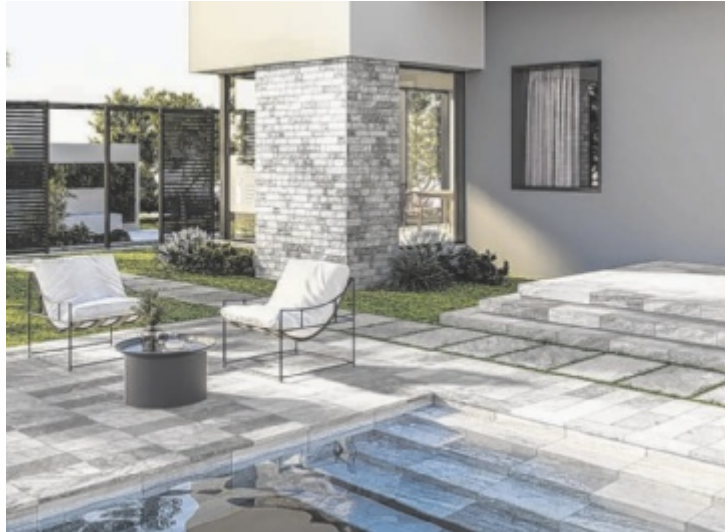
Ein Besuch im Schauraum in Regau lohnt sich allemal!

Für die Verlegung im Außenbereich bieten zwei Zentimeter starke Terrassenplatten aus Feinsteinzeug die perfekte Lösung. Eine Verlegung in Rasen, Kies oder mit Stelzlagern (fix oder höhenverstellbar) bedarf keiner besonderen Vorbereitung. Möglich ist natürlich auch eine Verlegung im Klebe- oder Mörtelbett, wobei eine Imprägnierung oder Behandlung der Fliesen nicht notwendig ist. „Überzeugen Sie sich von unserer großen Produktvielfalt, welche von der günstigen Aktionsfliese bis zur topmodernen Designerfliese reicht! Die Gestaltungsmöglichkeiten sind beinahe