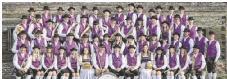
Musikkapelle Neukirchen an der Vöckla