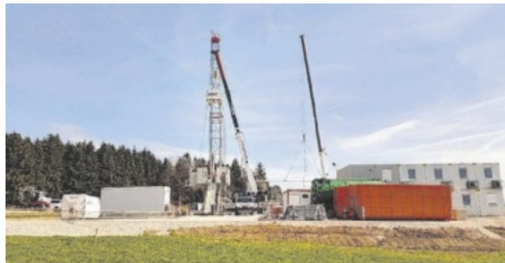
In Frankenmarkt startete die Bohrung nach Erdgas

Im Fokus stehen vergleichsweise seichte Erdgasvorkommen in sogenannten miozänen Sandsteinen der Hall-Formation. Ähnliche Lagerstätten haben in der Vergangenheit beachtliche Förderraten erreicht. Das aktuelle Prospektionsgebiet weist ein mittleres Potenzial von rund 226 Millionen Kubikmetern Erdgas auf, im besten Fall könnten es sogar knapp 500 Millionen Kubikmeter sein. Die Wahrscheinlichkeit, tatsäch-