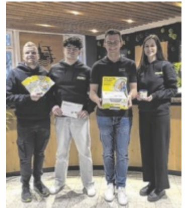
Übergabe der Typisierungsbox

Im vergangenen Jahr fand schon eine Typisierungsaktion beim