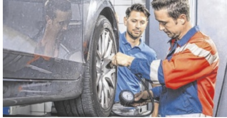
Wechsel auf Sommerreifen

Vor dem Wechsel sollten Sommerreifen genau überprüft werden. Die Mindestprofiltiefe liegt