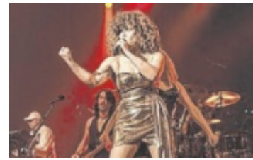
Tribute to Tina Turner

tergau um 14.30 Uhr zu einer Kirchen- und Friedhofsführung. Am Samstag, 9. Mai, ist das Museum der Heimatvertriebenen – Volksgruppen aus Alt-Österreich von 10 bis 15 Uhr geöffnet. Am Samstag, 2. Mai, und am Samstag, 9. Mai, ist das Uhrmacher-Handwerkermuseum jeweils von 9 bis 11.30 Uhr geöffnet. ■