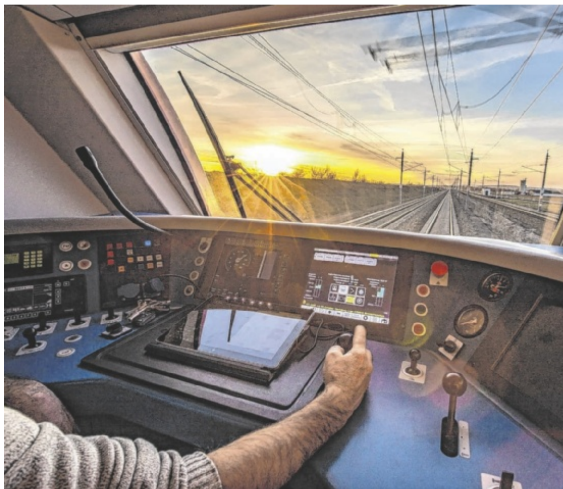
Sonnige Aussichten: Blick aus dem Führerstand, dem Arbeitsplatz eines Lokführers

ders hoch, da zusätzlich zum Ausgleich der Pensionierungen eine Aufstockung der Mannschaft erfolgen soll. Die bezahlte Ausbildung gliedert sich in Theorieeinheiten und Training am Fahrsimulator und später unter Anleitung im echten Fahrbetrieb. Nach 52 intensiven Wochen und bestandener Prüfung dürfen die fertigen Lokführer selbstständig am Führerstand Platz nehmen und die Verantwortung für Reisende und Güter übernehmen. Nach erfolgreich durchlaufener Ausbildung ist der zukünftige Dienstort üblicherweise in der Region oder in dem Bundesland, für welches man sich beworben hat. Um sich das umfassende Wissen anzueignen, sind technisches Interesse und Lernbereitschaft besonders wichtig. ■