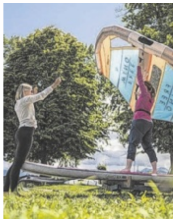
Lakebase in Ebensee ermöglicht Tests von Wassersportgeräten

EBENSEE. Von 1. bis 3. Mai wird Ebensee zum Wassersport-Hotspot. Die neue Lakebase bietet gratis Tests, Workshops und Action direkt am Traunsee.