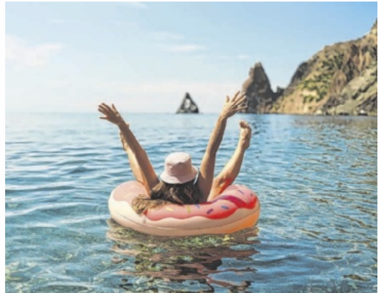
Auch unsichere Regionen verzeichnen weiter Buchungen.