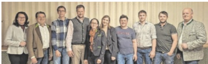
Bauernbundteam Zell am Pettenfirst

in eine Chance, die Gasförderung in Österreich auszubauen und unabhängiger von Importen zu werden. Neben HOCH-1 sind bereits weitere Bohrungen in Planung. Die Ergebnisse der Bohrung in Frankenmarkt werden in den kommenden Wochen erwartet und sollen Aufschluss über das tatsächliche Potenzial der Region geben. ■