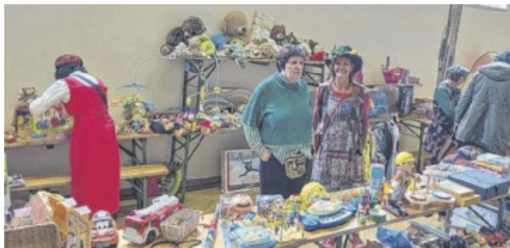
Der Flohmarkt in der Jahnturnhalle startet am 25. April um 7 Uhr.

bis Ende Oktober jeweils Donnerstag, Freitag, Samstag von 14 bis 18 Uhr sowie an Sonntagen von 10 bis 17 Uhr.