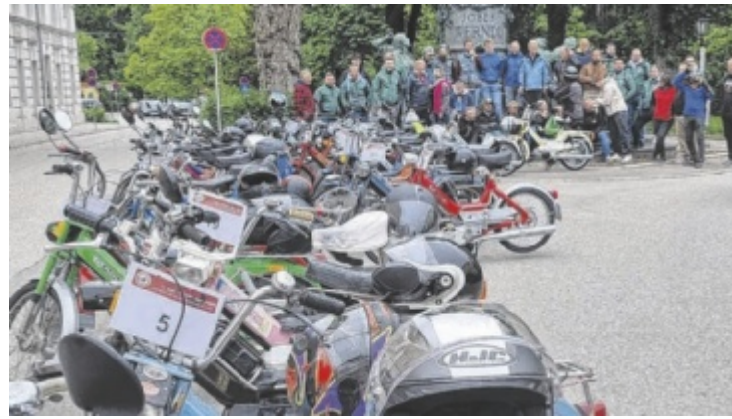
Das Puch Maxi-Treffen findet am 31. Mai in Steyr statt.