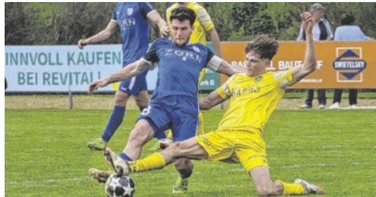
Bad Hall (in Blau) und Haidershofen trennten sich 1:1-Remis.

fahrt vor. Der 61-Jährige machte 59 Länderspiele für Österreich, spielte in seiner erfolgreichen Karriere unter anderem bei der Wiener Austria und Stuttgart. Schiedlberg feierte in der 18. Runde der Bezirksliga ein 9:0-Schützenfest gegen Schlusslicht Asten, Bad Hall musste sich gegen Nachzügler Haidershofen mit einem 1:1 begnügen. ■