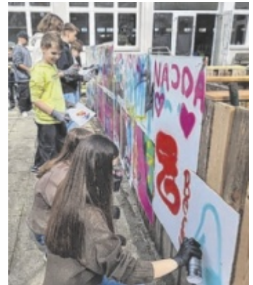
Graffiti-Projekts an der Mittelschule am Tabor.

STEYR. Der Schiffscontainer im Schulgarten der MS Tabor wird unter dem Motto „Einmal um die Welt zu einem farbenfrohen Kunstwerk gestaltet. Umgesetzt wird das Projekt, an dem sich Schüler aus allen Klassen beteiligen können, im Juni. Schon jetzt laufen die Vorbereitungen. Die Streetworker Vlad und Verena gaben zuletzt den jungen Künstlern Einblicke in die Welt des Graffitis, die Schüler konnten ihrer Kreativität beim Entwerfen eigener Designs freien Lauf lassen. ■