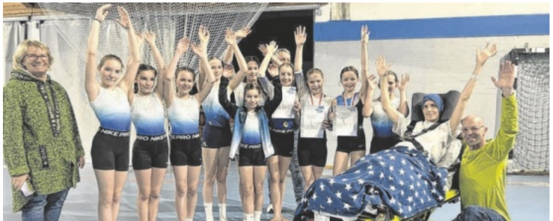
Die Rollenden Engel machten den Besuch beim Turnverein möglich.