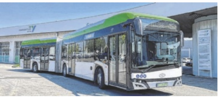
Die SBS testen den 18 Meter langen Solaris-Gelenkbus.