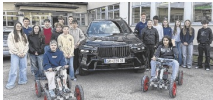
Das fertigen Go-Karts wurden bei der Schlussveranstaltung von BMW an die Partnerschule aus Garsten übergeben.

Mit dem Projekt „What’s about MINT?“ der Klasse 3b will man insbesondere Mädchen für technische Berufe begeistern und ihnen praxisnahe Einblicke in die Welt von Mathematik, Informatik, Naturwissenschaften und Technik (MINT) ermöglichen. Im Rahmen eines Unternehmensschuljahres planten und bauten die Jugendlichen gemeinsam mit dem Ausbildungsteam von BMW Steyr zwei Go-Karts. Dabei stan-