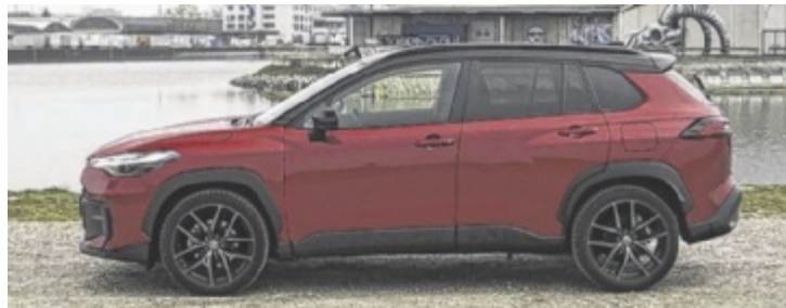
Der Toyota Corolla Cross 2,0 Hybrid 2WD GR Sport

Die neue, optisch erschlankte Front tut sich schwer, der Look zeigt sich am ehesten in den scharf geschnittenen LED-Lichtern. Deutlich präsenter ist das neue