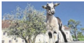
Der Sumerauerhof startet am 26. April in die neue Saison.

STEYR. Der deutsche Soziologe Klaus Dörre beleuchtet am Mittwoch, 29. April, um 19.30 Uhr im Museum Arbeitswelt „Die Utopie einer gerechten Weltwirtschaft“. Als einer der prägenden Sozialwissenschaftler im deutschen Sprachraum analysiert er die globale Wirtschaft, soziale Fragen, Umweltkrisen und Arbeit und erläutert Wege zu mehr Gerechtigkeit. Es folgt ein Austausch mit dem Publikum. VVK: 10 Euro ( museumarbeitswelt.at/shop ) ■