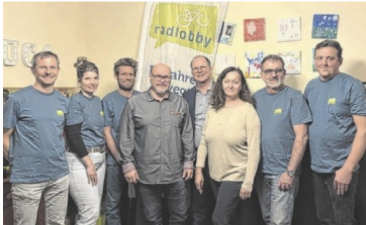
Gründungsitzung mit Vertretern der Stadtpolitik.

Mit der Vereinsgründung wird die organisatorische Basis für die weitere Arbeit rund um den Alltagsradverkehr gestärkt. Ziel des Vereins ist es, das Fahrrad als praktisches Verkehrsmittel im Alltag weiter zu fördern und die Bedingungen für Radfahrer in Bad Hall und Umgebung nach-