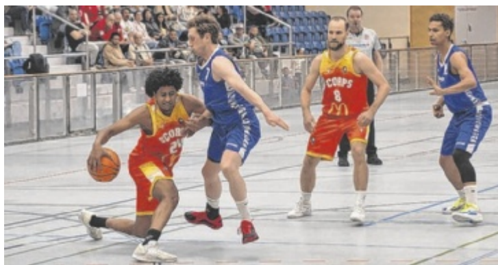
Steyr bezwang im Halbfinale das Team aus Gmunden.

Bis 5. Mai, 12 Uhr unter: www.lac-bmd-amateure.at Keine Nachnennungen