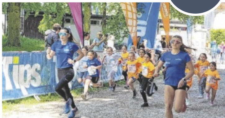
Die Freude an der Bewegung steht im Mittelpunkt.

Die Streckenlängen im Steyrer Schlosspark sind wie immer kurz gehalten und damit für alle zu schaffen. Bei der Veranstaltung steht die Freude an der Bewegung im Mittelpunkt. ■