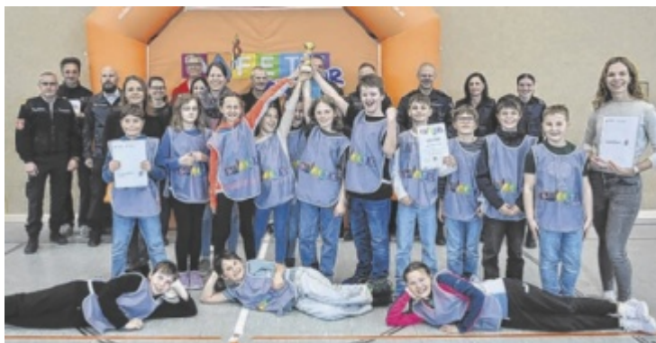
Die Volksschule Pfarrkirchen feierte einen Doppelsieg.

heitsparcours mit dem Scooter erforderten nicht nur das Wissen der jungen Teilnehmer, sondern auch ein bisschen Spielglück. Die 4b-Klasse der VS Pfarrkirchen sicherte sich den Bezirksieg vor der 4a-Klasse aus Pfarrkirchen sowie vor der 3. Klasse der VS Kleinraming. Die Bezirksieger dürfen am Landesfinale teilnehmen. ■