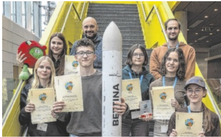
Die Projektgruppe des Bundesrealgymnasiums Steyr Michaelerplatz wurde als professionellstes Team ausgezeichnet.