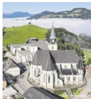
Die Kirche von Maria Neustift ist Anziehungspunkt für Wallfahrer.

Im Zentrum der Abend-Andachten steht die Gnadenmadonna am Barockaltar: Die rund 550 Jahre alte Marienfigur hält den Menschen den Jesusknaben entgegen – ein Bild, das seit Generationen berührt. Im Anschluss wird der Wallfahrersegen gespendet. ■