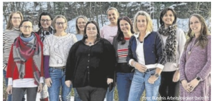
Partnerinnen des Bündnis Arbeitslosigkeit (be)trifft freuen sich auf rege Teilnahme.

Karten: www.wonderworld-shows.at +Tel. Bestellung: 0676 50 40 447