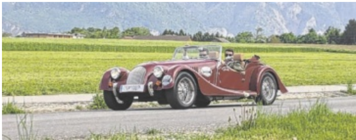
Die Lions Classic feierte im Vorjahr 20-Jahr-Jubiläum.

Kurpark zurück. Die diesjährige Strecke führt die Teilnehmer über abwechslungsreiche Haupt- und Nebenstraßen zunächst nach Aschach und weiter über den Oberdamberg in Richtung Gesäuse bis zum Stift Admont. Am späten Nachmittag wird der Konvoi zurück in Bad Hall erwartet. Wie jedes Jahr kommt der gesamte Reinerlös der Veranstaltung zu 100 Prozent bedürftigen Menschen in der Region Bad Hall zugute. ■