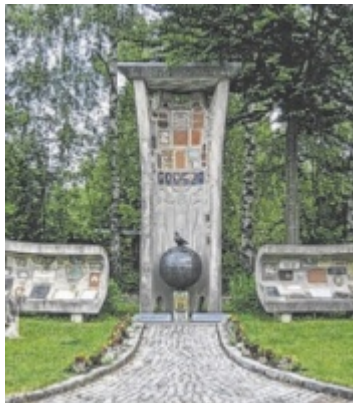
Sympathicus St. Ulrich (Bild) und Gleink sind Bezirksieger beim Sympathicus und nun im Rennen um den Landessieg. Seite 8