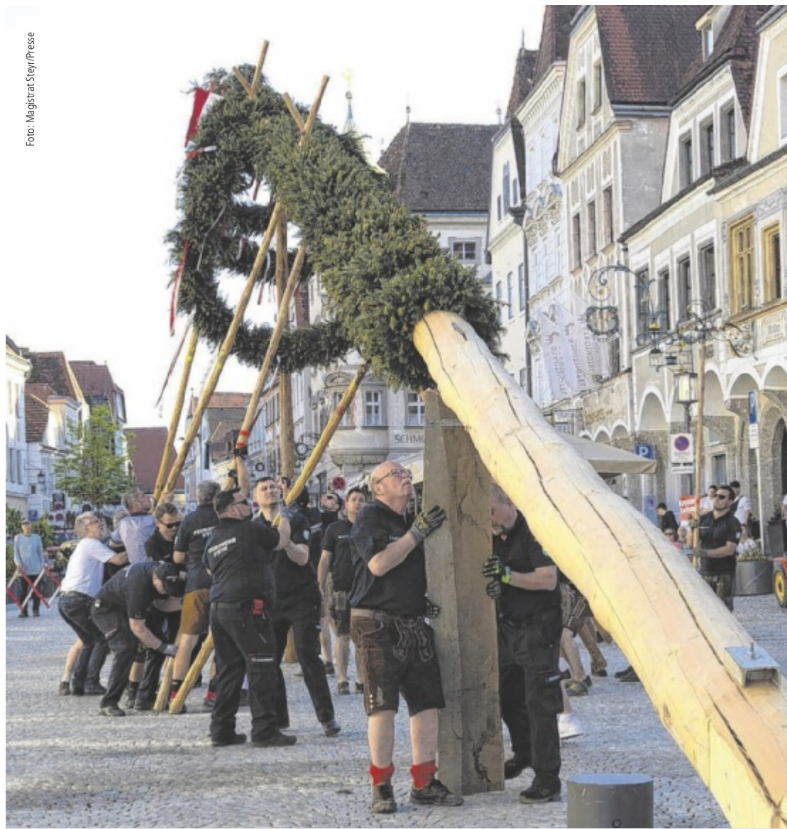
Tradition hochhalten Maibaumfeste stehen in der ganzen Region Ende April auf dem Programm. An vielen Orten wird der Maibaum nach alter Tradition per Muskelkraft aufgestellt, wie etwa am Stadtplatz in Steyr. Seite 5