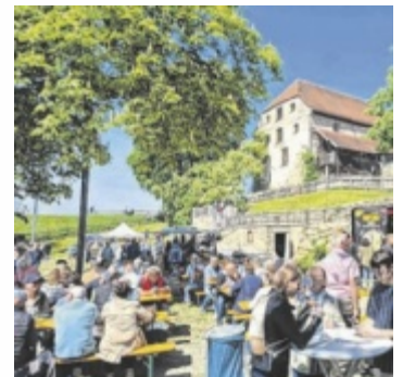
Auf Burg Frauenstein findet ein Frühlingsmarkt statt.

Am Sonntag, 26. April, verwandelt sich die Burg Frauenstein in Mining von 10 bis 18 Uhr wieder in einen lebendigen Treffpunkt für Liebhaber von regionalem Handwerk, Kunst und originellen Geschenkideen. Über 60 Aussteller präsentieren ihre vielfältigen Produkte sowohl im historischen Salzstadel als auch im weitläufigen Freigelände der Burg. Besucher können nach Herzenslust stöbern, einzigartige Stücke entdecken und sich inspirieren lassen. Für das leibliche Wohl sorgt die Burgschänke