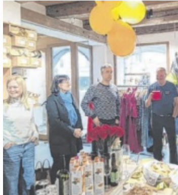
Mit Freunden und Kunden wurde das Jubiläum gefeiert.

Der zentrale Standort hat sich dabei als ideal erwiesen. Auch das vielfältige Sortiment trägt