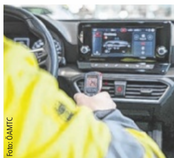
Eine Wartung der Klimaanlage stellt sicher, dass sie im Betrieb zuverlässig kühlt.

„Durch regelmäßige Wartung bleibt die Kühlleistung auch bei steigenden Temperaturen optimal“, erklärt ÖAMTC-Techniker Michael Osterkorn. Besonders Allergiker profitieren, wenn gleichzeitig der Pollen- bzw. Innenraumfilter gewechselt wird. Jährlich gehen bis zu zehn Prozent des Kältemittels verloren, wodurch die Kühlleistung nachlässt. Da das Kältemittel auch Öl zur Schmierung des Kompressors enthält, kann ein zu geringer Stand Schäden verursachen. Ein Klimaanlage-Check stellt sicher, dass ausreichend Kältemittel vorhanden ist: Das Kühlmittel wird abgesaugt, Feuchtigkeit entfernt und neu befüllt. Im Kühler können sich Bakterien und Pilze ansiedeln,