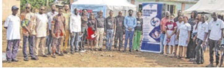
Die Menschen in Awgu sind sehr dankbar für die Unterstützung.