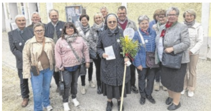
Das Miteinander stand im Vordergrund.

Viele der anwesenden Festgäste äußerten den Wunsch, einen solchen gemeinsamen Gottesdienst künftig jährlich zu feiern – als sichtbares Zeichen der Einheit und des Zusammengehörigkeitsgefühls. ■