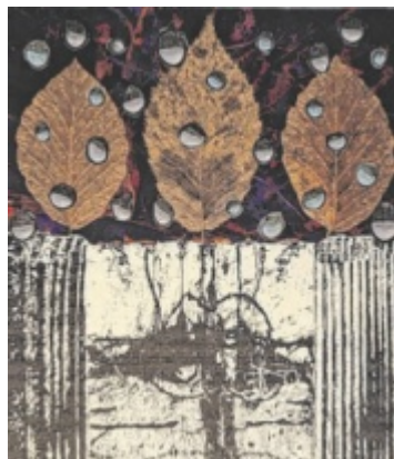
Wolfgang Friedwagner: „Herbst“

symbolhafte Fundstücke und Blattgold einfügt – eine Hommage an die Innviertler Landschaft.