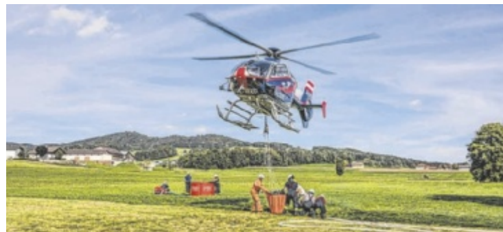
Bezirks-Zivilschutztag in Frankenburg mit Leistungsschau zum Jubiläum

bereich werden auch spannende Schauübungen durchgeführt, Hub-schrauberrundflüge angeboten und ein Kinderprogramm für Unterhaltung sorgen. Natürlich kommt auch die Kulinarik nicht zu kurz. Vertreten sind bei diesem großen Zivilschutztag die Feuerwehren, das Rote Kreuz, die Polizei, das Bundesheer, Autofahrerorganisationen und viele weitere Stellen, die für Sicherheit und Hilfe der Bevölkerung sorgen. ■ Anzeige