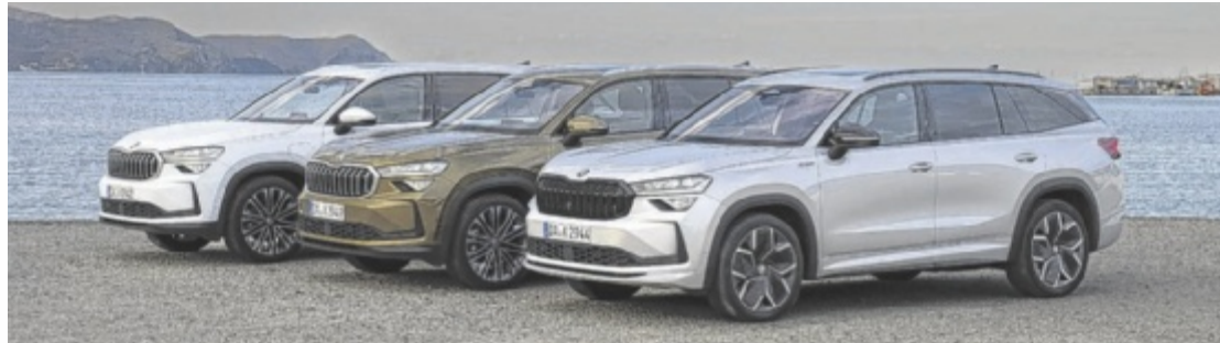
Škoda Kodiaq: viel Raum, Effizienz und Innovation

Škoda bietet den Kodiaq mit einer breiten Motorenpalette an: zwei Benziner, zwei Diesel und erstmals ein Plug-in-Hybrid. Der Hybridantrieb kombiniert einen 1,5-TSI-Benziner mit einem Elektromotor, erreicht eine Systemleistung von 150 kW (204 PS) und ermöglicht