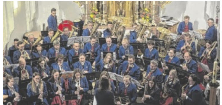
Gruppenfoto in der Kirche mit den Musikern