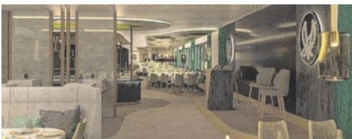
Die kleine Bühne bleibt in der Mitte des Business-Clubs.