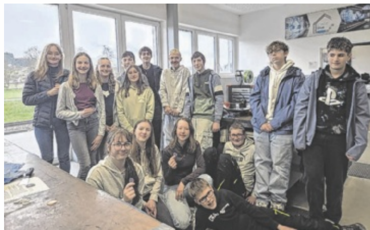
Spannende Aufgaben warteten auf die Schüler bei den Talent Days. Sie fertigten den „Schlüssel der Zukunft“ bei Scheuch, AGS und InnRaum3.

Die Tour vermittelte anschaulich, wie Kreativität, technisches Verständnis und digitale Kom-