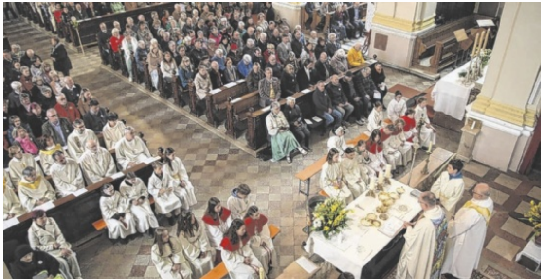
Die Stadtpfarrkirche war bis auf den letzten Platz gefüllt

Der anschließende Festgottesdienst übertraf alle Erwartungen: Die Kirche war bis auf den letzten Platz gefüllt. Gemeinsam feierten alle Priester der neuen Pfarre die Messe in Konzelebration, unterstützt von Diakonen, hauptamtlichen Seelsorgern sowie ehrenamtlichen Wort-Gottes-Feier-Leitenden. Ein besonderes Zeichen der Verbundenheit setzten