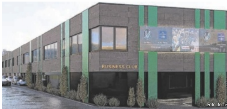
Die geplante Außenansicht – der Bereich vor dem Eingang ist künftig überdacht.

RIED. Die SV Oberbank Ried plant für die nächsten fünf Jahre Investitionen von insgesamt 16 Millionen Euro. Damit sollen der VIP-Klub vergrößert, das Stadion saniert, ein Fandorf errichtet und zusätzliche Trainingsplätze für die Fußballakademie angelegt werden. Zwei Drittel der Kosten, maximal 10,7 Millionen Euro, kommen als Förderung vom Land.