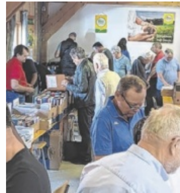
Der Andrang bei den letzten Tauschtagen des IBSV war groß.