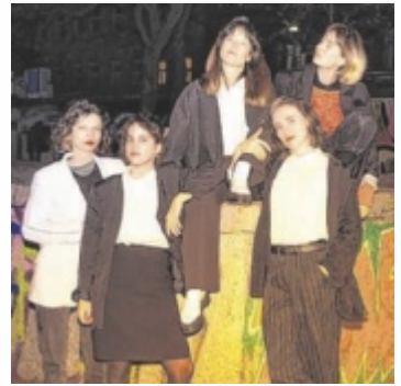
Cousines Like Shit kommen am 24. April ins KiK.

RIED. Das KiK präsentiert am Freitag, 24. April, ein Konzert mit der „Avant Trash“-Band Cousins Like Shit.