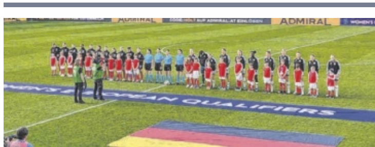
Das österreichische Nationalteam stoppte in Ried den Negativtrend.

Für Unverständnis sorgte die Bemerkung, dass man „über das Verhalten der Hartberger Anhänger enttäuscht“ sei. Hartberg reagierte online erwartungsgemäß mit „jetzt erst recht“: Es sei „schade, wenn gelebte Fankultur, die aus purer Begeisterung für den Sport entsteht, so negativ gesehen wird“.