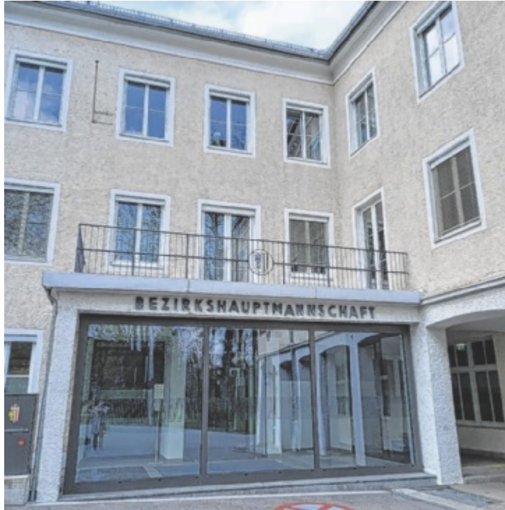
Die Bezirkshauptmannschaft Ried ist für viele Bereiche zuständig.

Das Aufgabengebiet umfasst außerdem den Bereich Verkehrssicherheit. Hier wurden im vergangenen Jahr 2.913 Führerscheinprüfungen begleitet und 4.194 Lenkberechtigungen ausgestellt. Die Behörde ahndete zudem 58.728 Verkehrsstrafde-