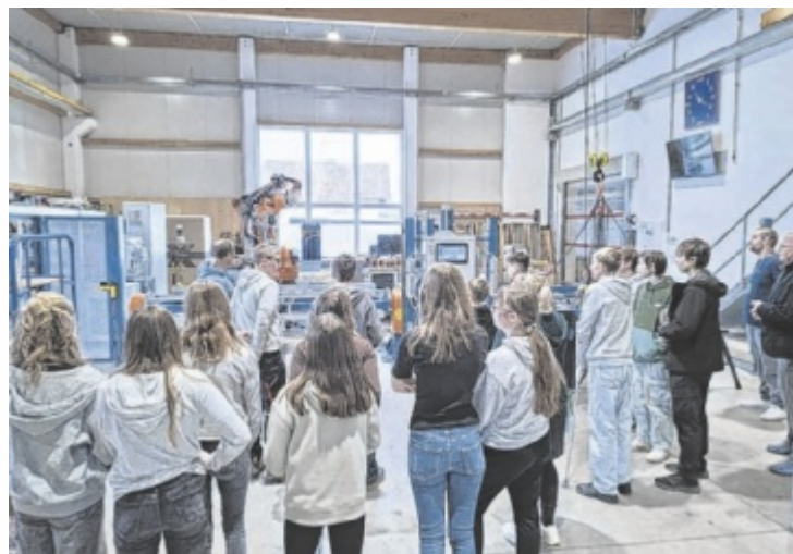
Die Schüler besuchten auch die Firma AGS.