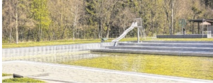
Das Freibad kurz vor Beginn der Reinigungsarbeiten

RIED. Die Eröffnung des Rieder Freibades ist heuer für Samstag, 16. Mai, geplant - bei schlechtem Wetter ist eine Verschiebung des Termins möglich. Die Vorbereitungen laufen dazu seit Anfang April. Beim Kombiticket gibt es erstmals eine Kooperation mit Umlandgemeinden.