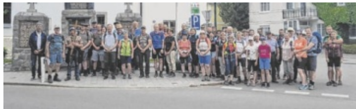
Jedes Jahr marschieren die Innviertler nach Maria Schmolln.

RIED. Zahlreiche Pilger aus Tumeltsham und Ried machen sich bei der Friedens- und Familienwallfahrt auf den Weg, um gemeinsam ein Zeichen für Zusammenhalt und Frieden zu setzen.