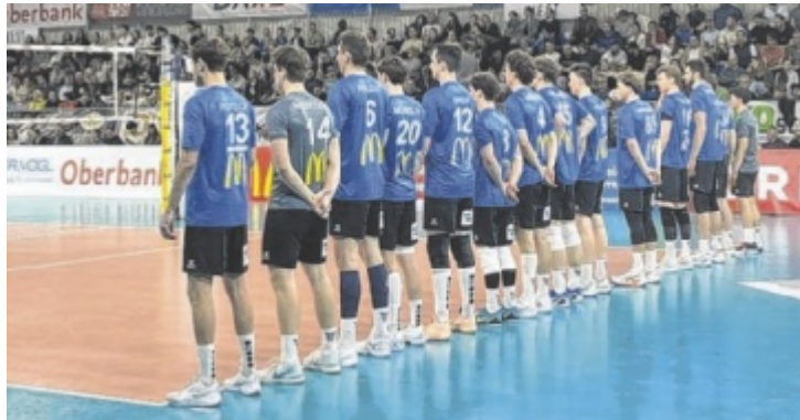
Schlechtes Timing: Im ersten Final-Heimspiel im Raiffeisen-Volleydome riss die Siegerserie des UVC McDonald's Ried.

RIED. Nach vier Siegen in Folge hat der UVC McDonald's Ried wieder ein Spiel verloren. Das zweite Match in der Finalserie der österreichischen Meisterschaft gewann der TSV Raiffeisen Hartberg am Donnerstag, 16. April, im erneut ausverkauften Rieder Volleydome klar mit 3:0 (25:19, 25:19, 25:19).