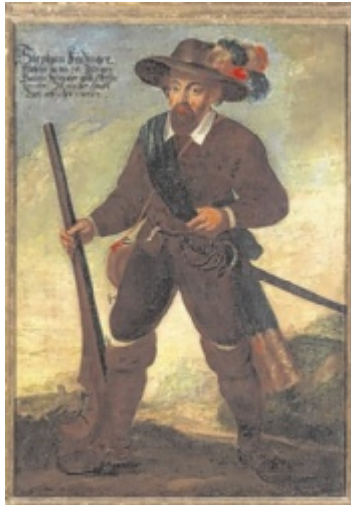
Stefan Fadinger wurde zur Symbolfigur eines Kampfes um Freiheit und Selbstbestimmung

Zentraler Teil der „communale“ ist die Ausstellung „Bauernkrieg 1626 – Zwischen Geschichte und Fiktion“ im Schlossmuseum Linz (Eröffnung: 8. Mai). Sie beleuchtet die Ereignisse 1626 und die Bedingungen, die zum bewaffneten Aufstand führen sollten. Sie bietet Einblicke in die von Krisen geprägten Lebenswelten der Bevölkerung und folgt den anfänglichen Erfolgen der Aufständischen im Mai 1626 über die letztlich scheiternde Belagerung des Linzer Schlosses bis hin zu ihren verheerenden Niederlagen im November 1626. Beleuchtet wird in der Ausstellung, kuratiert von Konstantin Ferihumer, aber auch, wie die Gesellschaften über die Jahrhunderte mit der Geschichte der Bauernkriege 1626 umgegangen sind. Wie hochstilisiert wurde, wie uminterpretiert. Alfred Weidinger, wissenschaftlicher Geschäftsführer der OÖ Landes-Kultur GmbH erzählt, dass die Ausstellung zu 350 Jahre Bauernkrieg vor 50 Jahren in Linz 750 Ka-