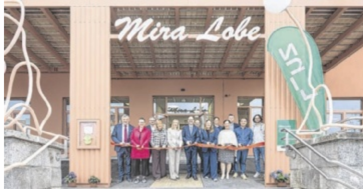
Die Mira-Lobe-Schule samt Hort wurde feierlich eröffnet.

Das bestehende Schulgebäude wurde umfassend saniert. Offene