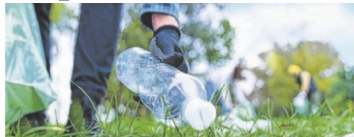
Anmelden, Müllsäcke abholen und los geht's.

Und so geht's: Müllsäcke und Handschuhe werden von Landesabfallverband, Linz AG und Stadt