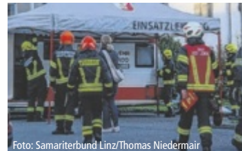
Die Zusammenarbeit funktionierte.

Beteiligt waren unter anderem die Feuerwehren Hart, Leonding und Ruffling. Die besondere Herausforderung lag in der Evakuierung der Bewohner sowie der Suche nach vermissten Personen. Insgesamt 17 Betroffene wurden im Zuge der Übung vom Samariterbund medizinisch versorgt, teils mit angenommenen Rauchgasvergiftungen. Auch die Feuerwehr Axberg wur-