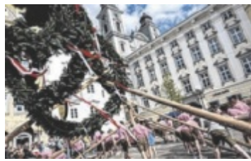
Am 30. April wird der Maibaum am Hauptplatz aufgestellt.

Ohne diese Anpassung könnte sich die Bauzeit auf bis zu dreieinhalb Jahre verlängern, weil Baustellenflächen für Veranstaltungen, Märkte und andere Nutzungen immer wieder verkleinert oder geräumt werden müssten. ■