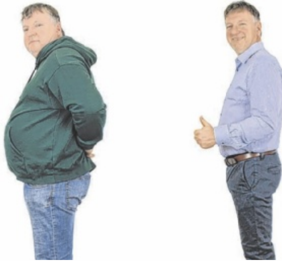
Größe 50 statt 56: Gefährliches Bauchfett halbiert, Lebensqualität verdoppelt

„Die Rezepte waren einfach toll“, erzählt der 55-jährige Landwirt. Statt Hunger erlebte er Genuss – und rasch erste Erfolgsmomente: etwa, als die Waage endlich unter 100 Kilo zeigte. Nach nur 16 Wochen easylife-Stoffwechseltherapie verlor er beeindruckende 37 Kilogramm, auch sein Körperumfang verringerte