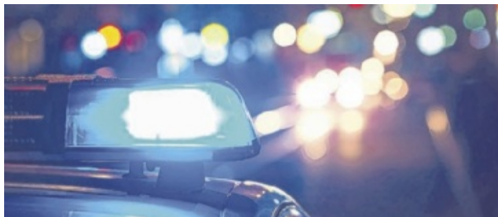
Schwerpunktkontrolle gegen Roadrunner-Szene in Linz

Insgesamt 171 Fahrzeuge wurden kontrolliert, wobei 18 Fahrzeuge einer sofortigen technischen Überprüfung (Technik und Lärm) unterzogen wurden. An zwölf Fahrzeugen wurden schwere technische Mängel mit Gefahr in Verzug festgestellt. Bei diesen Fahrzeugen wurden noch vor Ort die Kennzeichen abgenommen. Insgesamt wurden 85 Anzeigen wegen technischer Mängel erstattet.