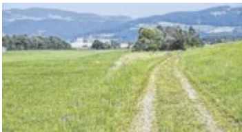
Der Linzer Segelflugplatz