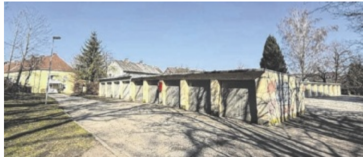
Statt dieser Garagen soll ein dreistöckiger Wohnbau entstehen.

Für Bürgermeister Dietmar Prammer (SPÖ) geht es beim Projekt um eine „maßvolle Nachverdichtung“. Die Fläche ist bereits versiegelt, es werden also keine neuen Flächen verbraucht. Gleichzeitig schafft