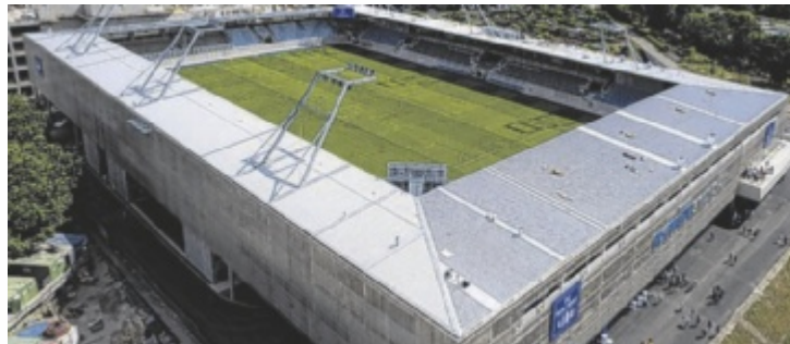
Der Bau des Linzer Donauparkstadions (Archivbild) wurde geprüft.

LINZ. Der Neubau des Donauparkstadions in Linz hat laut Rechnungshof (RH) letztlich deutlich mehr gekostet als ursprünglich vorgesehen. Laut den Berechnungen der Prüfer wurden rund 59,9 Millionen Euro investiert. Der RH legt außerdem nahe, rund eine Million Euro zurückzufordern.