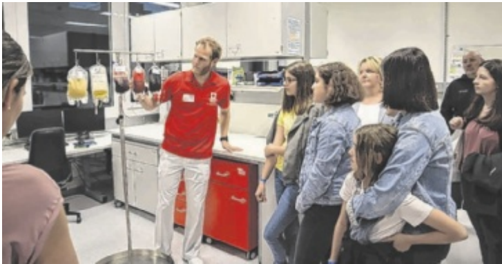
Besucher erhalten spannende Einblicke in der Blutzentrale Linz.