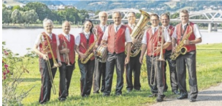
Die Magistratsmusik Linz feiert heuer ihr 100-jähriges Bestehen.

Mit ihren Maikonzerten eröffnet die Magistratsmusik alljährlich die Reihe „Wort & Klang“, die zu Veranstaltungen unter freiem Himmel im Botanischen Garten Linz einlädt. Gespielt wird donnerstags am 7., 21. und 28. Mai um 15 Uhr. Am Programm steht ein Mix aus Tradition und moderner Unterhaltungsmusik. Die Konzerte finden nur bei Schönwetter statt. Kosten: Eintritt in den Botanischen Garten Eintritt frei ist bei den Konzerten am Hauptplatz, im Volksgarten