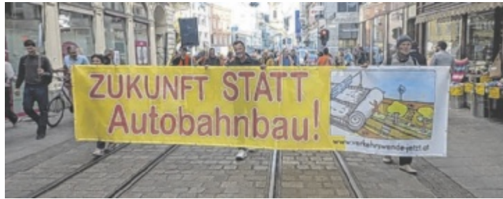
Eine Demo gegen die A26 zog durch die Innenstadt.

Zusätzlich stellte das Gericht fest, dass der Initiative die notwendige rechtliche Grundlage für die Beschwerde gefehlt hat. „Für Volksbefragungen gelten klare gesetzliche Regeln. Diese wurden in diesem Fall nicht erfüllt“, so Prammer.