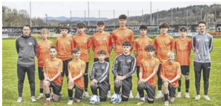
Junge Kicker aus ganz Oberösterreich wollen zum Gothia Cup nach Schweden reisen. Noch aber scheitert es an der Finanzierung.

Die Fußballschule OÖ mit Sitz in Steyregg fördert junge Talente im ganzen Bundesland. Sie ist ein eigenständiger Verein, welcher Fußballcamps, Turniere und Techniktrainings an mehreren Standorten organisiert und veranstaltet. Im Fußball-Ausbildungs-Zentrum OÖ werden mehr als 120 Kinder im Alter von 8 bis