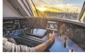
Blick aus dem Führerstand

Auch die ÖBB suchen wegen des Generationenwandels Personal. Im Bereich der Lokführer ist der Bedarf an Neuaufnahmen besonders hoch, da zusätzlich zum Ausgleich der Pensionierungen eine Aufstockung der Mannschaft erfolgen soll. Die bezahlte Ausbildung gliedert sich in Theorieeinheiten und Training am Fahrsimulator und später unter Anleitung im echten Fahrbetrieb.