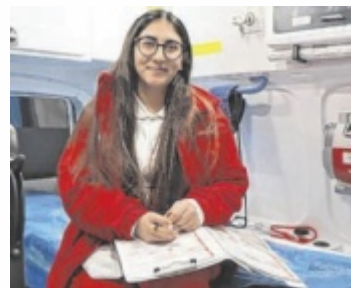
Die Ortsstelle Linz-Süd sucht motivierte Freiwillige

ckende Versorgung: Freiwillige unterstützen bei Krankentransporten ebenso wie bei Notfällen. Dabei sind neben medizinischem Grundwissen auch soziale Kompetenzen gefragt, zum Beispiel im Umgang mit Patienten oder ihren Angehörigen. Zum Aufgabenbereich zählen außerdem Einsätze bei Veranstaltungen. Dort sorgen Rettungsteams für die medizinische Versorgung vor Ort. Im Ernstfall müssen sie rasch reagieren und erste Maßnahmen ergreifen.