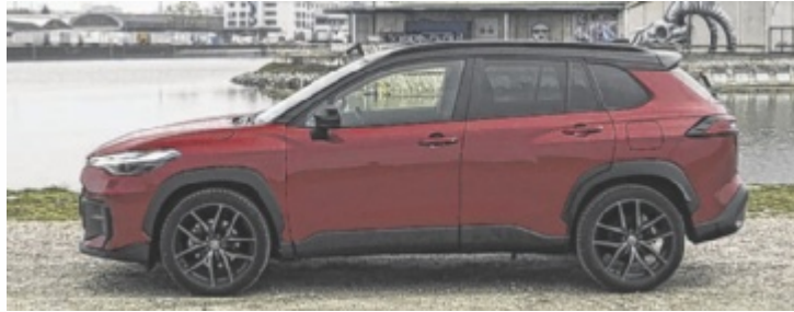
Der Toyota Corolla Cross 2,0 Hybrid 2WD GR Sport

Die neue, optisch erschlankte Front tut sich schwer, der Look zeigt sich am ehesten in den scharf geschnittenen LED-Lichtern. Deutlich präsenter ist das neue