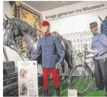
Das Museum Wehrgeschichte OÖ öffnet seine Türen.

Auf eine Reise in die Vergangenheit geht es mit dem Museum Wehrgeschichte OÖ: Am 2. Mai findet um 14 Uhr ein kostenloser Geschichtsrundgang statt, der sich auf die Spuren des Gefechts von Ebelsberg am 3. Mai 1809 begibt. Anmeldung erforderlich: archiv@