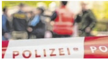
Die Ermittlungen nach der Beil-Attacke laufen.

Ein 40-jähriger Security-Mitarbeiter einer nahegelegenen Bank wurde am Südbahnhofmarkt unvermittelt angegriffen. Der 30-jährige mutmaßliche Täter soll mit dem Handbeil mehrmals auf sein Opfer eingeschlagen haben. Gernot Landsfried vom Lokal „MA 28“ am