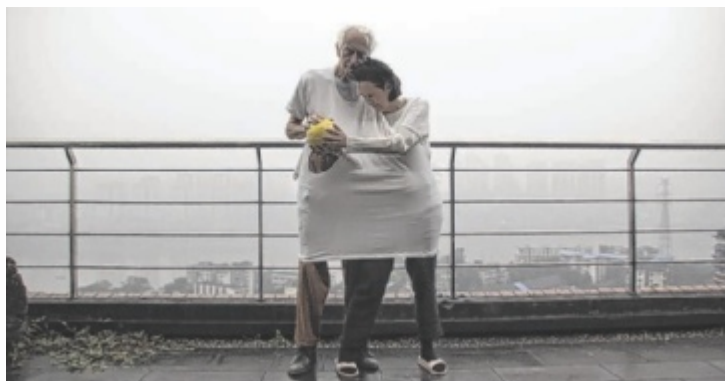
Der Film „Die Kunstkomplizen“ begleitet das Künstlerduo PRINZpod.

Das Filmprogramm der 23. Ausgabe bietet dem Publikum Einblicke in Lebenswelten aus ganz Europa und soll Anstoß zur Auseinandersetzung mit der europäischen Gegenwartsgesellschaft sein. In bewährter Tradition stehen vier Eröffnungsfilme stellvertretend für die Vielfalt. So erzählt