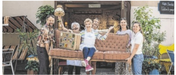
Die Backomas kommen erstmals nach Linz.

Die Vollpension geht auch auf Tour. Heuer wird erstmals Linz angesteuert: Von 30. April bis 3.