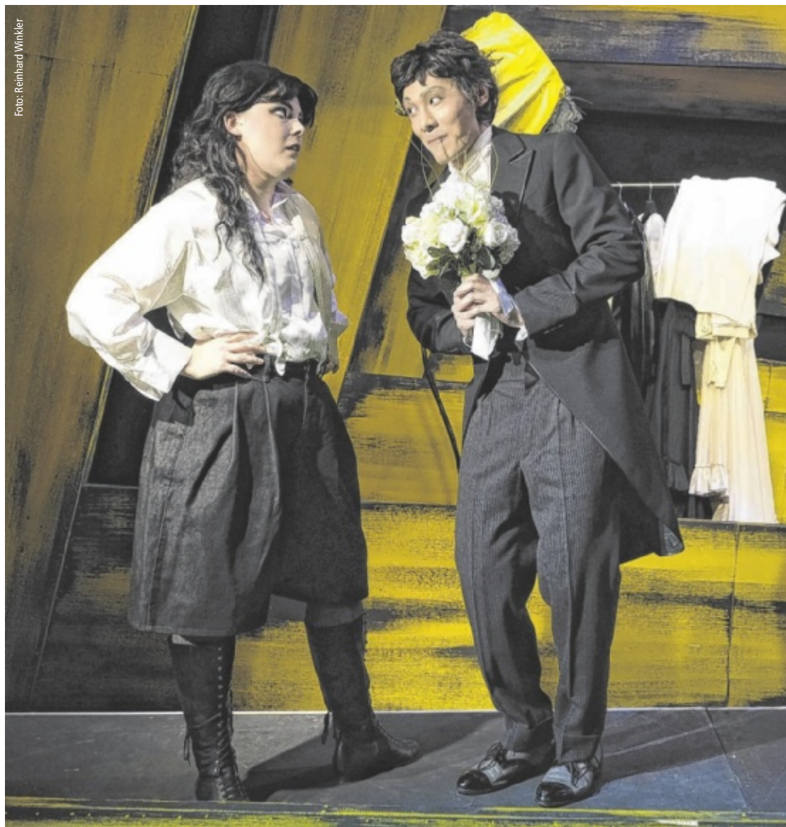
Uraufführung Gleich drei Premieren stehen im Landestheater Linz vor der Tür, darunter die Uraufführung von Walter Kaufmanns Operette „Heute Nacht Fräulein“ (Foto). Auch der Spielplan für 2026/2027 ist mittlerweile bekannt. Seite 26