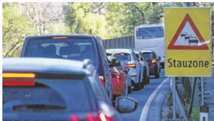
Massive Staus auf der B3 sorgen für Zeitverzögerungen.

Einen wichtigen Hinweis hat der Landesobmann der Oberösterreichischen Pendlerinitiative noch für die Betroffenen: „Bei einem anderen Weg zum Arbeitsplatz kann sich das auf die Pendlerpauschale und den Pendlereuro auswirken. Das sollte man auch dem Arbeitgeber bekannt geben beziehungsweise beim Lohnsteuerausgleich berücksichtigen.“ ■