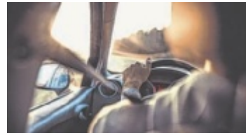
Der Verkehr in der Schwaigaustraße wird Thema im kommenden Gemeinderat.