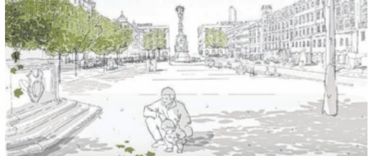
Teilflächen sollen entsiegelt und begrünt werden.

Bodenuntersuchungen haben gezeigt, dass die Abdichtung der Tiefgaragendecke unter großen Teilen des Hauptplatzes saniert werden muss. Die Stadt verbindet diese Arbeiten nun mit der geplanten Neupflasterung. So würden spätere zusätzliche Baustellen vermieden. „Wir verschieben den Umbau nicht, weil das Projekt an Bedeutung verliert, sondern weil wir jetzt die zusätzlichen Arbeiten mitdenken, die für eine langfristig sinnvolle Umset-