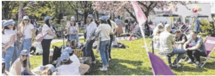
Frühstücks-Clubbing im Kiosk Café Tutto Berny

Von DJ-Sets über Live-Konzerte bis hin zu Workshops und Ausstellungen ging das Clubfestival bei bestem Frühjahrswetter über die Bühne. Linzer Clubs der freien Szene waren ebenso Teil wie das OK Deck, das in bewährter Weise den FM4 Club beheimatete. Am