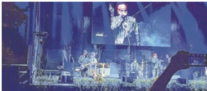
Die Ostpartie vor rund 5.000 Zusehern am Wiener Zentralfriedhof

DO 08.04.2027 - ALEX KRISTAN @ ENNS / STADTHALLE