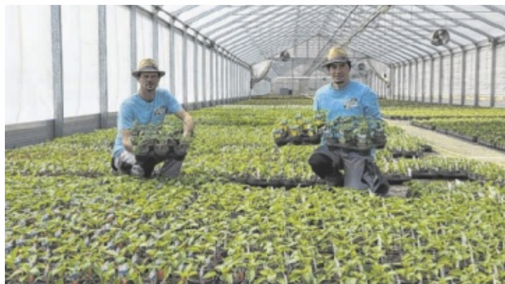
Ertragreiche und widerstandsfähige Gemüsejungpflanzen