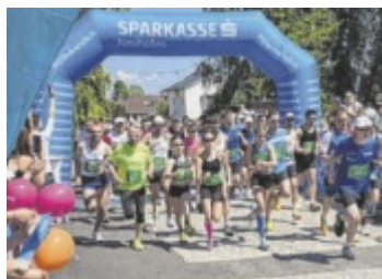
Der #glaubandich RUN wird heuer erstmals zum Night Run.

Zum fünften Mal findet der von der Sparkasse Neuhofen organisierte #glaubandich RUN statt. Aber heuer mit einer besonderen Premiere im Herzen des Ortes.: Erstmals startet der Hauptlauf nach Sonnenuntergang. Die neue, rund 5,2 Kilometer lange Strecke ist nahezu eben, führt durch das Ortszentrum sowie über die Bundesstraße und ist somit ideal für alle, die entspannt laufen oder persönliche Bestzeiten jagen wollen. Ob Hobbyläufer, ambitionierter