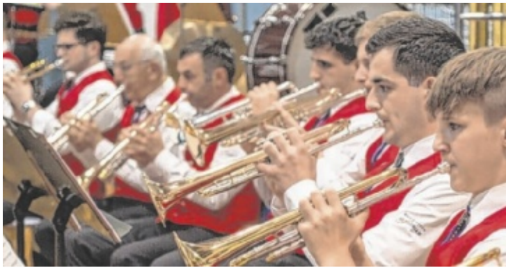
Mitglieder des Musikvereins St. Florian bei einem Konzert