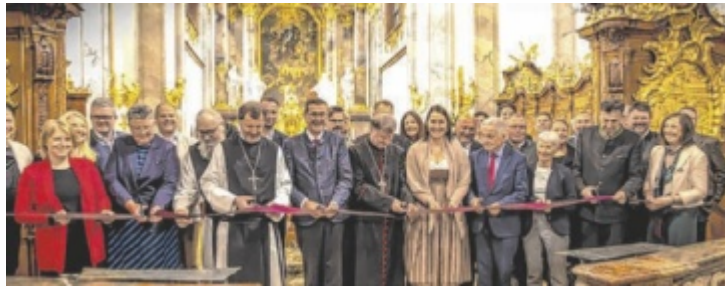
Der neue Wilheringer Weg wurde offiziell eröffnet.