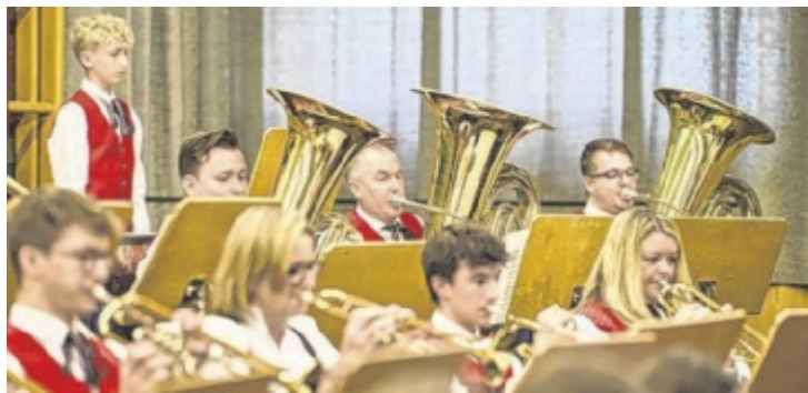
Der Musikverein Schönering bietet ein vielfältiges Programm.