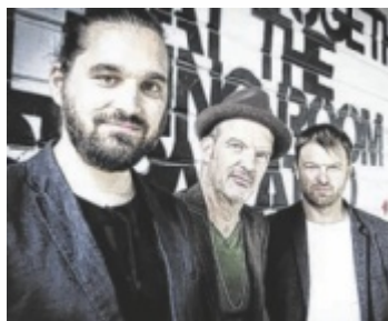
Das Wolfgang Muthspiel Chamber Trio ist im Mai zu Gast.