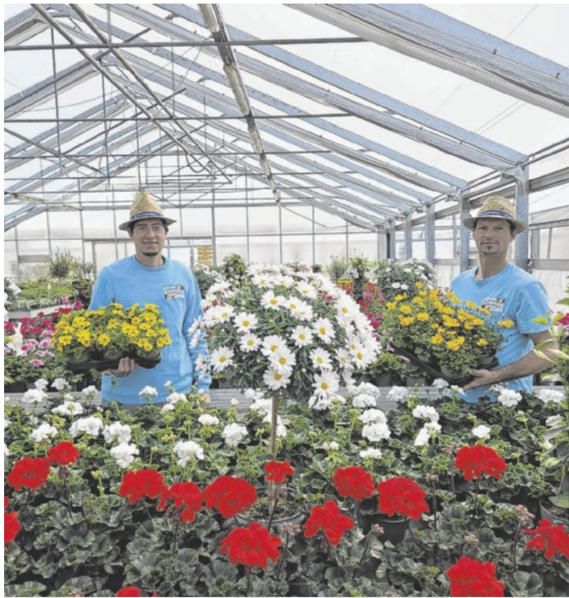
Regionalitäts-Aktionswoche Die Gärtnerei Loizenbauer lädt zur Aktionswoche ein, in der nachhaltig und regional gezogene Eigenproduktionen zu Sonderpreisen angeboten werden.