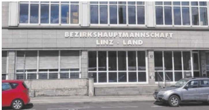
221 Mitarbeiter sorgen dafür, dass alle Abläufe funktionieren.

Gleichzeitig funktioniert die Behörde als zentrale Drehscheibe: Wer mit einem Anliegen kommt, wird bei Bedarf an die passende Fachabteilung weitergeleitet. So greifen unterschiedliche Bereiche ineinander – vom einfachen Antrag bis zu umfangreichen