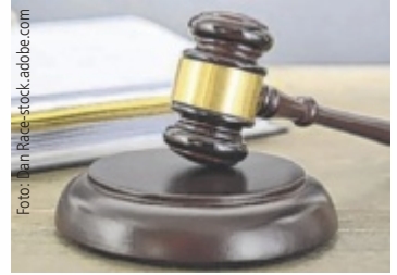
Das Geschworenengericht verhängt im Doppelmordprozess die Höchststrafe für den 78-jährigen Angeklagten.

ENNS/STEYR. Am Landesgericht Steyr ist am 15. April das Urteil im Prozess um einen Doppelmord in Enns gefallen. Der 78-jährige Angeklagte wurde von einem Geschworenengericht schuldig gesprochen und zu lebenslanger Freiheitsstrafe verurteilt.