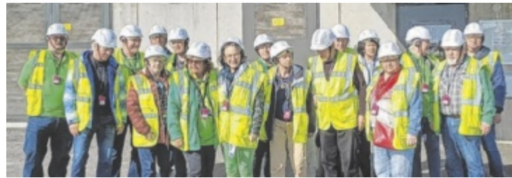
Teilnehmer des Siedlervereins bei ihrer Exkursion zur TriPlast im Ennshafen.