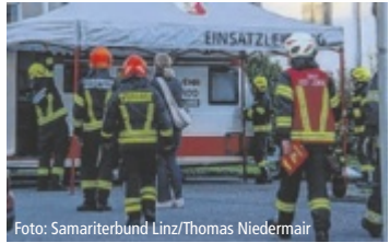
Die Zusammenarbeit funktionierte.

LEONDING/LINZ. In einer betreuten Wohneinrichtung in Leonding ist der Ernstfall geübt worden. Der Arbeiter-Samariterbund Linz trainierte gemeinsam mit mehreren Feuerwehren. Angenommen wurde ein Dachbrand, bei dem sich Rauch über einen Liftschacht bis in den Keller ausbreitete.