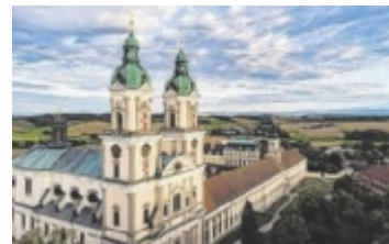
Das Augustiner Chorherrenstift Sankt Florian lädt ein.

LINZ-LAND. Oberösterreich steht von 1. bis 10. Mai im Zeichen der Museen: Bei der Aktionswoche „Treffpunkt Museum“ öffnen 73 Häuser mit rund 200 Programmpunkten ihre Türen. Besonders stark beteiligt ist der Bezirk Linz-Land mit acht Museen und 19 Programmpunkten.