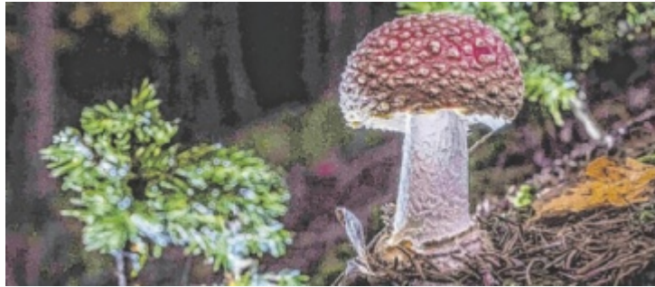
Viele Mythen ranken sich um den giftigen Fliegenpilz.

RIEDAU. Zum 25-jährigen Bestehen widmet sich das Lignorama in Riedau heuer einem oft übersehenen, aber zentralen Bestandteil unserer Umwelt: den Pilzen. Die Sonderausstellung „Pilze. Heimliche Herrscher“ vermittelt ab Donnerstag, 30. April, Wissenswertes über Fliegenpilz und Co.