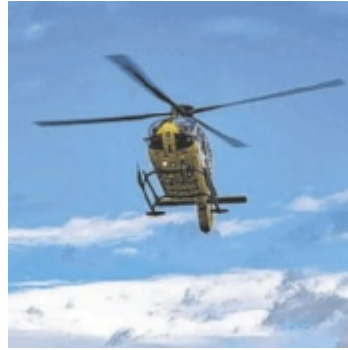
Ein Notarzthubschrauber soll in Suben in Zukunft rund um die Uhr einsatzbereit sein.

Mit dem Notarzthubschrauber sollen künftig auch jene Teile Oberösterreichs, die derzeit von rund um die Uhr verfügbaren Stützpunkten in Niederösterreich und der Steiermark nicht optimal abgedeckt sind, schnell-