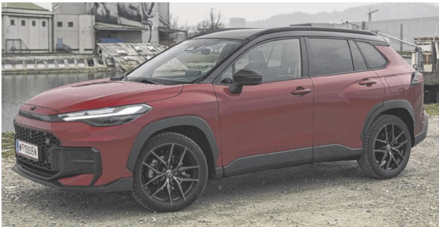
Der Toyota Corolla Cross 2,0 Hybrid 2WD GR Sport ist als Basismodell ab 38.390 Euro zu haben.