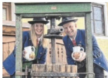
Es wird verkostet.

Besucher können sich auf einen geselligen Nachmittag mit regionalen Spezialitäten und musikalischer Unterhaltung freuen. Für die passende Stimmung sorgt ab 14 Uhr die Ileit'n Musi. Kulinarisch werden die Gäste mit herz-