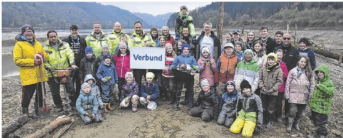
Pfadfinder aus dem Bezirk Schärding halfen bei einem Projekt zur Renaturierung am Kößlbach mit.

til, Gruppenleiter der Sauwald Scouts. „Und als ich ihnen gesagt habe, dass sie dabei wahrscheinlich richtig schmutzig werden, da waren alle sofort Feuer und Flamme.“