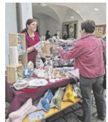
Beim Frühlingsmarkt werden nicht nur Pflanzen angeboten.

Hobbygärtner können hier bis 14 Uhr ihre Pflänzchen, Ableger und Setzlinge beschriftet abgeben. Ab 14 Uhr verwandelt sich der Schlosshof dann in einen lebendigen Marktplatz – heuer mit so vielen Ausstellern wie noch nie. Die Pflanzen können gegen eine freiwillige Spende für den Verschönerungsverein mitgenommen werden. Neben dem Austausch von Grünem steht vor allem das Miteinander im Vordergrund: Das Team freut sich auf zahlreiche Gespräche sowie ge-