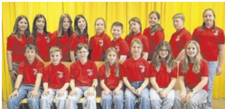
Die Schüler bereiten sich fleißig auf den großen Auftritt vor.

Im Mittelpunkt des Unterrichts standen in den vergangenen Monaten die Proben für das gemeinsame Projekt. Szenen wurden einstudiert und auf der schuleigenen Probebühne umgesetzt. Das Musical erzählt die Geschichte des elfjährigen Max, der einen gewöhnlichen Einkaufsbummel mit seiner Mutter zu-