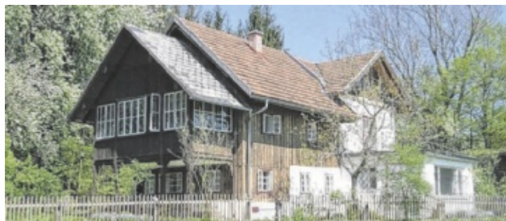
Das Bilger-Breustedt-Haus erwacht aus der Winterpause.

TAUFKIRCHEN. Das Bilger-Breustedt-Haus in Taufkirchen startet am Sonntag, 26. April, um 15 Uhr mit einer Vernissage in die neue Ausstellungssaison. Heuer werden neben einer besonderen Zeitreise unter anderem Lesungen, ein Erzählcafé und ein Kinderfestival geboten.