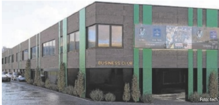
Die geplante Außenansicht – der Bereich vor dem Eingang ist künftig überdacht.

Die Erweiterung des Stadionsdorfs für die Fans und die Modernisierung der Gastronomie seien schon lange geplant, mussten aber immer wieder verschoben werden. „Wir wollten den Service für die