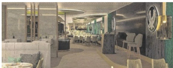
Die kleine Bühne bleibt in der Mitte des Business-Clubs.