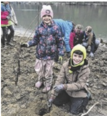
Es wurde fleißig angepackt.

Der Umgang mit der Natur ist einer der acht Schwerpunkte bei den Pfadfindern, Umweltschutz ist ein zentrales Thema. Die Renaturierung am Kößlbach wurde daher von Anfang an mitverfolgt. „Wir freuen uns riesig, dass wir jetzt selbst mit anpacken können. Die Kids haben jede Menge Spaß, tun dabei etwas richtig Nachhaltiges und können in den nächsten Jahren das Wachstum des Auwalds mitverfolgen“, sagt Andreas Pro-