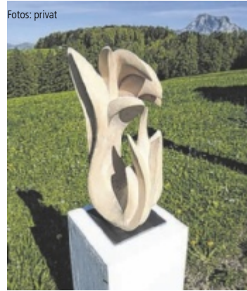
Eine Skulptur von Markus Tremel

oxiden. Tremel setzt auf die sinnliche Wirkung des Materials. Duft, Maserung und handwerkliche Ausarbeitung seiner Holzobjekte sprechen mehrere Sinne an und lassen die Werke je nach Perspektive immer wieder neu erscheinen. Unterberger wiederum verdichtet Eindrücke von