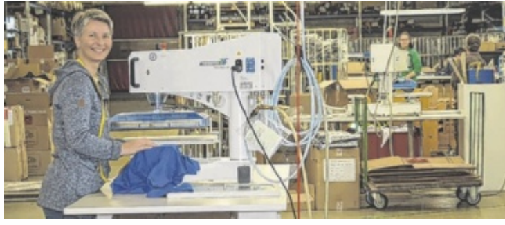
Reindl-Mitarbeiter freuen sich über eine gute Auftragslage.

ST. WILLIBALD. Der Innviertler Berufsbekleidungshersteller Reindl blickt auf ein starkes Jahr zurück: 2025 wurden rund 500.000 Teile Berufsbekleidung, Schutzkleidung und Schutzausrüstung ausgeliefert. Zudem wurde in die EDV und ein neues Warenwirtschaftssystem investiert.