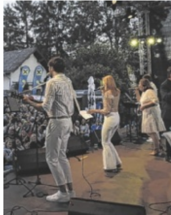
Die Post Big Band Salzburg tritt in Schärding auf.

Musikalisch steht der Abend ganz im Zeichen von ABBA: Die Post Big Band Salzburg bringt die größten Hits der schwedischen Kultband auf die Bühne. Bereits zuvor sorgt die Vorband Your Music für Stimmung. Für die Verpflegung ist der Kapsreiter Stadtwirt zuständig. Auch für Kinder wird ein Angebot bereitgestellt. Ein Höhepunkt des Abends ist das