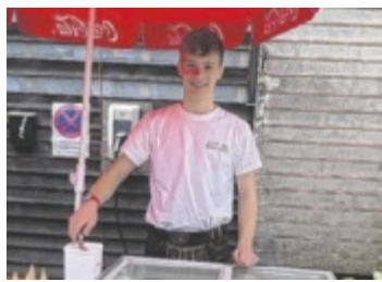
Angeboten wird hausgemachtes Eis.

Der Festtag startet um 10 Uhr mit einem Frühschoppen. Schon eine halbe Stunde später folgt ein Höhepunkt: die Eröffnung der neu errichteten Maschinenhalle. Kulinarisch steht Regionalität im Mittelpunkt. Schüler und das Team der Fachschule verwöhnen die Gäste mit Spezialitäten vom Rind, hausgebrautem Bier, Säften aus eigener Produktion, hausgemachtem Eis und dem „Otterburger“. Für Kinder wird ein eigenes Ge-