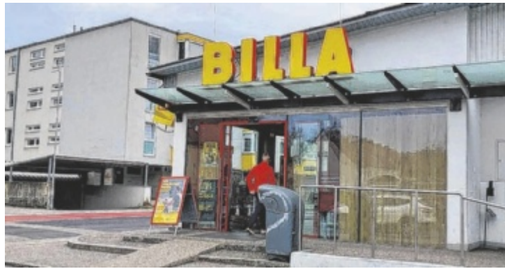
Die Billa-Filiale in der Punzer-Straße im Steyrer Stadtteil Munichholz sperrte am 11. April überraschend zu.