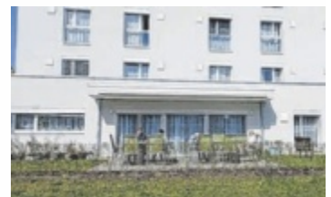
Das Wohnhaus Steyr

STEYR. Der Arbeitsalltag im Wohnhaus Steyr von pro mente OÖ gestaltet sich abwechslungsreich, persönlich und individuell. Beim Tag der offenen Tür am 22. April haben zukünftige Mitarbeiter die Möglichkeit, Einblicke in den Berufsalltag zu gewinnen.