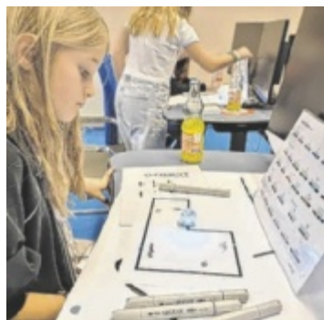
Im TIC können Kinder die Mini-Roboter Ozobots erforschen.