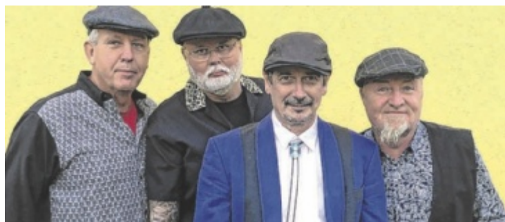
Diese vierköpfige Band setzt auf Energie und Nähe zum Publikum.