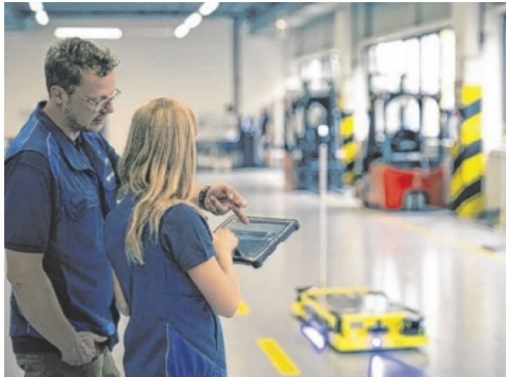
Autonome Flurförderfahrzeuge im BMW Werk Steyr.

Wissenschaft und Innovation hautnah erleben lautet die Devise bei der „Langen Nacht der Forschung“. Mit Experimenten, Ausstellungen, Führungen und zahlreichen Mitmachstationen für alle Altersgruppen. Die Besucher erwartet ein abwechslungsreiches Programm, das besonders durch seine Interaktivität besticht: Ob selbst programmierte Roboter, Experimente aus Chemie und Physik, Einblicke in moderne Produktionsprozesse