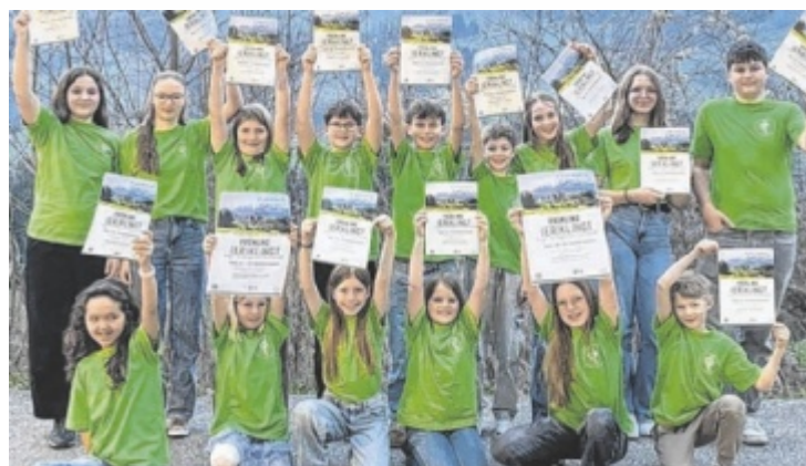
Maria Neustifter Jungmusiker freuen sich über viele Zuhörer.