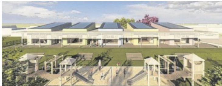
So soll der neue Kindergarten aussehen.

GAFLENZ. Mit dem Spatenstich letzte Woche fiel der Startschuss für den Neubau des Kindergartens in Gaflenz. 2,84 Millionen Euro werden investiert.