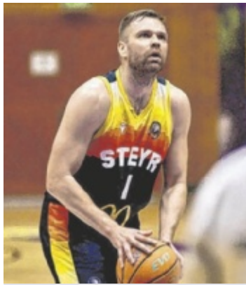
Finalkurs Nur noch ein Sieg trennt die Iron Scorpis aus Steyr vom Einzug ins Finale der Basketball-Landesliga. Seite 18