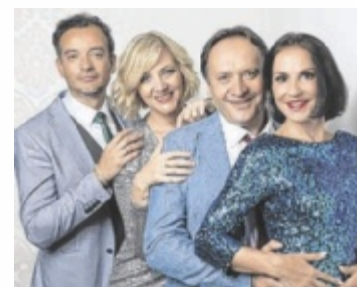
Italo-Hits in Steyr