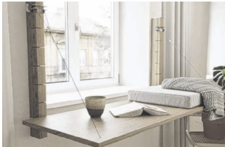
Balcosy SUNDÅ passt sich deinen Bedürfnissen an. Egal ob als Fenstersitz, Pflanzenwand, Bücherregal oder ganz was anderes.