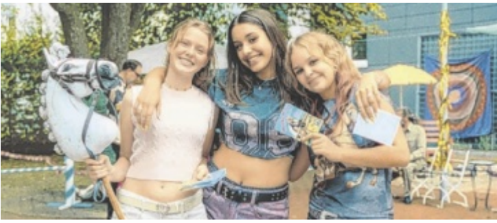
Die Freundinnen begeistern sich für den finnischen Trend-Sport.