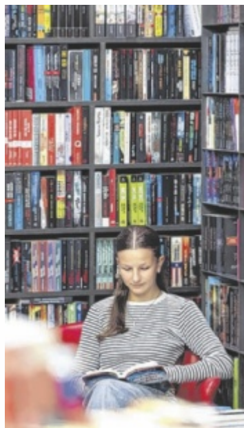
Schmökern ist nur ein Teil der Langen Nacht der Bibliotheken.