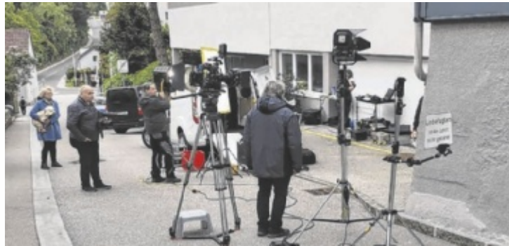
Für den Thriller „Femizid“ wurde zwölf Tage lang gedreht.