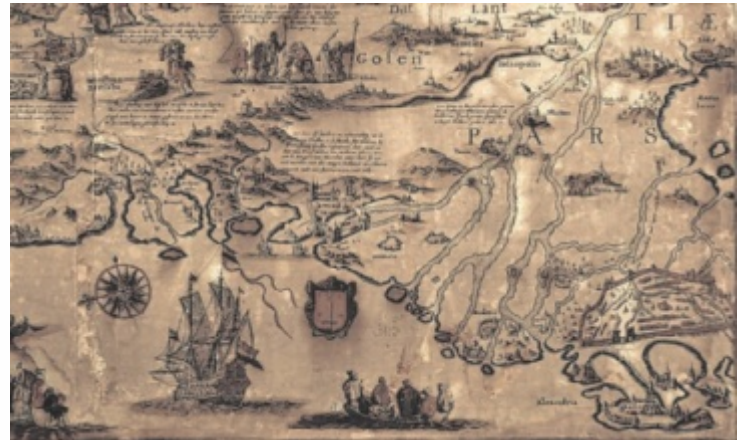
Der kolorierte Kupferstich wird fachgerecht restauriert.