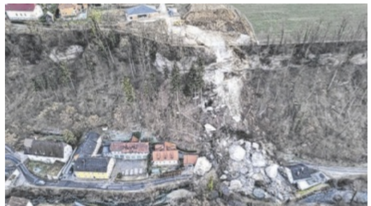
Der fatale Felssturz in Christkindl ereignete sich am 8. Februar 2023.

zu. Der Einsatz hatte fatale Folgen, der gesamte Hang rutschte ab und riss einen Arbeiter (64) sowie den Junior-Chef (31) in den Tod. Das Ermittlungsverfahren der Staatsanwaltschaft dauerte mehr als drei Jahre, nun gibt es Strafanträge gegen den Senior-Chef des Kärntner Unternehmens sowie gegen einen Geologen, der die Ausschreibung erstellt hatte. Beiden drohen bei einer Verurteilung Freiheitsstrafen von bis zu zwei Jahren. ■