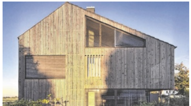
Eine Holzfassade macht noch kein Holzhaus.

FIRMA: 4441 Behamberg, Poststraße 8 Tel.: 07252/30009