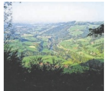
Im Steyrtal wird befürchtet, dass es mit der landschaftlichen Idylle vorbei sein könnte.

Prognosen des Landes Oberösterreich rechnen mit 25.500 mehr Fahrzeugbewegungen pro Tag durch die Westspange. Mitorganisatorin Elisabeth Rohrauer: „Ein guter Teil dieser Fahrzeuge würde seinen weiteren Weg durch das Steyrtal zur Autobahn nehmen. Der Verkehr könnte sich vervielfachen.“ Laut Verkehrszählung am Tunnelportal Grünburg lag der Tagesdurchschnitts-