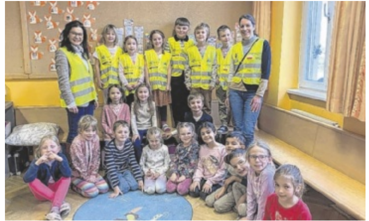
Überprüfung in der Volksschule Pfarrkirchen.

Die Zivilschutzbeauftragten besuchten in den letzten Wochen und Monaten stichprobenartig die Volksschulen und belohnten diejenigen Erstklässler, die eine Warnweste an hatten. Während das Bezirksergebnis für Steyr-Land nur bei 39 Prozent liegt, hatten in Steyr-Stadt 80 Prozent der Kinder eine Warnweste an. „Wir werden weiterhin einen Schwerpunkt auf dem Thema Sicherheit und Sichtbarkeit im Straßenverkehr legen. Auch wenn die Schüler meist reflektierende Streifen bzw. Anhänger an der Schultasche oder der Klei-