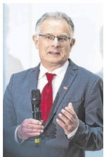
Markus Marterbauer ist im Museum Arbeitswelt zu Gast.