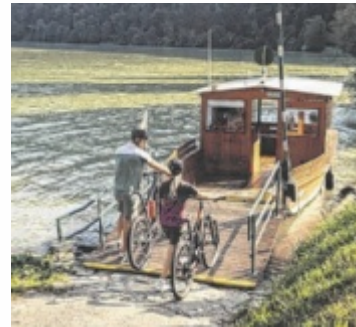
Mit der Fähre bequem ans andere Donauufer

Die neue WaldEntdeckerWelt macht den Wald in all seinen Facetten erlebbar und entwickelt sich vom bekannten Ausflugsziel Baumkronenweg weiter zu einer ganzheitlichen Natur-, Erlebnis- und Bildungswelt. Neue