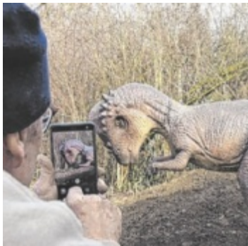
Dinos gibt es im Evolutionsmuseum auch zu sehen.