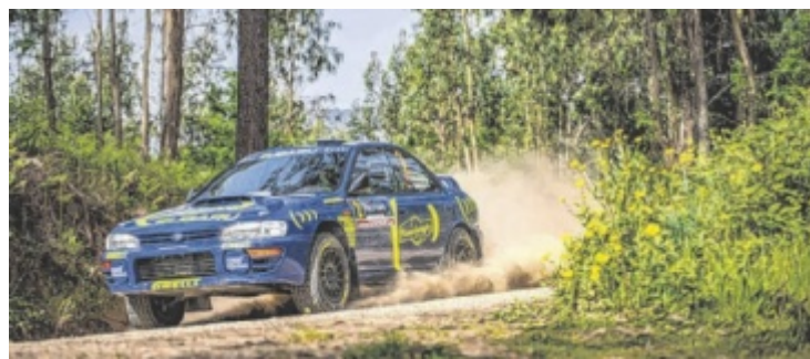
Rosenberger und Schwarz bei der Historic Rallye Fafe in Portugal.

Die Angebote werden in Zusammenarbeit mit dem Land Oberösterreich durchgeführt. Eine Anmeldung ist erforderlich (0677 62442242), die Teilnahme ist kostenlos. Weitere Infos unter www.pettenbach.at ■