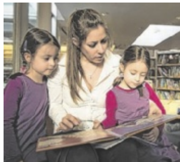
Büchereien aus der Region bieten spannendes Programm.

Bibliotheken sind längst mehr als Orte zum Ausleihen von Büchern. Sie sind kulturelle Nahversorger, Treffpunkte und lebendige Bildungsräume mitten im Ort. In den oberösterreichischen Bibliotheken stehen insgesamt rund zwei Millionen Medien zur Verfügung – von Büchern und Zeitschriften über Brettspiele, Filme und Hörbücher bis hin zu E-Books. Unter dem Motto „Sternstunden“ erwar-