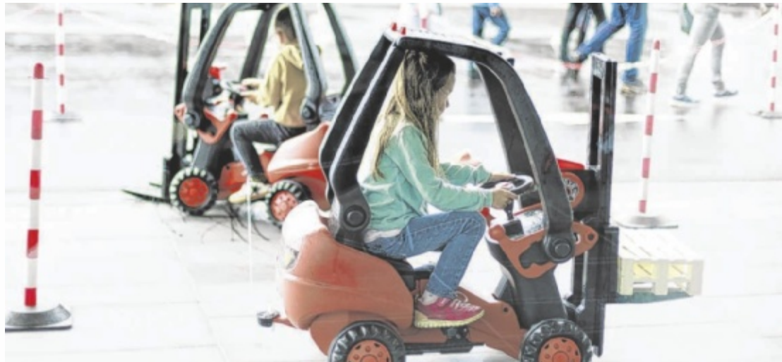
„Lange Nacht der Forschung“ am Freitag, 24. April von 17 bis 23 Uhr bei Fronius in Thalheim

Wie viel Muskelkraft benötigt es, müssten wir einen Smartphone-Akku von Hand laden? Kann ich als blutiger Anfänger ein eigenes