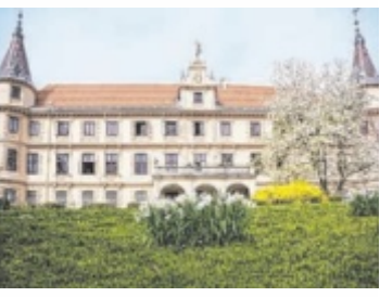
Alles blüht auf Schloss Puchberg