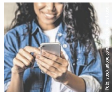
Alle OÖ-Gemeinden können für den Spezialaward Futura einreichen.

Alle oberösterreichischen Gemeinden können ihre Projekte bis 17. Mai einreichen. Gesucht werden Pilotprojekte, Testphasen oder bereits umgesetzte Lösungen mit kurzer Beschreibung, Angaben zur Gemeinde sowie ergänzendem Bild- oder Videomaterial. Die Einreichungen werden von einer Fachjury bewertet, die Gewinnergemeinde anschließend prämiert und in der Zeitung sowie auf tips.at präsentiert.