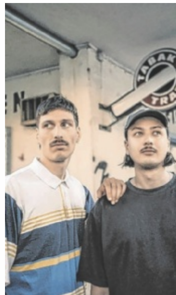
Der Sound der Formation „Ende“ aus Wien und Linz vereint Härte und Zerbrechlichkeit.

Container Of Fools aus Linz stehen am Freitag, 24. April, auf der Bühne. Die vierköpfige Band spielt Metal-Grunge und Alternative-Rock, beeinflusst von RHCP, Nirvana und Depeche Mode. Am Samstag, 25. April, folgt „Ende“. Das Duo aus Wien und Linz bringt Post-Punk, Pop, New Wave und Punk auf die Bühne. Gitarren, Drum Machines und Synthesizer formen einen dichten Sound. Die Songs handeln von kaputten Beziehungen, wütenden Nächten und Flucht. Beginn ist jeweils um 21 Uhr, Eintritt: freier Musikbeitrag. ■