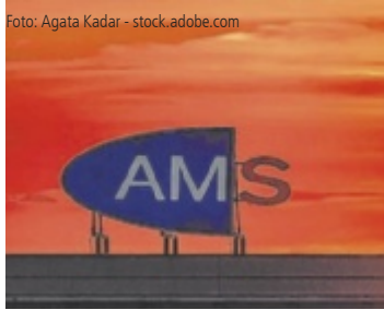
Das AMS Kirchdorf informiert über die aktuellen Arbeitslosenzahlen.

BEZIRK. Der Arbeitsmarkt im Bezirk Kirchdorf zeigt im März 2026 ein gemischtes Bild. Die Arbeitslosigkeit ist im Vergleich zum Vorjahr gesunken. Gleichzeitig hat sich die Entwicklung laut Arbeitsmarktservice zuletzt abgeschwächt.