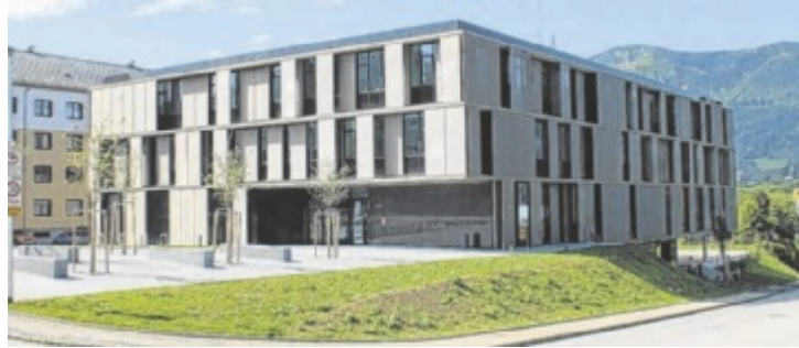
Fast jeder zweite Einwohner im Bezirk Kirchdorf brauchte 2025 die Hilfe und Unterstützung der Bezirkshauptmannschaft.

Im Bereich Verkehr wurden 6.705 Reisedokumente und 4.513 Führerscheine ausgestellt, 429 Führerscheine entzogen. Zudem erließ die Behörde 990 straßenpolizeiliche Verordnungen und 783 Bewilligungen. Insgesamt wurden 28.563 Verkehrsstraftdelikte registriert. Im Sicherheitsbereich gab es 370 ausgestellte Waffendokumente und 77 Waffenverbote. Aufenthaltstitel wurden 771 Mal ausgestellt. Die Zahl der Vereine stieg auf 887.