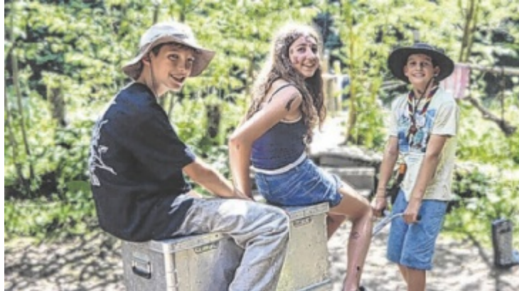
Die Pfadfinder treffen sich wöchentlich für gemeinsame Aktivitäten.

Gegründet wurde die Gruppe im Jahr 2001 von Marilies Eckhart aus dem Wunsch heraus, vor Ort ein sinnvolles Freizeitangebot für junge Menschen zu schaffen. Aus einer ersten Idee und einer Informationsveranstaltung gemeinsam mit Mitstreiterinnen und den Pfadfindern Vorchdorf entwickelte sich rasch eine Erfolgsgeschichte – damals mit 28 Kindern im Alter von sieben bis zehn Jahren.