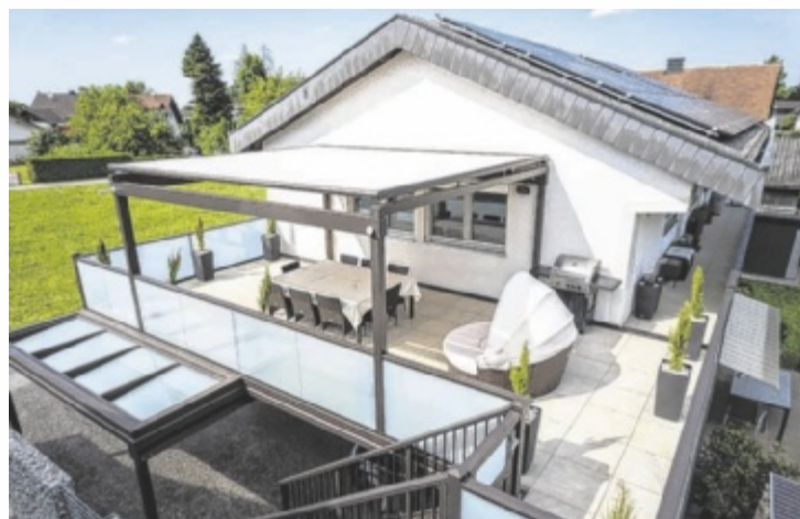
Individueller Anbaubalkon mit Überdachung und Stiegenaufgang

Beim Bauen und Wohnen sind es oft Geländer, Zäune und Sichtschutzlösungen, die einem Haus Charakter und Struktur geben. Besonders gefragt sind Systeme, die Privatsphäre schaffen, das Grundstück klar fassen und zugleich architektonisch überzeugen. Genau hier setzt Leeb an. Schöner Wohnen heißt, Wohnraum nicht nur innen, sondern auch außen klug zu erweitern. Genau dafür entwickelt Leeb als Europas Nummer eins maßgefertigte Systeme, die Architektur, Komfort und Pflegeleich-