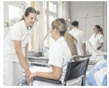
Bei der Ausbildung

Bitte um Zusendung an: tips-kirchdorf@tips.at