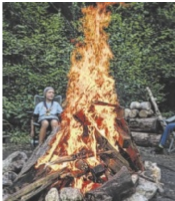
Jubiläumsfest Die Pfadfinder Steyrtal laden am 25. April zum 25. Jubiläumsfest mit Lagerfeuer am Abend ein. Seite 4