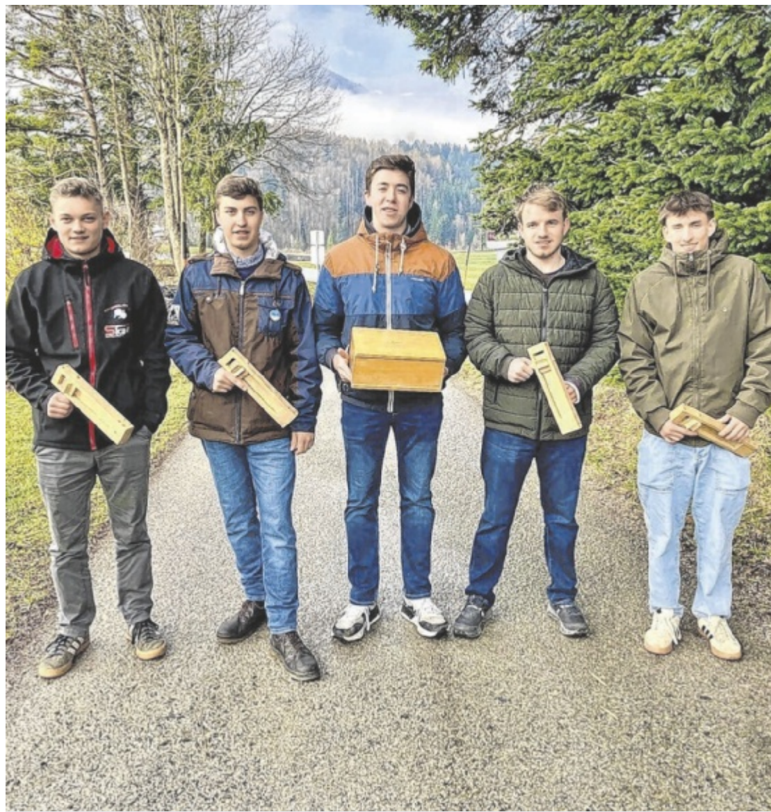
Ratschenbuben sammeln Spenden Ministranten aus Windischgarsten sammeln in der Karwoche einen vierstelligen Spendenbetrag für neue Fenster bei der Pfarrkirche Sankt Jakob. Seite 12 / Foto: Josef Stummer