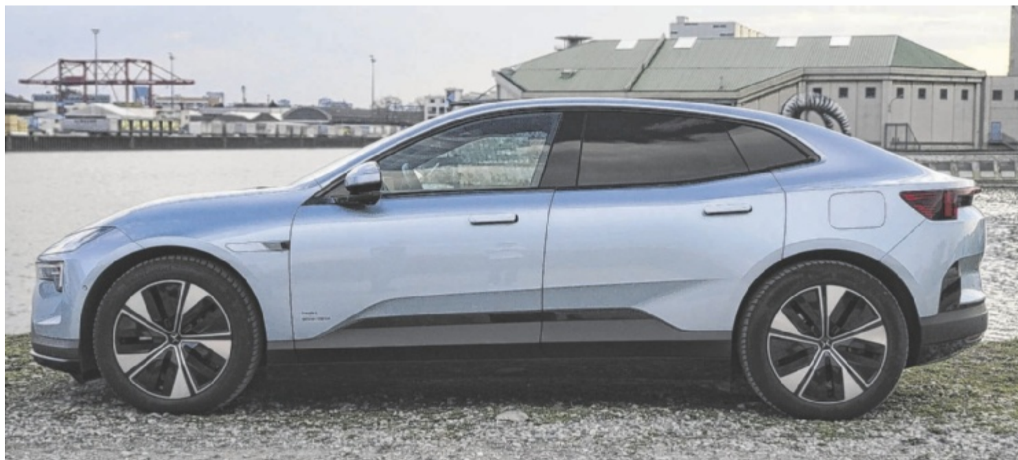
Der Polestar 4 LR Single Motor ist ab 59.990 Euro zu haben.