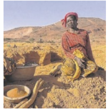
Goldabbau in Burkina Faso: Die Dokumentation „Kein Gold für Kalsaka“ beleuchtet die Auswirkungen.

KIRCHDORF. Die Reihe „Fernsicht 26“ gastiert am Donnerstag, 23. April, um 19.30 Uhr im Kirchdorfer Kino. Ein Film und Gespräch rücken den Goldabbau in Afrika und die verheerenden Folgen in den Fokus.