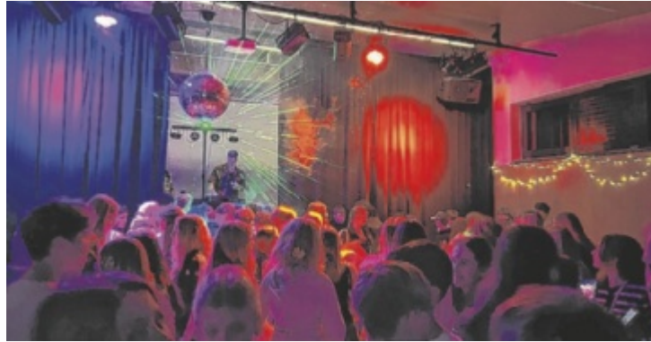
Die KePi-Jugenddisco steht für eine coole und sichere Party.

Organisiert wird die Veranstaltung von den Gemeinden Kematen an der Krems und Piberbach. Bei der Jugenddisco sorgen DJ Sharkx und DJ Lutoks für Musik. Außerdem stehen ein Wuzzeltisch, ein Dartautomat und ein Tischtennistisch kostenlos zur Verfügung. Die Barfuß-Bar von Pro Mente bietet erneut kreative alkoholfreie Cocktails an. Eine Chill-out-Area lädt zum Entspannen und Kartenspielen ein. Auch Schulfreunde aus anderen Gemeinden sind willkommen. Der Einlass ist ausschließlich für Jugendliche von elf bis 16 Jahren möglich. Es besteht Aus-