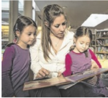
Elf Bibliotheken beteiligen sich im Bezirk Linz-Land.

Die öffentlichen Bibliotheken sind mehr als Orte zum Ausleihen von Büchern. Sie sind kulturelle Nahversorger, Treffpunkte und lebendige Bildungsräume. In den oberösterreichischen Bibliotheken stehen rund zwei Millionen Medien zur Verfügung. Die Lange Nacht zeigt diese Vielfalt eindrucksvoll: Unter dem Motto „Sternstunden“ erwartet die Besucher ein buntes und fantasievolles Programm für alle Generationen.