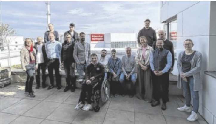
Boxenstopp der Jobralley bei Büsscher &amp; Hofmann GmbH in Enns