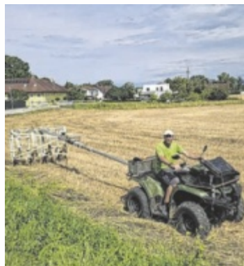
Bei der Vermessung

Hier wurden im Auftrag des Landes Oberösterreich 2015 (Österreichisches Archäologisches Institut) und 2025 (GeoSphere Austria) geophysikalische Messungen vorgenommen. Deren Ergebnisse, vor allem der Radar-Messungen 2025, werden an-