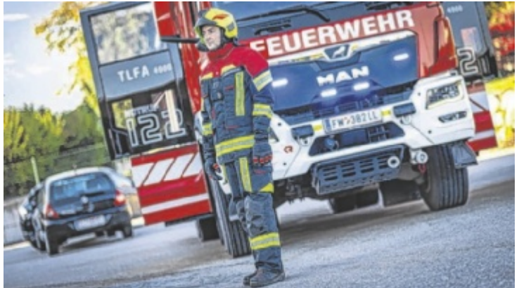
Der Leondinger Feuerwehr-Ausrüster Rosenbauer blickt auf das erfolgreichste Jahr seiner 160-jährigen Geschichte zurück.

Der Umsatz stieg um 9,4 Prozent auf 1,429 Milliarden Euro. Gleichzeitig verbesserte sich das operative Ergebnis (EBIT) deutlich auf 84,5 Millionen Euro. Besonders stark fiel die Entwicklung beim Ergebnis vor Steuern (EBT) aus, das sich mit 54,7 Millionen Euro mehr als verdoppelte. Auch das Periodenergebnis legte deutlich zu. Wesentliche Treiber waren neben einer höheren Auslieferung von Fahrzeugen auch Effizienzsteigerungen im Unternehmen. Das Segment Fahrzeuge bleibt mit rund 78 Prozent Umsatzanteil der wichtigste Bereich. Parallel dazu wurde die finanzielle Basis gestärkt: Die Nettoverschuldung konnte nahezu halbiert und die Eigenkapitalquote deutlich erhöht werden. „2025 war ein Meilenstein