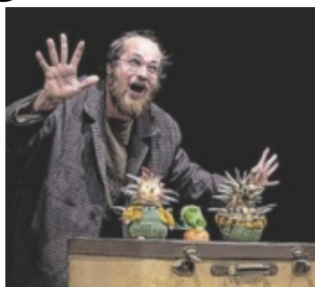
Ein Puppenspieler erweckt Hase und Igel zum Leben.

Als sich Herr Hase jedoch über die Igel lustig macht, kommt es zu einer ungewöhnlichen Herausforderung: ein Wettlauf zwischen Hase und Igel. Dass dabei nicht nur Schnel-