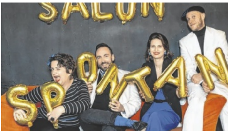
Feinstes Impro-Musical mit dem Salon Spontan