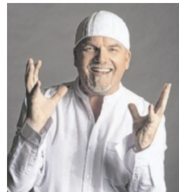
DJ Ötzi und die Woodstock Allstar Band sorgen für Partystimmung am Linzer Domplatz.

Für den unverwechselbaren Live-sound an diesem Abend sorgt die Woodstock Allstar Band. Mit Vollblutmusikern aus renommier-