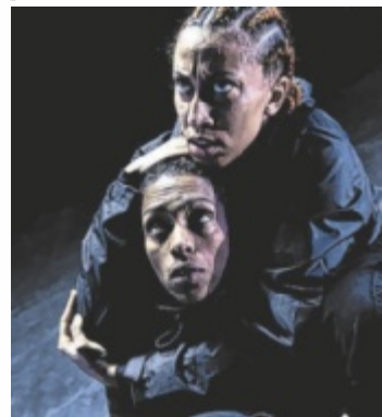
Urban Arts Ensemble Ruhr

Der US-deutsche HipHop-Choreograf RubberLegz alias Rauf Yasit verbindet Straßenenergie mit künstlerischer Präzision. Mit dem Stück „Cracks“ kehrte Yasit, der in Los Angeles lebt und arbeitet, nach Deutschland zurück. Gemeinsam mit dem Urban Arts Ensemble Ruhr begibt er sich auf Spurensuche. Sie lassen die Risse und Träume aus Kindertagen wieder auferstehen, fragen nach den Geschichten, die die Körper der Tänzern geformt haben und lassen Gegenwart und Vergangenheit in einem Spannungsgeladenen Dialog zwischen kindli-