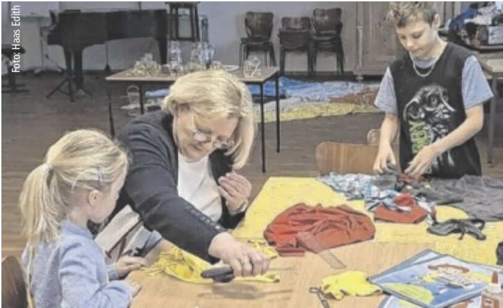
Kinder lernen, wie man alte Kleidungsstücke zu neuen Taschen umfunktioniert.