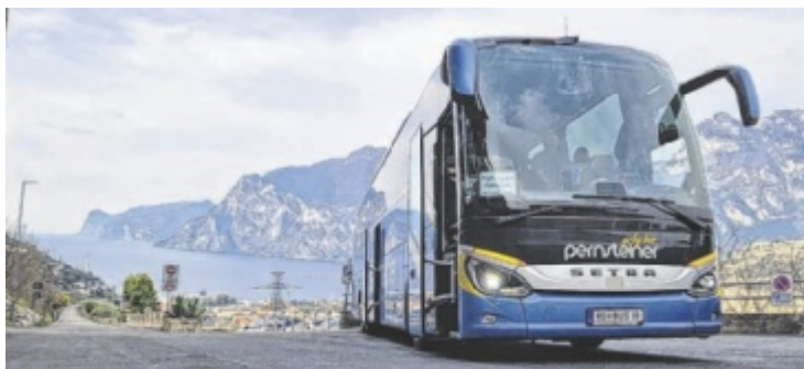
Unterwegs am Gardasee

Pernsteiner GmbH Busreisen – Reisebüro Hauptstraße 9, 4131 Kirchberg Tel.: 07282 4042 www.pernsteiner-reisen.at