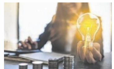
Häufig bleibt das Thema Finanzen ein Tabu.

Frauen gründen Unternehmen, führen Betriebe und tragen Verantwortung – dennoch bleibt das Thema Finanzen häufig ein Tabu. Genau hier setzt die Veranstaltung an und bietet Raum für Infos und Austausch. Ab 17.30 Uhr ist ein Get-together geplant, bevor um 18.15 Uhr eine Gesprächsrunde mit Experten aus den Bereichen Bank, Buchhaltung sowie mit Unternehmerinnen beginnt. Dabei werden verschiedene Aspekte der Finanzwelt beleuchtet. „Viele Frauen sind wirtschaftlich stark – aber bei Fi-