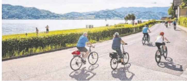
Raderlebnistag am Attersee ist heuer am 26. April

Der autofreie Rad-Erlebnistag zählt seit Jahren zu den beliebtesten Ver-