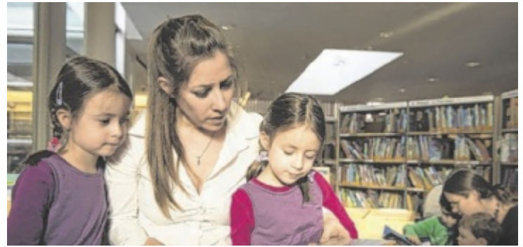
Viele Bibliotheken bieten ein spannendes Kinderprogramm an.

In der Gemeindebücherei Bad Goisern (18 bis 22 Uhr) stehen ein gemütliches Zusammentreffen, Kurzführungen sowie ein Vortrag zur Geschichte der Bücherei auf dem Programm. Die Öffentliche Bibliothek der Pfarre Bad Ischl (15 bis 21.30 Uhr) bietet eine interaktive Geschichtenzeit für Kinder sowie Einblicke in die Arbeit des Heimatvereins und einen gemeinsamen Ausklang. Die Stadtbücherei Gmunden (13 bis 21 Uhr) organisiert Mitmachstationen für Kinder rund um das antike Rom, ein Blind Date mit einem Buch sowie einen Me-