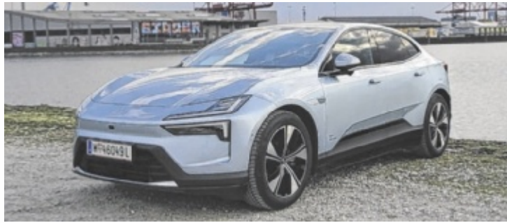
Der Polestar 4 LR Single Motor ist ab 59.990 Euro zu haben.

Ein Punkt gleich zu Beginn – der Polestar 4 hat keine Heckscheibe und nein, Rückwärtsfahren wird dadurch nicht zum Abenteuer. Die Sicht nach hinten übernimmt eine Kamera, deren Bild im digitalen Innenspiegel erscheint und natürlicher wirkt als gedacht. Ob man sich dazu aus Kostengründen entschieden hat, oder dies ein bewusstes Alleinstellungsmerkmal ist, bleibt offen. Sicher ist nur: Der Polestar 4 ist unverwechselbar. Das SUV-Coupé wirkt gedrungen, dynamisch und elegant zugleich, mit markanter LED-Lichtsignatur. Selbst die weiße Snow-Lackierung