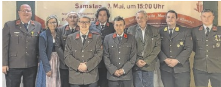
Die FF Mitterweißenbach leistete letztes Jahr 2.294 Stunden.