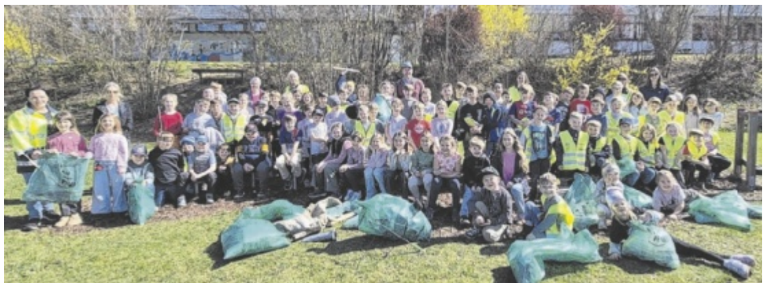
Flurreinigungsaktion der Volksschule Oberhofen am Irrsee

Wer sich beteiligen will – egal ob einzeln, mit der Familie, der Schulklasse oder dem Sportverein – findet alle Infos und Termine unter www.huistattpfui.at . Dort lassen sich auch eigene Sammelaktionen anmelden. Die Bezirksabfallverbände, Städte und Gemeinden vor Ort helfen ebenfalls gerne weiter. ■