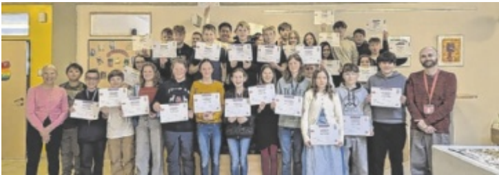
Die Schüler der digiMS 2 Bad Goisern präsentieren stolz ihre Zertifikate nach einer erfolgreichen English-Projektwoche.

punkt. Begleitet wurden die Schüler von zwei Native Speakern aus Großbritannien, die die Inhalte vermittelten und den direkten Zugang zur Sprache ermöglichten. Ziel der Projektwoche war es, die kommunikativen Fähigkeiten zu stärken und Hemmungen beim Sprechen abzubauen. Den Abschluss bildete der „Parents Evening“. Dabei präsentierten die Schüler ihre Ergebnisse in Form von Sketches und kreativen Beiträgen. ■