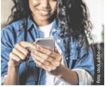
Alle ÖÖ-Gemeinden können für den Spezialaward Futura einreichen.

ÖÖ. Erstmals wird beim Tips Sympathicus 2026 der Spezialaward „Futura“ vergeben. Ausgezeichnet werden innovative Projekte mit zukunftsweisenden Ideen – etwa digitale Bürgerservices, KI-gestützte Energielösungen oder Apps zur besseren Vernetzung in Gemeinden.