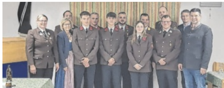
Feuerwache Rettenbach – Steinfeld – Hinterstein