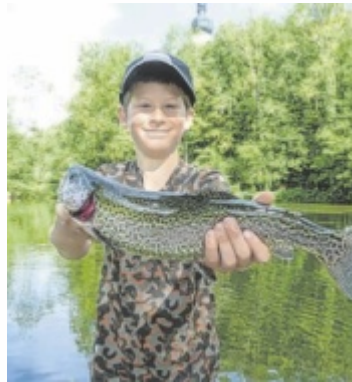
Erfolgreicher Jungfischer

Treffpunkt ist um 8.15 Uhr direkt bei den Teichen. Nach einer kurzen Einführung starten die Teilnehmer in den Bewerb. Im Anschluss an das Fischen findet am Vereinsplatz am Traunsee eine Siegerehrung mit kleiner Stärkung statt. Der größte Fang wird mit einem Pokal belohnt. Ende der Veranstaltung ist gegen 12 Uhr. Für die Lizenz, Jause und Getränke wird ein Unkostenbeitrag von 15 Euro eingehoben, der bei der Anmeldung im Fischereifachgeschäft Höller in Gmunden, bei Fish-On in Steinerkirchen und am Vereinsplatz zu bezahlen ist. Während des Fischens stehen