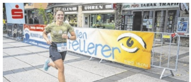
Laufspaß in der Kaiserstadt bei traditionellen Kaiserlauf.

Bereits am Samstag, 26. September, findet im Kongress und Theaterhaus Bad Ischl ab 16.30