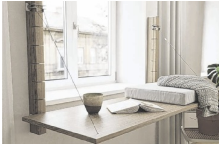
Balcosy SUNDÅ passt sich deinen Bedürfnissen an. Egal ob als Fenstersitz, Pflanzenwand, Bücherregal oder ganz was anderes.