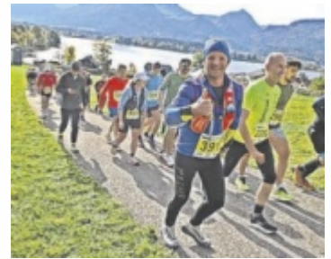
Beim 27-Kilometer Klassiker mit Blick auf den See.

nen gerechnet Ergänzt wird das Wochenende durch zusätzliche Angebote wie ein Fitness- und Erholungspaket. Tips verlost fünf Startplätze (Bewerb frei wählbar) für die Leser. ■