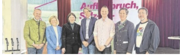
Verantwortliche bei der Podiumsdiskussion in Bad Ischl

Kunst und Kultur sollen künftig mehr sein als Programm. Sie werden gezielt als Motor für gesellschaftlichen Wandel, regionale Entwicklung und internationale Vernetzung eingesetzt. Die Initiative verbindet Themen wie Jugend, Tourismus, Mobilität, Handwerk und digitale Transformation zu einem Zukunftsmodell für den ländlichen Raum. Dass dieser Ansatz bereits greift, zeigen konkrete Projekte: In Ebensee folgen ab Mai 2026 künstlerische Interventionen im öffentlichen Raum, während internationale Kooperationen wie