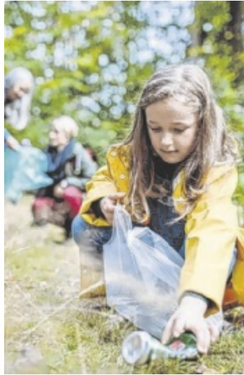
In der Region wird wieder fleißig Müll gesammelt.

Für Landwirte im Bezirk ist der Müll auf Wiesen ein zunehmendes Problem. Mit Beginn der Vegetationsperiode wächst das Futter auf jenen Flächen, die zuvor durch Abfälle belastet wurden. Was im Winter durch Schnee ver-