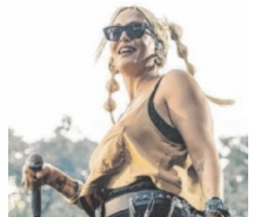
Sarah Connor

Erstmals wird das Planai Stadion in Schladming auch im Sommer zur großen Open-Air-Bühne. Von Mittwoch, 3., bis Sonntag, 7. Juni 2026 feiert der Weltcup-Ort gemeinsam mit der Leutgeb Entertainment Group die Premiere des neuen Summer Openings. Einer der Höhepunkte ist der Auftritt von Sarah Connor am Donnerstag, 4. Juni. Die Sängerin gehört zu den erfolgreichsten Künstlerinnen im deutschsprachigen Raum. Mit ihrem Nummer-1-Album „Freigeistin“ und der Tour „Wilde Nächte – Open Air 2026“ bringt sie emotionale Songs und eine energiegeladene Liveshow mit.