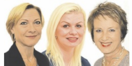
Das Team von Optik Akustik Bauer in Scharnstein berät sie gerne.