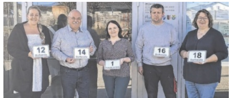
Der Ortskern von St. Thomas soll mit der Einführung von Straßennamen übersichtlicher werden.

Grund für diesen Schritt sind die zunehmende Bebauung mehrmals aufgetretene Schwierigkeiten bei der Orientierung, insbesondere für Einsatzorganisationen, Zustelldienste und Besucher. Denn die rund 120 Gebäude im Ortskern waren bisher unter einer einzigen Adresse zusammengefasst. Die neuen Straßennamen sollen nun eine bessere Orientierung gewährleisten. „Eine übersichtliche Adressierung ist heute