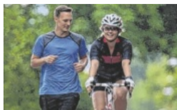
Gesund durch Sport