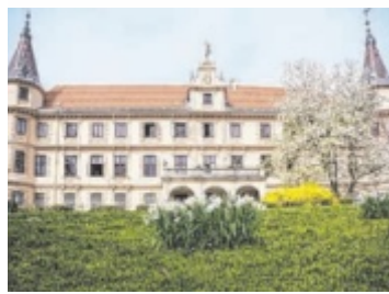
Alles blüht auf Schloss Puchberg