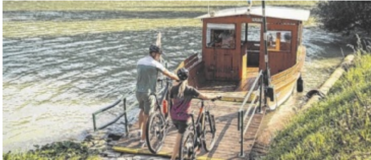
Uferwechsel mit der Donaufähre

Ende März öffneten auch zwei der beliebtesten Ausflugsziele der Region wieder ihre Türen: die neue WaldEntdeckerWelt in Kopfing sowie der IKUNA Naturerlebnispark in Natternbach.