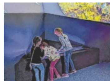
Es gibt viel zu bestaunen

und seinem Leben mit ADHS verwebt er sein Engagement für Umwelt und Zusammenhalt zu einem eindrucksvollen Ganzen. Einen besonderen Platz nimmt seine Mutter ein, die ihn nachhaltig beeinflusst hat. ■