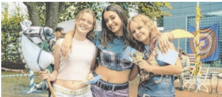
Die Freundinnen begeistern sich für den finnischen Trend-Sport.

Mars bewohnbar machen sollen, indem sie Temperatur, Sauerstoff und Ozeane erhöhen. Durch kluge Planung und den Einsatz verschiedener Projektkarten entsteht ein spannender Wettbewerb. Das Spiel verbindet wissenschaftliche Ideen mit anspruchsvoller Strategie und gilt als moderner Klassiker unter den Brettspielen. In der Vorrunde am 25. April werden von 9 bis circa 22 Uhr alle drei Spiele nacheinander in Vier-Personen-Besetzung gespielt. Die vier Spieler, die nach den drei Partien die meisten Punkte erringen konnten, treten am 26. April im Finale an. Nähere Informationen unter www.spieleakademie.at