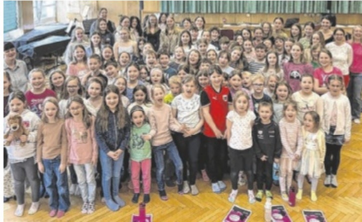
Drei Chöre – Rund hundert Kinder singen beim großen Musicalprojekt „Das verhexte Museum“ in Gaspoltshofen mit.