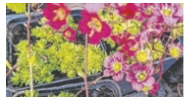
Pflanzen einkaufen

NATTERNBACH. Die Grünen Natternbach laden wieder zum Pflanzlermarkt. Die Einnahmen kommen zwei Familien zugute, deren Kinder auf Therapien angewiesen sind. Die Pflanzlerl, von Gemüsepflanzen bis Blühpflanzen, wurden von zahlreichen Gärtnern rund um Angela Panhölzl gezogen und werden am Sonntag, 26. April, von 9 bis 13 Uhr am Natternbacher Marktplatz verkauft. Auch der Keramikstand mit Eveline Karl und ihren Keramikmädels wird wieder vertreten sein. ■