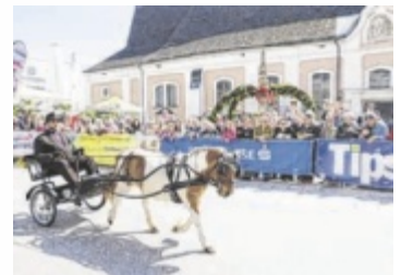
Pony im Einsatz