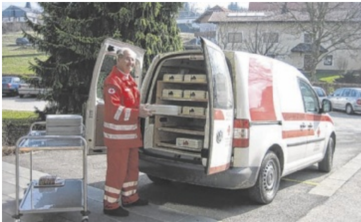
Mannigatterer initiierte „Essen auf Rädern“ in Peuerbach.

dem“-Angebot, das vom Roten Kreuz organisiert wird, in der Sternestadt ins Leben.