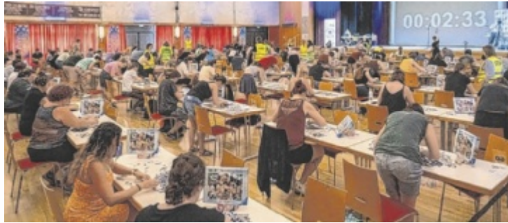
Bei den österreichischen Puzzle-Meisterschaften müssen alle Teilnehmer ein identisches Ravensburger-Puzzle mit 500 Teilen zusammensetzen.

Der Veranstalter des Puzzlevereins Österreich und der Hauptsponsor Ravensburger suchen wieder die schnellsten Puzzler des Landes. In drei Wettbewerben puzzeln die Teilnehmer um die Wette, zusätzlich erwartet die Zuschauer ein Rahmenprogramm zum Mitmachen. „Wir erwarten rund 600 Teilnehmer aus ganz Österreich, aufgrund des