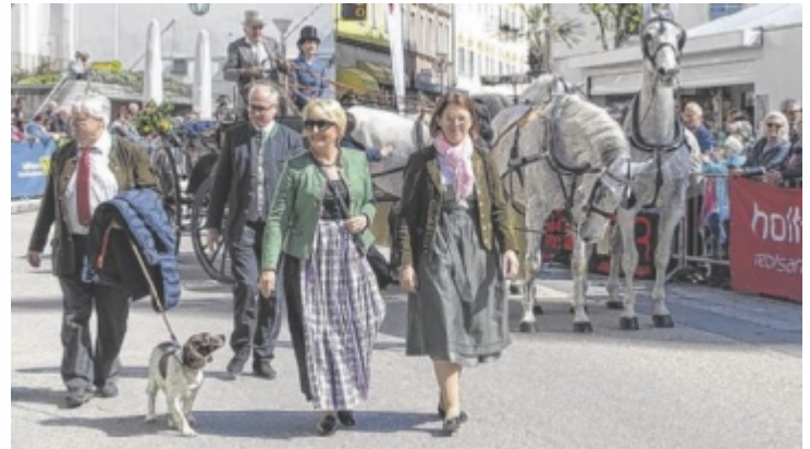
Ehrengäste auf dem Weg zur Tribüne