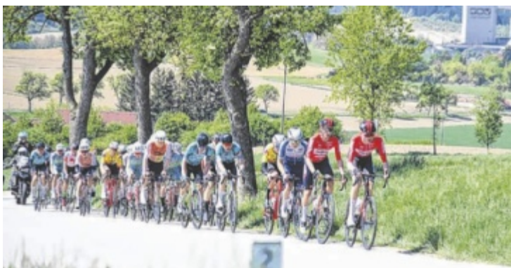
Das Raika Kirschblütenrennen findet am 26. April statt.

7. bis 10. Mai: Hockenheim 6. bis 9. August: Nürburgring 27. bis 29. August: Red Bull Classics 1. bis 4. Oktober: Nürburgring