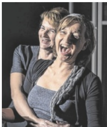
Das Kabarett-Duo „Die Menopausen“ tritt in Neukirchen auf.

Der Einlass ist ab 19 Uhr, es herrscht freie Platzwahl. Vorverkaufskarten um 20 Euro gibt es bei den örtlichen Banken, im