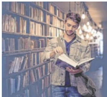
Nacht der Büchereien

Bereits zum fünften Mal öffnen Oberösterreichs Bibliotheken ihre Türen zur Langen Nacht der BibliOÖtheken. Rund 150 öffentliche Bibliotheken verlängern am Freitag, 24. April, ihre Öffnungszeiten und laden Menschen jeden Alters dazu ein, Bibliotheken einmal ganz anders zu erleben. Auch in den Bezirken Grieskirchen und Eferding sind mehrere Bibliotheken mit dabei. Bibliotheken sind längst mehr als Orte zum Ausleihen von Büchern. Sie sind kulturelle Nahversorger, Treffpunkte und lebendige Bildungsräume mitten im Ort. Die Lange Nacht zeigt diese Vielfalt besonders eindrucksvoll: Unter dem Motto „Sternstunden“ erwartet die Besucher ein buntes Programm und macht diese Nacht zu einem besonderen Erlebnis. ■