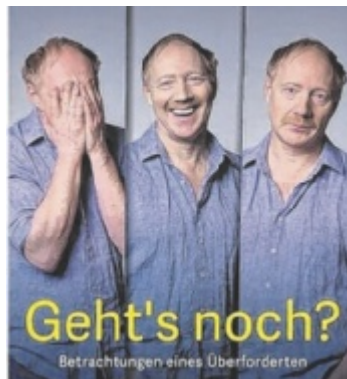
Das Buch „Geht's noch“ von Simon Schwarz

Als Schauspieler und Kabarettist ist Schwarz jemand, den das Publikum gern in sein Leben lässt. Nun spricht er erstmals als Umweltschützer und Gesellschaftskritiker über seine Kindheit als Sohn einer Umweltaktivistin, über Feminismus, Kapitalismus und seinen Glauben an eine neue Erzählung vom Lebensglück. Er präsentiert sich als Mensch mit Haltung – humorvoll, offen und selbstkritisch. Mit persönlichen Erinnerungen, Geschichten aus seiner Kindheit