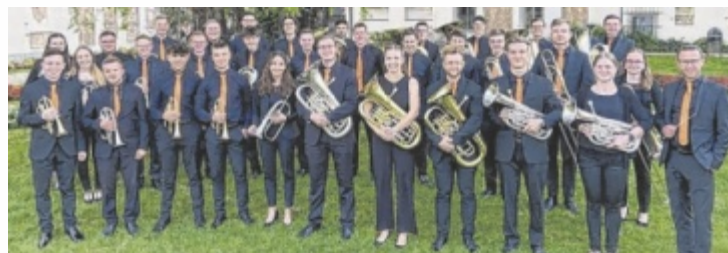
Die Jugend Brass Band Oberösterreich präsentiert ihr Wettbewerbsprogramm für die Brass Band Europameisterschaft im Bräuhaus Eferding.

Die JBB OÖ unter der Leitung von Thomas Beiganz nimmt am Sonntag, 26. April, an der Jugend Brass Band EM teil und spielt „Glory Fanfare“ von Otto M. Schwarz, „Share My Yoke“ von Joy Webb, „Burn The