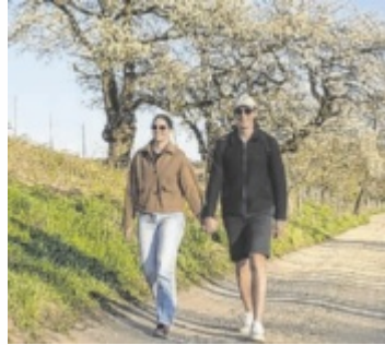
Die Obstbäume in Scharten stehen in voller Blüte.

Die Schartner Direktvermarkter und Vereine laden auch heuer wieder dazu ein, die Obstbaumblüte im Naturpark Obst-Hügel-Land zu erleben. Bei der beliebten Kirschblütenwanderung stehen mehrere Routen zur Auswahl und entlang der Strecken warten auf die Wanderer verschiedene kulinarische Angebote der Schartner Höfe und Betriebe. Zudem gibt es ein vielseitiges Rahmenprogramm für die ganze Familie, beispielsweise Musik, Naturerlebnisstationen für Kinder oder Hofbesichtigungen.