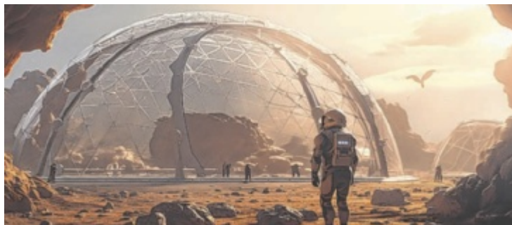
Ziel bei dem Spiel ist, den Mars bewohnbar zu machen.

ab 21:45 Uhr Löwe – abst. Mond – Siehe gestern