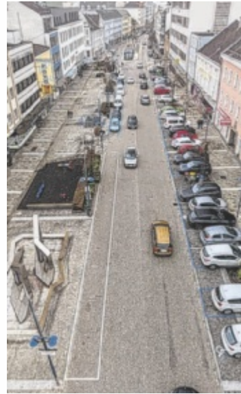
Blick auf den KJ