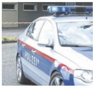
Im Einsatz

Solide Finanzen, gezielte Investitionen und Ausbau der Lebensqualität bleiben in Marchtrenk die Budgetmaxime. Erhalt und Sanierung der Infrastruktur ist ein großes Thema, ebenso die Förderung der Entwicklung der Innenstadt mittels Bürgerbeteiligung, so Mahr. ■