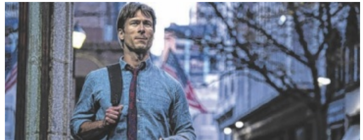
Glen Powell will sich das Erbe holen, das ihm zusteht.