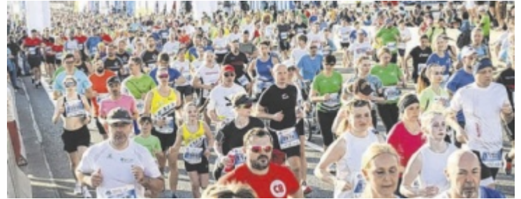
Tausende Profiatleten und Hobbyläufer werden auch heuer wieder am Marathonsonntag in der Landeshauptstadt erwartet.

LINZ/ÖÖ. Am Sonntag, 12. April, steht Linz ganz im Zeichen des Laufsports. Vom Hobbyläufer bis zum Profi wird die Stadt zur Bühne für ein sportliches Großereignis mit besonderer Atmosphäre. Mit Ausnahme der rollenden Bewerbe ist der Marathon bereits vollständig ausgebucht.