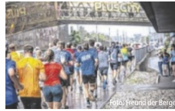
Der Lauf erfreut sich großer Beliebtheit.

PASCHING. Am Donnerstag, 2. Juli im Team Gas geben und beim business2run PlusCity mitlaufen – denn auch dieses Jahr macht das Firmenlaufevent im größten Einkaufszentrum Oberösterreichs Halt.