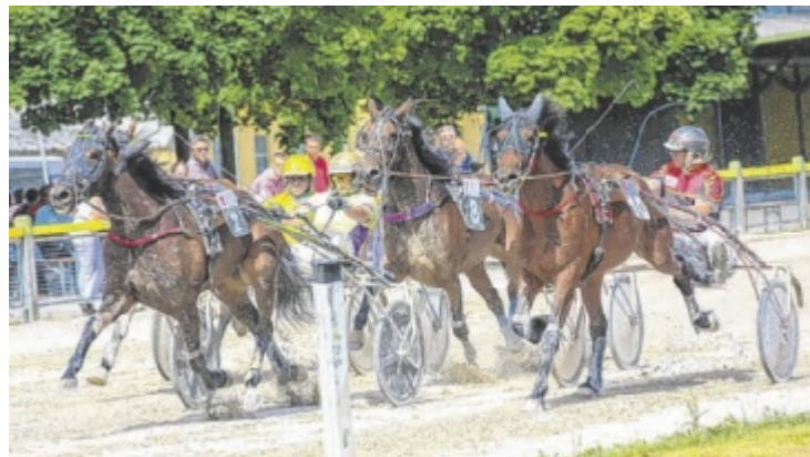
Positionskampf auf der Welser Trabrennbahn

Alle Informationen und Termine: www.welser-trabrennbahn.at/ ■