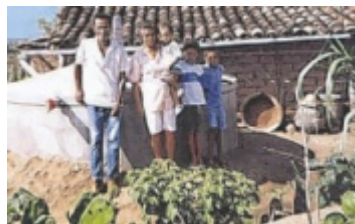
Ein Bild aus den Anfängen.