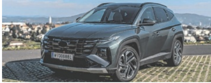
Der Hyundai Tucson 1.6 CRDI 4WD ACT Prestige Line

Hyundai spricht von geometrischen Algorithmen und parametrischer Dynamik. Klingt nach