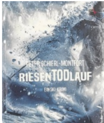
Ein brandneuer Ski-Krimi.

oberösterreichischen Adelberg wird Skistar Franz „Cats“ Katzenberger erschossen. Kriminalmajor Kurt Haderer und sein Adjutant Hauzenberger übernehmen die Ermittlungen und stoßen auf Rivalitäten und dunkle Geheimnisse im Ski-Zirkus. ■