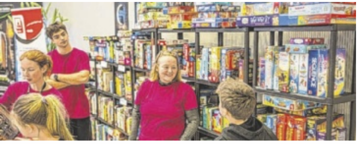
Viele, viele Spiele und Infos

In Wels liegt zudem die Marktverantwortung für die österreichischen und deutschen Betriebe der Rhomberg Sersa Rail Group. Vom Standort werden die Aktivitäten von sieben Unternehmen in Österreich und Deutschland mit insgesamt rund 1 200 Mitarbeitenden gesteuert. Rund 330 Mitarbeitende sind direkt vor Ort beschäftigt. ■