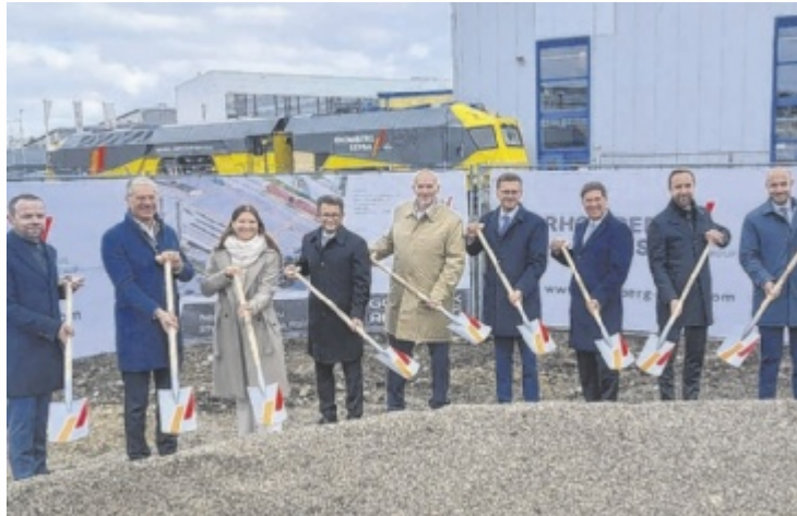
Und es war wieder Spatenstich-Zeit in Wels.

Seit über 75 Jahren wird in Wels Gleisbau betrieben, und ebenso lange werden auf dem Firmengelände Gleisbaumaschinen instandgehalten. Mit der 15 Millionen Euro Investition wird der Standort ausgebaut und auch für die Zukunft abgesichert: „Mit dem Ausbau reagieren wir nicht nur auf unser starkes Wachstum und stärken die Betreuung unserer Kunden in Österreich und