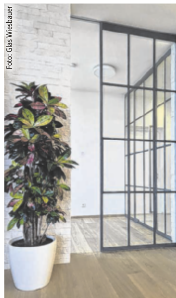
Glaswände trennen, ohne zu begrenzen

Glas überzeugt funktional und auch emotional: Es verwandelt Räume. Ob edle Küchenrückwände, moderne Walk-in-Duschen oder exklusive Saunaverglasungen – Glas bringt Licht, Weite und Design in Einklang. Individuelle Motive und maßgeschneiderte Lösungen machen jedes Projekt einzigartig und verleihen dem Zuhause eine unverwechselbare Handschrift. Glas schafft At-