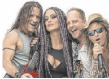
Flash 90s Disco mit Rednex

PASCHING. Flash90s, Österreichs erstes 90s Radio, holt in Kooperation mit Tips die 90er zurück – mit den legendärsten Cowboys des Jahrzehnts: Rednex! Die Buffalos dürfen aus dem Keller geholt werden, die Hüftjeans sind wieder angesagt, und das Tanzbein wartet darauf, geschwungen zu werden.