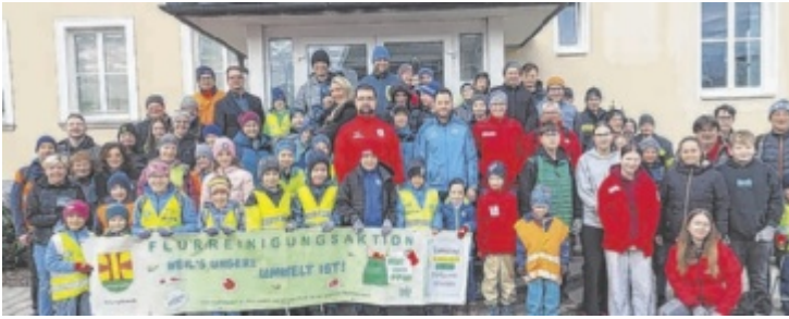
Hoch motiviert war die Truppe unterwegs.