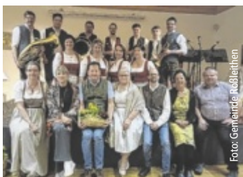
Musiker und Kulturausschuss-Mitglieder.

Gleichzeitig konnte eine offene Stelle in der Küche neu besetzt werden, was ebenfalls zur Stabilisierung beiträgt. „Ich freue mich, dass mein Vorschlag so schnell aufgegriffen wurde und wir nun in die konkrete Umsetzung kommen. Entscheidend ist, dass wir aus der Situation lernen und künftig besser vorbereitet sind“, betont Strasser. ■