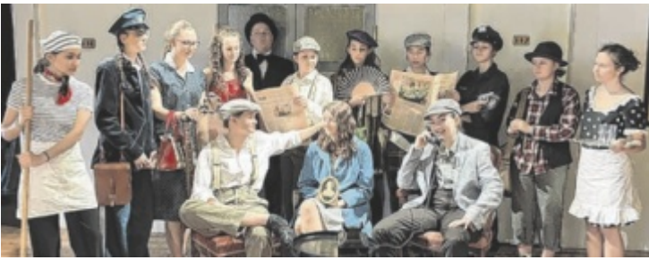
Schülerinnen präsentieren rasantes Stück im Theatersaal.