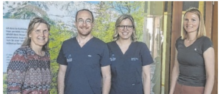
Experten aus dem Bereich Gesundheit geben Tipps.