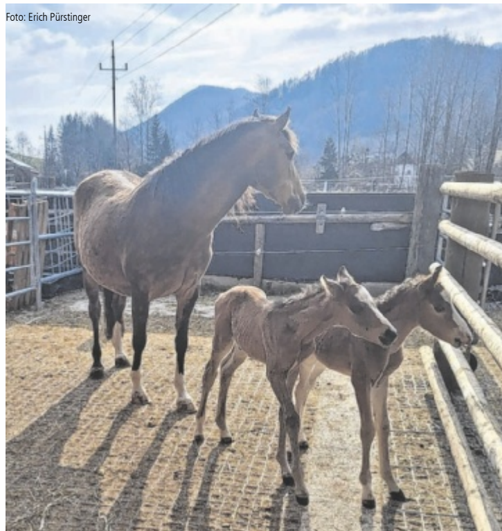
Die zwei Fohlen sind nun gut vier Wochen alt und wohlauf, so wie ihre Mama.