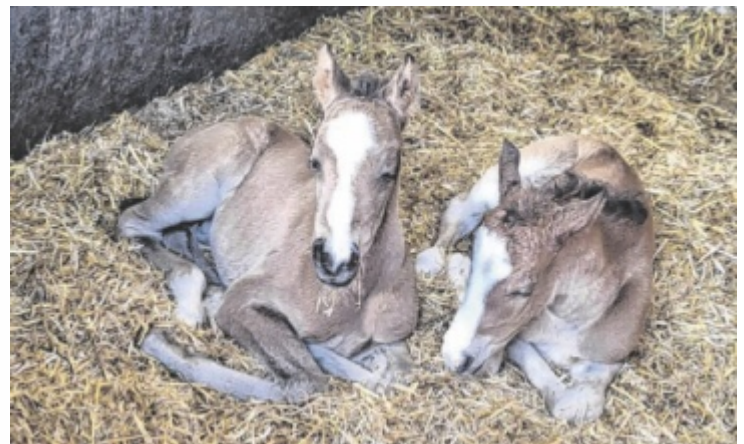
Mittlerweile sind Collvero und Dorina gut vier Wochen alt.

Die beiden kleinen Fohlen – der Hengst bekam den Namen Collvero PP und die Stute heißt Dorina PP – sind nun ein ganz besonderer Teil dieser Geschichte und ein seltener Glücksfall, der selbst erfahrene Pferdeleute staunen lässt. ■