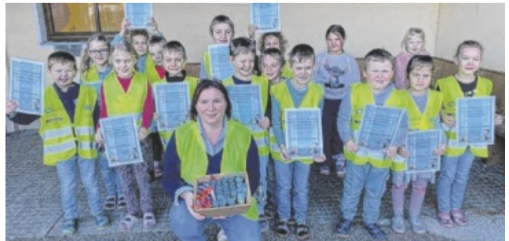
Bei der Warnwesten-„Überprüfung“ in der Volksschule RoBleithen Foto: Zivilschutz 00

Bitte um Zusendung an: tips-kirchdorf@tips.at