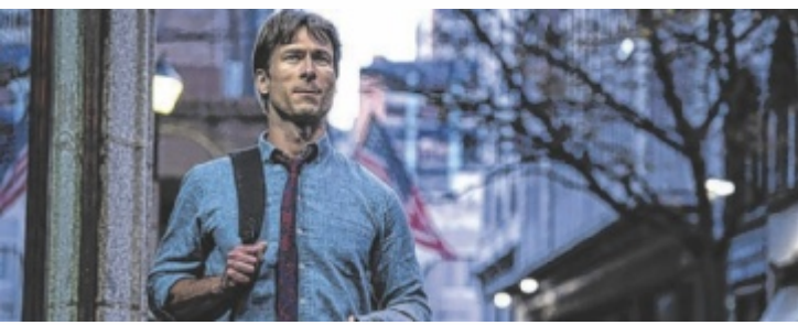
Glen Powell will sich das Erbe holen, das ihm zusteht.