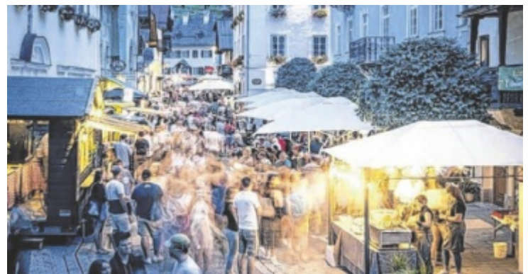
Sommernächte in St. Wolfgang laden ins Innere Salzkammergut ein