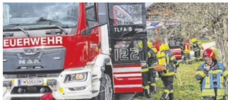
Feuerwehreinsetzkkräfte bei einer groß angelegten Übung in Bad Goisern, bei der die herausfordernde Löschwasserversorgung im Fokus stand.

Das Übungsszenario sah einen Brand in der Ortschaft Herndl vor. Atemschutztrupps suchten mehrere Vermisste und brachten diese ins Freie. Gleichzeitig wurde mit dem begrenzten Wasservorrat der Tanklöschfahrzeuge eine erste Brandbekämpfung durchgeführt, während weitere Einsatzkräfte eine Versorgungs-