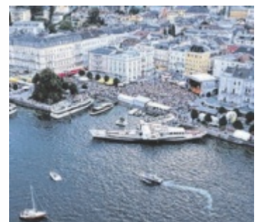
Großevents locken heuer wieder zum Rathausplatz Gmunden