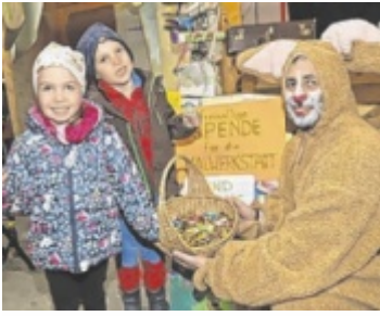
Kinder-Nachmittag zur Unterstützung der Malwerkstatt.