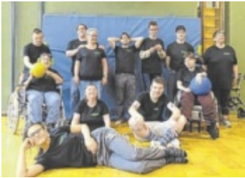
Die Sportler der Lebenshilfe-Werkstätte Bad Ischl