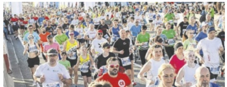
Tausende Profiatleten und Hobbyläufer werden auch heuer wieder am Marathonsonntag in der Landeshauptstadt erwartet.

Die Ausgabe der Startnummern sowie Ummeldungen und Nachnennungen für noch verfügbare Bewerbe erfolgen im Rahmen der Sportmesse in der TipsArena (Freitag, 10. April, 12 bis 19 Uhr; Samstag, 11. April, 10 bis 18 Uhr). Am Marathonsonntag selbst sind weder Startnummernausgabe noch Ummeldungen möglich. Für eine möglichst unkomplizierte Anreise sorgen kostenlose Shuttlebusse zum Startbereich.