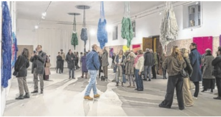
Ausstellungseröffnung in den Stallungen der Kaiservilla.