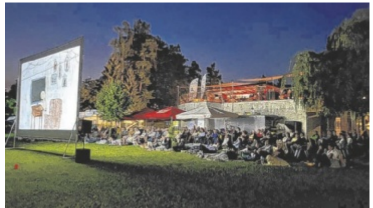
Sommerkino-Vorstellungen in der Region Attersee-Attergau

„Der Sommer im Salzkammergut ist einzigartig – mit einer Mi-