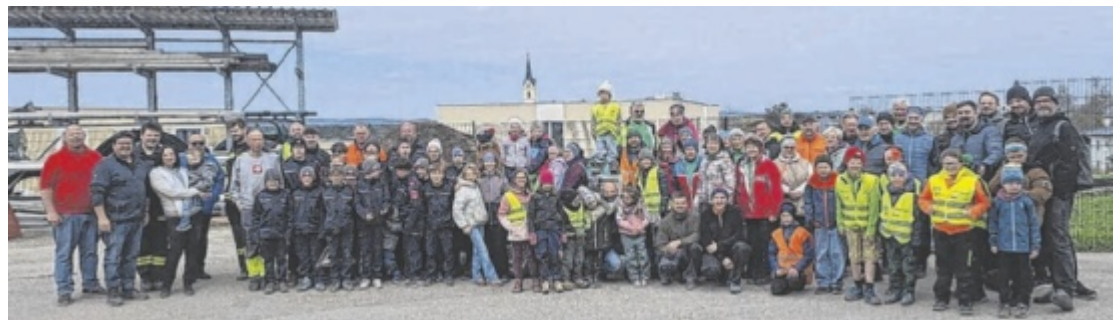
Freiwillige Helfer bei der Flurreinigungs-Aktion in Roitham

ten. Auch im Straßen- und Bauausschuss setzte er zentrale Impulse. Ortner bleibt weiterhin Mitglied des Gemeinderats. Seine Erfahrung steht der Gemeinde somit auch künftig zur Verfügung. ■