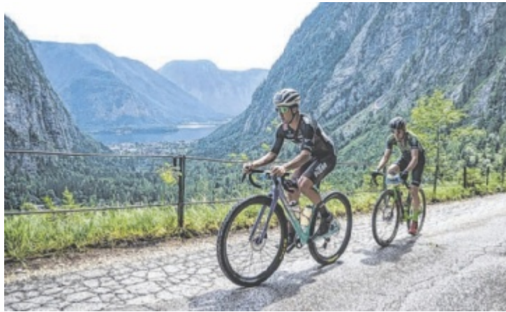
Hoch über dem Hallstätter Echerntal.

Seit 2017 wird im Rahmen der Veranstaltung ein Gravel-Marathon angeboten. Was als neues Format begann, hat sich inzwischen etabliert. Mittlerweile stehen drei Gravel-Strecken zur Auswahl, die über Schotterwege, Forststraßen und verkehrsarme Nebenstraßen durch die Berg- und Seenlandschaft der Region führen. Die längste Strecke, die Gravel.one, wird zum Jubiläum verlängert. Der Start wird von Obertraun nach Bad Ischl ver-