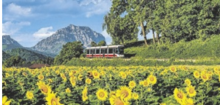
Unbegrenzte Fahrten mit den OÖ Freizeitticket mit Regionalzügen, Bussen, Stadtverkehren sowie Lokalbahnen von Stern & Hafferl.

Der Mobilitätsbonus lässt sich bequem über die Wegfinder App ein-