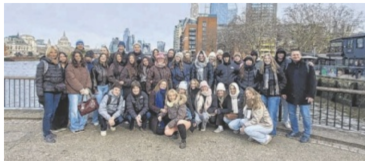
Die Schüler der HLW Wolfgangsee in London