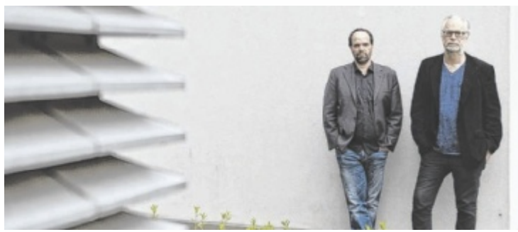
Maschek präsentieren in Bad Schallerbach ein Best of.