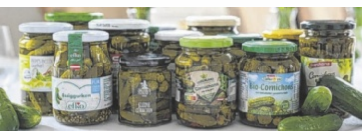
Die Essiggurkerl aus den heimischen Supermärkten im Test

HINZENBACH. Gault&Millau hat Essiggurkerl aus heimischen Supermärkten verkostet. 13 verschiedene Essiggurkerl wurden beurteilt, nach Geruch, Mundgefühl beziehungsweise Knackigkeit und Geschmack. Auch die Farbe floss in die Bewertung mit ein. Auf Platz eins schafften es die efko Delikatess Gurken süßsauer. Die efko Essiggurken landeten gemeinsam mit den Hengstenberg Cornichons klassischfein auf dem fünften Platz. ■