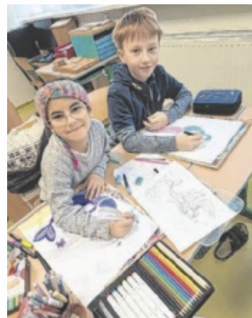
Volkschüler malten Plakat-Entwürfe für das Konzert.

Diese regionale Geschichte wurde von Florian Möseneder vertont. Das Konzept stammt von Katharina Eckerstorfer. Die Stadtkapelle Grieskirchen wird