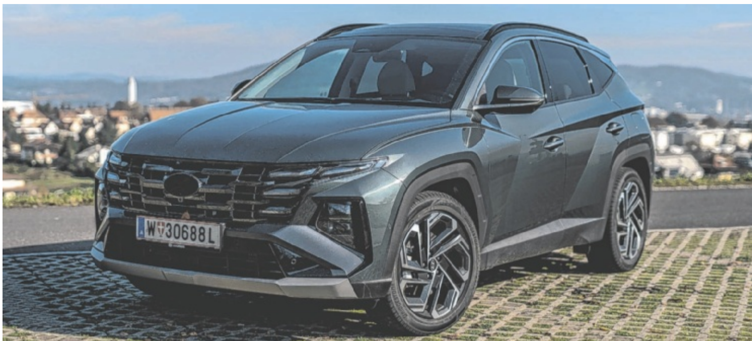
Der Hyundai Tucson 1.6 CRDi 4WD ACT Prestige Line ist ab 54.990 Euro zu haben.