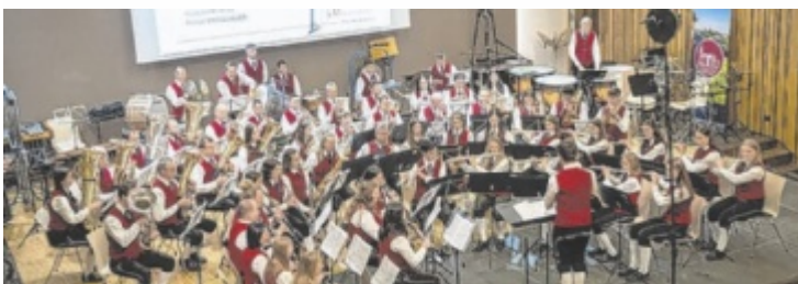
Der Musikverein Hofkirchen beim Wertungsspiel im letzten Jahr.