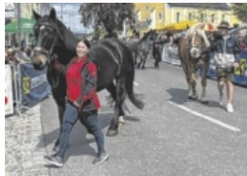
Waizenkirchen lädt zum 31. Pferdemarkt.

Gestartet wird um 9 Uhr mit dem Auftrieb der Pferde am Marktplatz. Die Anmeldung der Pferde ist am Veranstaltungstag von 8 bis 11 Uhr am Marktplatz möglich. Die Bewertung der Tiere durch die Jury wird bis 11 Uhr durchgeführt. Ab 13.30 Uhr gibt der Musikverein Waizenkirchen ein Platzkonzert und um 14 Uhr folgen der Festzug sowie die Prämierung. Dabei ziehen nicht nur die prämierten Pferde, sondern auch festlich ge-