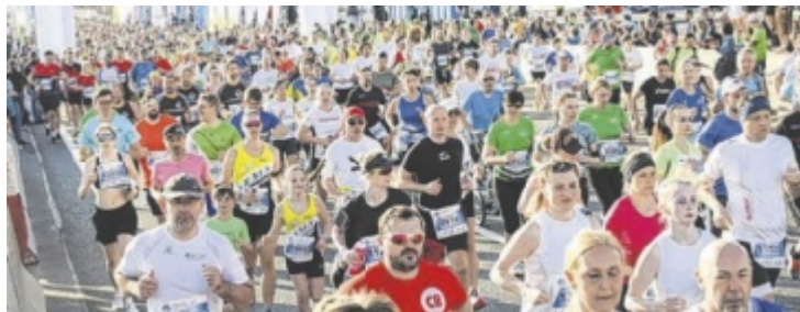
Tausende Profiatleten und Hobbyläufer werden auch heuer wieder am Marathonsonntag in der Landeshauptstadt erwartet.

Die Ausgabe der Startnummern sowie Ummeldungen und Nachnennungen für noch verfügbare Bewerbe erfolgen im Rahmen der Sportmesse in der TipsArena (Freitag, 10. April, 12 bis 19 Uhr; Samstag, 11. April, 10 bis 18 Uhr). Am Marathonsonntag selbst sind weder Startnummernausgabe noch Ummeldungen möglich. Für eine möglichst unkomplizierte Anreise sorgen kostenlose Shuttlebusse zum Startbereich.