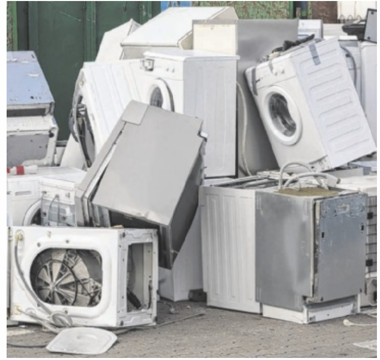
Reparieren statt Wegwerfen entlastet nicht nur die Umwelt, sondern schont angesichts steigender Energiepreise auch die Budgetpläne der Gemeinden für die Entsorgung.

Hier setzt ein wichtiger Hebel an: Wer bewusst reparierfähige Geräte kauft und diese instand halten lässt, handelt mehrfach nach-