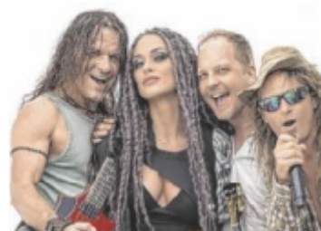
Flash 90s Disco mit Rednex

PASCHING. Flash90s, Österreichs erstes 90s Radio, holt in Kooperation mit Tips die 90er zurück – mit den legendärsten Cowboys des Jahrzehnts: Rednex! Die Buffalos dürfen aus dem Keller geholt werden, die Hüftjeans sind wieder angesagt, und das Tanzbein wartet darauf, geschwungen zu werden.