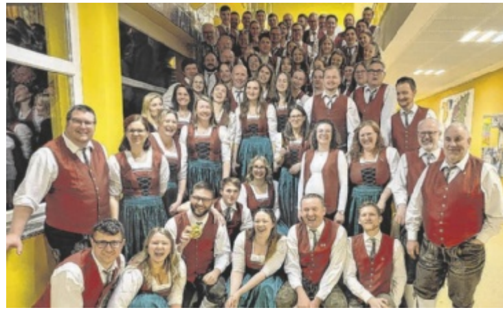
Der erfolgreiche Musikverein Gaspolthofen