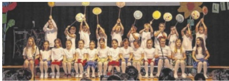
Schulfest im Melodium

Ende des Mietvertrags begann die Suche nach einer neuen Location. Im Zentrum wurde das Duo fündig: Ein ehemaliger Friseursalon wurde zur Basis für den Neustart. Drei Monate lang wurde umgebaut und modernisiert. Nun präsentiert sich das Lokal als stilvolles Bar-Restaurant. Die Zutaten kommen direkt aus Italien, der Teig reift drei Tage. Dafür gab es bereits eine Falstaff-Gabel. ■