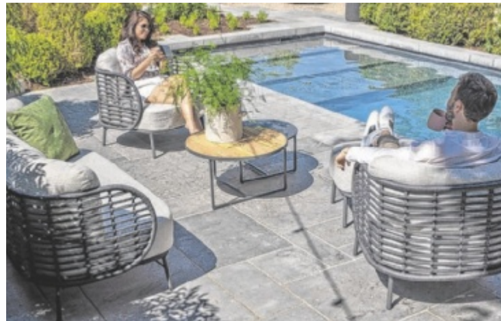
Die neuen Kollektionen der hochwertigen Gartenmöbel gibt's in der über 1.200 Quadratmeter großen X-Markt Ausstellung zu erstaunlich niedrigen Preisen. Daher heißt es schnell sein, denn einige Modelle werden bald vergriffen sein.

Der Trend geht eindeutig zu Gartenmöbeln, die dank hochwertiger Materialien den Indoor-Möbeln in Sachen Komfort um nichts nachstehen. Bänke, Eckbänke, Lounge-Garnituren und Keramiktische mit hochwertigen Oberflächen sind jetzt bei X-Markt auch zentimetergenau planbar. Durch Bestellung in großen Mengen direkt beim Hersteller, Eigenproduktion und Fertigung vor Ort gibt es bei X-Markt auch hochwertige Gar-