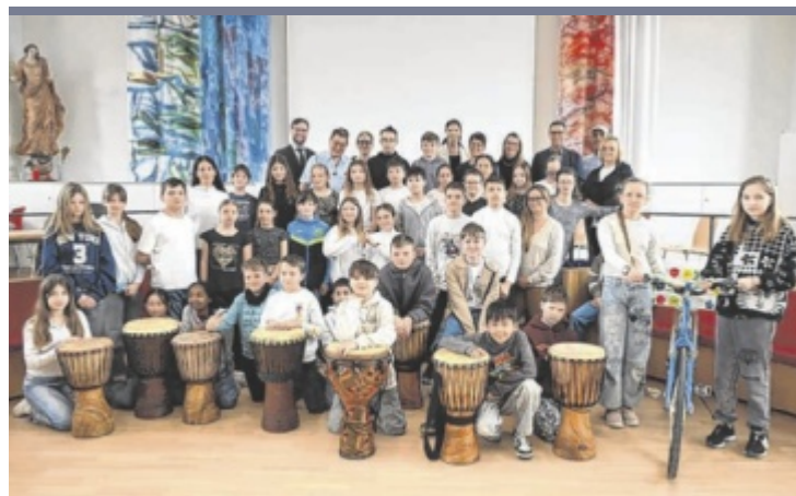
Kooperationsprojekt Die Mittelschule Alkoven hat im Zuge des neuen Schwerpunkts „Gesundheit, Pflege und Soziales“ ein Kooperationsprojekt mit dem Institut Hartheim gestartet. Durch die Partnerschaft erhalten die Schüler praxisnahe Einblicke für ihre neuen Unterrichtsfächer. Begonnen hat das Projekt mit einer offiziellen Feier.

4615 HOLZHAUSEN BEI MARCHTRENK | creativ-zaun-design.at