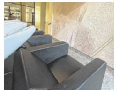
Friseurtradition neu erleben

Schnittgefühl – Verändert mehr als die Frisur. ■