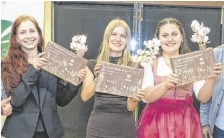
Die drei besten Nachwuchsflooristinnen Oberösterreichs