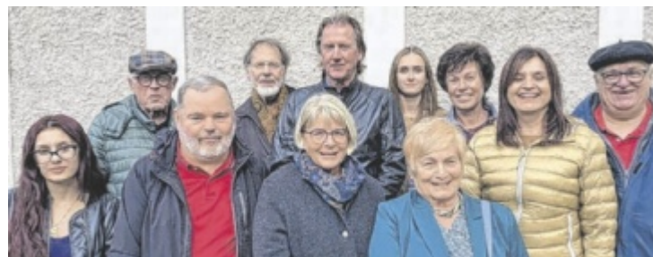
Die Kunstgruppe 2000 präsentiert Werke zum Thema Wasser.

In der aktuellen Ausstellung dreht sich alles um das Thema Wasser – Tiere, Pflanzen und Landschaften. Eröffnet wird sie am Donnerstag, 23. April, um 19 Uhr am Gemeindegarten St. Marienkirchen von Landeshauptmann außer Dienst Josef Pühringer. ■