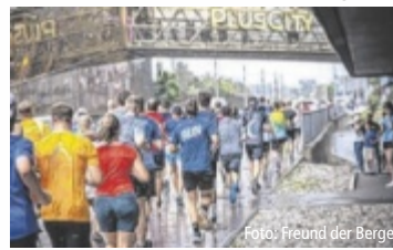
Der Lauf erfreut sich großer Beliebtheit.

PASCHING. Am Donnerstag, 2. Juli im Team Gas geben und beim business2run PlusCity mitlaufen – denn auch dieses Jahr macht das Firmenlaufevent im größten Einkaufszentrum Oberösterreichs Halt.