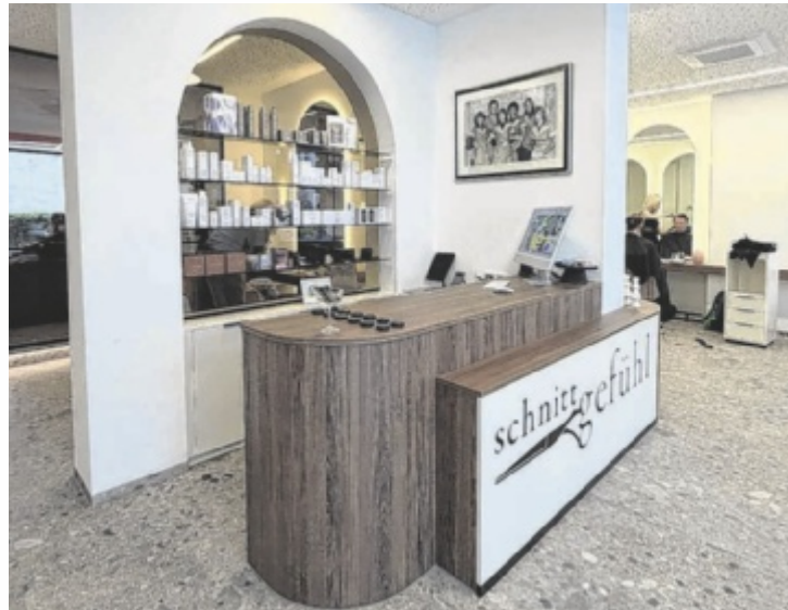
Schnittgefühl erstrahlt nach dem Umbau: Hier trifft modernes Ambiente auf Friseurtradition.

Mit dem Umbau verbindet Schnittgefühl Tradition und Zukunft neu. Helle Räume, klare Linien und warme Materialien schaffen eine ruhige Atmosphäre. Man spürt, dass sich hier Menschen Zeit nehmen für Qualität und das Wohlbefinden der Kunden. Gemeinsam mit der Planbar und Ratzenberger wurde ein Ort geschaffen, der moderne Ästhetik und persönliches Kundenerlebnis vereint. Statt schneller Termine setzt Schnittge-