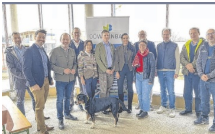
Gleichenfeier Im Alkoven Ortsteil Straßham sollen in zwei Bauabschnitten insgesamt 106 Wohnungen sowie ergänzende Geschäfts- und Büroflächen entstehen. Umgesetzt wird das Wohnbauprojekt „Alkoven am Dorfplatz“ von ÖÖ Wohnbau. Die ersten Wohnungen werden voraussichtlich im November bezugsfertig sein. Am Bild: Gleichenfeier des ersten Bauabschnitts