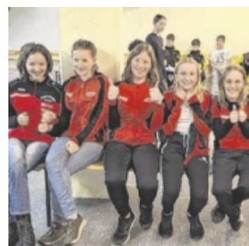
Auch der Nachwuchs zeigte starke Leistungen

AISTERSHEIM. Einen bislang einzigartigen Erfolg feierten die Schützen des SV Aistersheim bei der Luftgewehr-Bezirksmeisterschaft. Mit insgesamt 16 Medaillen – darunter sieben Gold-, fünf Silber- und drei Bronzemedailles – kehrte die Mannschaft so erfolgreich wie noch nie von einem Bezirksbewerb nach Hause zurück.