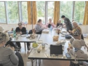
Einmal pro Monat wird gemeinsam gestrickt und gehäkelt.

Die nächsten Termine sind jeweils Samstag, 11. April, 16. Mai, 27. Juni, 18. Juli, 22. August, 19. September, 24. Oktober, 14. November und 19. Dezember, von 10 bis 18 Uhr im Pfarrheim St Thomas. ■