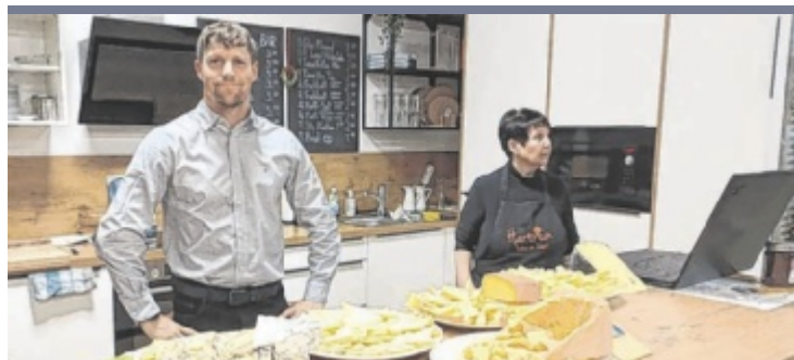
Käseverkostung Der Verein Hartkirchner Landleben lud zur Käseverkostung ein: Im Hartrium probierten sich die Besucher durch das Käsesortiment von Schärldinger und erhielten Einblicke in die Kunst der Käseherstellung.