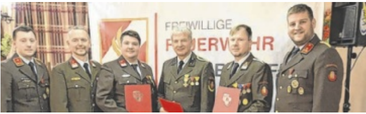
150. Vollversammlung der FF Meggenhofen