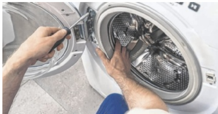
Die Geräte-Retter-Prämie konzentriert sich auf Haushaltsgeräte wie zum Beispiel Waschmaschinen.

Konsumenten können ihren Geräte-Retter-Bon online über die Webseite beantragen. Dieser ist drei Wochen lang gültig und kann – entweder digital oder ausgedruckt – bei einem der Partnerbetriebe eingelöst werden. Diese sind ebenfalls auf der offiziellen Webseite zu finden. Ein Bon kann für die Reparatur, Service oder Wartung und/oder den Kostenvorschlag eines E-Gerätes verwendet werden. Die Anzahl der Bons je Person ist grundsätz-