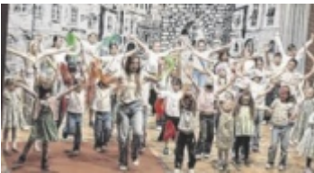
„Tanz der Farben“

Es gab zudem eine Neuaufnahme, vier Angelobungen, mehrere Beförderungen, Ehrungen und Übergeben von Leistungsabzeichen. ■