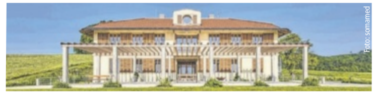
Infos und Anmeldung zum Mittagessen unter www.ayurvedashop.at/tag-der-offenen-tuer

Kuren in Österreich an. Mit seiner Erfahrung verbindet er moderne Medizin mit der jahrtausendealten Wissenschaft des Ayurveda. somamed am Tag der offenen Tür hautnah erleben: spannende Vorträge und Impulse für bessere Gesundheit, ayurvedische Schnupperanwendungen, kostenlose Pulsdiagnose, Führungen durch das Haus, Gewinnspiel mit attraktiven Preisen, exklusive Vorteile, kulinarische Leckerbissen aus der somamed Küche, Kinderecke und Hüpfburg (bei Schönwetter). Ein besonderes Highlight ist das ayurvedische Mittagessen um 18 Euro (Anmeldung erforderlich). ■ Anzeige