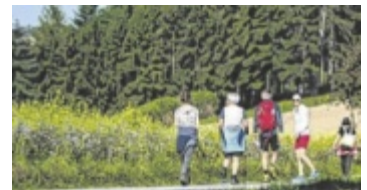
Tag der Bewegung

MOUNTAINBIKE TROPHY BAD GOISERN. Die 29. Salzkammergut Trophy findet von Freitag, 17. Juli, bis Sonntag, 19. Juli, statt. Zum zehnjährigen Bestehen des Gravel-Marathons wird die längste Gravel-Strecke deutlich verlängert. Anmeldungen unter https://www.salzkammergut-trophy.at/anmeldung-pid359