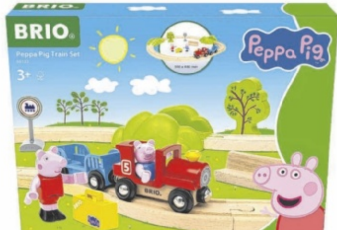
Das BRIO Peppa Wutz Eisenbahn-Set für Kinder ab drei Jahren

Spielfiguren Peppa und George auch eine passende Lokomotive, einen Wagen, Holzschienen und weiteres Zubehör wie Bäume, Schilder, eine Bank und einen Koffer. Für Kinder ab drei Jahren für 49,99 Euro (UVP) im Handel erhältlich. ■ Anzeige