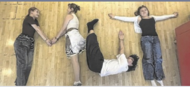
Wettbewerb Das Steyrer Jugendzentrum Gewölbe ruft Jugendliche zwischen 13 und 19 Jahren dazu auf, ihre Sichtweise zum Thema „Mut“ zu zeigen. Einreichungen bis 12. April, weitere Infos auf Insta: @gewolbe