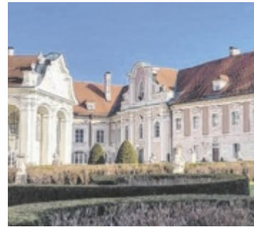
Das Steyrer Standesamt befindet sich im Schloss Lamberg.

Weiters vorne mit dabei in der Hitliste sind, Katharina, Hannah, Mia und Emilia (je 9 Mal), Mila und Klara (je 8 Mal) sowie Lukas (16 Mal), Elias (15 Mal), Jonas (11 Mal), Paul und David (je 10 Mal), Jakob, Leon, Leo und Theo (je 9 Mal). Im Jahr 2025 beurkundete das Steyrer Standesamt im Zentralen Personenstandsregister die Geburten von 1.067 Kindern (2024: 1012) – 536 Buben und 531 Mädchen. Davon wurden 293 Babys von Steyrer Müttern zur Welt gebracht (2024: 277). 899 der insgesamt 1.067 Neugeborenen des Vorjahres sind österreichische Staatsbürger.