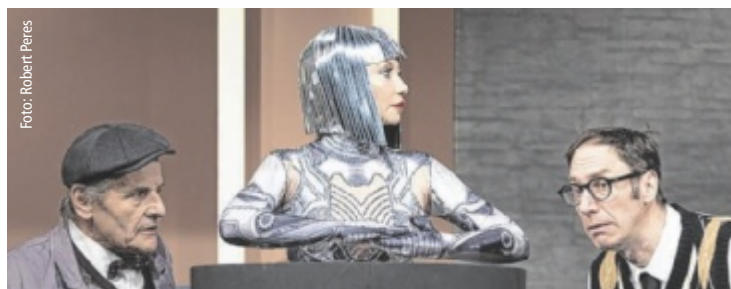
Die humanoide Super-KI „Roberta“ ist nicht nur smart, sondern auch sexy.