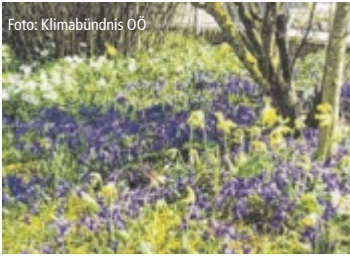
Bienenfreundliche Wiesen sind auch Augenweiden für Naturliebhaber.