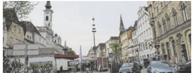
Viele Steyrer wünschen sich weniger Verkehr am Stadtplatz.

völkerung im Jahr 2024 haben sich 62 Prozent der Steyrer für einen verkehrsberuhigten Stadtplatz ausgesprochen. Auch bei den Runden Tischen mit Bürgern zum Thema Innenstadt war eine verbesserte Aufenthaltsqualität auf dem Stadtplatz eines der Top-3-Themen. Letzte Woche beschloss der Gemeinderat in seiner Sitzung mehrheitlich eine Resolution, die den Bürgermeister beauftragt, an Wochenenden eine Verkehrsberuhigung umzusetzen und die Auswirkungen