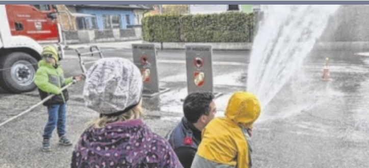
„Gemeinsam. Sicher. Feuerwehr“ 90 Kinder der VS Sierninghofen-Neuzeug waren bei der örtlichen Feuerwehr zu Gast und erlebten einen lehrreichen Vormittag. Bildgalerie online auf: www.tips.at/n/717308