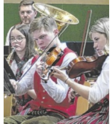
Jugendkapelle Hilbern

Besonders erfreulich war die große Zahl an mitgereisten Fans, die „ihre“ Musiker lautstark