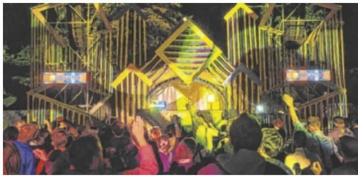
Schlosspark und Schlossgraben werden zum Festivalgelände.