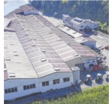
Das Firmenareal von Hydrac liegt an am Steyr-Fluss im Sierninger Ortsteil Neuzug.

Bei Hydrac blickt man positiv in die Zukunft, der Produktionsstandort im Sierninger Ortsteil Neuzug bleibt erhalten. Heuer feiert das Unternehmen sein 60-jähriges Bestehen. ■