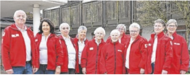
Team der Tagesbetreuung in Bad Hall