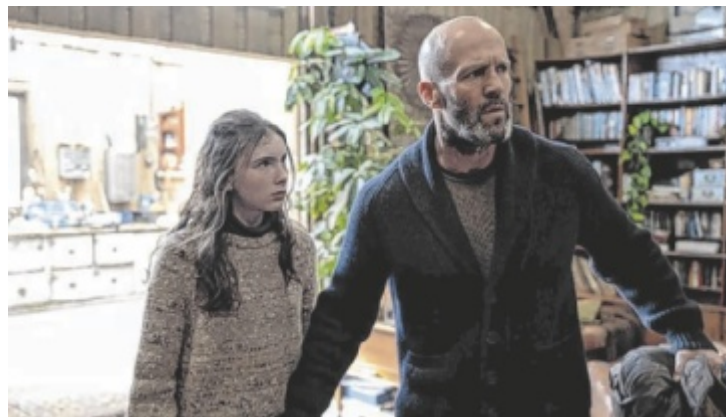
Jason Statham muss sich den Dämonen seiner Vergangenheit stellen.

tionen, darunter die Ouvertüre von „Carmen“, „Tirol 1809“ von Sepp Tanzer sowie „Bugler's Holiday“ mit gleich drei Trompetern. Mit Musik aus „Findet Nemo“ und „Mr. Bean macht Ferien“ sind auch filmische Melodien dabei. Die Michlbauern Rud bringt harmonischen Gesang ein. Eintritt: 12 Euro (Ö-Ticket) ■