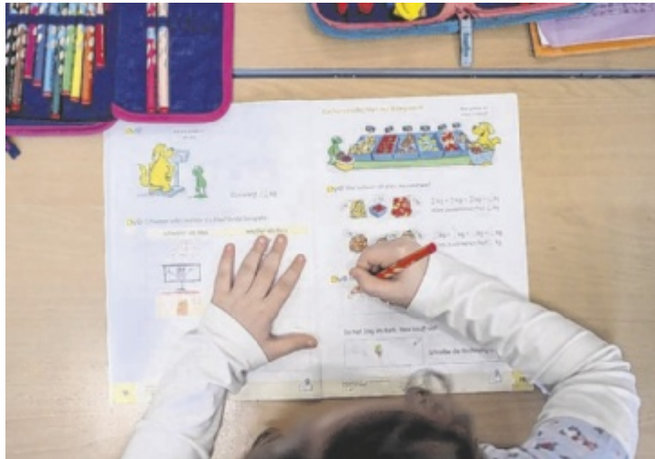
59 Schulen in Oberösterreich erhalten den Chancenbonus.

In Steyr dürfen sich die Volksschulen Tabor, Ennsleite und Resthof sowie die Mittelschule Tabor über zusätzliche Mittel freuen. Bei allen ist der Anteil von Kindern mit Migrationshintergrund hoch. Viele Schüler brau-