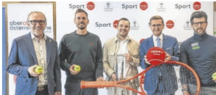
Jubiläums-Edition des Tennis-Highlight an der Donau