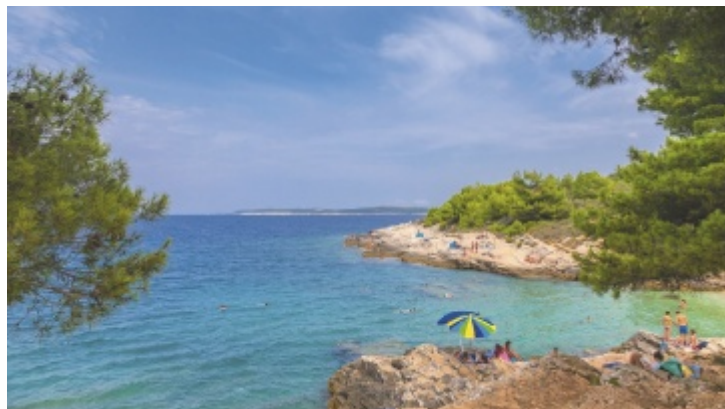
Die Halbinsel Istrien: traumhaftes Reiseziel im Süden

Besonders beliebt bleiben jedoch die nahegelegenen Küsten Italiens und Kroatiens. Die Anreise mit dem eigenen Auto bietet dabei maximale Flexibilität – ideal für Familien