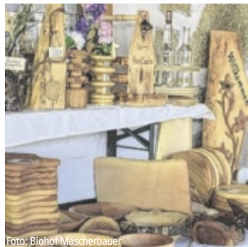
Kunst, Kulinarik und Osterstimmung.

SCHWERTBERG. Der Biohof Mascherbauer in Winden 1 in Schwertberg lädt heuer am Samstag, 28. März, 8 bis 14 Uhr, wieder zu seinem kleinen beliebten Ostermarkt mit regionalen Künstlern ein.