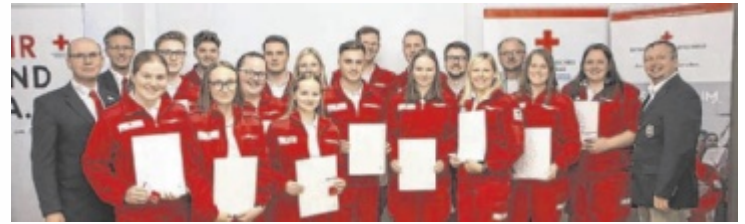
Verdiente Mitarbeitende wurden bei der Versammlung ausgezeichnet.

In den Endspurt gehen die Vorarbeiten für die neue Rotkreuz-Dienststelle in der Linzer Straße, die seit 2019 intensiv betrieben