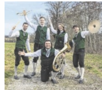
Frühjahrskonzert unter dem Motto „Lebensglück“.

RIED IN DER RIEDMARK/MAUTHAUSEN. Nach einem Jahr Pause lädt die Markt-Musikkapelle Ried in der Riedmark heuer am Samstag, 28. März, 20 Uhr, wieder zu ihrem traditionellen Frühjahrskonzert im Donausaal Mauthausen ein und nimmt das Publikum mit auf eine musikalische Reise durch die vielen Seiten des Lebensglücks.