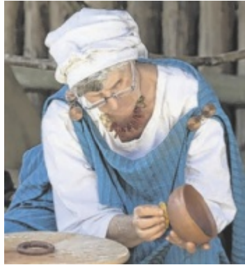
Altes Handwerk erleben