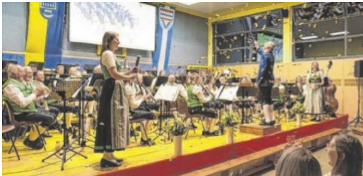
Der Trachtenmusikverein bringt Frühlingsgefühle nach Mitterkirchen.