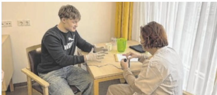
Voller Begeisterung beim Health and Care Day im Seniorium Perg dabei.