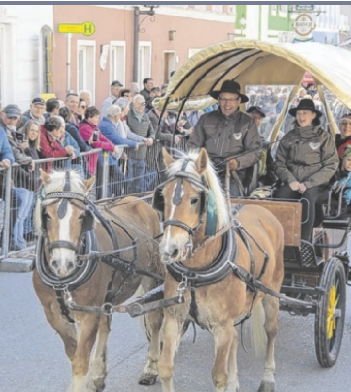
Josefmarkt Pferde, Wirtschaft, Kirtag und Gastronomie – auf diesen bewährten Säulen beruht der traditionelle Josefmarkt in Königswiesen. Heute feierten wieder tausende Besucher den „Nationalfeiertag“ der Königswiesener. Eine der Höhepunkte (Bild): der Einzug der Reiter und Gespanne