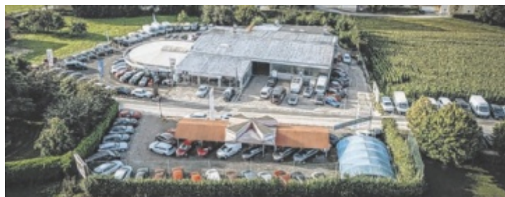
Ambros Automobile in Bad Zell

Unter dem Dach von Stellantis sind bekannte Marken wie Alfa Romeo, Citroën, DS, Fiat, Jeep, Opel und Peugeot vereint. Käufer profitieren dadurch von einer großen Auswahl an nahezu neuwertigen Fahrzeugen, die strenge Qualitätsprüfungen durchlaufen haben. Bei Ambros Automobile stehen aktuell über 150 dieser Jungwagen zu vergünstigten Preisen bereit. Sollte das passende Modell nicht lagernd sein, kann es auf Wunsch jederzeit bestellt wer-