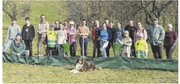
Zahlreiche Freiwillige waren gemeinsam auf Rettungsmission.

Jedes Jahr um diese Zeit wandern in Knierübl hunderte Amphibien, vor allem Erdkröten, Gras- und Springfrösche sowie Teichmolche aus dem Wald zum nahe liegenden Teich über eine stark befahrene Straße. Damit die Tiere sicher das Gewässer zum Ablachen erreichen, wandern sie entlang des Zaunes und fallen in eingegrabene Kübel. Ein- bis zweimal täglich werden die Amphi-