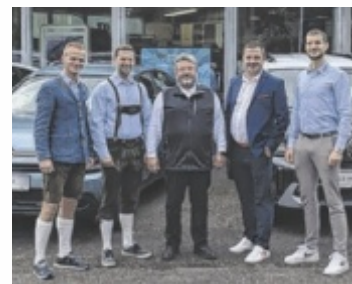
Das Ambros Verkaufs-Team

So wird der Einstieg in ein hochwertiges Fahrzeug deutlich erleichtert. Ambros Automobile setzt bewusst auf Qualität aus Europa und verzich-