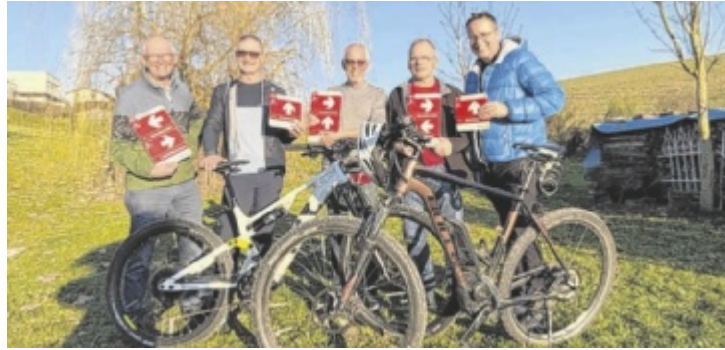
Der Mountainbike-Verein mit Bürgermeister Max Oberleitner (r.).

SCHWERTBERG. In Schwertberg entsteht eine neue Mountainbike-Strecke für Genussradler. Die Bauhofmitarbeiter der Gemeinde haben gemeinsam mit dem neu gegründeten Mountainbike-Verein bereits mit der Beschilderung der Route begonnen. Die Eröffnung ist am Samstag, 28. März.