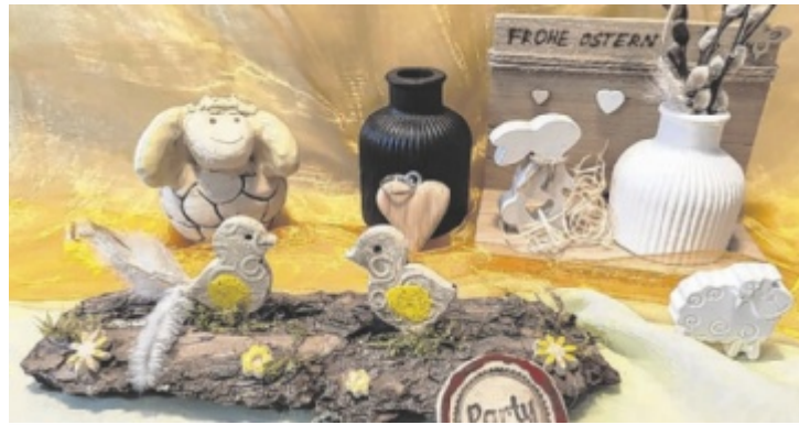
Beim Ostermarkt erwartet die Besucher ein buntes Sortiment.