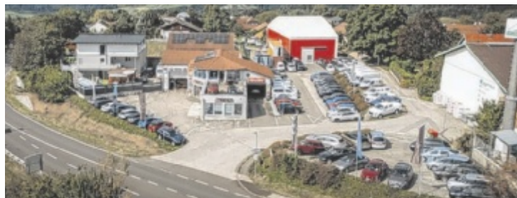
Ambros Automobile in Tragwein