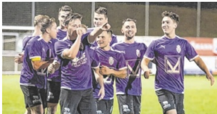
Einen perfekten Einstand zur Rückrunde feierten die Violetten aus dem Machland gegen die ASKÖ Leonding.

MITTERKIRCHEN/SA-XEN/NAARN/KATSDORF. Die Bezirksliga-Teams aus dem Machland setzten sich zum Rückrundenstart perfekt in Szene: In der Bezirksliga Ost feierte die Union Mitterkirchen mit einem 1:0 gegen die ASKÖ Leonding bereits den zehnten Saisonsieg. Sachsen punktete beim 0:0 in Neuzeug. In der Gruppe Nord gaben Tabellenführer Naarn und die SPG Katsdorf mit Siegen den Ton an.