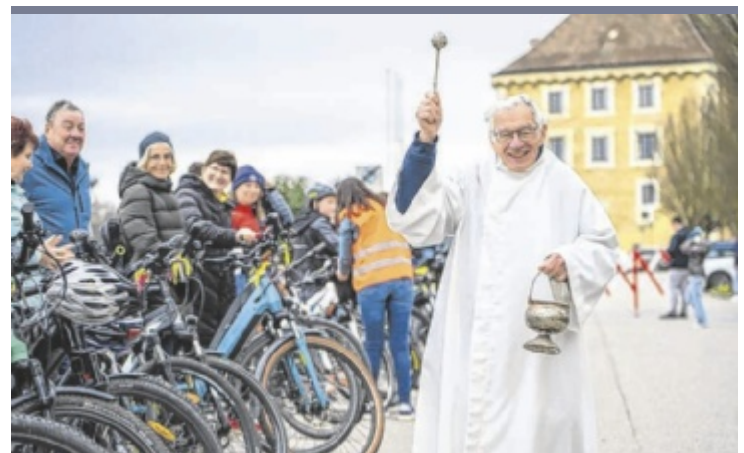
Fahrradsegnung Insgesamt 75 Radfahrer sowie ein Teilnehmer mit Dreirad ließen sich die traditionelle Fahrradsegnung am Heindlkai in Mauthausen nicht entgehen. Die Veranstaltung markiert jedes Jahr den symbolischen Start in die neue Radsaison und hat sich längst zu einem beliebten Treffpunkt für Radbegeisterte aus der Region entwickelt.