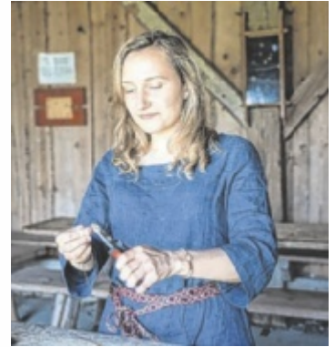
Schmuck wie früher

Den Auftakt der neuen Saison bilden die Osterferien, die ganz im Zeichen gemeinsamer Familienerlebnisse stehen. An beiden Osterferien-Wochenenden finden immer um 11 und um 14 Uhr kostenlose Führungen durch die rekonstruierte eisenzeitliche Siedlung statt. Darüber hinaus laden mehrere Mitmachtermine zum aktiven Ausprobieren ein: Am Dienstag, 31. März, 11 bis 15 Uhr, steht das traditionelle Fladenbrotbacken im Lehmofen auf dem Programm. Besucher können den gesamten Prozess – vom Vorbereiten des Teiges bis zum Backen im historischen Ofen – miterleben und erfahren, wie Brot in früheren Zeiten hergestellt wurde. Am Donnerstag, 2. April, 11 bis 15 Uhr, widmet man sich im Keltendorf Mitterkirchen alten Textil- und Schmucktechniken. Beim Spinnen und Herstellen von Metallschmuck erhalten Interessierte Einblicke in Materialien, Werkzeuge und Arbeitsweisen, die schon vor Jahrhunderten verwendet wurden. Am Samstag, 4. April, 13 bis 16 Uhr, findet der Workshop „Freundschaftsarmbänder weben“ statt. Dabei werden historische Techniken wie Brettchenweben und Kammweben vorgestellt und ausprobiert.