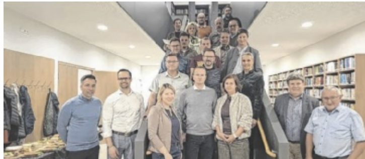
In Königswiesen fand ein Holzbau-Vernetzungstreffen mit Vertretern von Unternehmen, Bildungseinrichtungen, Gemeinden und Regionalentwicklung statt.

Bereits seit mehreren Jahren arbeitet die Mühlviertler Alm daran, Holz als regionalen Rohstoff bewusst einzusetzen – als verbindendes Element zwischen Landschaft, Handwerk, Baukultur und regionaler Identität. Ziel ist es, den Leitgedanken eines „Mühlviertler Holzhauses“ zu stärken und Gebäude aus regionalem Holz als Lebensräume für kommende Generationen zu schaffen. Die Vision dahinter ist klar: Holz aus der Region soll auch in der Region