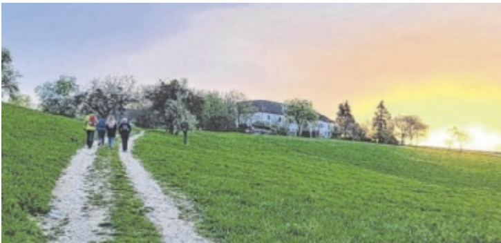
In Perg wird am Ostermontag gemeinsam gepilgert.