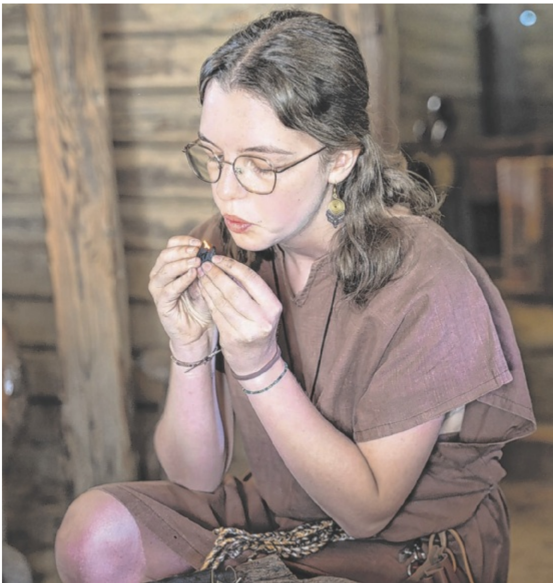
Die Welt der Kelten Brot backen und Schmuck herstellen wie früher, Wikinger-Erlebnis und mehr: Das Keltendorf Mitterkirchen startet mit einem vielversprechenden Programm in die neue Saison. Seite 4/ Foto: TV Donau OÖ/infinity