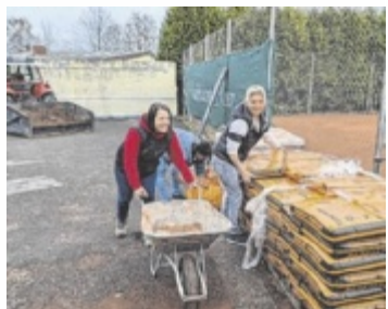
Die neue Saison startet.

MITTERKIRCHEN. Pünktlich zum Frühlingsbeginn konnte der UTC Mitterkirchen mit dem Auswintern der Tennisanlagen in Weising und Hütting beginnen.