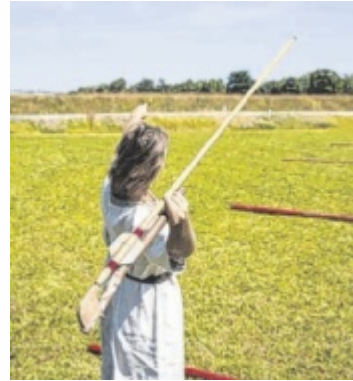
Abenteuer pur