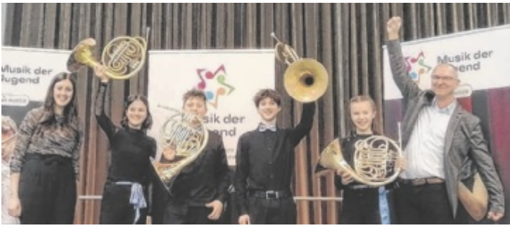
Für das Hornensemble „Cornu Varium“ geht es zum Bundeswettbewerb.