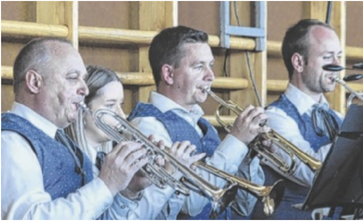
Buntes Programm beim Vereinskonzert in Allerheiligen.