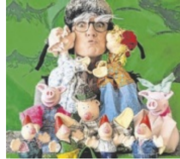
Theater für Kinder.

ST. GEORGEN/GUSEN. Das Theater mOMent aus Grieskirchen präsentiert am Samstag, 4. April, 15 Uhr, nach dem Bilderbuch von Mario Ramos das clowneske Figurentheaterstück „Ich bin der Stärkste im ganzen Land“ im Bäckerhaus.