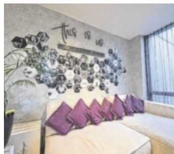
Im Ibis Styles gibts Frühstück und Mittagessen auch für „Externe“.

Diese Zertifizierungen bestätigen das umfassende Engagement des Hauses für umweltbewusstes Handeln und verantwortungsvolle Betriebsführung. Nachhaltigkeit wird im Hotel nicht nur als Konzept verstanden, sondern aktiv gelebt. Dabei spielt das gesamte Team eine zentrale Rolle: Jeder einzelne Mitarbeiter trägt dazu bei, die hohen Umweltstandards umzusetzen und kontinuierlich weiterzuentwickeln. Der gemeinschaftliche